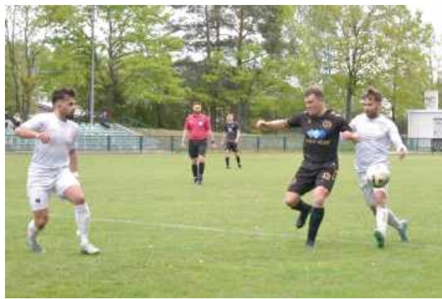
Ambitny beniaminek z Soli nie miał zbyt wiele do powiedzenia w starciu z liderem - Gromem Różaniec