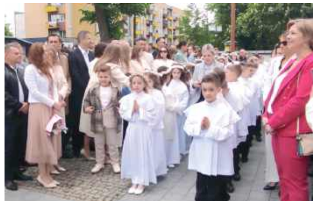
Pierwsza Komunia Święta w parafii św. Jerzego w Biłgoraju