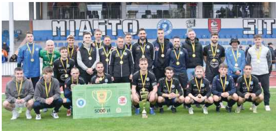
Łada 1945 Biłgoraj najlepszym klubem piłkarskim w okręgu zamojskim. W finale Pucharu Polski rozniosła Gryf Gmina Zamość aż 5:1

To wyjątkowo udane dni dla piłkarzy Łady 1945 BIŁGORAJ: Najpierw wygrany finał Pucharu Polski w okręgu zamojskim, za chwilę zwycięstwo ligowe w Lublinie. Świętować nie ma kiedy, bo już w środę i sobotę kolejne dwa mecze ligowe.