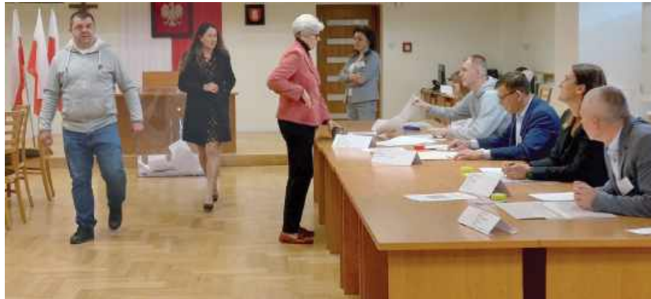
18 maja lokale wyborcze odwiedziło 48 480 mieszkańców powiatu biłgorajskiego

Wyniki wyborów prezydenckich na Ziemi Biłgorajskiej zdecydowanie różnią się od tych Ogólnopolskich. W powiecie biłgorajskim zwyciężył Karol Nawrocki, który zdobył 45,35 proc. poparcia. Drugi był Sławomir Mentzen z 17,83 proc. poparcia, a dopiero trzeci Rafał Trzaskowski z 14,82 proc. poparcia.