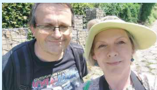
Autorzy podróżniczego bloga Slow Travel Polska tym razem odwiedzili Szczepieszyn

Szczepieszyn pod lupą blogerów, którzy zapuścili się na Roztocze. To Slow Travel Polska, który ma swój kanał na YouTube i odkrywa piękno i historię polskich miast i miasteczek. Blogerzy skrupulatnie podglądali Szczepieszyn, robili zdjęcia, filmowali, rozmawiali z ludźmi i wydali ocenę.