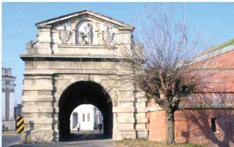
Brama Lwowska Stara w Zamościu wśród obiektów zgłoszonych do konkursu „Zabytek Zadbane”

76 zabytkowych obiektów z całej Polski zostało zgłoszonych do konkursu „Zabytek Zadbane”. To prestiżowa inicjatywa Ministra Kultury i Dziedzictwa Narodowego oraz Generalnego Konserwatora Zabytków, której celem jest wyróżnienie najlepszych przykładów troski o dziedzictwo. Wśród nich jest sześcioletnia Brama Lwowska Stara w Zamościu.