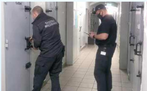
Do 26 maja Zakład Karny w Zamościu przyjmuje dokumenty od tych, którzy chcą tu pracować

- Wynagrodzenie na start w wysokości co najmniej 5 450 zł netto dla osób poniżej 26 roku życia i 5 060,00 zł netto dla osób powyżej 26 roku życia. Po zakończeniu szkolenia i uzyskaniu pozytywnego wyniku z egzaminu w zakresie szkoły podoficerskiej wynagrodzenie będzie wynosiło co najmniej 6 100 zł na rękę dla osób poniżej 26 roku życia i 5 600 zł netto dla osób powyżej 26 roku życia - informuje Zakład Karny