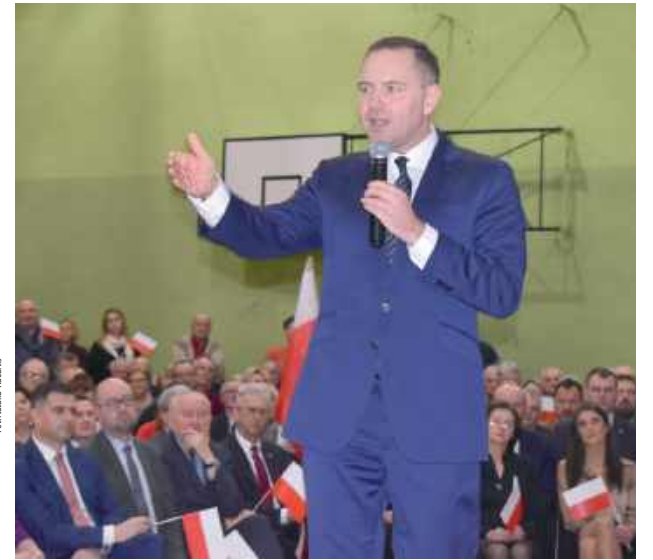
Karol Nawrocki odwiedził Biłgoraj 30 stycznia. Jego kandydaturę poparli wszyscy lokalni działacze PiS. W wyborach prezydenckich na Ziemi Biłgorajskiej zdobył 45,35 proc. poparcia