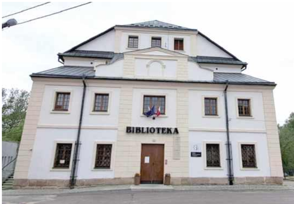
W Tarnogrodzie znajduje się okazała, barokowa synagoga. W środku znajduje się gminna biblioteka

Po spaleniu synagogi wybudowano w Tarnogrodzie prowizoryczną świątynię, zaś trzy lata później, tj. w 1686 r., na mocy przywileju ordynata