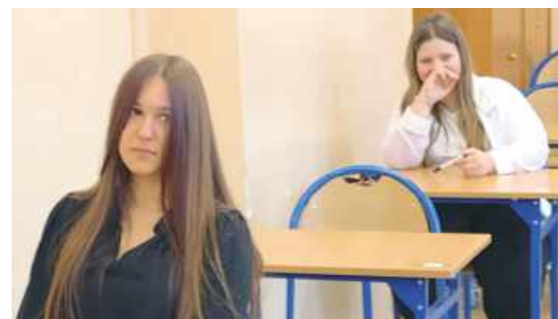
Pełne skupienie i można zaczynać egzamin