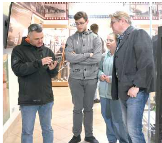
W Muzeum każdy znalazł coś dla siebie