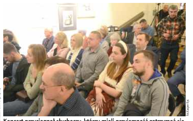
Koncert przyciągnął słuchaczy, którzy mieli przyjemność zatrzymać się chwilę tamtego wieczoru na poezję dla duszy i uszu