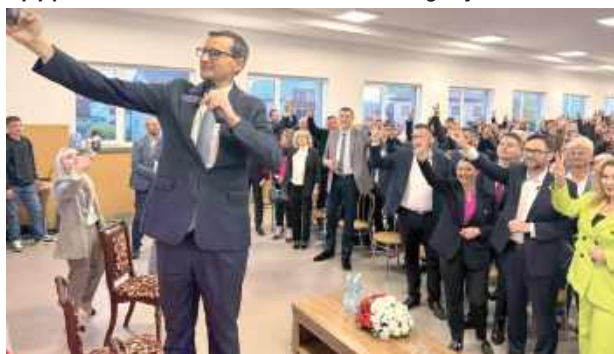
Wspólne selfie z Morawieckim to obowiązkowy punkt każdego ze spotkań