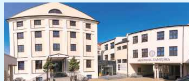
Kompleks przy ulicy Sienkiewicza w Zamościu przeszedł gruntowną modernizację

W Zamościu już oficjalnie jest nowy kompleks dydaktyczny. To kompleks budynków przy ul. Sienkiewicza 22A, w którym swoją siedzibę ma Wydział Nauk Społecznych i Humanistycznych Akademii Zamojskiej.