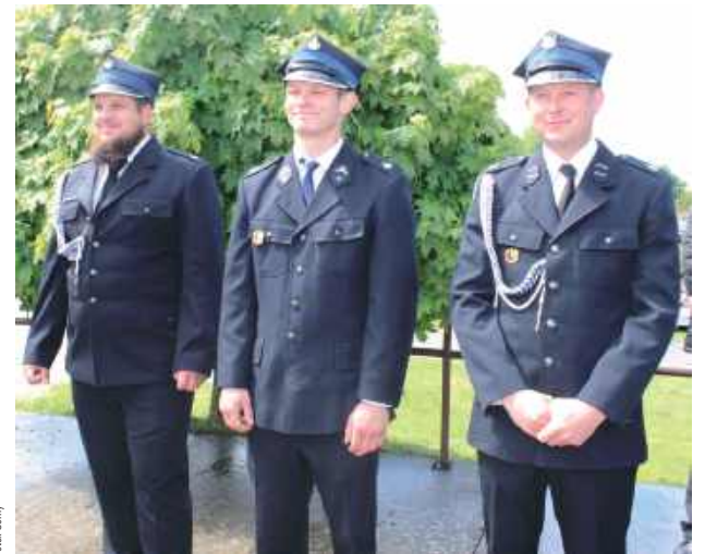
Strażacy z Potoka Górnego służą lokalnej społeczności już 100 lat