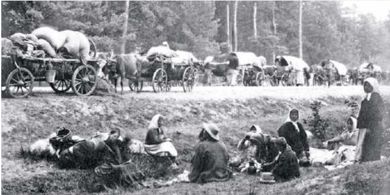
W 1915 r. takie obrazki były normą. Na zdjęciu - Bieżęcy z okolic Włodawy, 1915

B ieżenstwo jest praktycznie zapomnianym, aczkolwiek smutnym epizodem nie tylko Ziemi Biłgorajskiej, ale i Królestwa Polskiego. Była to masowa ewakuacja w czasie I wojny światowej, głównie wyznania prawosławnego, z zachodnich guberni Imperium Rosyjskiego w głąb Rosji, po przezwaniu linii frontu przez wojska niemieckie w okresie od 3 maja do września 1915 r.