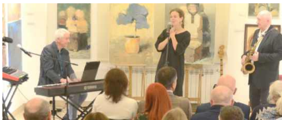
A na scenie zespół Ciepłe Popołudnie, który przepięknie urozmaicił tamten wieczór