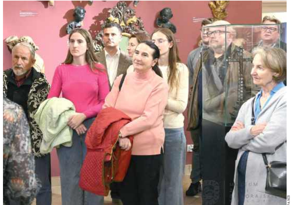
Zwiedzanie ekspozycji cieszyło się sporym zainteresowaniem