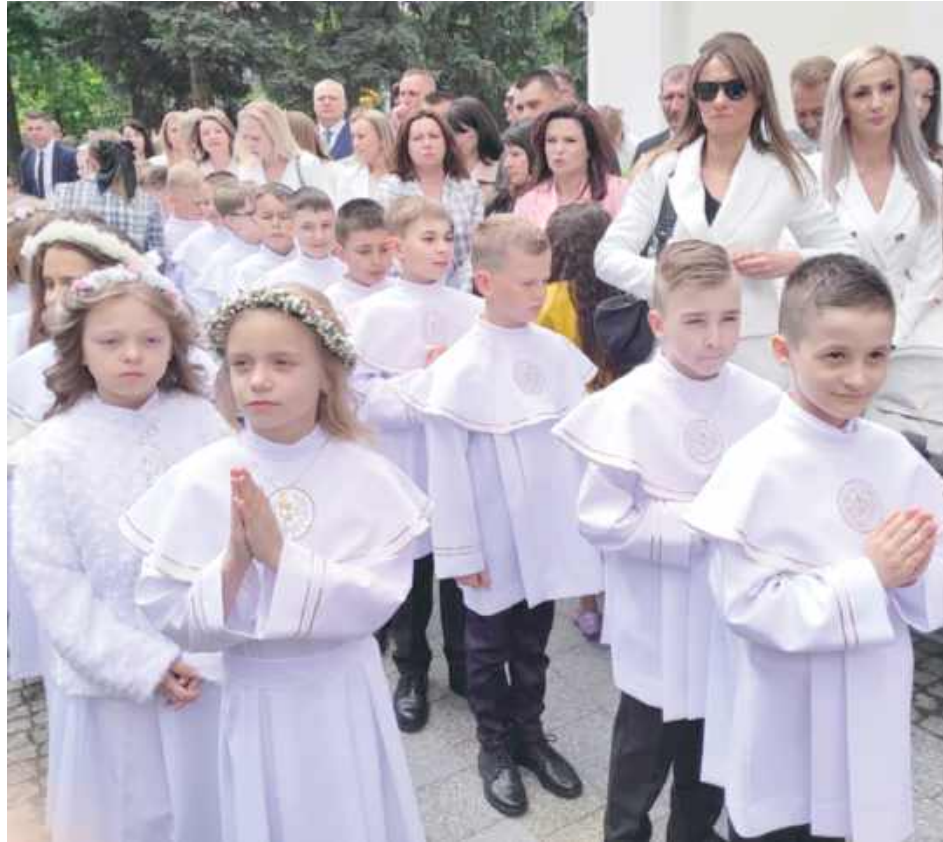
Pierwsza Komunia Święta to początek nowej drogi – drogi bliskości z Bogiem, życia sakramentalnego i wzrastania w wierze