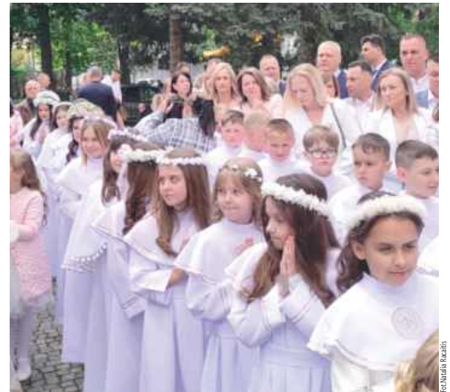
Niech ten dzień pozostanie w sercach dzieci na zawsze jako źródło siły, pokoju i radości