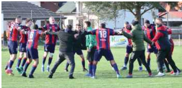
Takich obrazków życzymy piłkarzom z Księżpola po niedzielnym meczu z liderem - Roztoczem Szczepieszyn

Tylko dwa zwycięstwa drużyn z powiatu biłgorajskiego w 21 kolejce piłkarskiej klasy A. Na wyjeździe wygrał nasz najlepszy zespół Relax Księżpol, a w derbowym starciu, Metalowiec Goraj zwyciężył z Orionem Dereźnia.