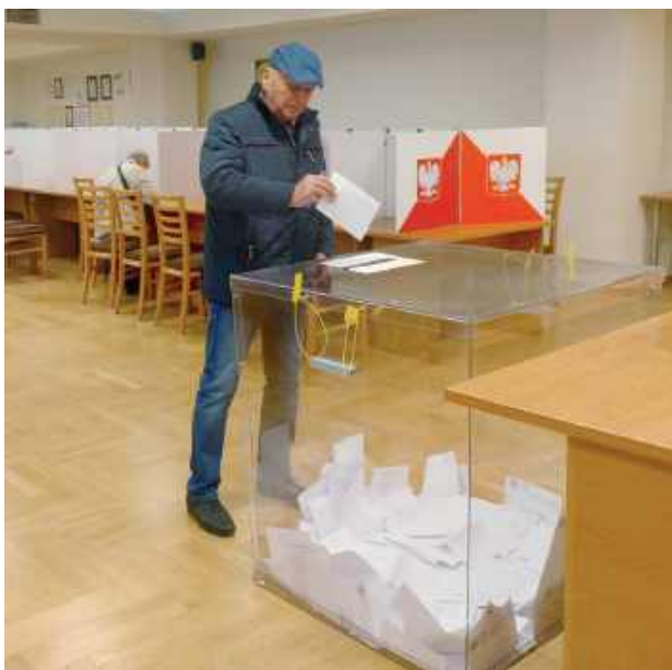
Frekwencja w wyborach prezydenckich w powiecie biłgorajskim wyniosła 64,36 proc.