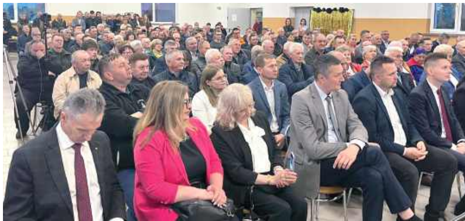
Spotkanie w Aleksandrowie cieszyło się dużym zainteresowaniem

Prelekcje gości spotkały się z dużym zainteresowaniem zgromadzonych – poruszono m.in. kwestie bezpieczeństwa energetycznego, wsparcia dla rolnictwa, inwestycji infrastrukturalnych oraz przyszłości samorządów w zmieniających się realiach społeczno-gospodarczych. Wystąpienia były dynamiczne i pełne konkretów, a prelegenci nie unikali odniesień do aktualnych wydarzeń i decyzji podejmowanych na szczeblu rządowym oraz unijnym. Po części oficjalnej przyszedł czas na otwartą dyskusję – mieszkańcy mieli możliwość zadawania pytań, dzielenia się