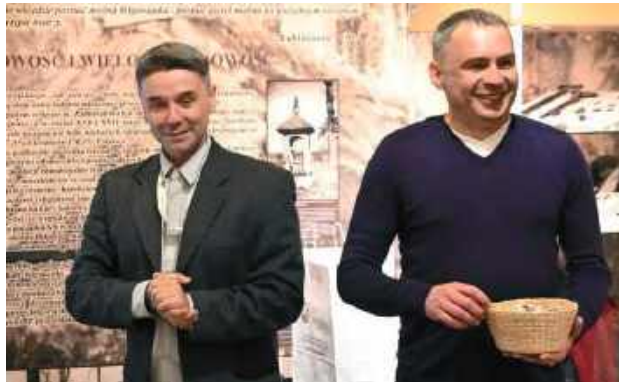
Pytania nie były takie proste