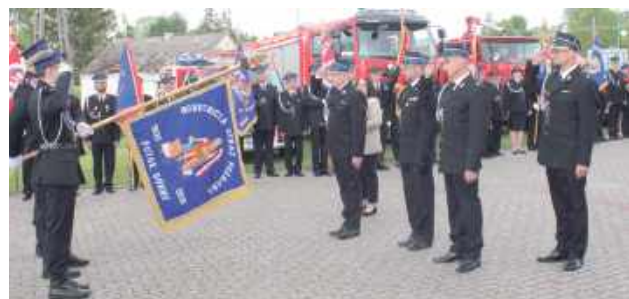
W uroczystości udział wzięły poczty sztandarowe jednostek OSP: Potok Górny, Jedlinki, Dąbrówka, Zagródkki, Szyszków, Naklik, Jasiennik Stary, KSRG Lipiny Dolne, Lipiny Górne - Borowina, Lipiny Górne-Lewki, Stary Bidaczów, KSRG Gózd Lipiński, KSRG Biszcza I, Biszcza II, Bukowina, KSRG Harasiuki

informuje, że na tablicy ogłoszeń Urzędu Gminy oraz na stronie internetowej www.bip.ksiezpol.pl zamieszczono wykaz nieruchomości stanowiących własność Gminy Księżpol przeznaczonych do dzierżawy na okres do 3 lat.