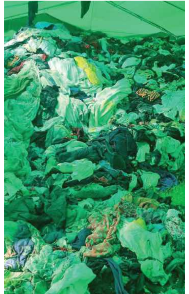
Tony tekstyliów pojawiły się na jednej z działek w Korczowie

Sprawy o uprzątnięcie toczą się na wielu płaszczyznach. W czerwcu 2023 r. Sąd Rejonowy w Biłgoraju skazał go na 10 miesięcy bezwzględnego pozbawienia wolności za oszustwa w tej sprawie. Ponadto burmistrz miasta czterokrotnie nakazał usunięcie odpadów właścicielom posesji przy Zwierzynieckiej. W sprawie nadal toczy się jeszcze jedno postępowanie sądowe. W styczniu 2023 r. w oparciu