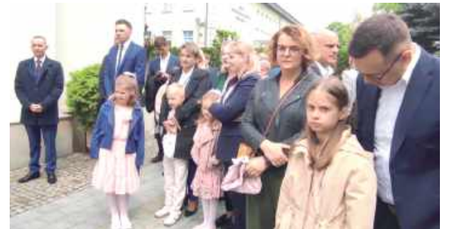
Dzieciom towarzyszyły ich rodziny i bliscy