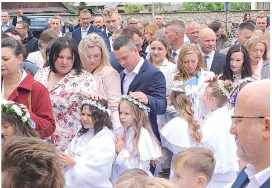
By wszystko było tego dnia wyjątkowe, dzieci przez wiele tygodni uczestniczyły w próbach, podczas których przygotowywały się do sakramentu