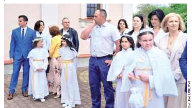
Pierwsza Komunia Święta okazja, by na nowo odkryć wiarę, przypomnieć sobie własne spotkanie z Jezusem w sakramentach i wesprzeć dziecko w dalszym duchowym rozwoju