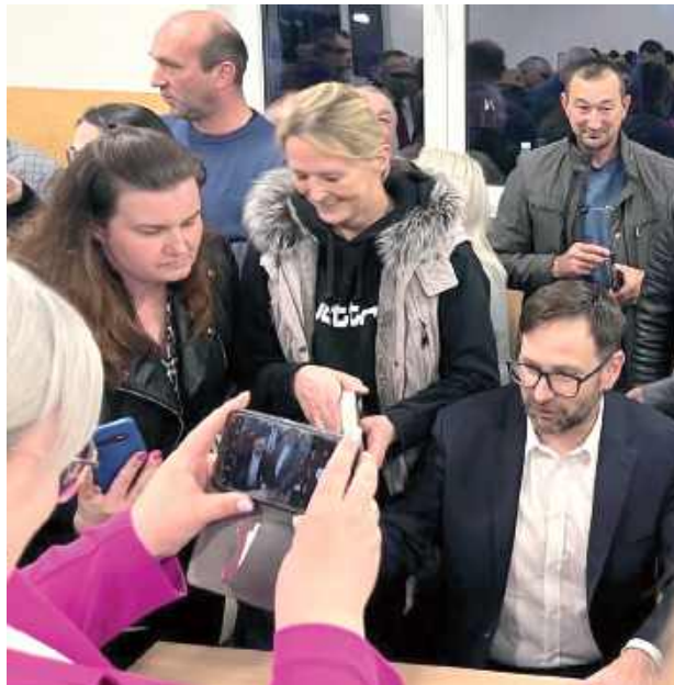
Podczas spotkania można było kupić książkę z autografem europośła Daniela Obajtka. Była też okazja do wspólnych zdjęć