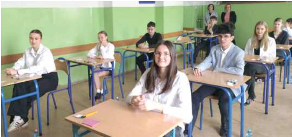
Uczniowie biłgorajskiej „Jedynki” tuż przed rozpoczęciem egzaminu z matematyki