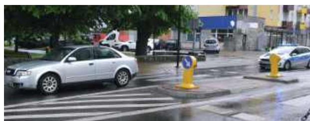
W sobotę około południa na ulicy Kościuszki w Biłgoraju doszło do groźnego wypadku z udziałem pieszej

W sobotę około południa na ulicy Kościuszki w Biłgoraju doszło do groźnego wypadku z udziałem pieszej. Według wstępnych ustaleń policjantów 60-letnia kobieta kierująca samochodem osobowym marki Audi potrąciła 81-letnią kobietę przechodzącą przez oznakowane przejście dla pieszych.