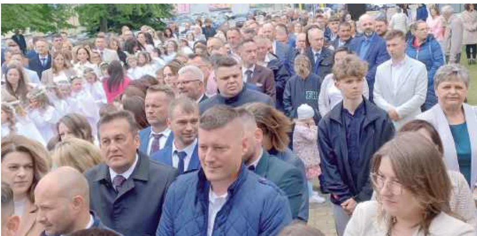
Podczas uroczystości dzieciom towarzyszyli rodzice oraz ich bliscy