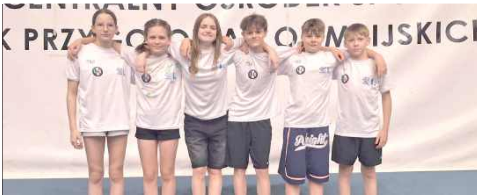
To pływacka wizytówka Biłgoraja doceniana także w województwie lubelskim. Czyli Sparta Biłgoraj na zgrupowaniu kadry regionu

W bólach rodzi się pływanie w Biłgoraju, ale jak widać, wyzwania kształtują młode talenty. Sześciu pływaków RWKS Sparta Biłgoraj zostało właśnie powołanych do kadry województwa lubelskiego.