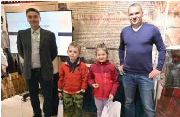
Dla młodych zwycięzców takie quizy nie są wcale trudne