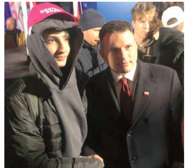
Kandydat Konfederacji Sławomir Mentzen odwiedził Biłgoraj 9 kwietnia. W wyborach prezydenckich zajął na Ziemi Biłgorajskiej drugie miejsce, zdobywając 17,38 proc. poparcia