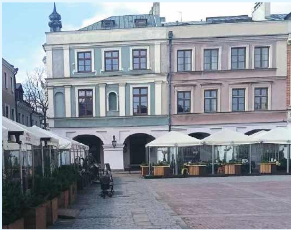
Kamienice przy Rynku Wielkim w Zamościu czekają na najemców

- Zakład Gospodarki Lokalowej w Zamościu Sp. z o.o. ogłasza przetarg ofertowy (pisemny) na wynajem lokalu użytkowego położonego w Zamościu w obrębie Rynku Wiel-