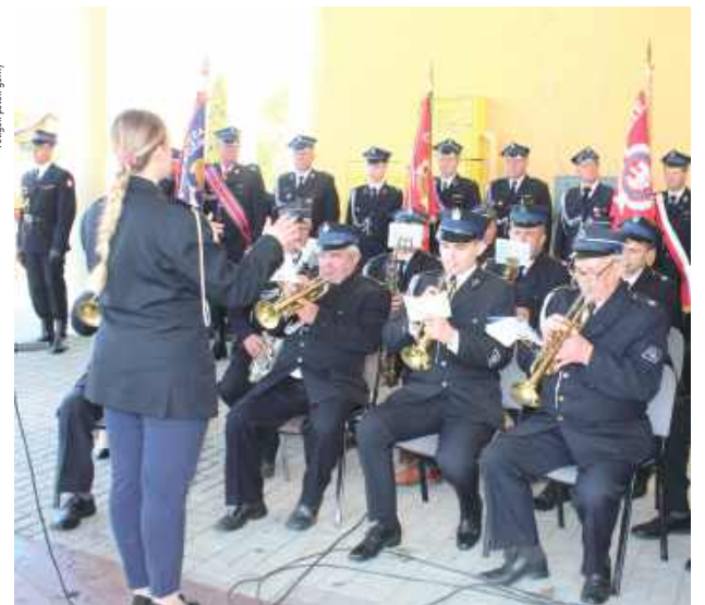
Gminna Orkiestra Dęta z Potoka Górnego znakomicie zadbała o oprawę muzyczną – zarówno podczas Mszy Świętej, jak i w trakcie oficjalnych uroczystości pod remizą. Zwieńczeniem ich występu było przygrzywanie w sali „po obiedzie”, co stworzyło prawdziwie strażacki klimat niemal do samego końca dnia