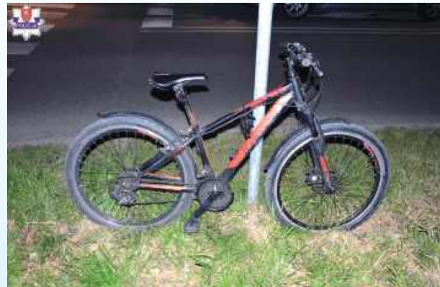
Do potrącenia doszło, gdy cyklista przejeżdżał przez przejazd dla rowerów

Po zderzeniu z osobową Hondą 14-letni rowerzysta trafił do szpitala. Do potrącenia doszło na skrzyżowaniu ul. Piłsudskiego z ul. Okrzei w Zamościu i to w czasie, gdy cyklista przejeżdżał przez przejazd dla rowerów.