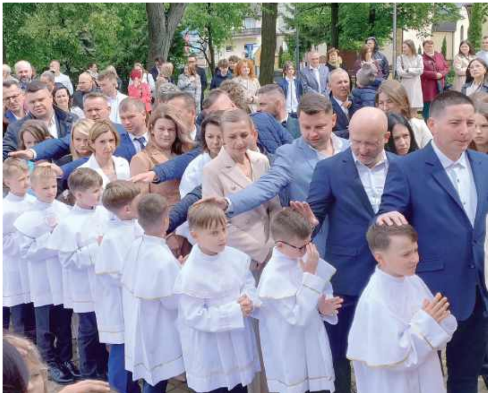
By wszystko było tego dnia wyjątkowe, dzieci przez wiele tygodni uczestniczyły w próbach, podczas których przygotowywały się do sakramentu