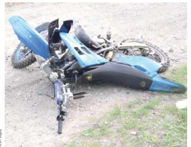
16-letni mieszkaniec powiatu biłgorajskiego, jadąc motocyklem typu Cross, na łuku drogi uderzył czołowo w przód Forda jadącego z przeciwka