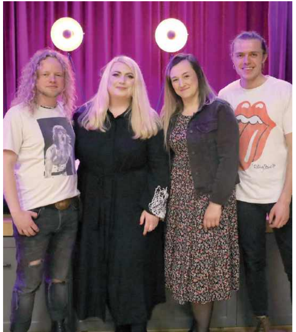
Organizatorzy zaliczyli imprezę do niezwykle udanych