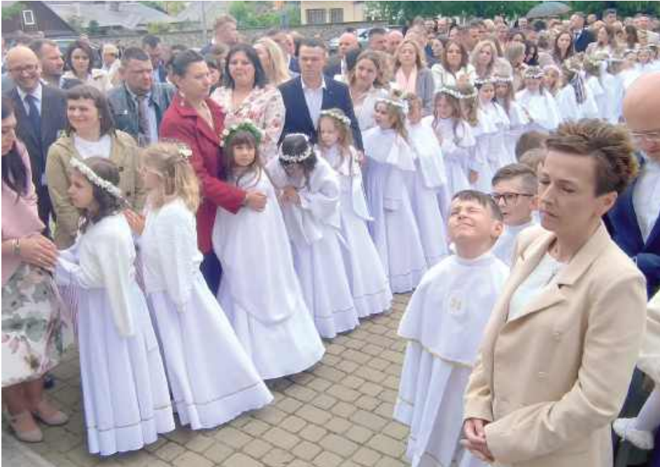
Przed uroczystością dzieci prosily rodziców o błogosławieństwo