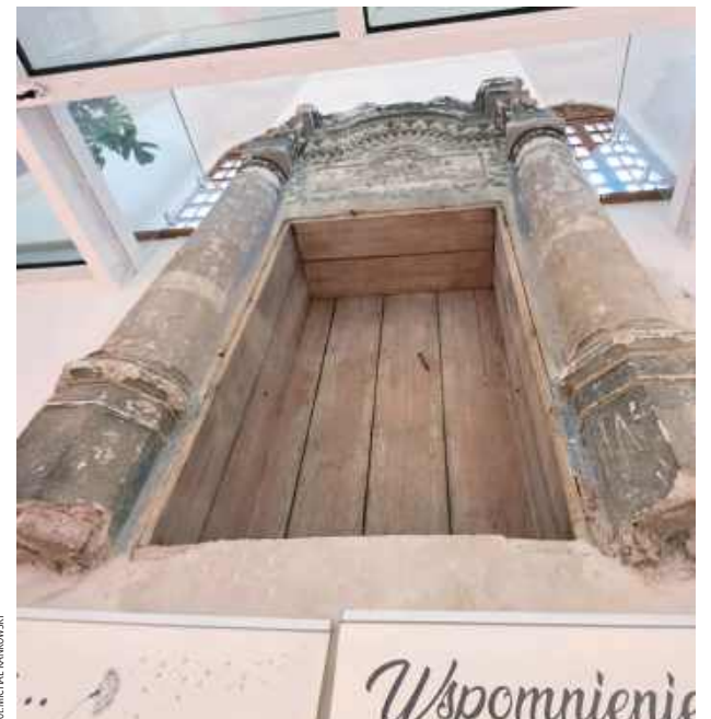
W środku zachowano pamiątkowe elementy