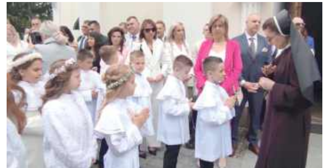
Ostatnie wskazówki i ustalenia przed najważniejszą uroczystością