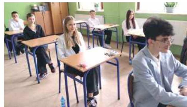
Ósmoklasiści wyglądają niemal jak maturzyści: elegancko ubrani i dobrze przygotowani