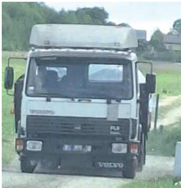
Mieszkańcy twierdzą, że złapali kierowcę tira na gorącym uczynku

„Kto bez wymaganego zgłoszenia lub zezwolenia albo wbrew jego warunkom przywozi z zagranicy lub wywozi za granicę odpady niebezpieczne, podlega karze pozbawienia wolności od lat 2 do 12”.