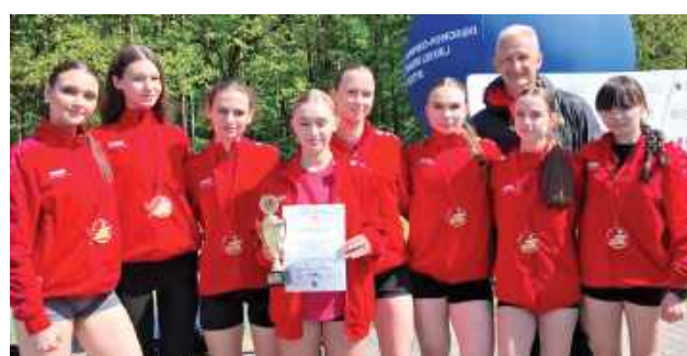
To dziewczyny na medal! Taki sukces!

W czwartek, 8 maja w Leśnym Parku Kultury i Wypoczynku „Myślęcinek” w Bydgoszczy odbył się Ogólnopolski Finał Licealiady w drużynowych biegach przełajowych. Wydarzenie zorganizowano w ramach Ogólnopolskiego Festiwalu Biegowego i zgromadziło dziewięć najlepszych drużyn ze szkół ponadpodstawowych z całego kraju.