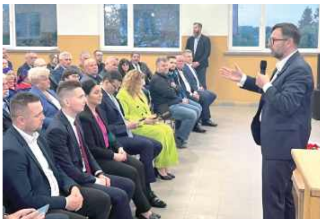
Spotkanie w Aleksandrowie odbyło się zaraz po spotkaniu w Biłgoraju. W pierwszym rządzie zarówno w Biłgoraju, jak i w Aleksandrowie zasiadli ci sami samorządowcy