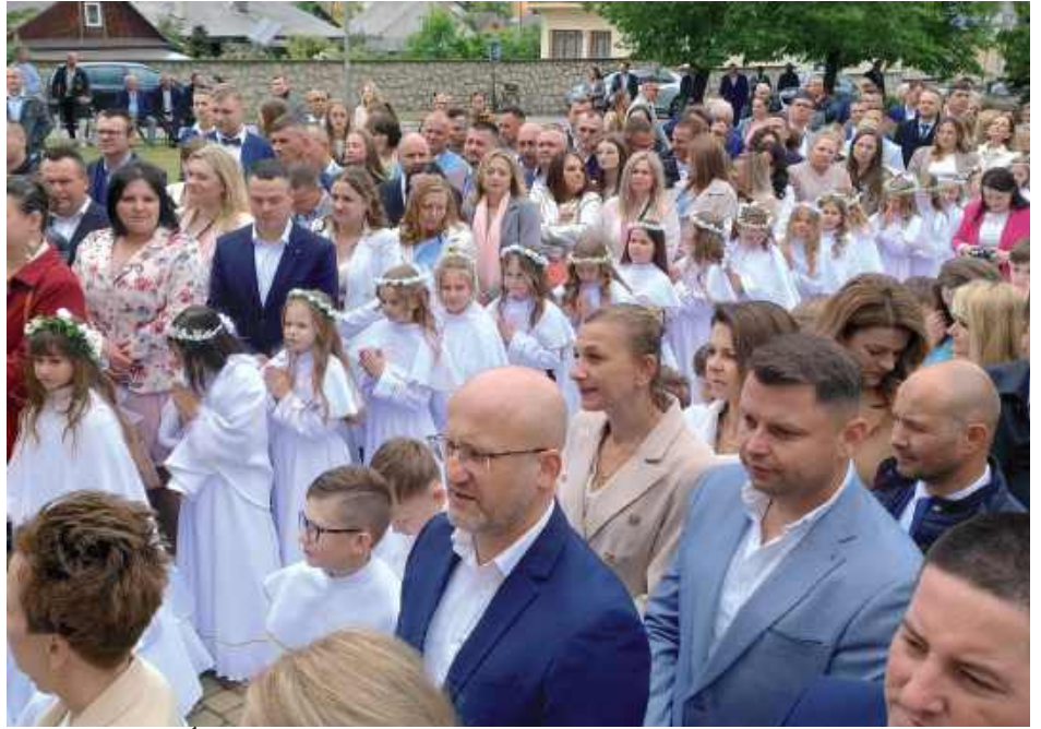
Pierwsza Komunia Święta to ważny moment w życiu dzieci oraz ich rodziców

W niedzielę, 18 maja w sanktuarium pw. Św. Marii Magdaleny w Biłgoraju dzieci przystąpiły do Pierwszej Komunii Świętej. Trzecioklasiści przez kilka miesięcy przygotowawali się do przyjęcia sakramentu. Dzieciom podczas uroczystości towarzyszyli ich bliscy, a rodzice pobłogosławili swoje pociechy tuż przed wejściem do kościoła. Młodzi parafianie w skupieniu uczestniczyli w uroczystej mszy świętej, podczas której po raz pierwszy przyjęli do swojego serca Pana Jezusa.