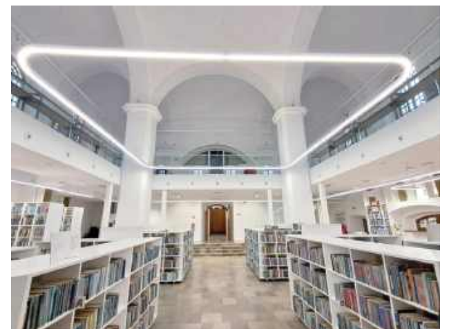
W tarnogrodzkiej bibliotece można naprawdę bardzo miło spędzić czas

Pierwsza drewniana synagoga została zbudowana w Tarnogrodzie być może już ok. 1580 r., a z całą pewnością przed 1627 r., przy południowo-wschodnim narożu rynku, w obrębie tworzącej się dzielnicy żydowskiej, wraz z całym kompleksem synagogałnym