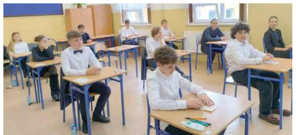
- Jest pozytywne myślenie, będzie dobrze - powtarzali przed egzaminem uczniowie

Ósmoklasiści z całej Polski pisali w ubiegłym tygodniu egzamin podsumowujący edukację w Szkole Podstawowej. Około 300 uczniów pisało swój pierwszy poważny egzamin.