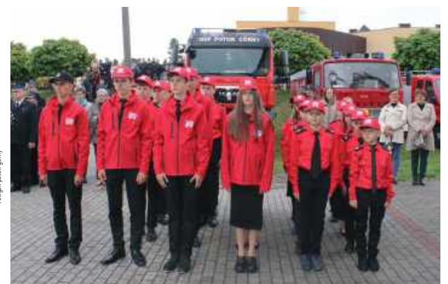
Podczas uroczystości Młodzieżowa Drużyna Pożarnicza złożyła ślubowanie