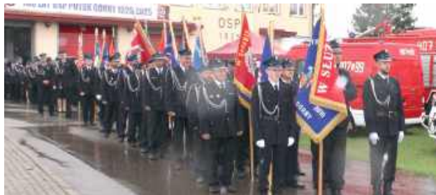
11 maja nasza jednostka jako pierwsza w gminie Potok Górny obchodziła wyjątkowy jubileusz – 100-lecie działalności

- Wszystko przebiegło znakomicie, a zadowolenie uczestników najlepiej oddaje fakt, że prezes nieustannie odbiera telefony z gratulacjami. Dziękujemy, że byliście z nami w tym wyjątkowym dniu! - przekazali po uroczystości druhowie z Potoka.