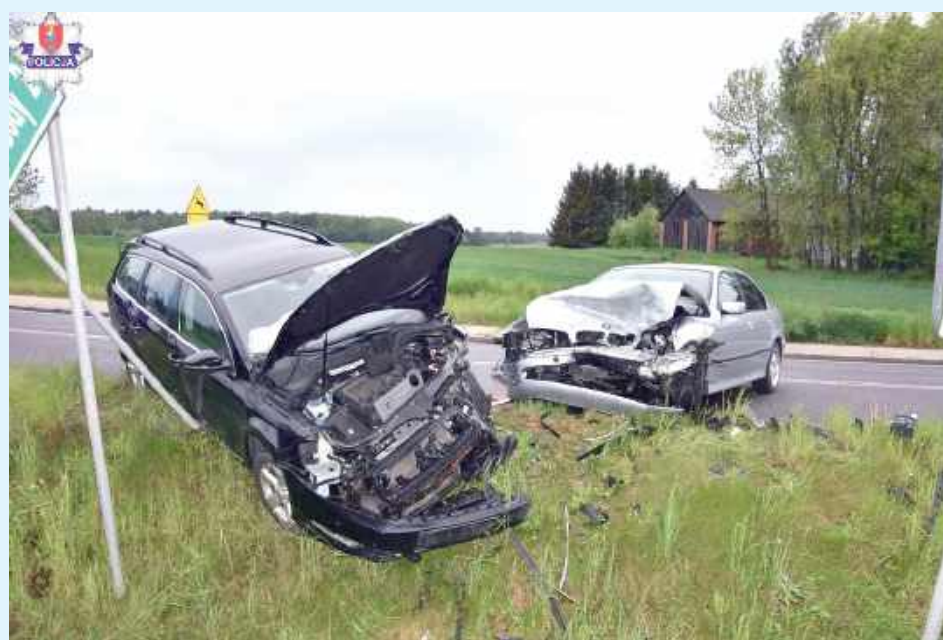
20-letni kierowca BMW stracił panowanie nad pojazdem, zjechał na przeciwny pas ruchu i czołowo zderzył się z kierującym Volkswagensem

z gminy Szczepleszyn, nie odniósł obrażeń, razem z nim podróżował pasażer w tym samym wieku, jemu również nic się nie stało.