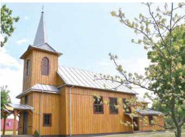
Dzięki pozyskanym środkom i wspólnemu wysiłkowi możliwe było przywrócenie kościołowi należnego blasku i zapewnienie jego trwałości dla przyszłych pokoleń