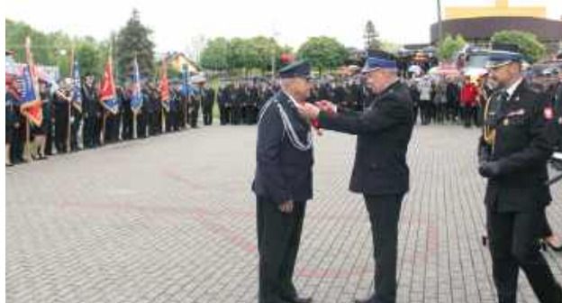
Były medale i odznaczenia