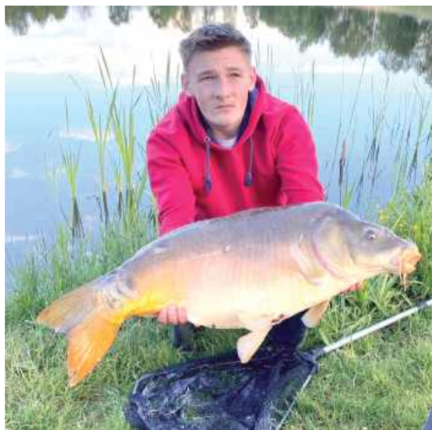
Karp złowiony w biłgorajskim zalewie ważył 12 kg i mierzył 85 cm!

To naprawdę rekordowy okaz. Wędkarze tłumaczą, że przeciętny karp łowiony w Polsce ma długość ok. 40-60 cm i waży od 2 do 5 kg. Jednak w dobrze zarybionych wodach można trafić na znacznie większe osobniki. Rekordowe karpie osiągają długość ponad 90 cm i ważą powyżej 20 kg.