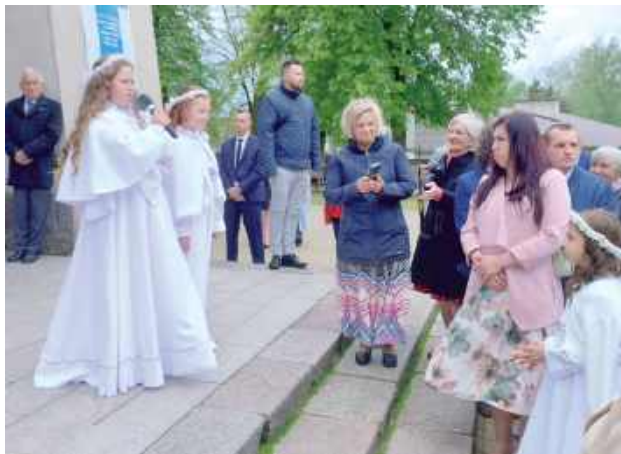
Przed uroczystością dzieci prosily rodziców o błogosławieństwo