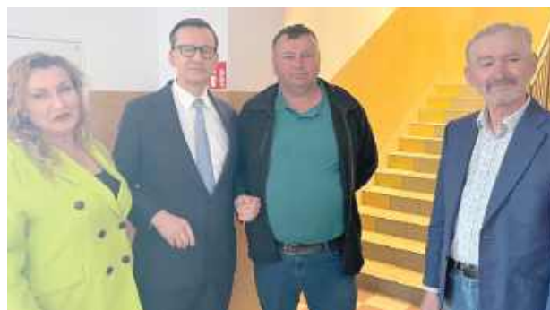
Były premier Mateusz Morawiecki odwiedził Biłgoraj i Aleksandrów