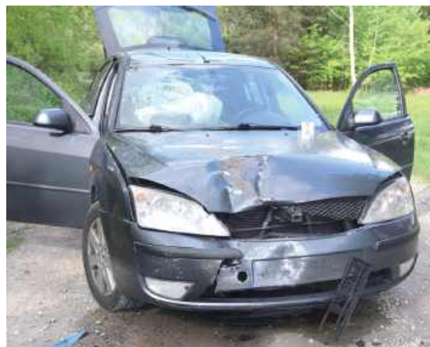
Policjanci zatrzymali elektronicznie dowód rejestracyjny należący do kierowcy Forda, z uwagi na uszkodzenia powypadkowe oraz brak aktualnych badań technicznych pojazdu