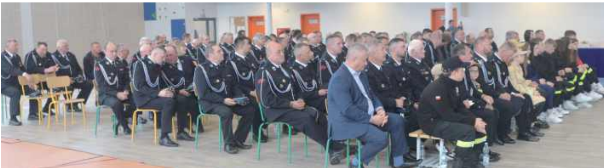
206 młodzieżowych drużyn pożarniczych funkcjonujących przy jednostkach OSP z województwa lubelskiego otrzymało łącznie prawie 2 mln zł