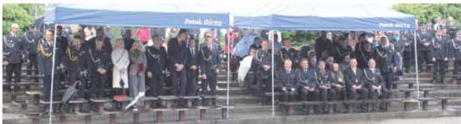
W uroczystości udział wzięli licznie zaproszeni goście