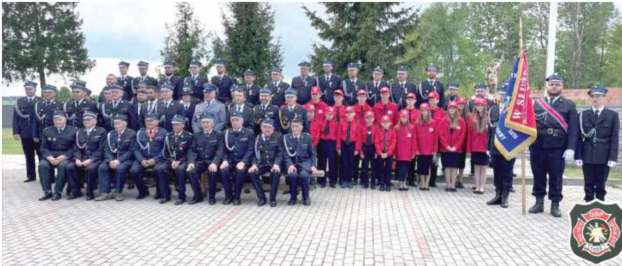
W niedzielę, 11 maja jednostka OSP Potok Górny obchodziła wyjątkowy jubileusz 100-lecie działalności

W niedzielę, 11 maja jednostka OSP Potok Górny obchodziła wyjątkowy jubileusz 100-lecia działalności.