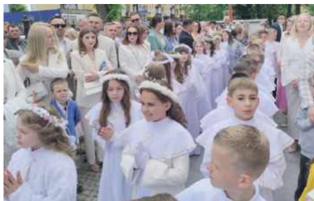
Dla rodziców i bliskich to również moment refleksji i wdzięczności