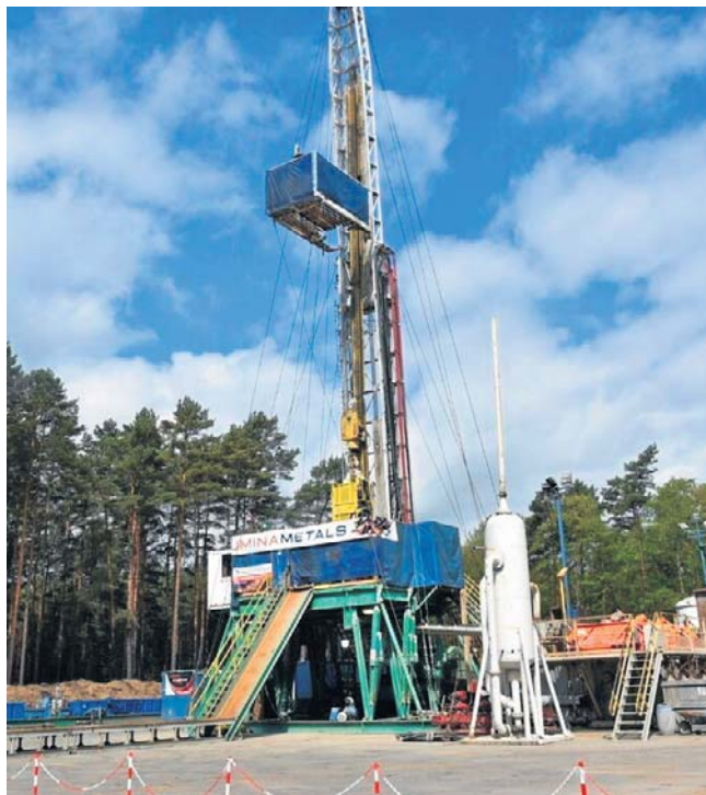
Odwiert na terenie gm. Sława

- Mocno zwracamy uwagę na ochronę środowiska - zapewnia Pandoff. - Modelujemy też to, jak w przyszłości będzie wyglądała kopalnia: gdzie będą poszczególne elementy i szyby. Za-