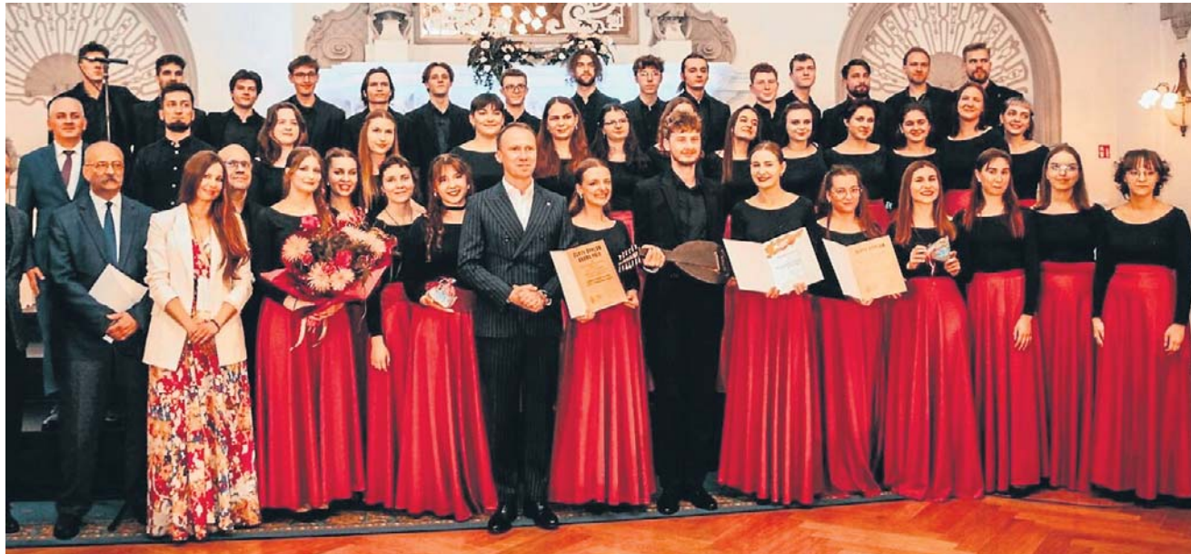
Lodz Chamber Choir jest zdobywcą Grand Prix Turnieju Chórów Legnica Cantat 55. Chór zobaczymy i usłyszymy w sobotę o godzinie 19 podczas gali kończącej Cantat 56