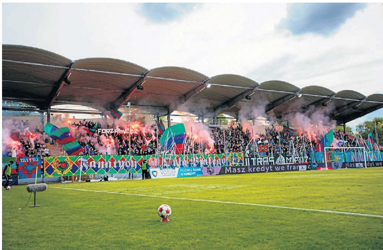
Miedzianka przez część meczu praktycznie nie istniała. Gorący doping z trybun nie pomógł

PIŁKA NOŻNA SZANSE NA EKSTRAKLASĘ JUŻ TYLKO MATEMATYCZNE