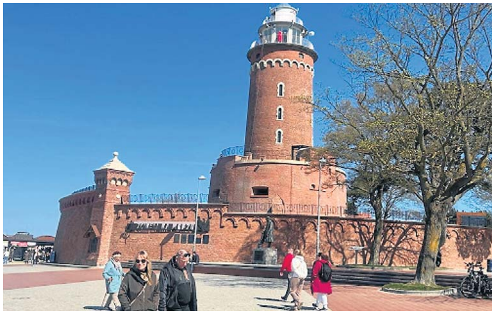
Kołobrzeg to raj dla kuracjuszy. Nazywany jest „perłą Bałtyku”. To najbardziej popularne uzdrowisko w kraju. Znajduje się tutaj kilkanaście sanatoriów i szpitali uzdrowiskowych

No tak, gdyby każdy pacjent opowiadał medykowi szczegółową historię swoich chorób, to