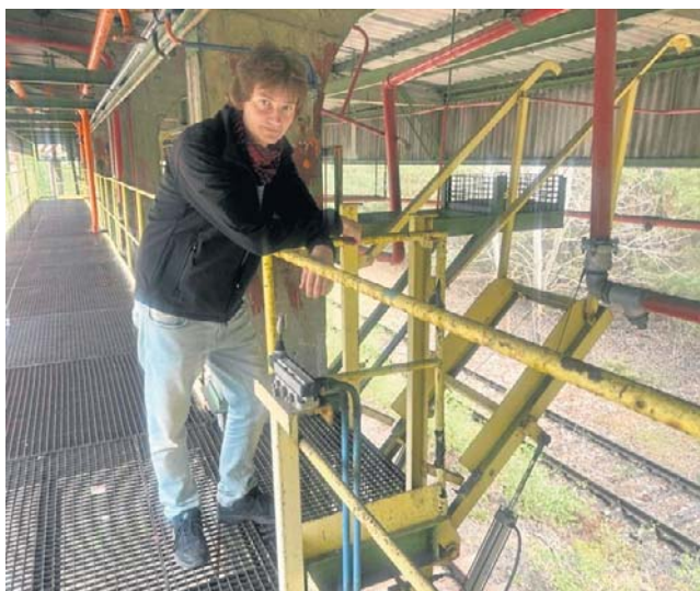
Rampa po bydgoskim Zachemie. „Tory jak w Czarnobylu”

Gwoli wyjaśnienia: wraz z upadkiem ZSRR zamknięta strefa wokół Czarnobylskiej Elektrowni Atomowej uległa podziałowi na dwie części: Ukrainą i Białoruską. Obie znacznie się od siebie różnią i są zarządzane niezależnie od siebie. Strefa ukraińska jest bardziej znana i łatwiej dostępna. To tam znajduje się