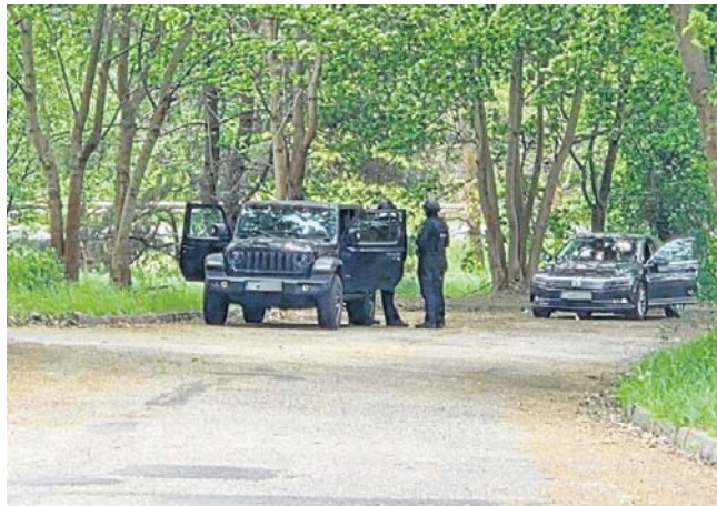
Po podwójnym zabójstwie w Lubinie, na wyjazdach i na obrzeżach miasta intensywnie szukano sprawcy

Dopiero rano dowiedzieliśmy się, że faktycznie doszło do strzelaniny. I co gorsza, to nie był pierwszy raz w ostatnim czasie.