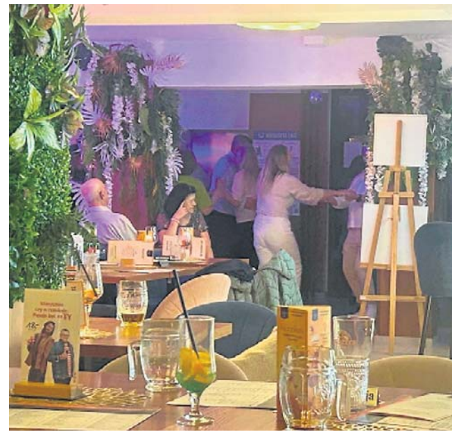
Tańce na dansingu lepsze niż rehabilitacja? Stawy i kręgosłup odpuszczają, a ciśnienie wariuje

- Niby stare ludzie, a bawią się tymi guzikami jak małe dzieci - komentuje pan z obsługi, tzw. złota rączka. - Raz na tydzień muszę wymienić przyciski, którymi