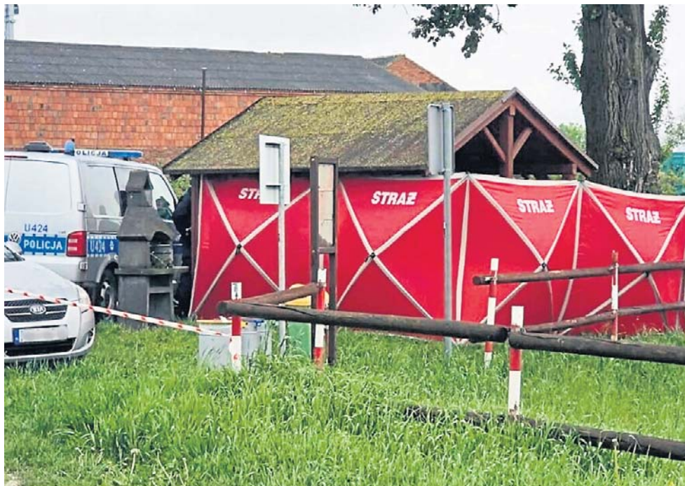
Do samobójstwa doszło na terenie rekreacyjnym przy stawie w Bodzewie (gm. Piaski)

- To było między 00:30 a 1:00 w nocy. Najpierw usłyszałam z dworu jakieś krzyki i wyciski, ale nie zwróciłam na to większej uwagi, bo takie sytuacje zdarzają się tutaj dość często. Chwilę później usłyszałam dwa strzały. Wtedy jeszcze nie pomyślałam, że może chodzić o strzelaninę. Leżałam już w łóżku, kiedy nagle zrobiło się zamieszanie i na miejsce przyjechała policja. To właśnie najbardziej zapamiętałam z całej sytuacji - mówi nam jedna z mieszkank.