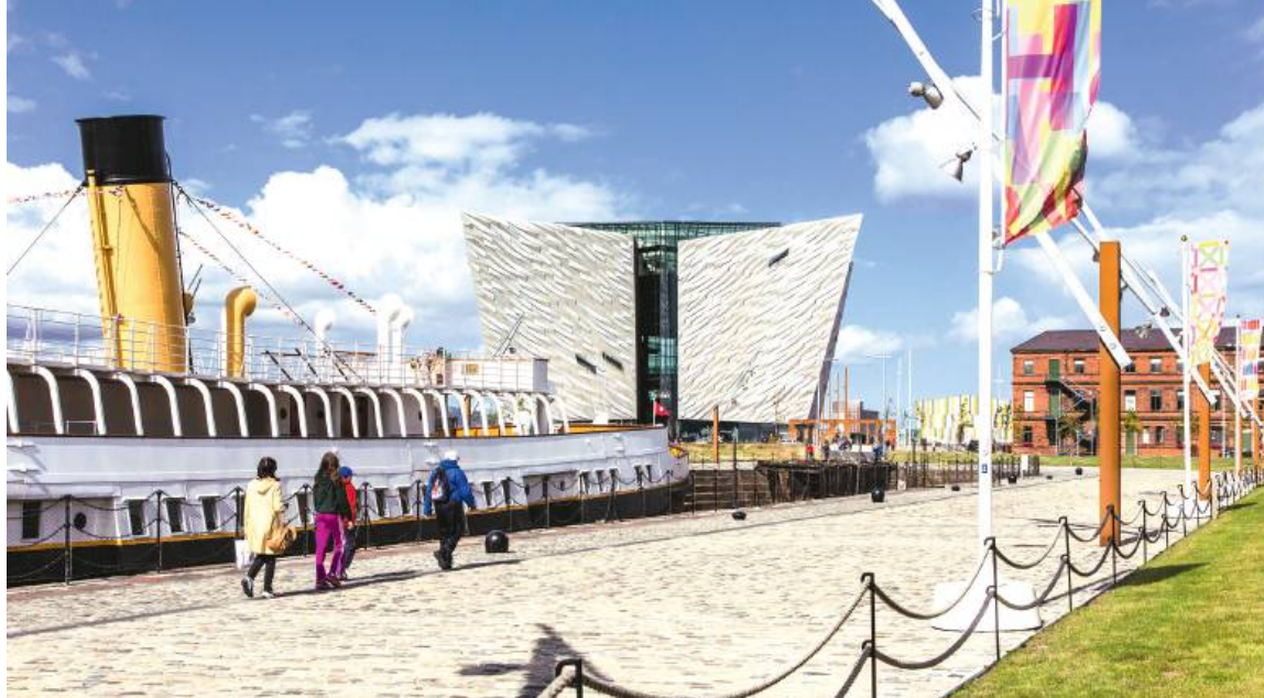
Muzeum Titanica w 2024 r. odwiedziło ok. 880 tys. osób.

Budynki rosną w górę, bo Belfast to pionowe miasto.