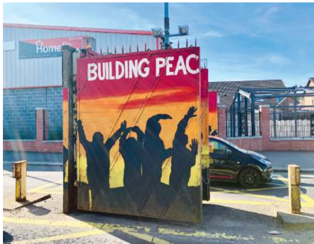
Jeden z tzw. interfejsów, czyli miejsc, gdzie dzielnice irlandzkie łączą się z brytyjskimi.

Jest The Cosy Bar, The Longfellow Bar, My Lady Inn. Są stali bywalcy, przychodzą tu pewnie od kilkudziesięciu lat. Jest guinness, bo „There’s nothing like a Guinness”, jak zapewniają reklamy, albo harp, taki ich lager. Zlejmy wszystko w jedną całość, bo miejsca i ludzie podobni.