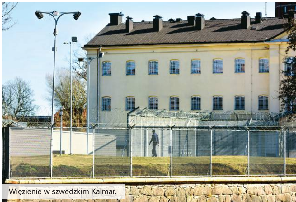
Więzienie w szwedzkim Kalmar.

Wygładam przez okno. Wysoki, blisko 10-metrowy mur zwieńczony