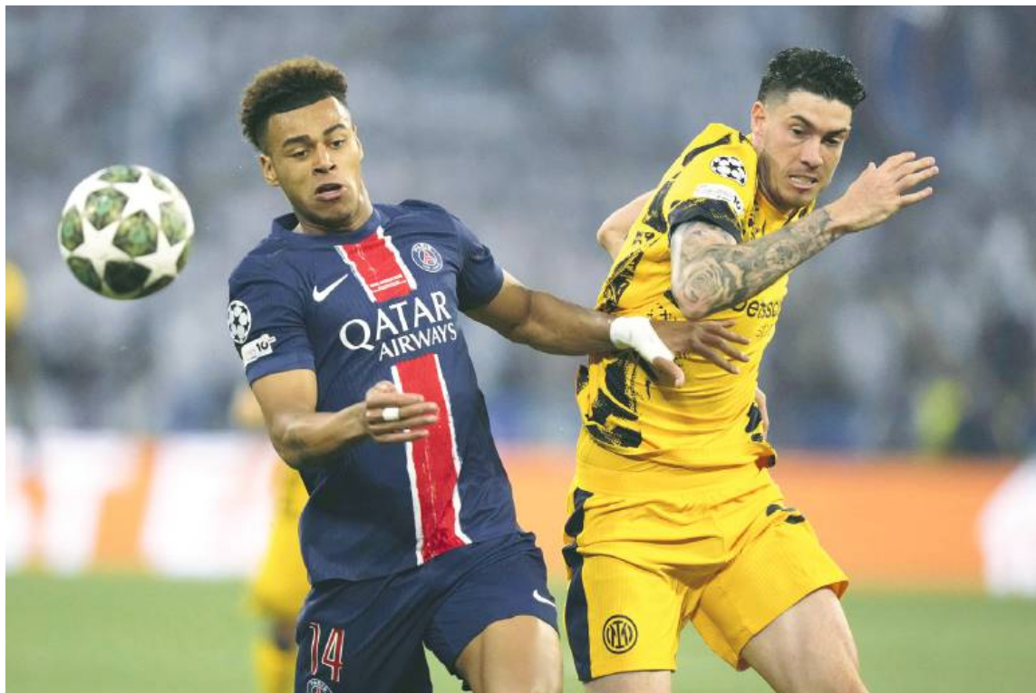
Désiré Doué z PSG (po lewej) walczy o piłkę z Alessandrem Bastonim z Interu podczas finałowego meczu Ligi Mistrzów na Allianz Arenie w Monachium, 31 maja 2025 r.