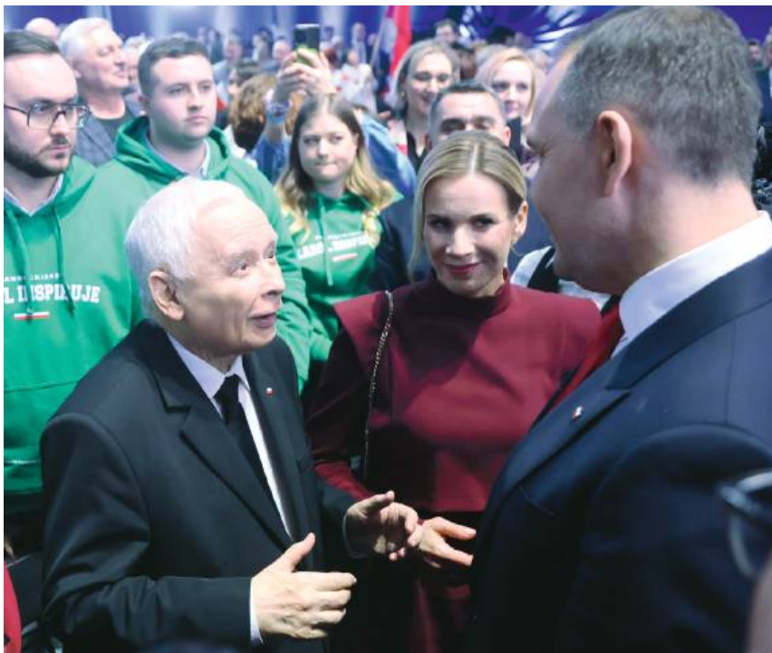
Jarosław Kaczyński znów może się chwalić, że ma nosa do prezydentów. Nz. konferencja programowa w Szeligach koło Warszawy, 2 marca 2025 r.

go wywołuje. Stąd islamofobia. Polacy są islamofobiczni, chociaż nigdy w życiu nie rozmawiali z muzułmaninem. I tak dalej.