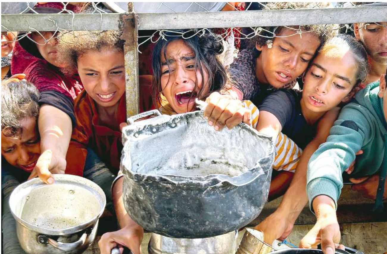
Palestyńczycy oczekujący na przydział jedzenia w punkcie dystrybucyjnym w Chan Junus, 25 maja 2025 r.

jest wrogiem Izraela, ale „wrogie jest każde dziecko w Gazie. Musimy okupować Gazę i zasiedlić ją. Nie pozostanie tam ani jedno dziecko. Nie ma innego zwycięstwa”.