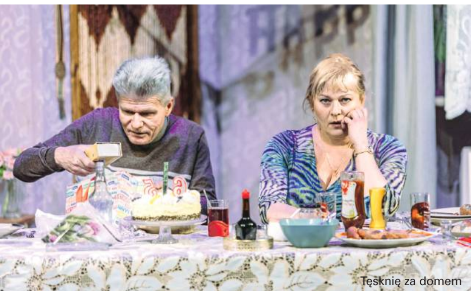
Tęsknię za domem

► powierzchownym obrazem świata i ludzi wypchniętych na margines, a postaci i epizody z epopei Mickiewicza służą jako rusztowanie do słabo kontrolowanych wariacji na współczesne tematy. Największe wrażenie robi finałowy, rzeczywiście złowieszczy polonez i poprzedzająca go pieśń Jankiela. Reszta jest przygotowaniem, dość ryzykownym dla widzów oczekujących większej dyscypliny intelektualnej, choć – odnotowuję dla porządku – odbieranym z entuzjazmem przez młodą i bardzo młodą część widzów.