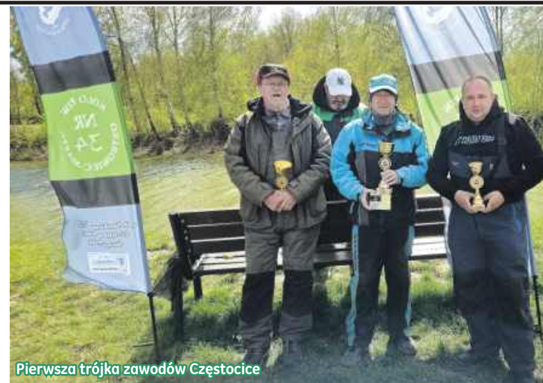
Pierwsza trójka zawodów Częstocice

Podobnie ma się sytuacja jeśli zawody odbywają się w dwóch turach. Trzeba wtedy zbierać punkty z obu i po dodaniu wyłania się zwycięzca. Ale jest też taka rzecz, że może dwóch zawodników mieć tyle samo punktów. Co wtedy? Ano wtedy liczy się waga złowionych ryb. A co, jeśli zdarzy się, że będzie taka sama? Wtedy po prostu są np. dwa pierwsze miejsca. Mam nadzie-