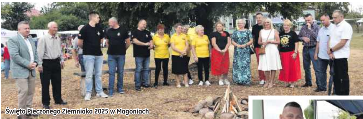
Święto Pieczonego Ziemniaka 2025 w Magoniach

Gmina Bodzechów w postępowaniu konkursowym przyznała środki na realizację zadań publicznych przez organizacje pozarządowe. Łącznie rozdysponowano 120 tysięcy złotych.