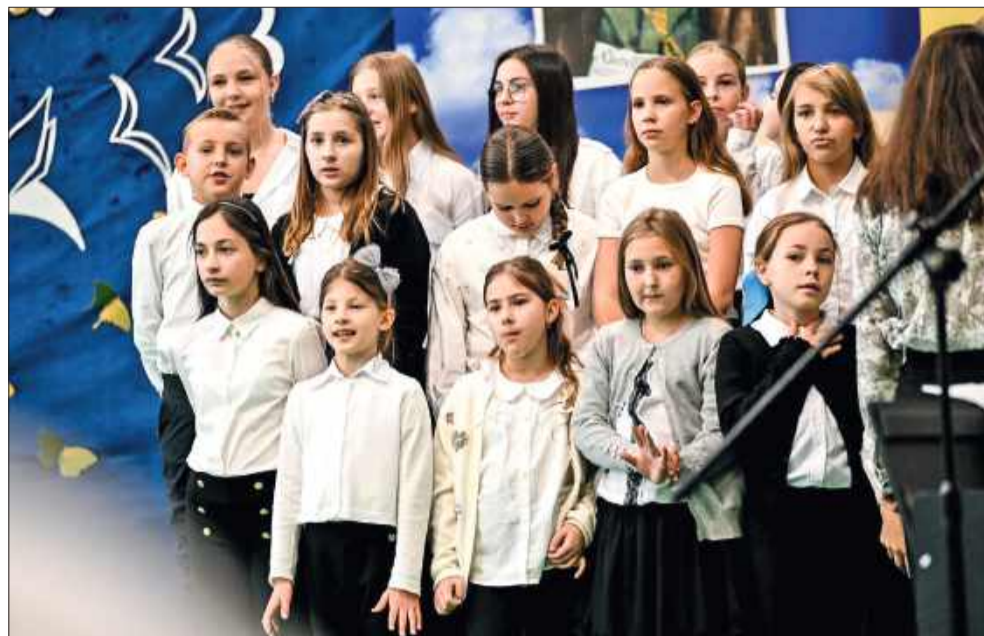
Uczniowie w programie artystycznym przygotowanym specjalnie na jubileusz szkoły.