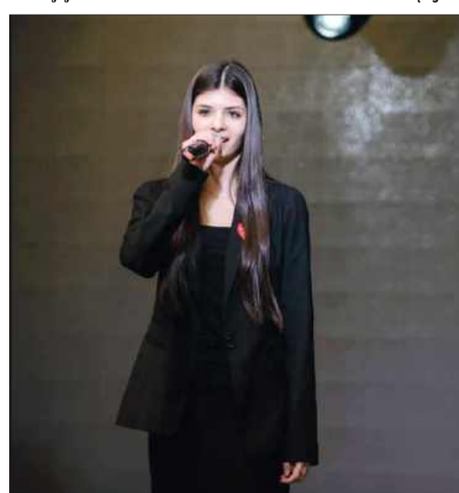
Jej głos zachwyca jury w całej Polsce. Teraz chce rozwijać się na wielkich scenach.

■ Czy masz wymarzoną ścieżkę, którą chciałabyś rozwijać w swojej karierze?