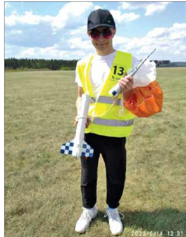
Modelarstwo kosmiczne uczy wytrwałości, pasji i pracy zespołowej.

■ Mielec może być z Ciebie dumny! Co daje Ci ta pasja na co dzień?