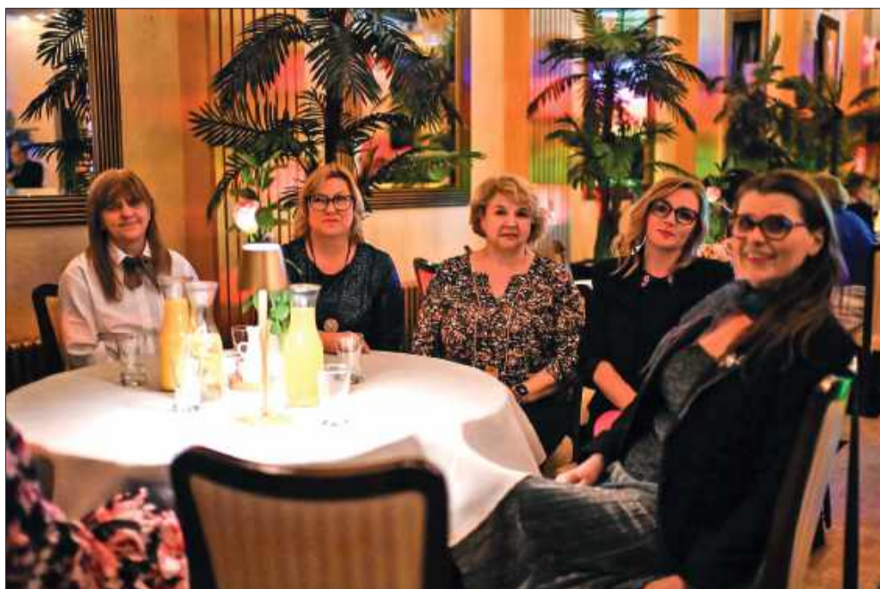
Na widowni zasiedli przyjaciele, partnerzy i sympatycy stowarzyszenia.