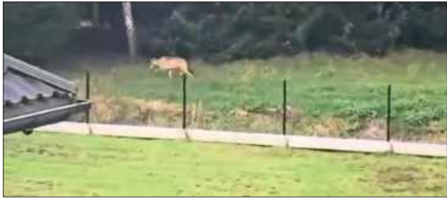
Wilki widziane były w pobliżu domów.

W ostatnich dniach w mediach społecznościowych i wśród mieszkańców gminy Radomyśl Wielki coraz częściej pojawiają się doniesienia o obecności wilków w pobliżu zabudowań. Zaniepokojeni mieszkańcy informują o zwierzętach widzianych na polach, przy drogach, a nawet na obrzeżach wsi, niedaleko domów. W związku z tym Urząd Miejski wydał oficjalny apel o zachowanie ostrożności.