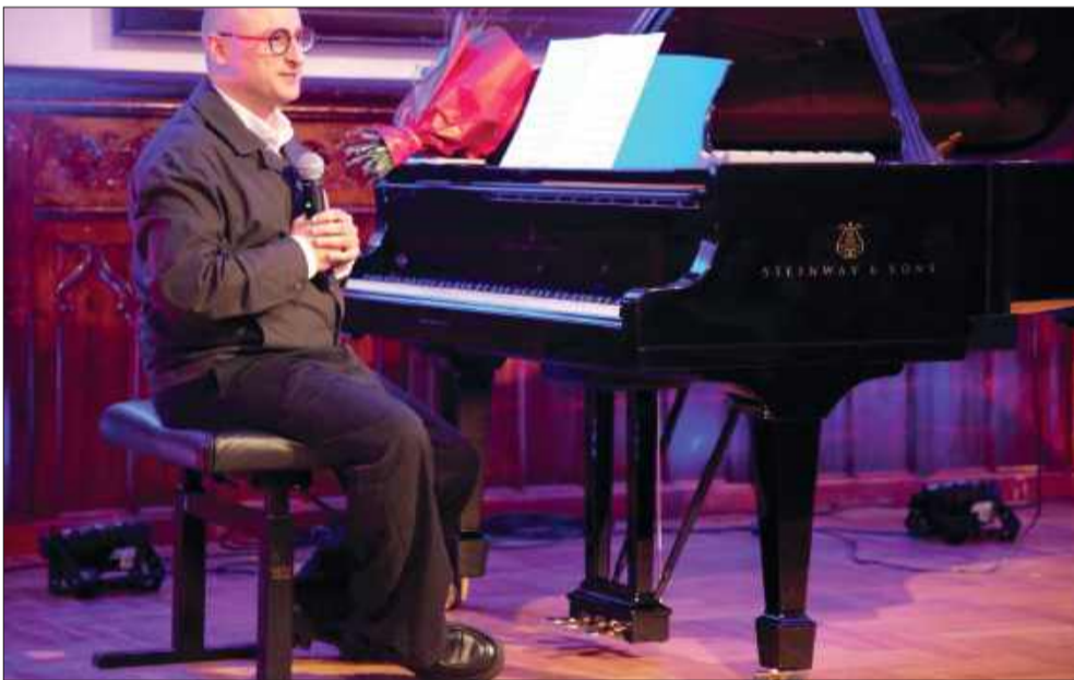
Wyjątkowy koncert w ramach 28. Mieleckiego Festiwalu Muzycznego.