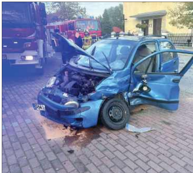
Kolizja w Żarówce.