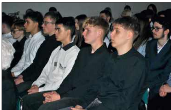
Wspólnotę szkoły przez lata tworzyli uczniowie, nauczyciele i rodzice.

Podczas spotkania nie zabrakło momentów wzruszenia. Uczestnicy mogli obejrzeć archiwalne zdjęcia, które przywoływały wspomnienia pierwszych lat funkcjonowania szkoły, dawnych klas, nauczycieli i wydarzeń, które kształtowały jej historię. Wspominano początki, kiedy wszystko dopiero się zaczynało, oraz kolejne etapy rozwoju, dzięki którym Zespół Szkół w Radomyślu Wielkim