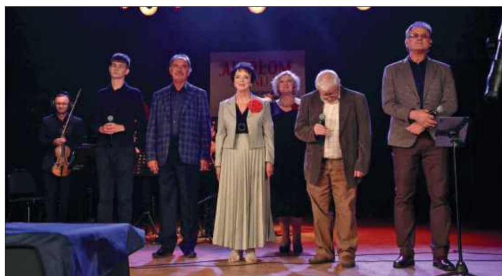
Uroczysta inauguracja 19. roku akademickiego Mieleckiego Uniwersytetu Trzeciego Wieku.

Ich działalność to nie tylko nauka i rozwój osobisty, ale także budowanie więzi międzyludzkich i społecznych. MUTW odgrywa ważną rolę w życiu Mielca – łącząc pokolenia, inspirując do działania i promując ideę aktywnego starzenia się.