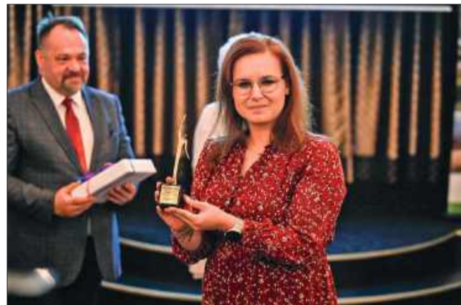
Laureaci tegorocznej nagrody Prometeusza – Stowarzyszenie „DLA WAS” z Mielca.