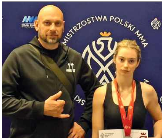
Świetny wynik mielczanki.