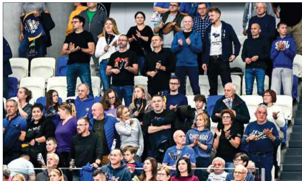
Kibice z Mielca nie zawiedli – gorący doping przez całe spotkanie.