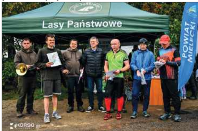
Zmęczeni, ale zadowoleni.