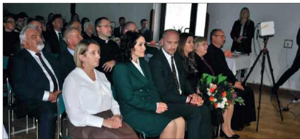
Rozwój szkoły zawdzięcza działaniu i współpracy wielu osób.

Dyrektor zaznaczyła również, że minione lata to czas nie tylko sukcesów, ale też wspólnych wyzwań, którym szkoła zdołała sprostać dzięki zaangażowaniu całej społeczności: