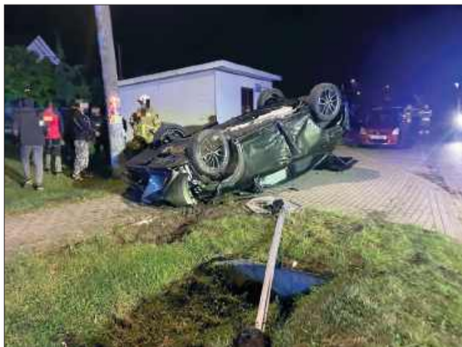
Dachowanie w Rudzie.