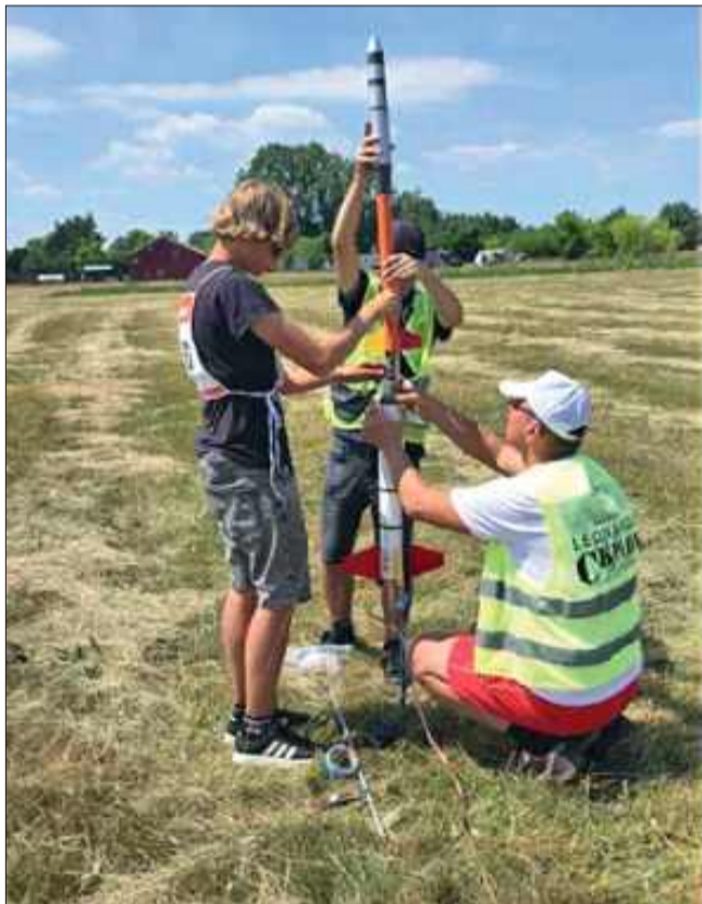
Każdy detal ma znaczenie.

- Największym sukcesem był dla mnie udział w Mistrzostwach Europy w 2022 roku, gdzie zdobyłem trzy pierwsze, jedno drugie i jedno trzecie miejsce drużynowe.