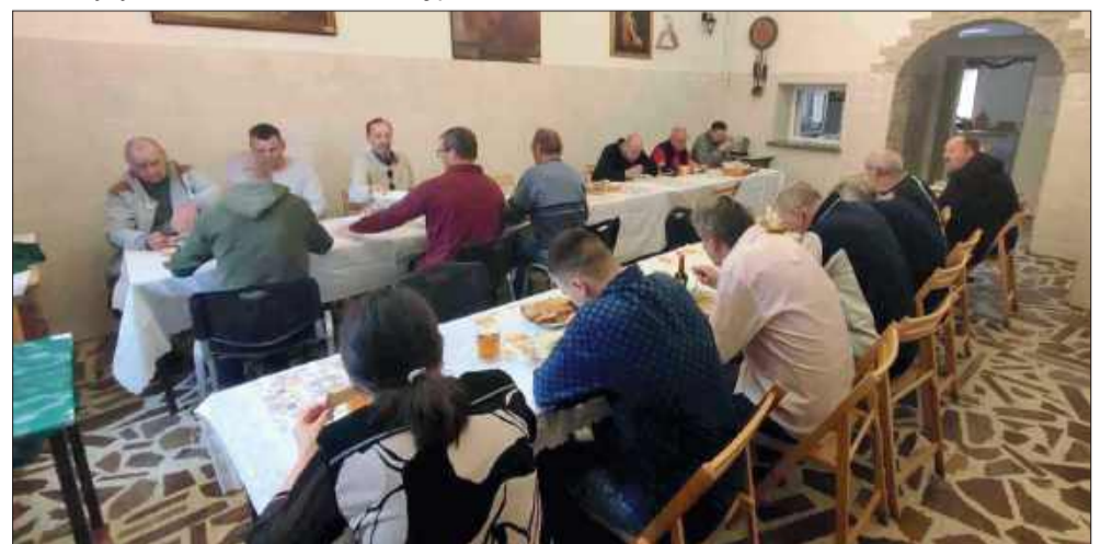
W mieleckich placówkach są jeszcze miejsca dla osób potrzebujących.