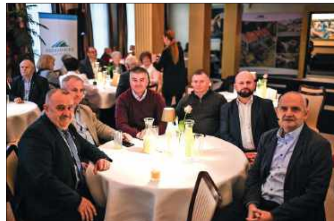
Uroczystość zgromadziła licznych przedstawicieli władz samorządowych i instytucji lokalnych.

Przyznanie nagrody Prometeusza jest wyrazem uznania dla wieloletniej pracy członków stowarzyszenia, którzy od lat konsekwentnie niosą pomoc potrzebującym, budując wokół siebie wspólnotę pełną empatii i zrozumienia.