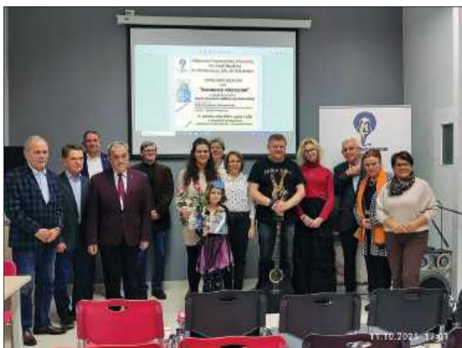
Kulminacyjnym momentem wydarzenia było uroczyste wręczenie nagród.