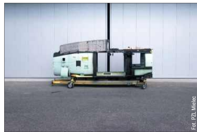
Kabina Black Hawk z PZL Mielec