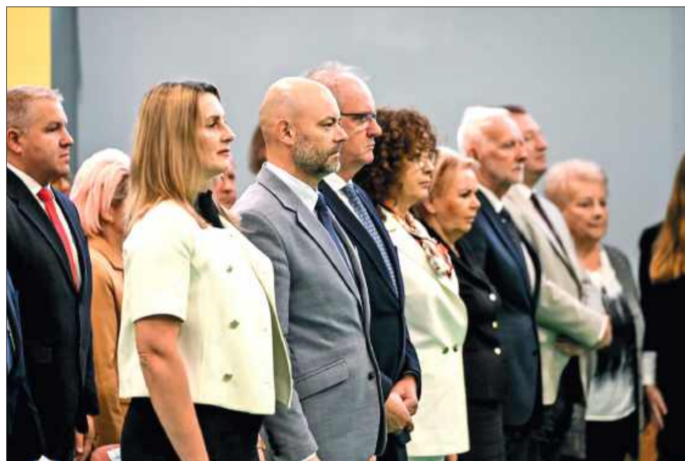
Goście jubileuszu – wśród nich przedstawiciele władz miasta i mieleckiego samorządu.