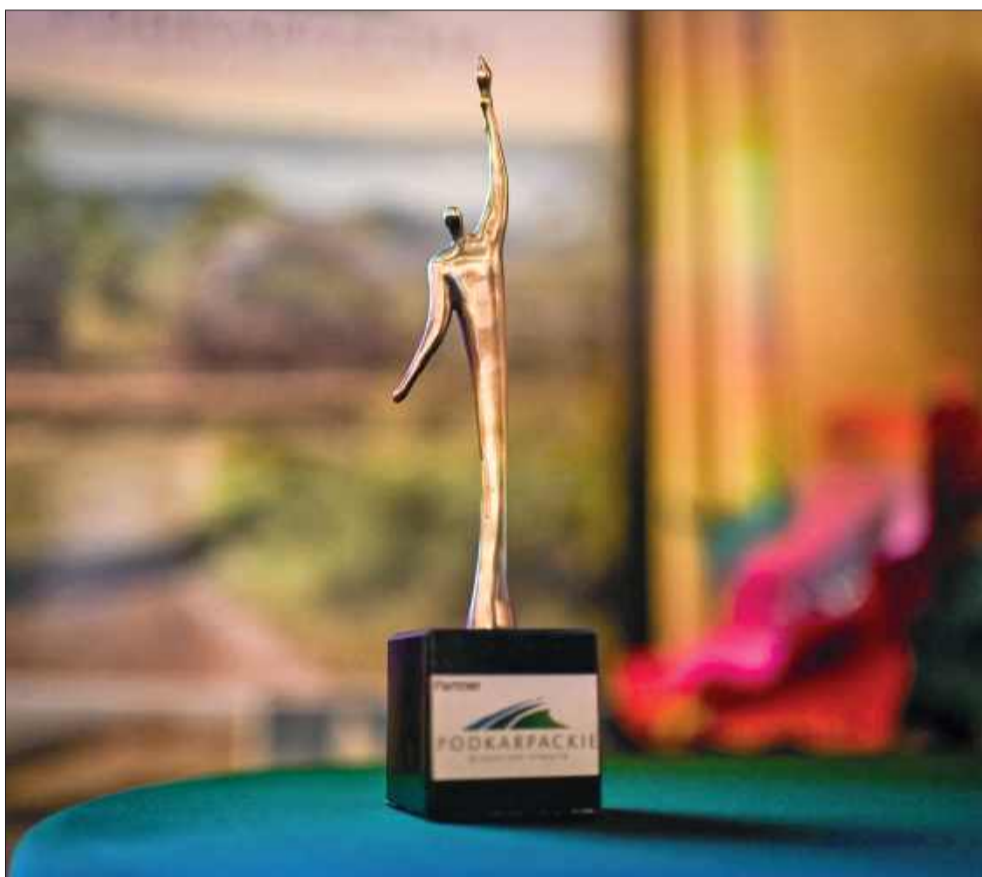
Statuetka Prometeusza – symbol pasji, poświęcenia i siły społecznej.

Stowarzyszenie zajmuje się wsparciem edukacji i rozwoju, integracją osób z niepełnosprawnościami oraz zagrożonych niepełnosprawnością. Swoją opieką obejmuje rodziny i opiekunów osób niepełnosprawnych; dzieci, młodzież i dorosłych zagrożonych wykluczeniem społecznym. W ostatnim okresie Stowarzyszenie realizowało dużo projektów m.in.: ARTE-k – ośrodek ekspresji twórczej dzieci i młodzieży niepełnosprawnej, Festiwal Dzieci Niezwykłych, Bractwo Ludzi Niezwykłych – Program wsparcia „FOR-RY”, Mielecką Akademię Kreatyw-