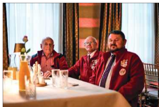
Goście na ceremonii wręczenia mieleckiego Prometeusza.