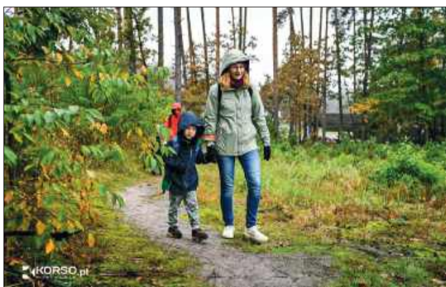
Zielony Punkt Kontrolny to już tradycja.

Choć pogoda nie rozpieszczała, deszcz nie zdołał ostudzić entuzjazmu uczestników. Organizatorzy - Nadleśnictwo Mielec, Polskie Towarzystwo