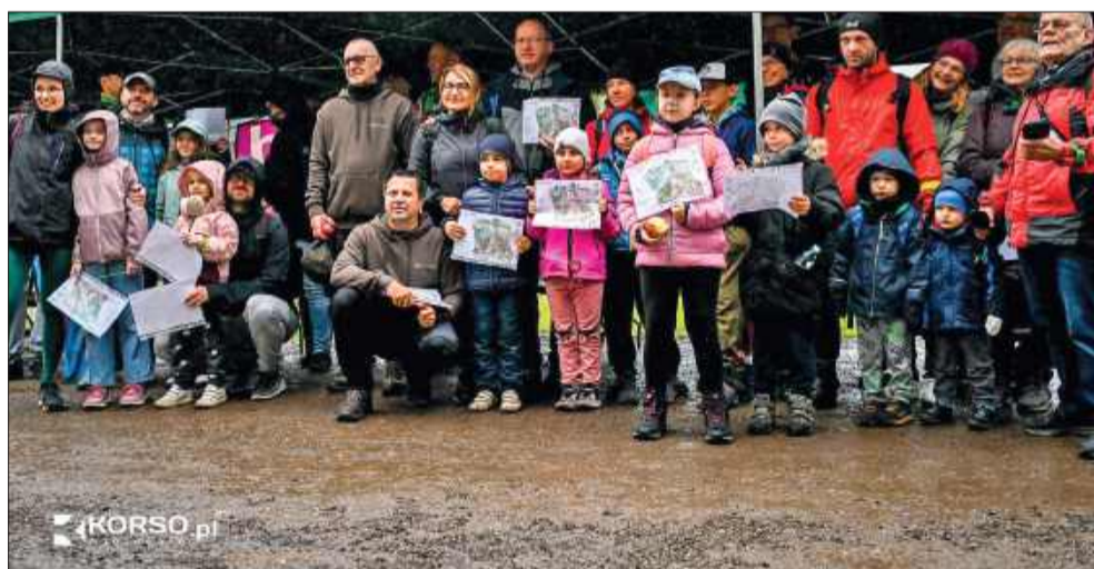
Wspólne zdjęcia uczestników i organizatorów na zakończenie imprezy.