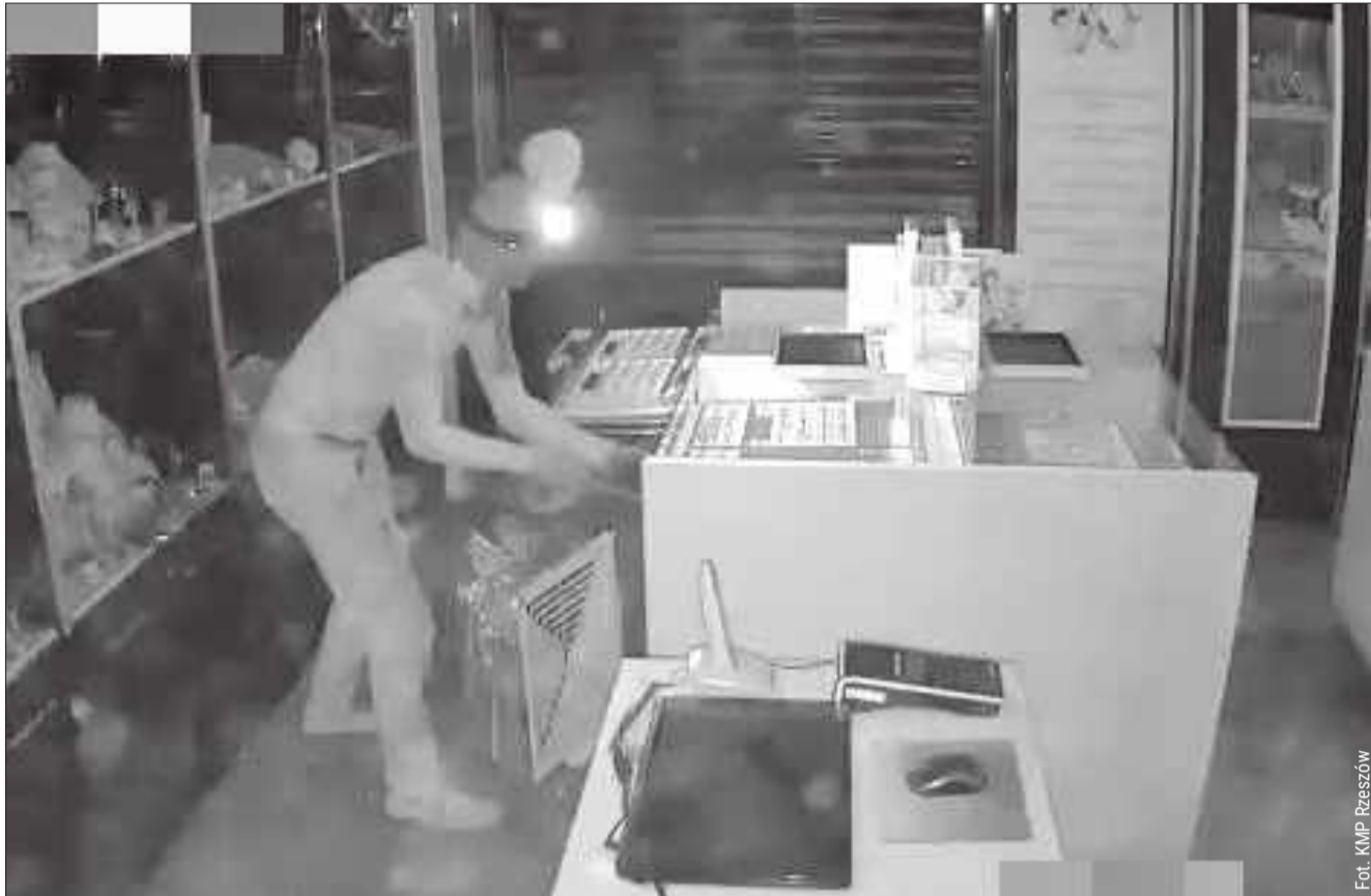
Zdjęcie ze sklepowego monitoringu.

O zdarzeniu policję poinformowano 25 września. Funkcjonariusze, którzy pojawili się w galerii przy al. Piłsudskiego, zabezpieczyli teren oraz przeprowadzili szczegółowe oględziny. Każdy, nawet najmniejszy ślad,