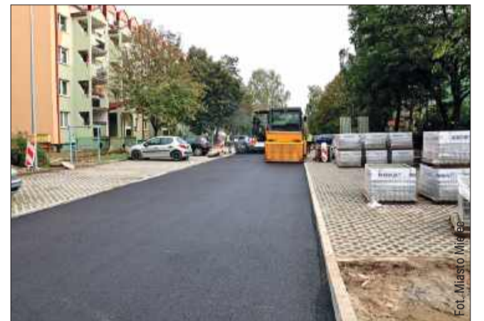
Trwające prace na Warneńczyku

Na ulicy Warneńczyka w Mielcu intensywnie postępują prace związane z przebudową drogi. Modernizacja obejmuje około 600 metrów jezdni od skrzyżowania z ulicą Zygmuntofską w kierunku ulicy Wolności, a także fragment od ulicy Powstańców Warszawy w stronę ulicy Smoczka.