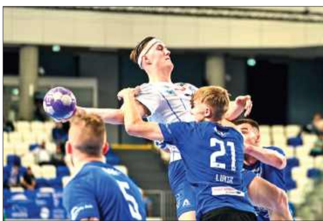
Mocna obrona i szybkie tempo gry.

Ostatecznie Gwardia Opole wygrała w Mielcu 31:25, wykorzystując doświadczenie i konsekwencję w ataku oraz twardą grę w obronie.