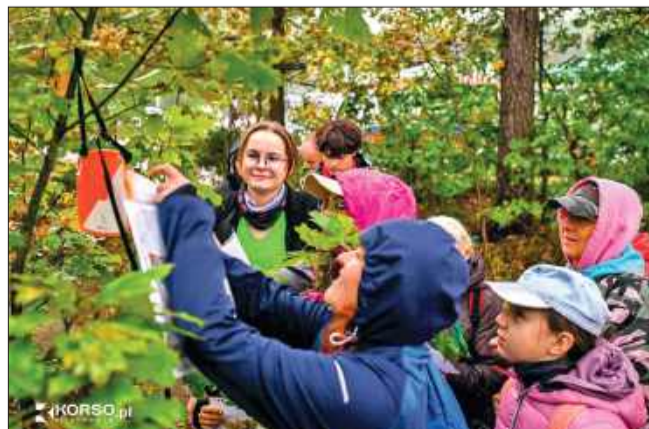
Drużyny wyruszają na trasy w kategoriach: rodzinnej, sportowej i rowerowej.