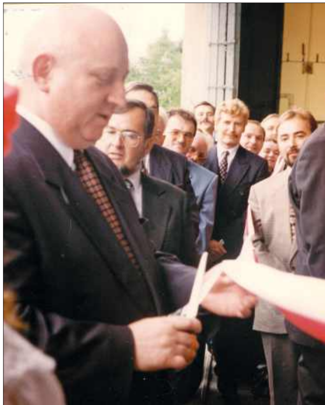
Premier Józef Oleksy otwierający symbolicznie pierwszą polską specjalną strefę ekonomiczną w Mielcu.