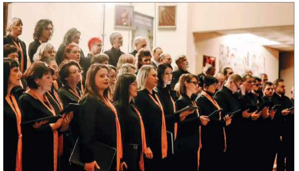
W wykonaniu „Missa Pro Pace” udział wzięły trzy znakomite podkarpackie chóry.

„Missa Pro Pace op. 45” Feliksa Nowowiejskiego – jedno z najbardziej znanych spośród