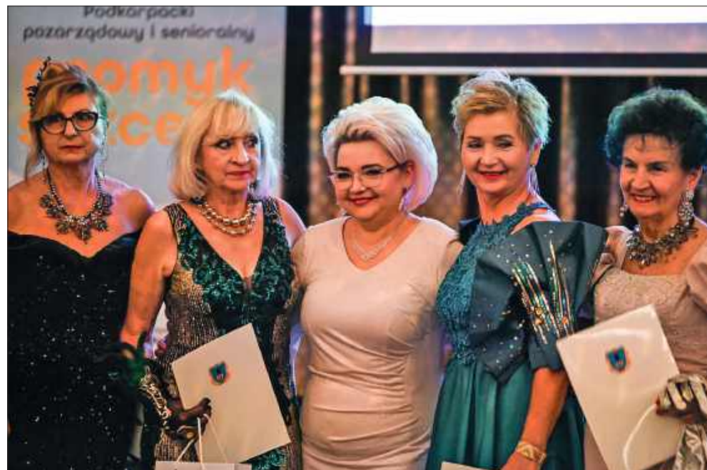
Wieczór uświetnił występ kobiet z Grupy Modowej W&Modowe Szaleństwo.