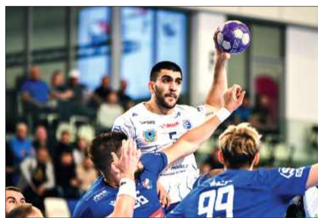
Twarda walka o piłkę.