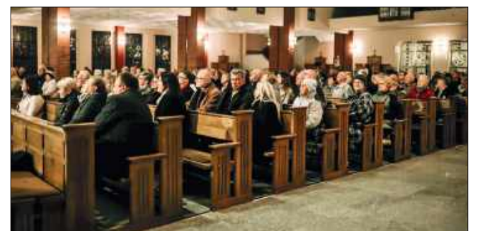
Publiczność zgromadzona w kościele słuchała w zachwycie.