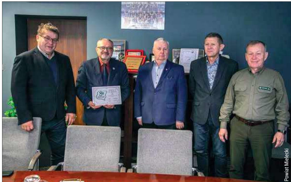
Uroczyste wręczenie tytułu odbyło się z udziałem przedstawicieli władz samorządowych powiatu mieleckiego.