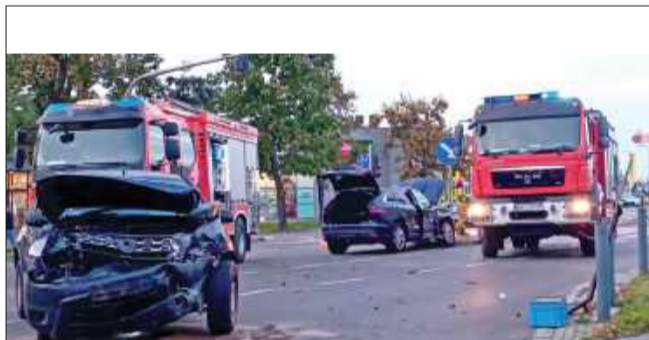
Wypadek na ul. Niepodległości.