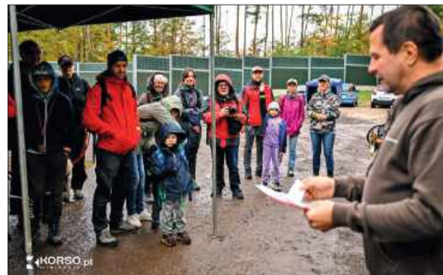
Uczestnicy 12. Mieleckiego Zielonego Punktu Kontrolnego tuż przed startem przy „Lesiówce”.