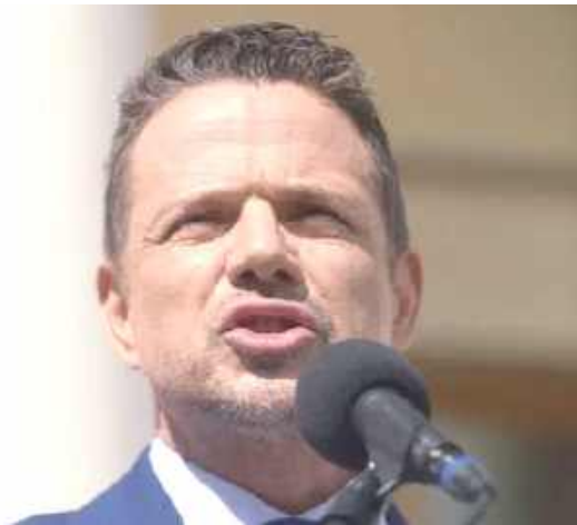
Rafał Trzaskowski zdobył 49,11 proc. poparcia (10 237 177 głosów)

Frekwencja w niedzielnych wyborach wyniosła 71,63 proc. i była rekordowa, jeżeli chodzi o wybory prezydenckie w Polsce. To więcej niż w dotychczas