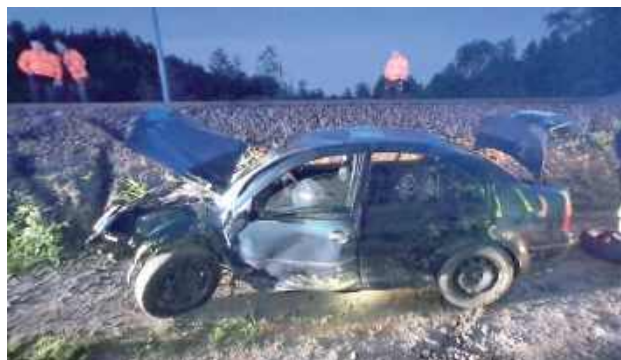
Mieszkaniec powiatu ryckiego został ukarany mandatem karnym w wysokości 5000 zł i 8 punktów karnych za spowodowanie zagrożenia bezpieczeństwa

POWIAT RYCKI: Niebezpieczny widok w Nadwiślanie. 21-latek swoim Volkswagenem wjechał w nasyp kolejowy i zawisł na torach, co mogło doprowadzić do tragedii. Pociągi zostały wstrzymane, a służby działały sprawnie, by usunąć zagrożenie.