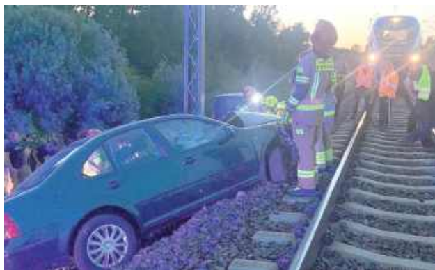
Volkswagenem jechał drogą szutrową i nie dostosował prędkości do warunków ruchu, po czym stracił panowanie nad samochodem