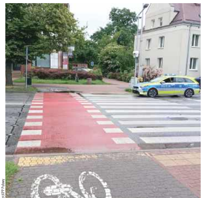
To właśnie na tym przejściu doszło do potrącenia rowerzystki

Do zdarzenia doszło przy ul. Wojska Polskiego. Mieszkaneczka Puław pokonywała ulicę, przejeżdżając po przejeździe rowerowym, gdy uderzyło w nią osobowe Renault. Kobieta upadła na ziemię, ale kierująca samochodem, zamiast zatrzymać się, pojechała dalej. Dzięki świadkom udało się ustalić pojazd, który uczestniczył w kolizji. - Okazało się, że kierowała nim 76-letnia mieszkanka gminy Końskowola. Wyjaśnienia kierującej samochodem odbiegały od wcześniejszych ustaleń, jednakże uszkodzenia samochodu wskazywały na to, że faktycznie doszło do potrącenia rowerzystki - informuje