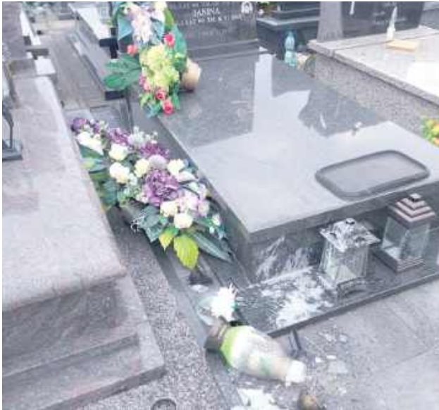
Na pierwszy rzut oka widać, że takich zniszczeń nie zrobiły warunki atmosferyczne