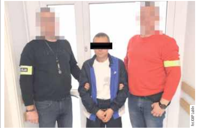
Policjanci typują go do innych przestępstw z terenu miasta

Lublin: 43-latek został tymczasowo aresztowany za rozbój w warunkach recydywy. Wszedł za 84-latką do mieszkania, następnie zaatakował ją i wyrwał torebkę z zawartością dokumentów, telefonu oraz pieniędzy.