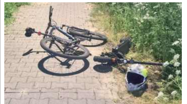
W wyniku zderzenia się kierowcami obaj kierujący upadli

Ryki: 18-latek jadący hulajnogą elektryczną zderzył się z 19-letnim rowerzystą. Trafili do szpitala.