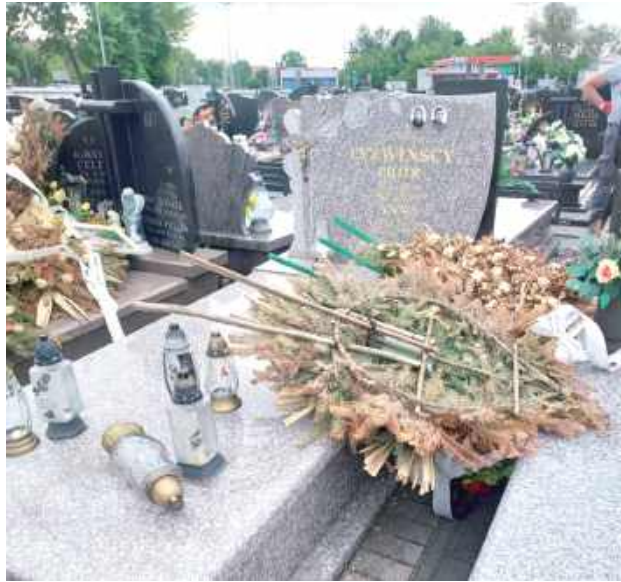
Co musiało się zdarzyć w głowie człowieka lub kilka osób, by przyjść na cmentarz i dokonać aktu wandalizmu - pyta mieszkanka Dęblina

W minionym tygodniu doszło do trudnych do wytłumaczenia scen na cmentarzu komunalnym w Dęblinie. O sprawie poinformowali nas czytelnicy.