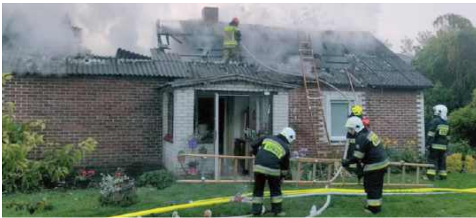
Strażacy musieli rozebrać dach budynku