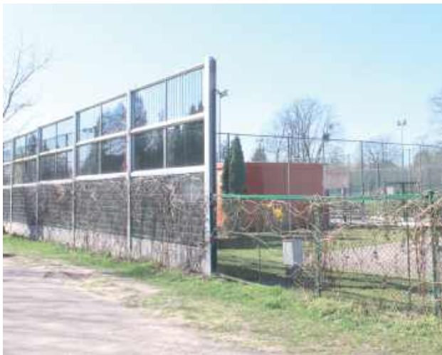
Zgodnie z decyzją sądu ekrany akustyczne zostają na swoim miejscu, bo stoją tu legalnie

Naczelny Sąd Administracyjny uznał, że ekrany akustyczne ustawione przez miasto przy boisku z zakazem użytkowania stoją legalnie. Puławy od kilku lat walczą o możliwość pełnego korzystania z „Orlika”, który zdaniem mieszkańców obok małżeństwa emituje zbyt dużo światła i hałasu.