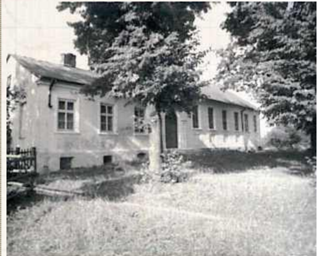
Budynek, który w Cycowie dla społeczności luteranckiej stanowił nigdy szkołę, kaplicę i mieszkanie kantora. Obecnie w rękach samorządu, nieużywany Zdjęcie z dokumentacji konserwatorskiej tzw. „karty białej” z roku 1985