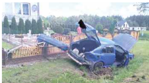
19-latek został ukarany mandatem karnym w wysokości 1100 zł

- Kierujący pojazdem 19-letni mieszkaniec gminy Opole Lubelskie nie dostosował prędkości i techniki jazdy, przez co