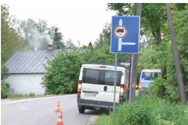
Rowerzysta jechał lewą zamiast prawą stroną jezdni, a gdy zobaczył za zakrętem jadący samochód, gwałtownie skręcił na środek jezdni, doprowadzając do zderzenia z autem

Z obrażeniami ciała do szpitala trafił mieszkaniec powiatu puławskiego, który będąc w stanie nietrzeźwości, doprowadził do zderzenia z dostawczym Peugeotem, a następnie chciał uciec z miejsca zdarzenia. Przyczyna wyszła na jaw, gdy w ruch poszedł alkomat.