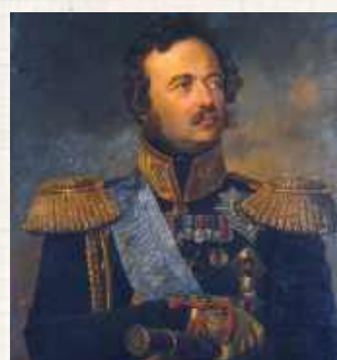
Iwan Paskiewicz z przydomkiem Erywański (1782 - 1856) był jednym z najlepszych rosyjskich dowódców, który wstawił się w wojnie z Turcją (1806-12), w wojnach napoleońskich, na Kaukazie i z Turkami. Dowodził armią rosyjską tłumiając powstanie listopadowe. Wykazał się wtedy także okrucieństwem. Jako namiestnik cesarski z wielką zjadłością tłumiał wszelkie przejawy polskiego życia narodowego, w związku z czym okres jego rządów przeszedł do historii jako „noc paskiewiczowska”

Dobra dęblińska jako część majątku odebranego Czartoryskim podarowane zostały za zasługi m.in. przy tłumieniu powstania listopadowego Iwanowi Paskiewiczowi i jego rodzinie.