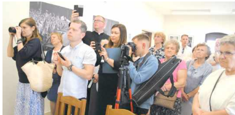
Publiczność na otwarciu wystawy

„Kalwaria” oraz „Droga świętości”. Pierwsza z nich ukazuje Kalwarię Zebrzydowską - miejsce, do którego Bujak wie-