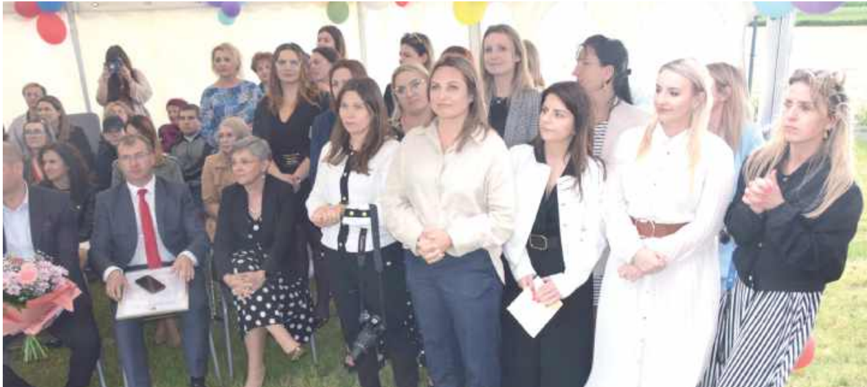
20-lecie działalności świętowano w ubiegły czwartek w Witaniowie