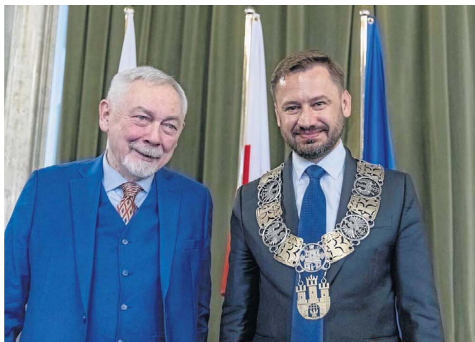
Jacek Majchrowski i Aleksander Miszalski rządzą już Krakowem. Kto następny?

2. Może się więc okazać, że zadeklarowanych kandydatów już niedługo będziemy mieli nawet 20, ale... nie wiadomo czy do przyspieszonych wyborów w ogóle dojdzie! 2 czerwca 2026 minął termin na złożenie protestów wyborczych przeciw ważności referendum. Komisarz Wyborczy w Krakowie otrzymał z Sądu Okręgowego informację o trzech złożonych protestach. Dopiero jak zostaną rozpatrzone, to zostanie wyznaczona data wyborów. A co, jeśli sąd uzna, że protesty były słuszne i masowo łamano ciszę wyborczą? - Różnica w głosowaniu to około 3 proc. Jeżeli sąd uzna, że działania przeciwników Miszalskiego i inicjatorów referendum miały duży wpływ na wynik głosowania, referendum może zostać uznane za nieważne, bo było to działanie podczas ciszy wyborczej. Wtedy Aleksander Miszalski może wrócić do urzędu - mó-