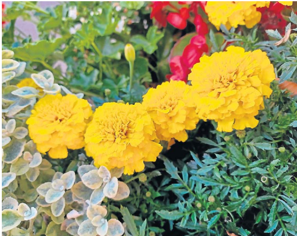
Polecamy kwiaty na słoneczny balkon, które udadzą się każdemu!

Begonia stale kwitnąca - kwitnie praktycznie przez cały sezon - od wiosny aż do jesiennych chłódów. Można wybierać spośród odmian o białych, różowych lub czerwonych kwiatach.