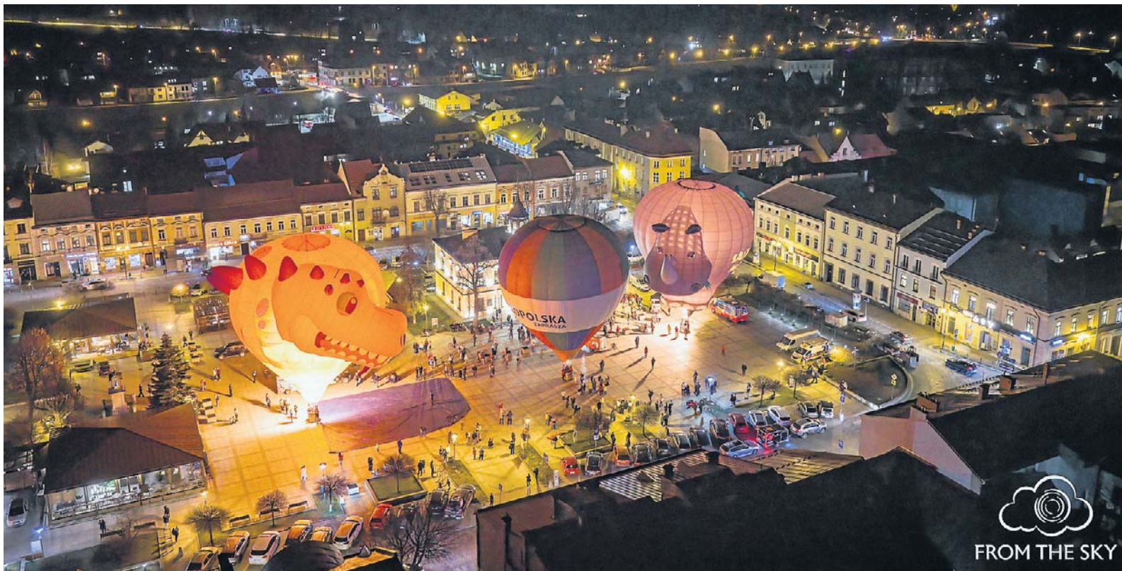
Tak było na Podhalu, tak będzie również na Sądecczyźnie

Odlotowa Małopolska to oczywiście cudownie barwna balonowa fiesta, zawody, adrenalina, ale też zachwycające widoki. Oprócz malowniczych - porannych i wieczornych - startów, odbędzie się również specjalna Wieczorna Gala Balonów