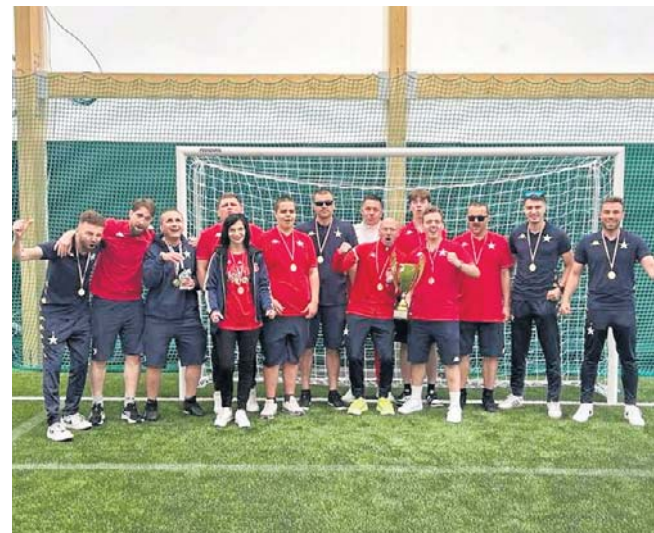
Dla Wisły Kraków Blind Football wywalczony w Bielsku-Białej tytuł mistrza Polski był już trzecim w historii

W tym roku nie jest to ostatnie trofeum, jakie chcą zdobyć wiślacy. W październiku powalczą o obronę Pucharu Polski. W zeszłym sezonie zdobyli dublet i teraz chcą to powtórzyć. ©