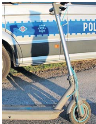
Sprawa może zakończyć się pouczeniem lub nawet skierowaniem do Sądu Rodzinnego i Nieletnich

cych na hulajnogach bez kasków. Dwójka z nich poruszała się jednym pojazdem, co też jest zabronione.