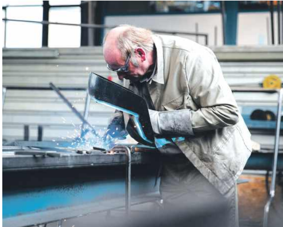
Dorabiający emeryci i renciści nie należą do rzadkości