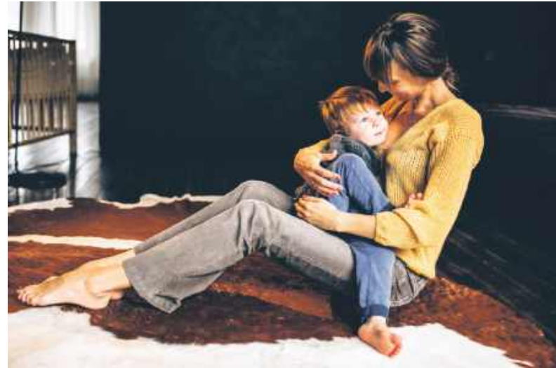
Tyn synecek siedzi sie u mamy na klinie

We sklepie downi, bo dzisioj już ponoć nyy, ludzie kupowali towor na kryska, abo na borg, czyli na kredyt. Idzie tyz kupować na heft, a więc na zeszyt, ale żodnymu tego nyy życa, bo życanie nyy ma dobre (jakby fto sie pytoł: życa