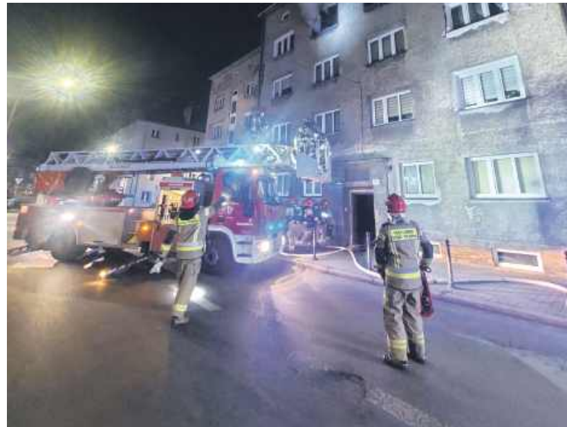
Dym wydobywał się z okien na trzecim piętrze

Równocześnie z akcją gaśniczą sprawdzono pozostałe mieszkania w budynku. Nie stwierdzono jednak zadymienia, a stężenia szkodliwych sub-