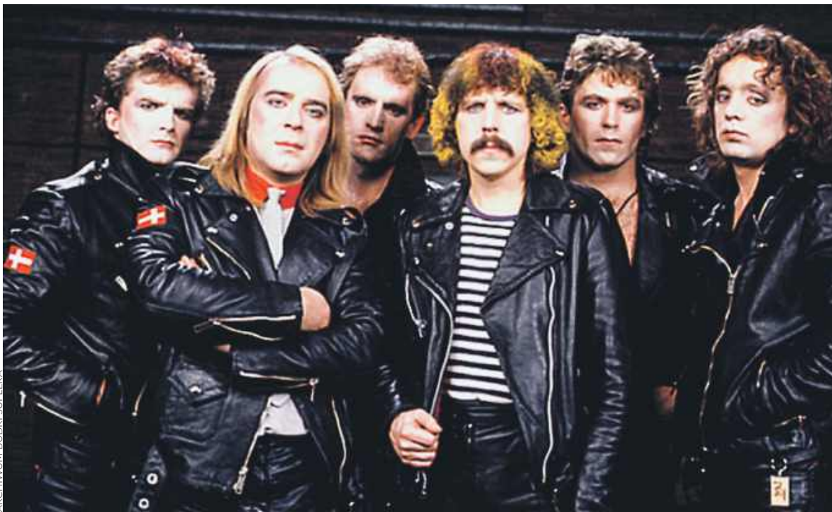
Budka Suflera na początku lat osiemdziesiątych. Pierwszy z lewej Felicjan Andrzejczak, który wykonywał utwór „Jolka, Jolka pamiętasz”

BYTOM. „JOLKA, JOLKA PAMIĘTASZ LATO ZE SNU, GDY PISAŁAŚ: TAK MI ŻŁE” - TAK ZACZYNA SIĘ JEDEN Z DZIESIĘCIU BEZ WĄTPIENIA NAJWIĘKSZYCH HITÓW POLSKIEGO ROCKA LAT OSIEMDZIESIĄTYCH I W OGÓLE JEDNA Z NASZYCH NAJPOPULARNIEJSZYCH, CZĘSTO ŚPIEWANYCH CHOĆBY PRZY OGNISKU I NA IMPREZACH ORAZ KARAOKE PIOSENEK. OKAZUJE SIĘ, ŻE JEJ MELODIA ZOSTAŁA SKOMPONOWANA W BYTOMIU.