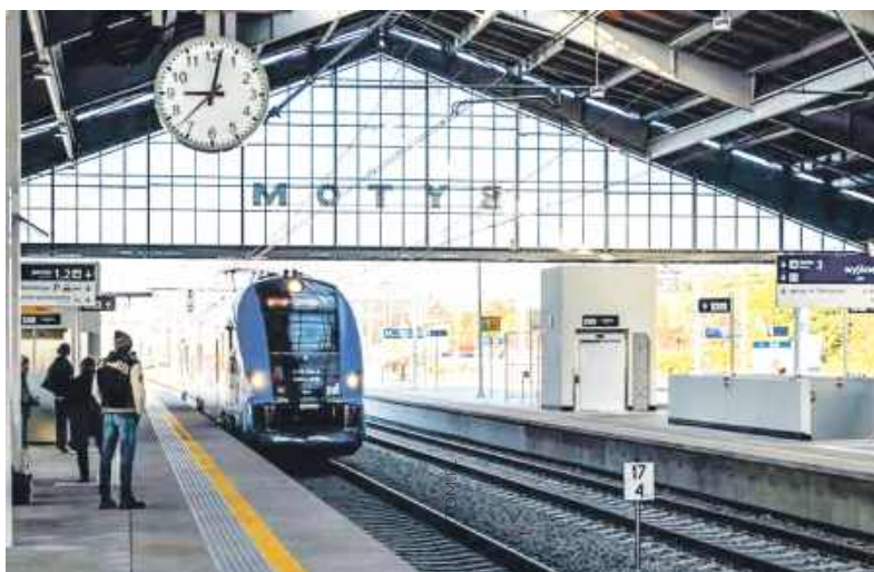
Wsiadamy do pociągu i jedziemy na lotnisko

Od 10 marca bezpośrednio dojedziemy pociągami z Bytomia na lotnisko w Pyrzowicach. Połączenie jest pilotażowe, a zawdzięczamy je... utrudnieniom spowodowanym remontami na torach.