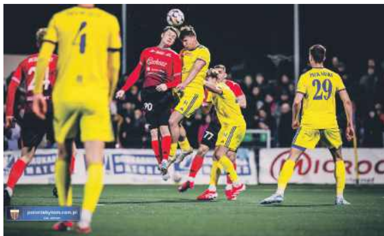
Piłkarze bytomskiej Polonii po raz trzeci w sezonie podzielili się punktami z rywalem

Nasze zespoły z niższych lig w Dniu Kobiet zgodnie zafundowały atrakcyjne niespodzianki swoim fankom (zakładamy, że takowe posiadają) i zgodnie wygrały. Czwartoligowy radzionkowski Ruch w derbach powiatu tarnogórskiego zmierzył się u siebie z Gwarkiem. Kibice obejrzeni ciekawe, pełne emocji widowisko, które skończyło się wyni-