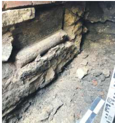
Odsłonięte podczas prac mury świątyni z XV wieku

Zlecono jej poza tym konserwację i naprawę okien oraz drzwi. Te największe, zewnętrzne, usytuowane od strony placu Klasztornego już są po rewitalizacji, ale będą zasłonięte na dalszą część robót. Ekipa remontowa działa także wewnątrz budowli, zajmując się chociażby posadzkami, ścianami, a w przyszłości montażem monitoringu.