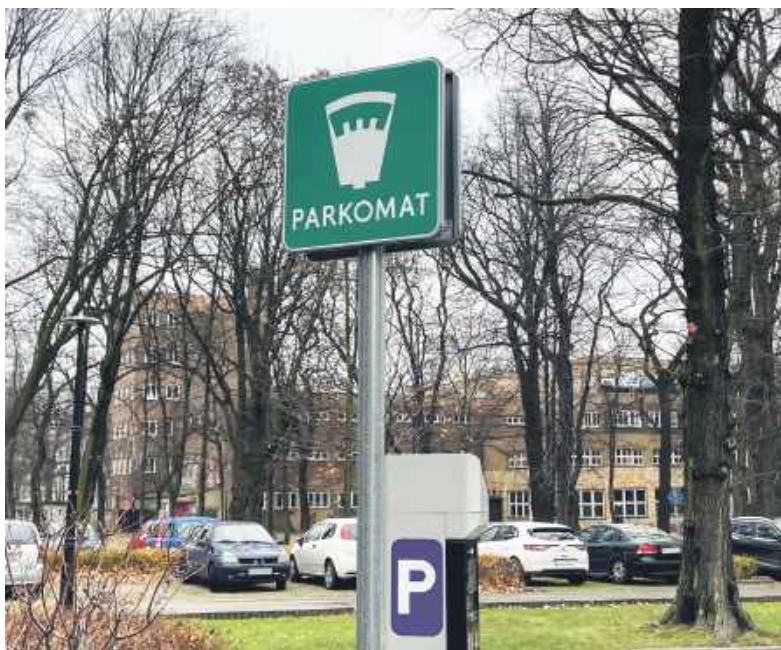
Parkomaty miały usprawnić parkowanie w mieście

Z opłat w Strefie Płatnego Parkowania zwolnione są pojazdy uprzywilejowane, czyli m.in. karetki czy radiowozy a także zarząd dróg, wojsko oraz auta elektryczne. Nie muszą też płacić kierowcy autobusów, dowożących uczniów do szkół oraz motocykli.