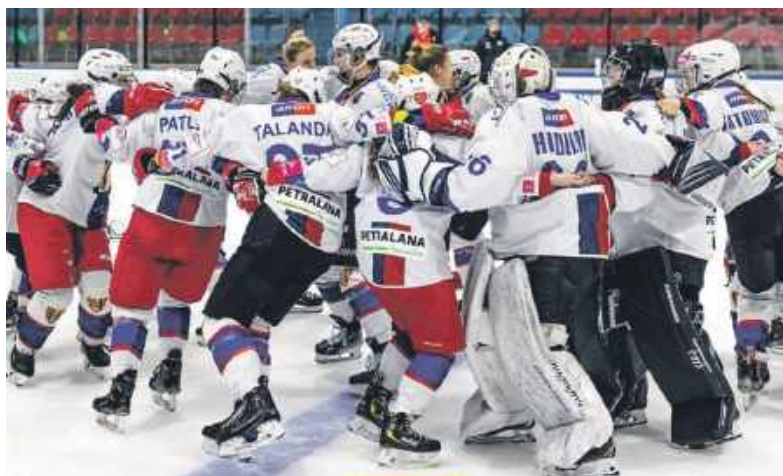
Tak się to wszystko znowu skończy? Oczywiście. Innego scenariusza nie przewidujemy!

O znużeniu seryjnymi triumfami, wypaleniu, czy braku motywacji do tego, by po raz kolejny zrobić to samo nie ma najmniejszej mowy. - Dziewczyny są maksymalnie nakręcone i każda z nich bardzo chce pokonać Kojotki, by ponownie wnieść puchar