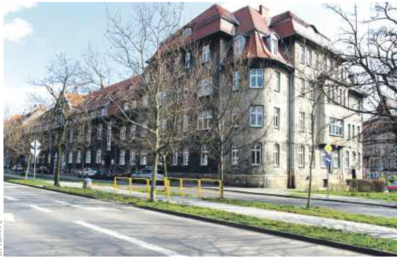
Przyszpitalny ZOL zmieni się w nowoczesną placówkę

ŚRÓDMIEŚCIE. ZAPEWNIAJĄCY OPIEKĘ SCHOROWANYM, STARSZYM OSOBOM ZAKŁAD OPIEKUŃCZO-LECZNICZY PRZY ALEI LEGIONÓW ZOSTANIE GRUNTOWNIE ZMODERNIZOWANY. WALNIE PRZYCZYNI SIĘ DO TEGO WYNOŚĄCA 14 MILIONÓW ZŁOTYCH DOTACJA UNIJNA JAKĄ POZYSKAŁ ZARZĄDZAJĄCY PLACÓWKĄ SZPITAL SPECJALISTYCZNY NR 1.