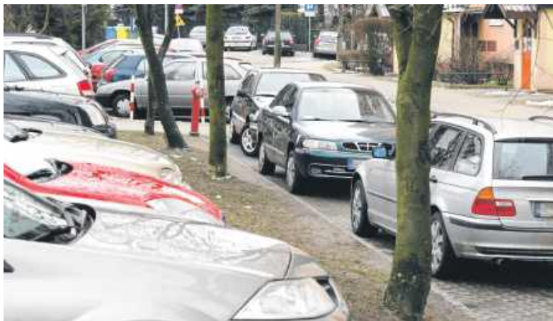
Niezależnie od tego, że opłaty za postój są wysokie, to znalezienie wolnego miejsca parkingowego jest bardzo trudne

W Bytomiu pod tym względem jest lepiej, bo płacimy tylko w dni robocze (z wyłączeniem 24 grudnia oraz 31 grudnia) w godzinach od 9 do 17, z wyjątkiem parkingu pod Urzędem Miejskim w Bytomiu, gdzie postój jest płatny w poniedziałek w godzinach od 8 do 17.30 oraz od wtorku do piątku, w godzinach od 8 do 15.