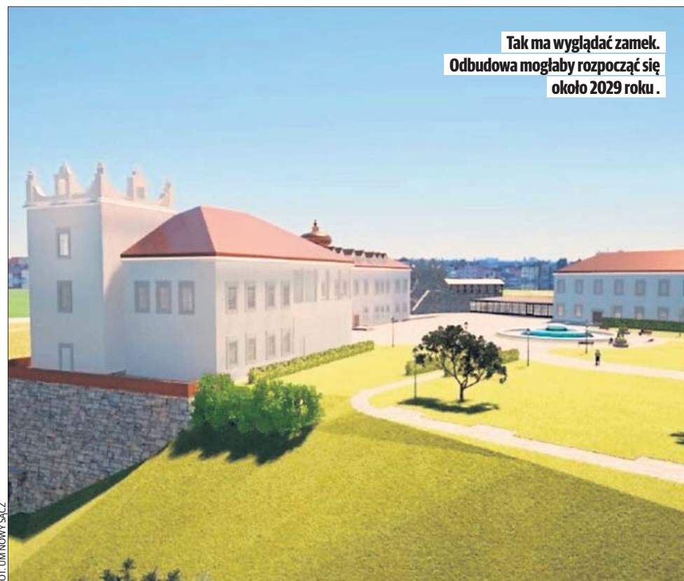
Tak ma wyglądać zamek. Odbudowa mogłaby rozpocząć się około 2029 roku.

Tematem odbudowy zamku od lat zajmuje się Sądecka Agencja Rozwoju Regionalnego. Kilka lat temu zaprezentowano odważną, nowoczesną koncepcję odbudowy obiektu. Projekt jednak nie spotkał się z aprobatą mieszkańców. Podczas konsultacji dominowały głosy, że sądeczanie oczekują bardziej tradycyjnej formy odbudowy. Wykryształizowała się więc wizja klasycznej rekonstrukcji zamku.