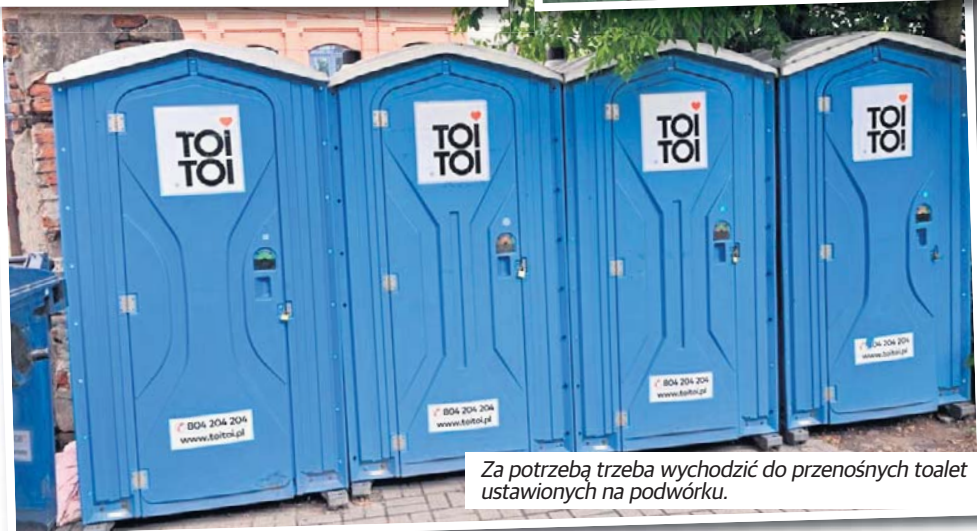
Za potrzebą trzeba wychodzić do przenośnych toalet ustawionych na podwórku.