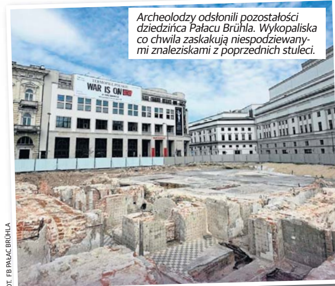
Archeolodzy odsłoniли pozostałości dziedzińca Pałacu Brühla. Wykopiska co chwila zaskakują niespodziewanymi znaleziskami z poprzednich stuleci.

W ramach prac archeologicznych na terenie Pałacu odsłonięto także fragment murów będących częścią przedwojennego ogrodu Ministerstwa Spraw Za-