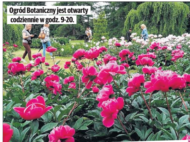
Ogród Botaniczny jest otwarty codziennie w godz. 9-20.