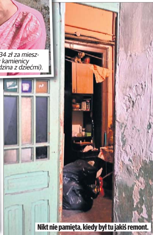
Nikt nie pamięta, kiedy był tu jakiś remont.