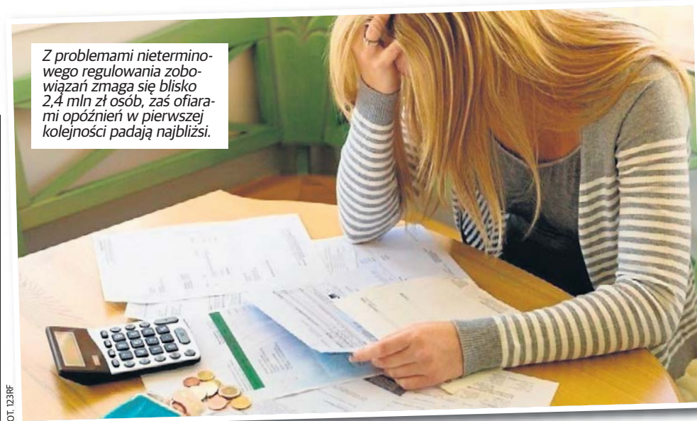
Z problemami nieterminowego regulowania zobowiązań zmagają się blisko 2,4 mln zł osób, zaś ofiarami opóźnień w pierwszej kolejności padają najbliżsi.

Statystyczny Polak ma obecnie do spłaty średnio 34 tys. zł.