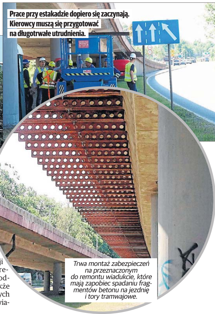
Prace przy estakadzie dopiero się zaczynają. Kierowcy muszą się przygotować na długotrwałe utrudnienia.

Przewidziano dokładnie 47 zadań do wykonania w ramach tej inwestycji - m.in.: wzmocnienia i remonty filarów i przęseł, odwodnienia, dylatacji a także odnowienie antykorozyjnych zabezpieczeń konstrukcji wiaduktu.