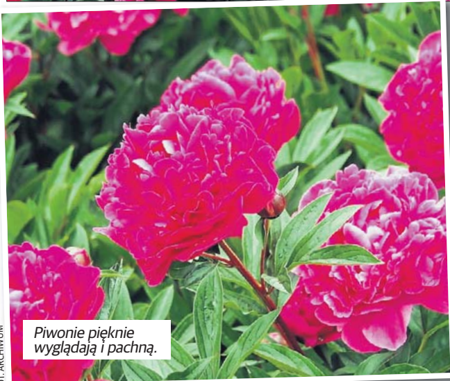
Piwonie pięknie wyglądają i pachną.