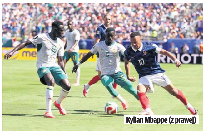
Kylian Mbappe (z prawej)