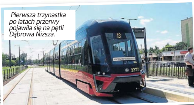
Pierwsza trzynastka po latach przerwy pojawiła się na pętli Dąbrowa Niższa.

W związku z tym Zarząd Dróg i Transportu zaproponował, aby „13” skierować ulicami: Niższą, al. Śmigłego-Rydza, Piłsudskiego, Kościuszki, Zachodnią, Limanowskiego i Aleksandrowską na krańcówkę Teofilów.