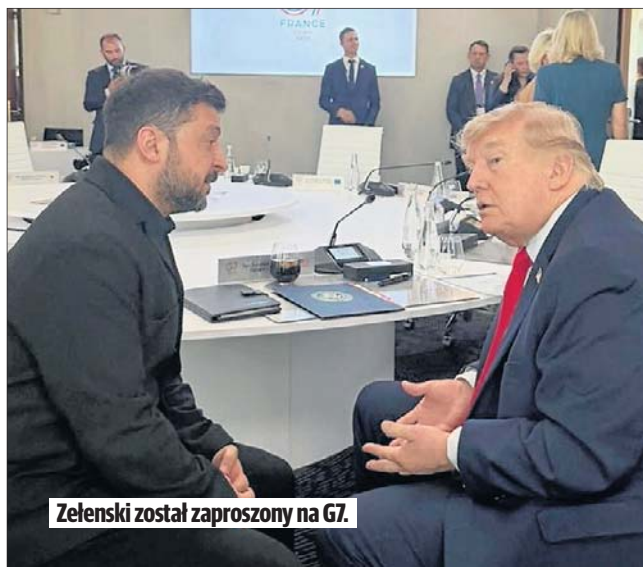
Zełenski został zaproszony na G7.

Przywódcy państw G7 oznajmili w środę rano, że są zjednoczeni we wsparciu dla Ukrainy, jej integralności terytorialnej i zgodzili się na zwiększenie presji na gospodarkę rosyjską. Liderzy największych światowych gospodarek przyjęli oświadczenie w tej sprawie podczas szczytu we francuskim Evian-les-Bains. Przywódcy G7 uznali, że Ukraina osiągnęła postęp na polu walki w ostatnich miesiącach i że istnieje obecnie „nowy impet” w wojnie obronnej z Rosją. Oświadczyli, że w celu jego wspierania i przyspieszenia zgadzają się na zwiększenie dostaw środków obrony powietrznej.