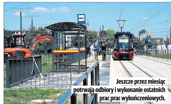
Jeszcze przez miesiąc potrwają odbiory i wykonanie ostatnich prac wykończeniowych.