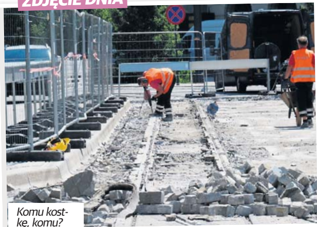
Komu kosztę, komu?