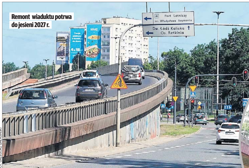
Remont wiaduktu potrwa do jesieni 2027 r.

Prace potrwają przez około dwa tygodnie, a zaraz po ich zakończeniu nastąpi zamknięcie zachodniej części wiaduktu. Ruch będzie odbywał się po