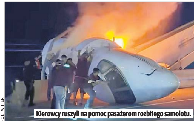
Kierowcy ruszyli na pomoc pasażerom rozbitego samolotu.

- Wyrażam wdzięczność krajom, które zaangażowały się, by ułatwić spotkanie i umożliwić to porozumienie - powiedział papież.