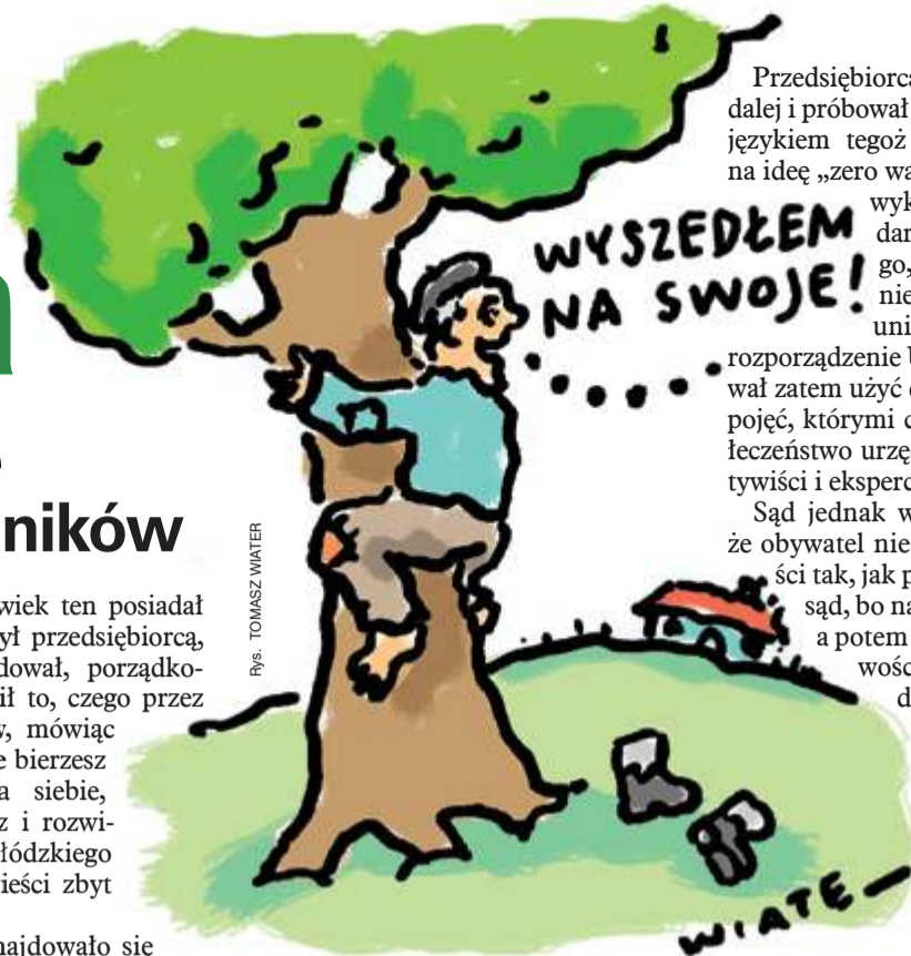
Rys. TOMASZ WINTER

To jednak nie wszystko, bo podczas kontroli urzędnicy znaleźli również betonowe podkłady kolejowe. Zostały