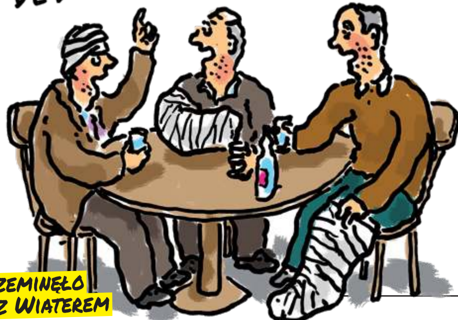
Fryz. TOMASZ WIATER