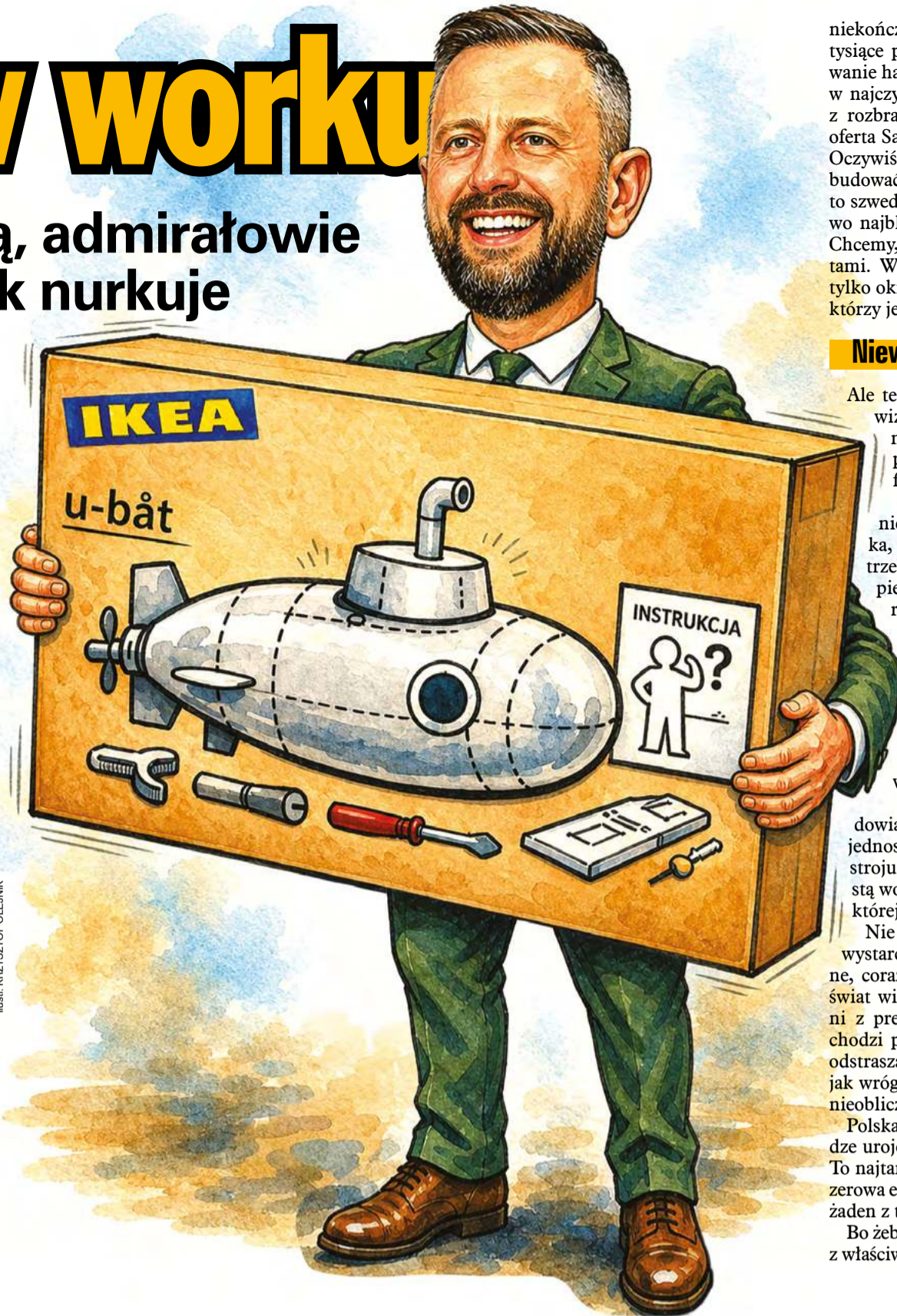
ILUSTRACJA: KRZYSZTOF OLEJNIK

W efekcie okręt, który dekadę temu miał być bliską przyszłością, stał się przyszłością mglistą.