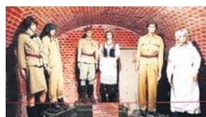
Kostiumy z serialu „4 pancerni i pies”