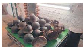
Historyczne hełmy z lat 1914-1945