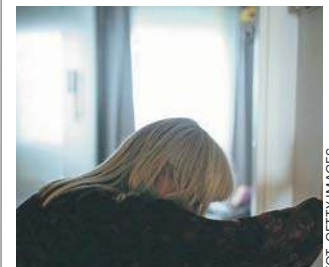
Objawy zawału są różne w zależności od płci

Zawał może manifestować się też uczuciem zmęczenia, nudnościami, a nawet objawami przypominającymi niestrawność lub zgagę. U niektórych pacjentek występuje także ból żuchwy. Jednym z najbardziej zbagatelizowanych objawów są też uderzenia gorąca.