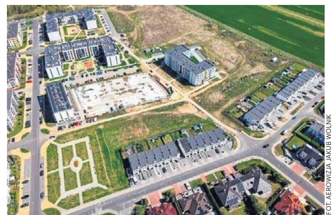
Drogowa inwestycja na Nowym Piastowie w Głogowie. Okolica się rozwija, budowa dróg jest koniecznością.

Nowy Piastów rozwija się, a budowa nowych dróg jest koniecznością. W tej części miasta przybywa domów oraz budynków wielorodzinnych. ©