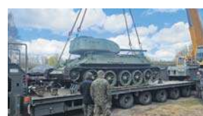
Najnowszy nabytek czołg T-34