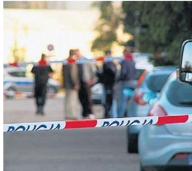
Zwłoki w mieszkaniu na Psim Polu. Sprawę bada wrocławską prokuratura.

Wiadomo jednak, że już w niedzielę (26 kwietnia) z samego rana podejrzany zabrał dzieci i pojechał na komisariat policji. Tam przyznał się do zabójstwa ich matki, a swojej żony.