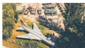
Skansen - widok z góry