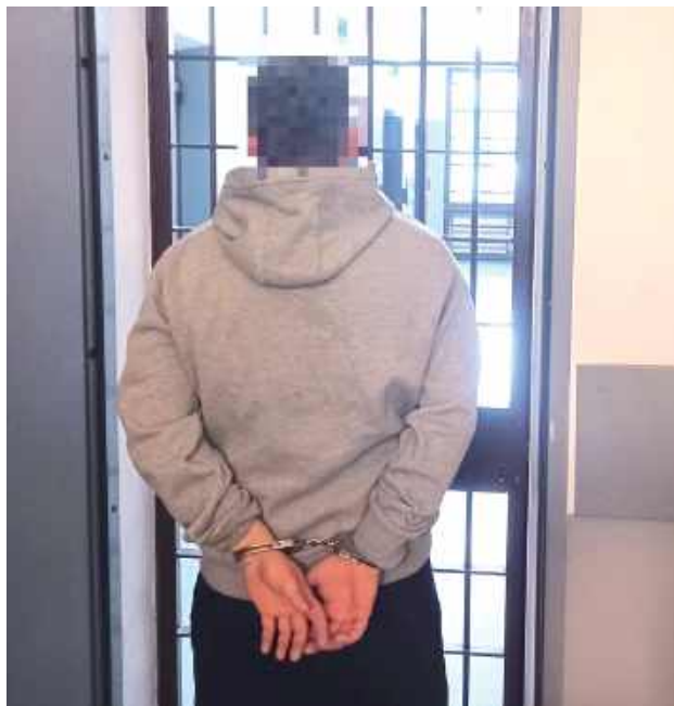
Oskarżony cały czas przebywa w areszcie

Podejrzany oddalił się z miejsca zdarzenia przed przyjazdem patrolu. Policjanci szybko podjęli działania i niedługo później zatrzymali mężczyznę. Podczas przeszukania domu 31-latek funkcjonariusze zabezpieczyli kilkadziesiąt porcji handlowych amfetaminy.