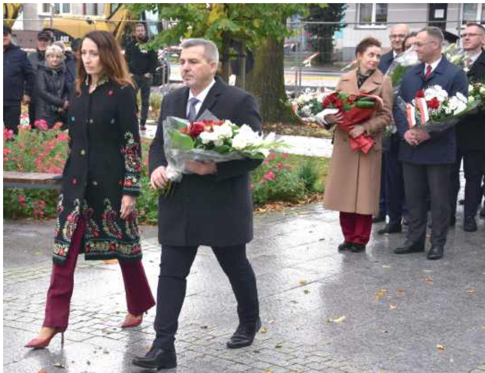
Pod pomnikiem na maciejowskim rynku złożono okolicznościowe wiązanki