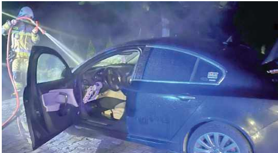
Pożar wybuchł o godzinie 20

Po godz. 20 do Stanowiska Kierowania KP PSP w Garwolinie wpłynęło zgłoszenie o pożarze samochodu osobowego na stacji benzynowej w miejscowości Stary Pilczyn. Działania stra-