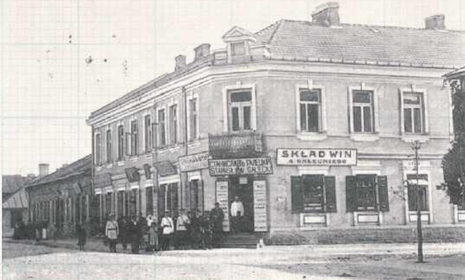
Magistrat miasta Garwolina, a obok skład win Stanisława Gałęckiego (Pocztówka wydana nakładem drukarni Moszka Mokotowa w Garwolinie)

Fragment tekstu: „Szkoda tylko, że za dużo powstaje sklepów spożywczych lub kolonialnych (sklep z artykułami spożywczymi sprowadzanymi spoza Europy – przyp. red.), gdy bardziej potrzebne są sklepy z innymi artykułami codziennej potrzeby, jak: galanteria, norymberszczyzną (drobne przedmioty i galanteria produkowane w niemieckim mieście Norymberga i sprzedawane w Polsce, często przez wędrownych handlarzy – przyp. red.), szkłem i fajansem (przyp. red.