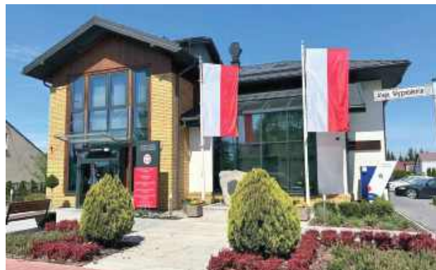
Budynek urzędu zyskał zupełnie nowy wygląd

Powstało także przestronne biuro obsługi mieszkańców, które umożliwia sprawną realizację wielu spraw w komfortowych warunkach.