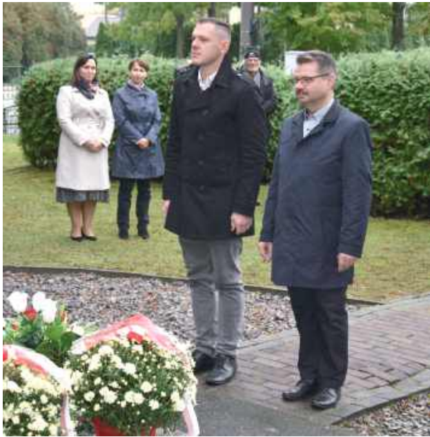
O godzinie 10 nastąpiło złożenie kwiatów pod pomnikiem przywódcy Insurekcji 1794 roku. Hołd naczelnikowi powstania oddali m.in. przedstawiciele Urzędu Miasta i Gminy Maciejowice