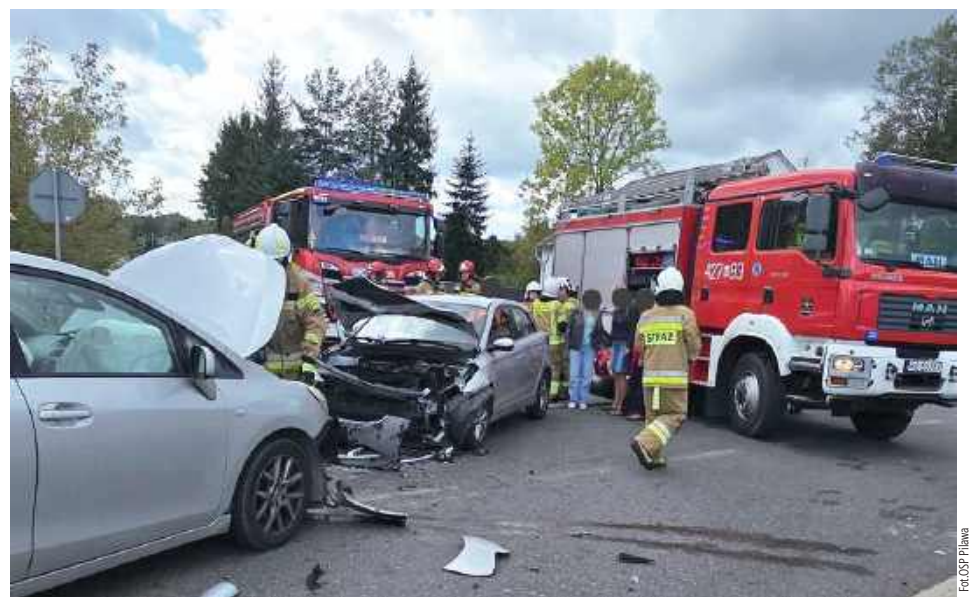
W wypadku uczestniczyły trzy auta

Trzy auta brały udział w zdarzeniu, do którego doszło w niedzielę, 5 października w Puznówce. Kierowca jednego z nich trafił do szpitala.