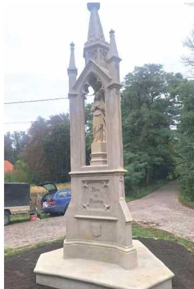
Piękna kapliczka wróciła po roku na swoje miejsce

Zabytkowa kapliczka w Podzamczu odzyskała swój dawny blask