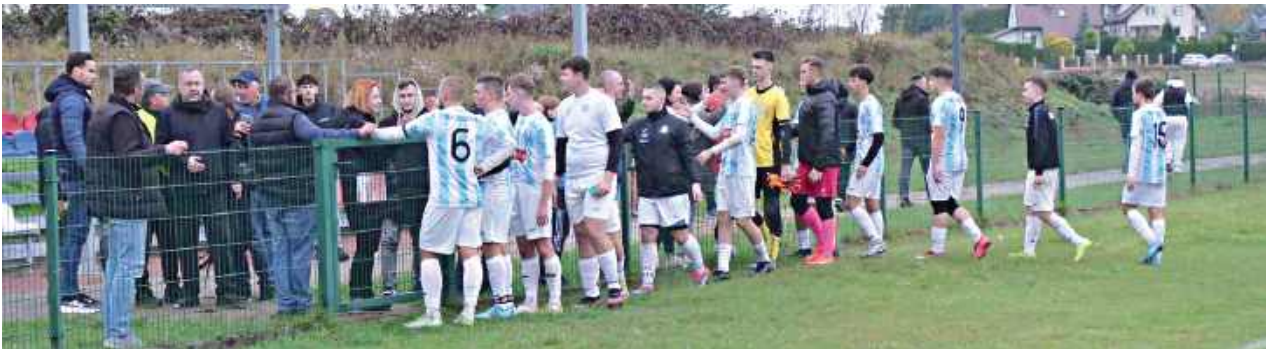
Zespół Sępa nie skorzystał z przewagi liczebnej. ULKS Gołąbek wywiół z Żelechowa komplet punktów pomimo gry jednego mniej przez ponad 45 minut

Sęp Żelechów przez całą drugą połowę grał z przewagą zawodnika w starciu z ULKS Gołąbek. Nie skorzystał z tego i przegrał 1:2.