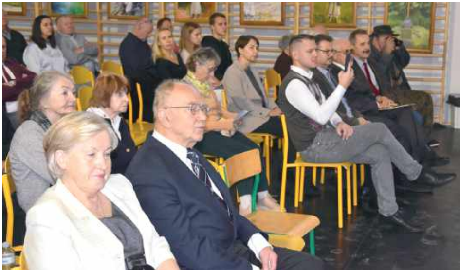
W sobotę, 11 października odbyła się Sesja Plenarna w Maciejowicach, zorganizowana w Szkole im. Tadeusza Kościuszki przy ulicy Tadeusza Kościuszki 19