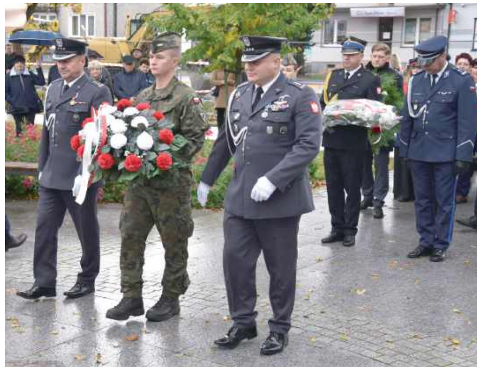
Wiązanki przed pomnikiem naczelnika Insurekcji złożyli także przedstawiciele jednostek wojskowych i innych służb mundurowych