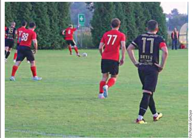
Co za mecz Promnika Gończyce! Zespół z powiatu garwolińskiego w Ostrówku wygrał aż 9:1

Promnik Gończyce podbił Ostrówek. Zespół z powiatu garwolińskiego pozostał u swoich niedawnych rywali wórek z aż dziewięcioma bramkami.