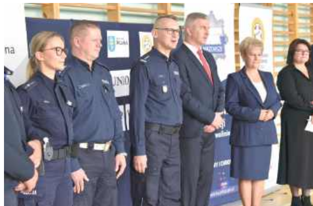
W wydarzeniu uczestniczyli wyjątkowi goście