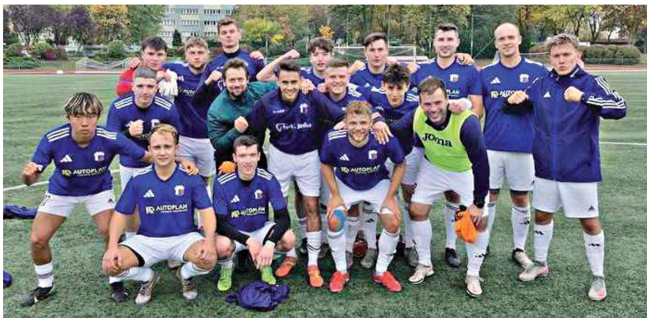
Zawodnicy Promnika odprawili czerwoną latarnię ligi z kwitkiem. Pomimo remisowej pierwszej odsłony z Warszawy wywożą komplet punktów