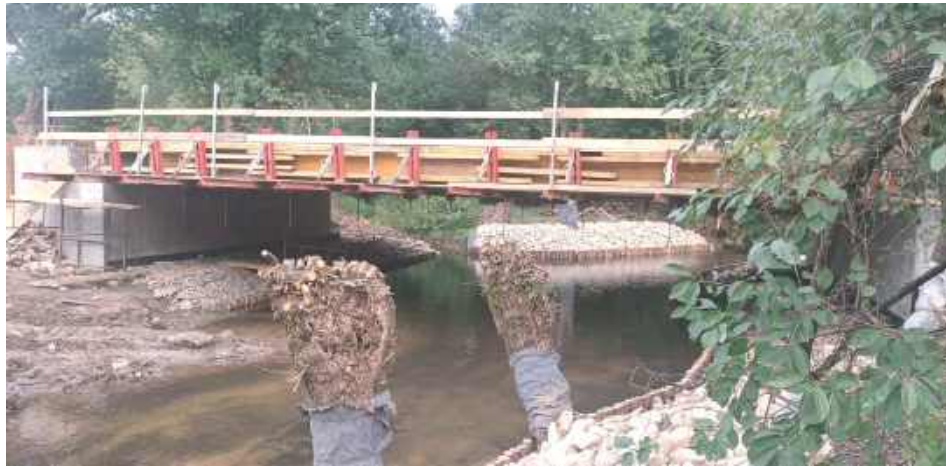
Trwają prace przy budowie nowego mostu

W wyniku przetargu ogłoszonego przez Powiatowy Zarząd Dróg w Garwolinie wybrano ofertę o wartości 2 450 000 zł. Dzięki korzystnemu rozstrzygnięciu i powstałym oszczędnościom powiat garwoliński wystąpił o zgodę na przeznaczenie tych środków na nowe zadanie – wykonanie dróg dojazdowych