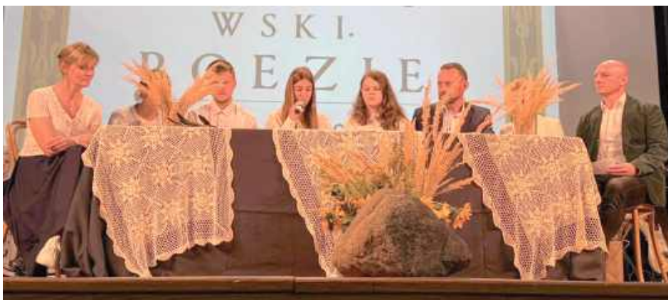
Narodowe Czytanie w Garwolinie to nie tylko święto literatury, ale także okazja do integracji lokalnej społeczności