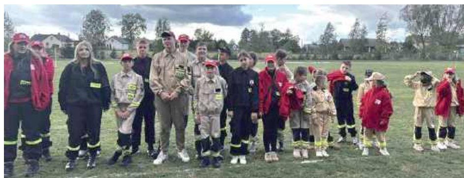
Młodzież rywalizowała w Woli Starogrodzkiej

również do Kobiecej Drużyny Pożarniczej OSP Stodzew, Młodzieżowych Drużyn Pożarniczych (chłopców i dziewcząt) oraz Dziecięcej Drużyny Pożarniczej - Wasz zapal i za-