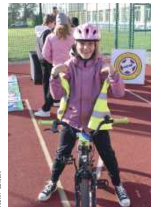
Akcja została zrealizowana we współpracy z dyrekcją Szkoły Podstawowej w Puznówce oraz dzięki wsparciu burmistrza Miasta i Gminy Pilawa i WORD w Siedlcach

Zadowolone twarze dzieci, ich zaangażowanie i entuzjazm to najlepszy dowód na to, że edukacja