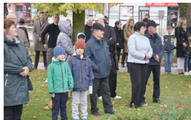
Chociaż pogoda nie dopisała, w uroczystości udział wzięli mieszkańcy Maciejowic i przybyli goście