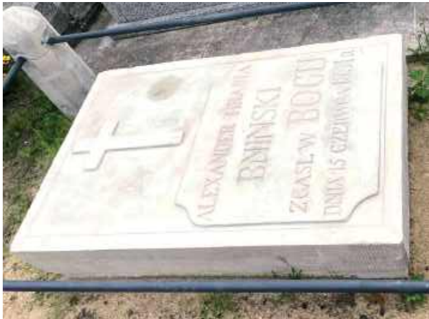
Zabytkowy nagrobek Hrabiego Bnińskiego

Na cmentarzu w Miastkowie Kościelnym zakończono prace przy renowacji zabytkowych nagrobków rodziny Gąssowskich oraz Hrabiego Bnińskiego.