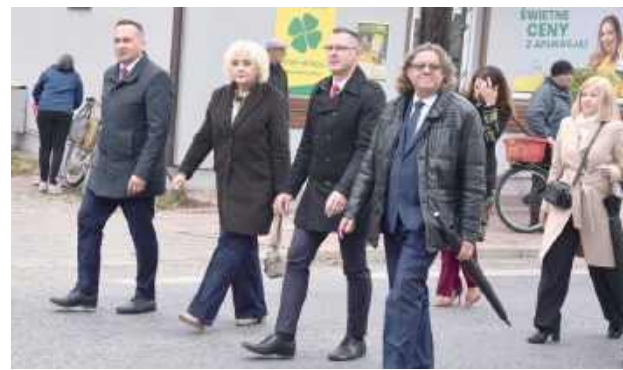
W uroczystym przemaszu spod kościoła parafialnego WNMP na maciejowski rynek udział wzięli przedstawiciele władzy państwowej i samorządowej

O godzinie 12:30 nastąpił przemasz uczestników uroczystości pod pomnik Tadeusza Kościuszki na rynku w Maciejowicach