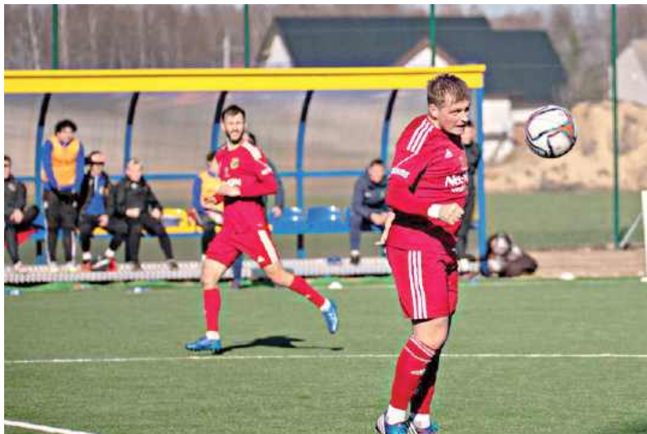
Wilga nie miała szans w domowym meczu z Talentem Warszawa, przegrała aż 2:6