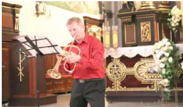
W niedzielę, 5 października w kościele parafialnym zainaugurowany został IV Żelechowski Festiwal Muzyczny „Musica et Sacrum”

Artyści, znani szeroko poza granicami naszego kraju, poprowadzili słuchaczy śladami muzyki różnych epok i stylów. W programie koncertu znalazły się m.in. takie utwory jak: „The Prince of Denmark’s March”