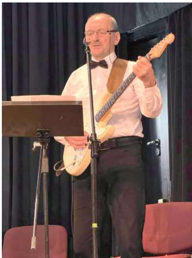
W wydarzeniu uczestniczyli lokalni samorządowcy, nauczyciele, uczniowie oraz mieszkańcy Garwolina

Narodowe Czytanie w Garwolinie to nie tylko święto literatury, ale także okazja do integracji lokalnej społeczności wokół wspólnych wartości i kultury.