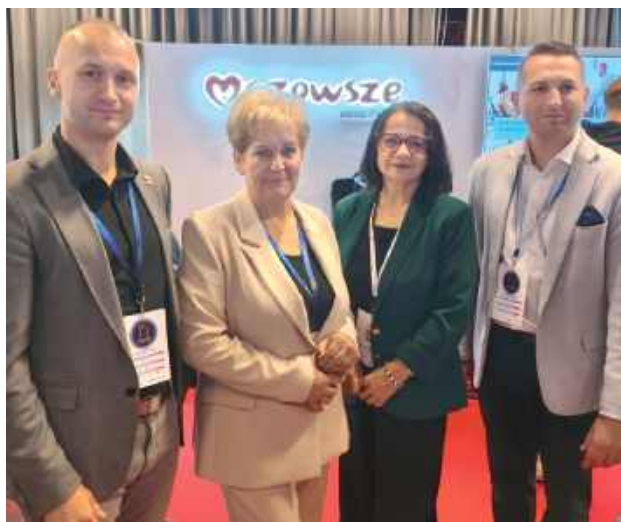
Samorządowcy z powiatu uczestniczyli w ważnej konferencji

W środę (8 października br.) w Centrum Konferencyjnym Legii Warszawa odbył się jubileuszowe, 15. Forum Rozwoju Mazowsza – Forum Funduszy Europejskich. Dyskutowano m.in. o roli europejskich środków finansowych w rozwoju lokalnym, regionalnym i krajowym. W wydaniu wzięli udział samorządowcy z powiatu garwolińskiego.