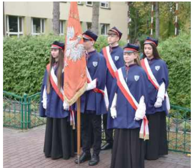
Złożeniu kwiatów pod pomnikiem Tadeusza Kościuszki przy szkole w Maciejowicach towarzyszyli uczniowie z pocztym sztandarowym