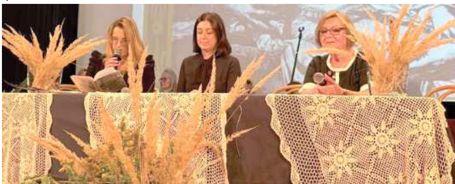
Tegoroczna edycja poświęcona była twórczości Jana Kochanowskiego