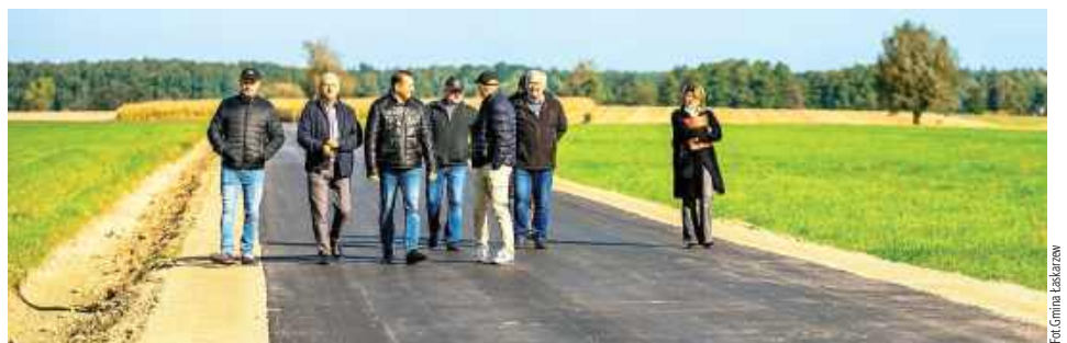
To pierwszy krok w kierunku poprawy połączeń komunikacyjnych między miejscowościami Melanów, Zygmunty i Kacprówek

Trwa przebudowa drogi gminnej w miejscowości Zygmunty na długości 620 mb, na którą gmina Łaskarzew otrzymała dofinansowanie w ramach środków budżetu Województwa Mazowieckiego w zakresie budowy i modernizacji dróg dojazdowych do gruntów rolnych (FOGR).