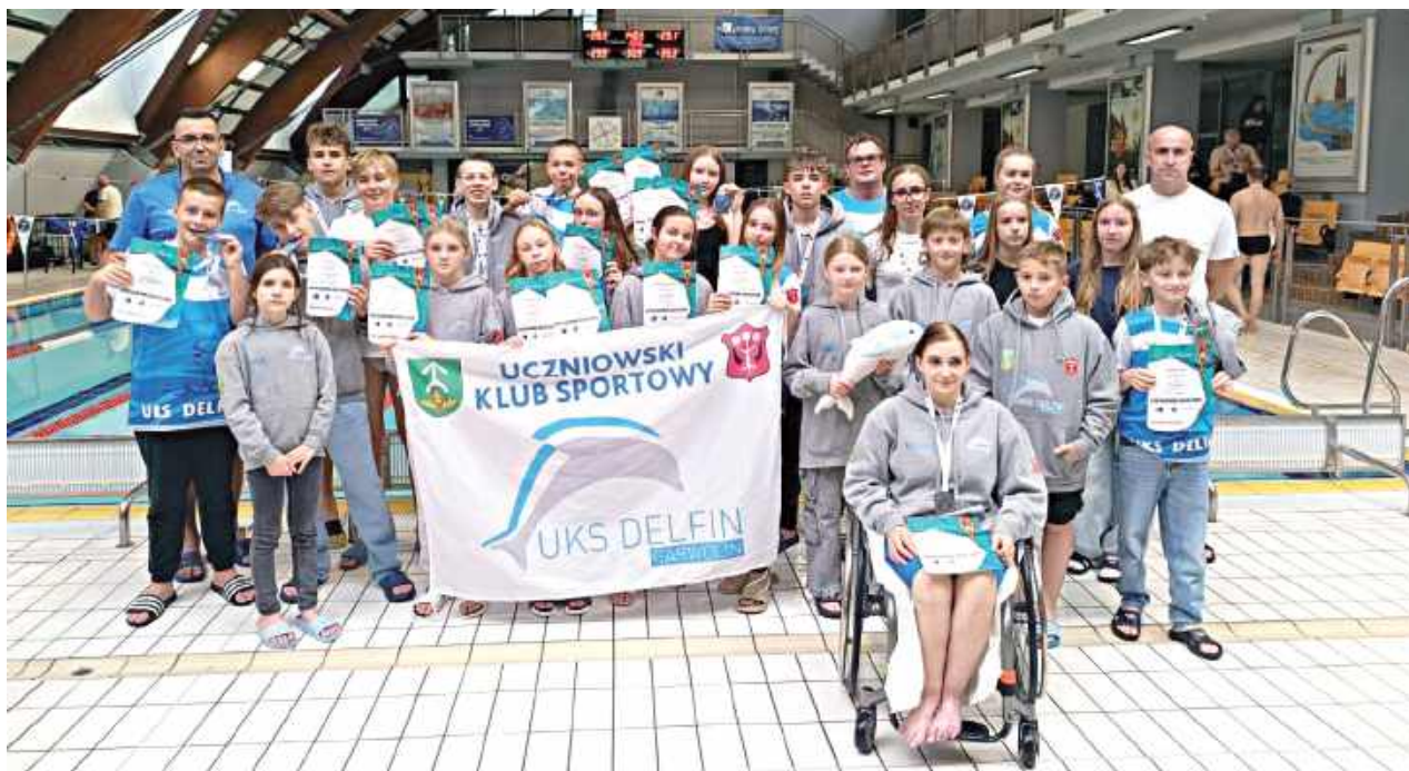
Pamiątkowe zdjęcie naszej ekipy