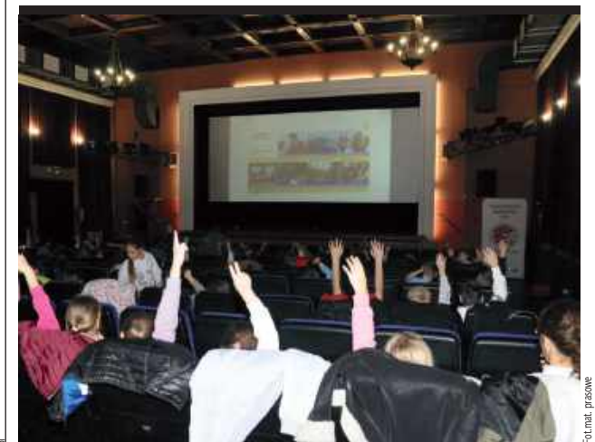
Kino „Wilga” działające w Centrum Sportu i Kultury w Garwolinie ma powody do dumy

Liczba widzów w garwolińskim Kinie „Wilga” wzrosła o ponad 11 tysięcy w porównaniu do poprzedniego roku, co dało mu miejsce wśród 200 miast w Polsce z największą widownią kinową. Z wynikiem 72 754 widzów w roku kino znalazło się w pierwszej setce w kraju. Frekwencja od zeszłego roku także wzrosła rekordowo.