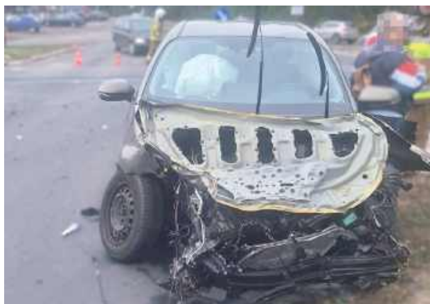
Na szczęście nikt nie odniósł poważnych obrażeń, ale sytuacja była bardzo groźna

W środowe przedpołudnie (9 października) na skrzyżowaniu dróg K76 i DW801 w Wildze doszło do niebezpiecznego zderzenia samochodu osobowego z pojazdem ciężarowym. Na szczęście nikt nie odniósł poważ-