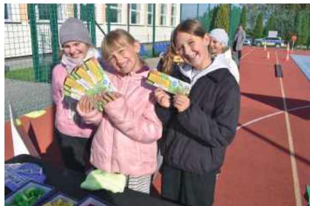
Profilaktyczne gadzety ufundowano z myślą o tym, by każde dziecko mogło zabrać ze sobą nie tylko wiedzę, ale i coś, co przypomni mu o zasadach bezpieczeństwa