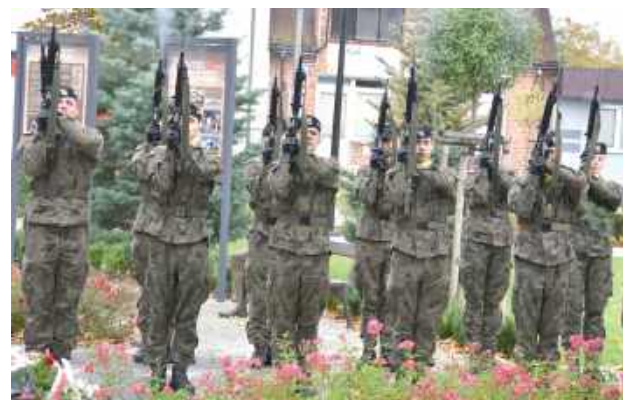
O godzinie 13 miały miejsce Apel Pamięci oraz salwa honorowa (kompania honorowa)