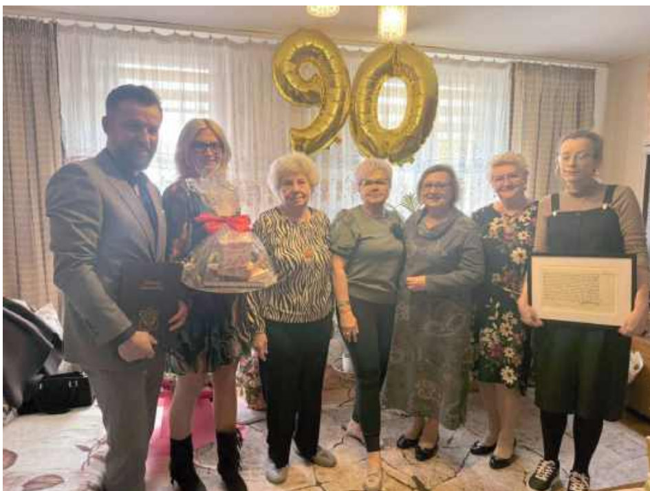
Jubilatkę odwiedzili przedstawiciele miasta z panią burmistrz na czele