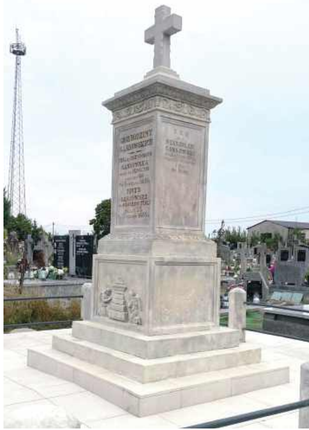
Można już podziwiać efekty przeprowadzonej renowacji

Lokalne władze zapraszają, by przy okazji odwiedzin cmentarza zatrzymać się na chwilę i zobaczyć efekty przeprowadzonej renowacji.