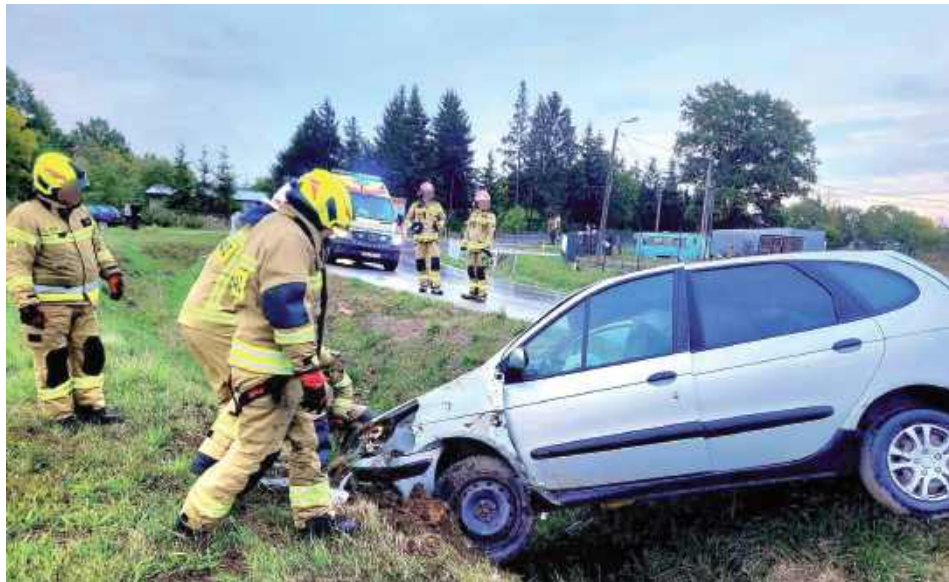
ok Strażacy musieli interweniować przy wypadku w Górznie

Na miejscu zdarzenia działania prowadziły zastępy PSP Garwolin i OSP Górzno oraz zespół ratownictwa medycznego.