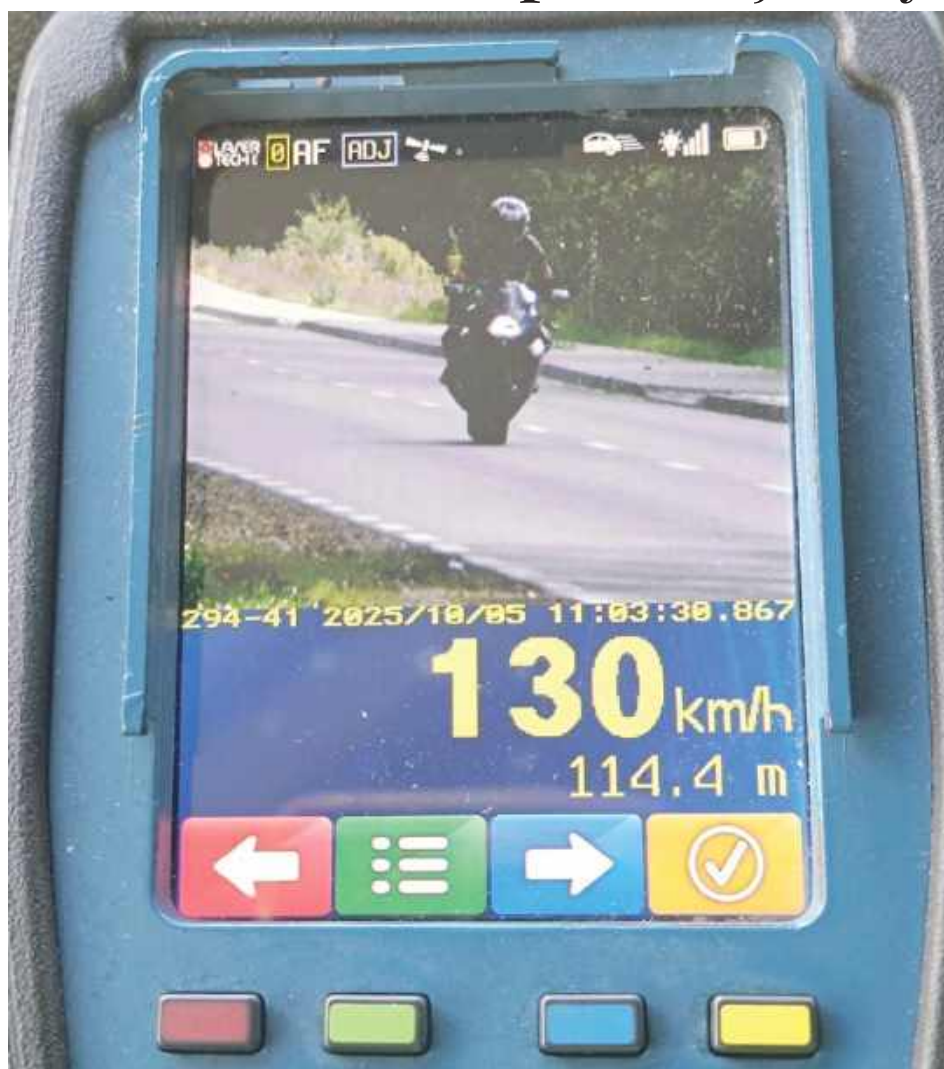
Za rażące przekroczenie prędkości funkcjonariusze nałożyli na kobietę najwyższy mandat w wysokości 2500 zł oraz 15 punktów karnych

Zabytkowa kapliczka w Podzamczu odzyskała swój dawny blask