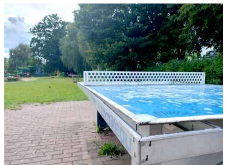
Uszkodzony stół do tenisa nie może spełnić żadnych zasad bezpieczeństwa