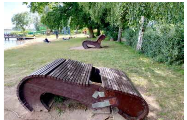
Do poważnych zniszczeń siedzisk doszło jeszcze w czerwcu. Sposób naprawy widoczny na zdjęciu

Dofinansowano przez Instytut Rozwoju Języka Polskiego ze środków budżetu państwa