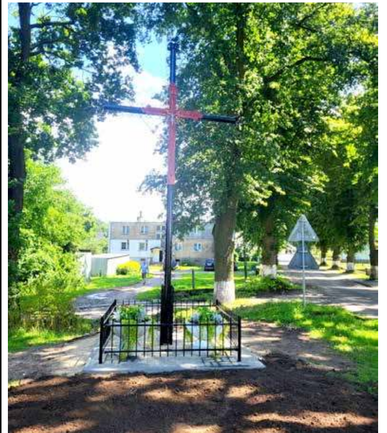
Końcowy efekt prac mieszkańców sołectwa Osowo