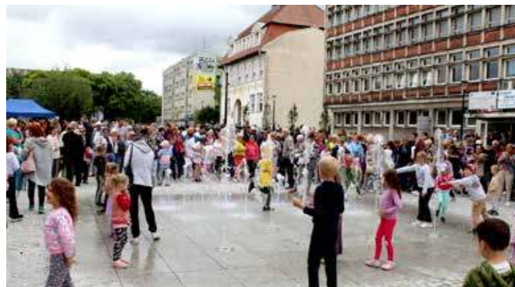
Fontanna cieszyła szczególnie najmłodszych

cych na tymczasową organizację ruchu w obrębie centrum miasta. O ile pogoda nie mogła tego dnia rozpieszczać w godzinach porannych, tak z okienkiem pogodowym mieliśmy do czynienia właśnie przed godziną 12. Wówczas wyraźnie się rozpo-godziło, co też było znakiem dla mieszkańców, aby pojawić się na miejscu.