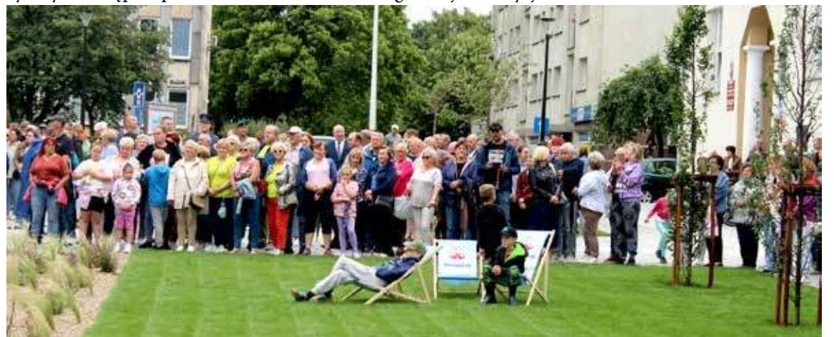
Mieszkańcy postanowili tłumnie wziąć udział w wydarzeniu