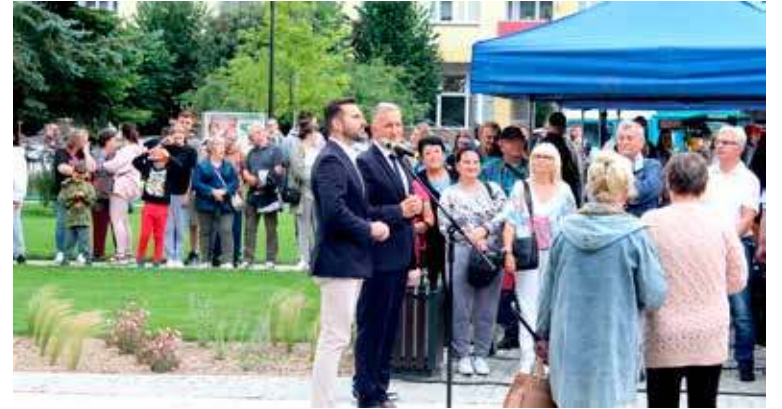
Część oficjalna trwała nie dłużej niż 15 minut

Od rana trwał demontaż ogrodzenia i znaków wskazują-