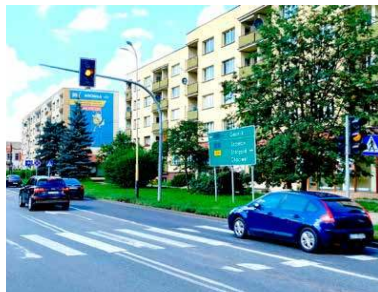
Obecnie trwa oczekiwanie na wymianę akumulatorów