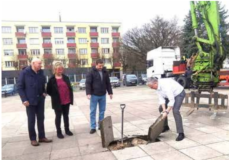
Oficjalne rozpoczęcie prac w marcu 2024 roku

3. Koncepcja przebudowy placu Wolności zakłada stworzenie miejsca wypoczynku w centrum miasta, z częścią parkingową i przystosowaną na imprezy masowe. Na placu, który od lat straszy, miałyby powstać fontanna, siedzi-