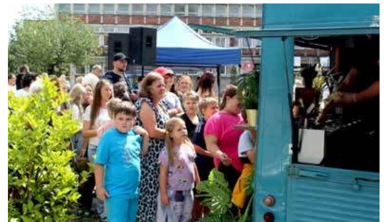
W kolejce po gofry

Główna uroczystość trwała nie dłużej jak 15 minut. Po muzycznym wstępie, przemowach