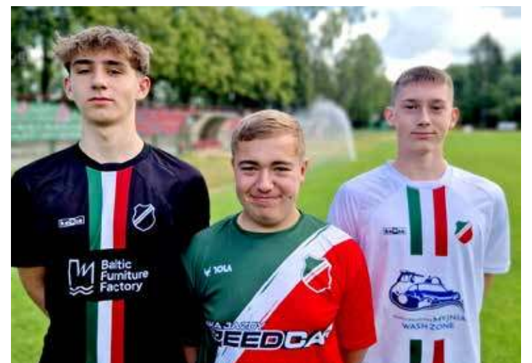
Trójka młodzieżowców do Pomorzanie przeszła z Mewy Resko