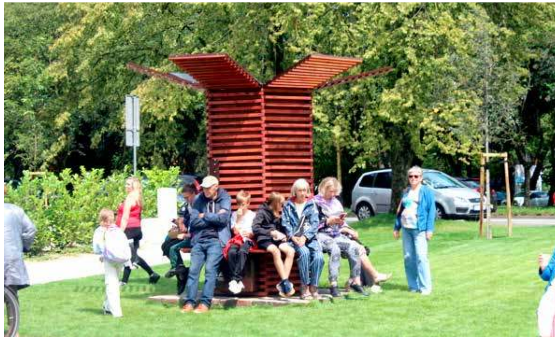
Tężnia została sprowadzona i zamontowana dosłownie kilka dni przed oddaniem placu w dniu 22 lipca br.

tego względu lepiej zachować powściągliwość, jeśli chodzi o miejskie tężnie..... - tyle autorka tekstu.