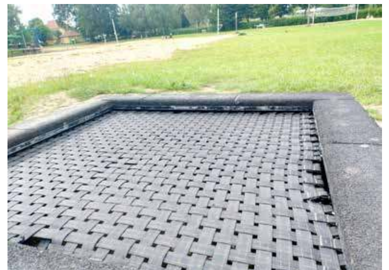
Tylko po prawej stronie widać kilka naderwanych mocowań trampoliny