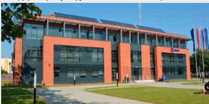
Komenda Policji w Stargardzie