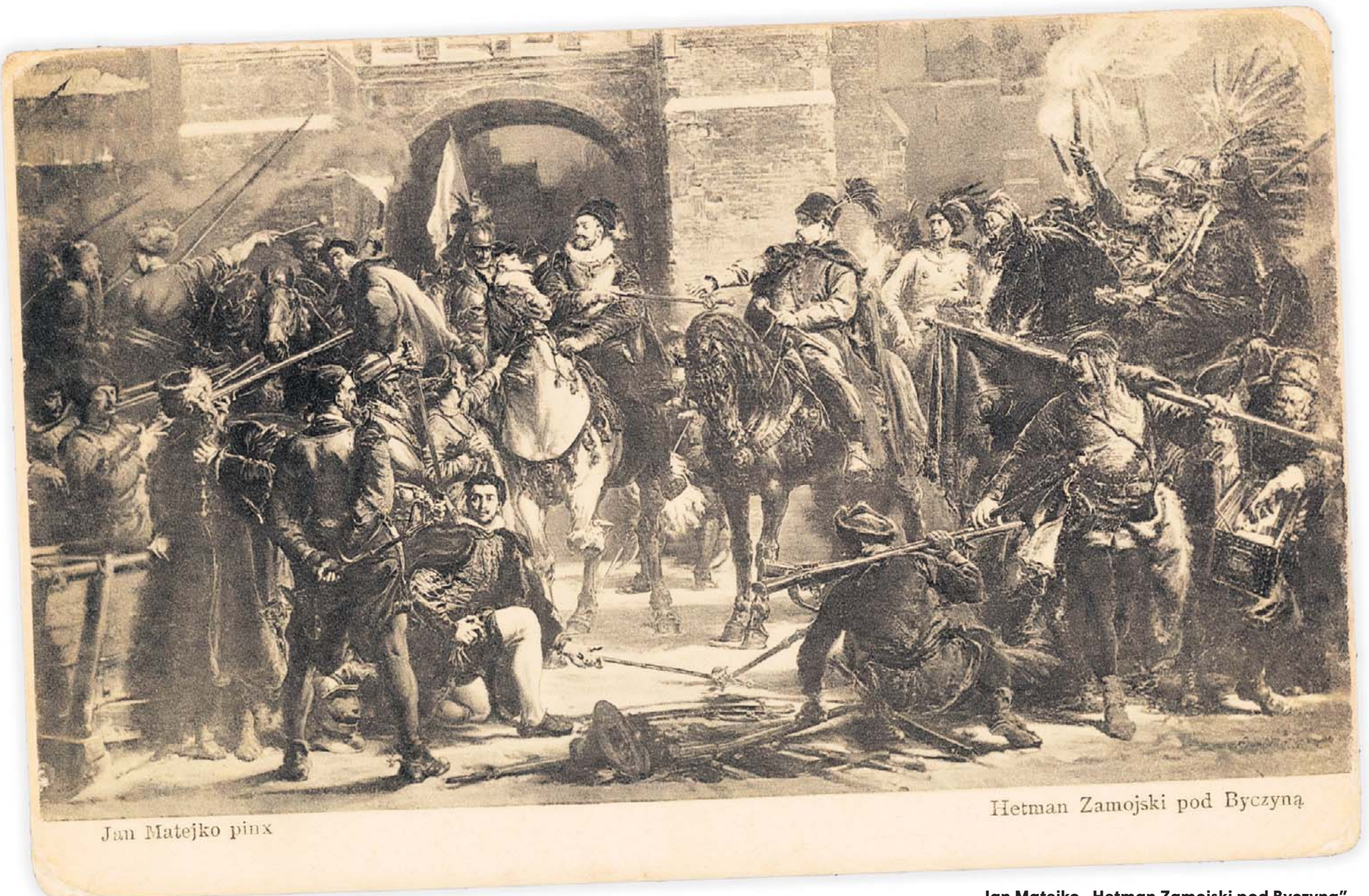
Jan Matejko pinx

Bitwę pod Orszą uważa się za pierwsze zwycięstwo husarii - ale to tylko częściowa prawda. Wtedy bowiem ta formacja była jeszcze lekką jazdą bez charakterystycznych zbroi. Dopiero pod Byczyną wystąpiła ona jako formacja ciężkozbrojna, miała nawet pierwszą wersję słynnych skrzydeł przyklejonych do tylnego łęku siodła. Właśnie tam narodziła się legenda.