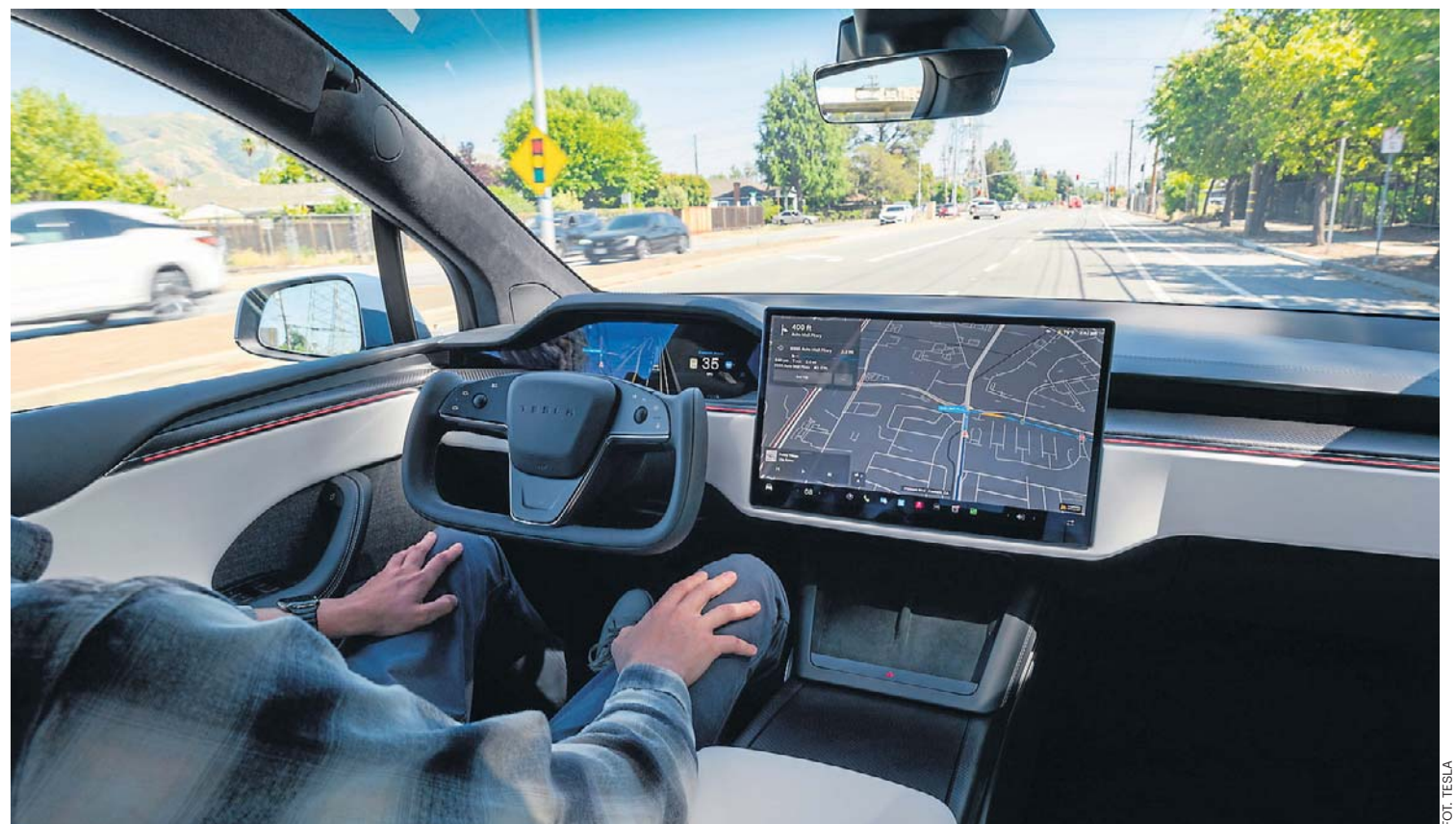
Najnowsze samochody działają jak „centra danych na kołach”, zbierając ogromne ilości informacji o pojeździe, kierowcy i pasażerach. Dane te są gromadzone, przetwarzane i wysyłane do serwerów producentów

Współczesny samochód widzi, słyszy i zapamiętuje. Rejestruje lokalizację, prędkość, styl jazdy, a także dane z telefonu