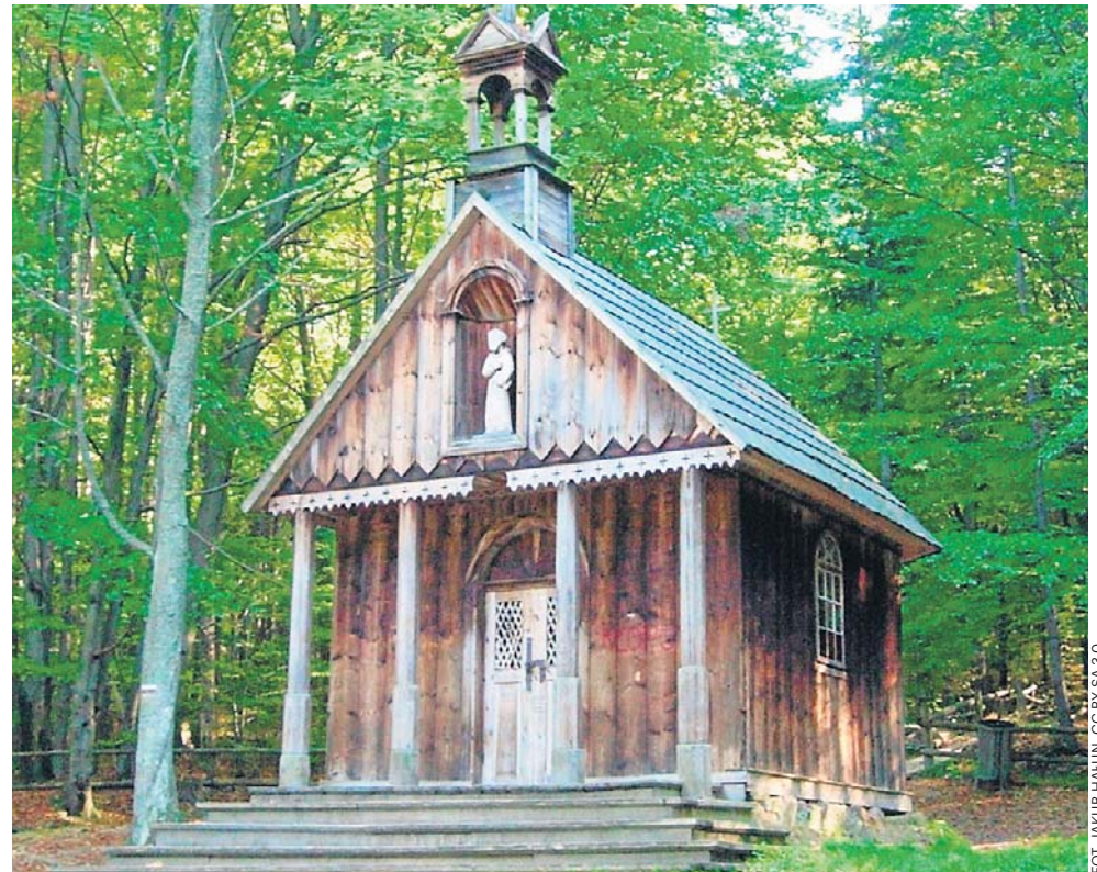
Przy szlaku prowadzącym ze Świętej Katarzyny na Łysicę znajduje się źródło ze smaczną wodą oraz drewnianą kapliczką św. Franciszka

W Górach Świętokrzyskich możecie też wybrać się na wędrowkę szlakiem „Śla-