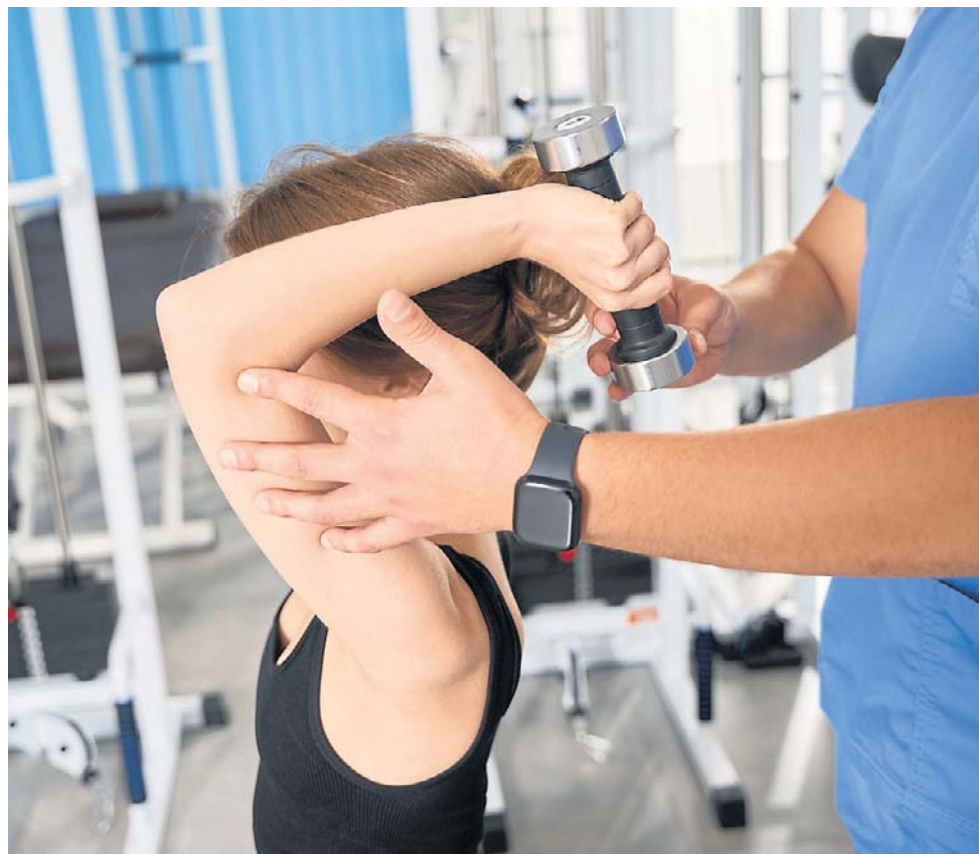
Należy pamiętać, że fizjoterapeuta nie leczy, a przede wszystkim wspomaga proces leczenia oraz znacząco poprawia komfort życia