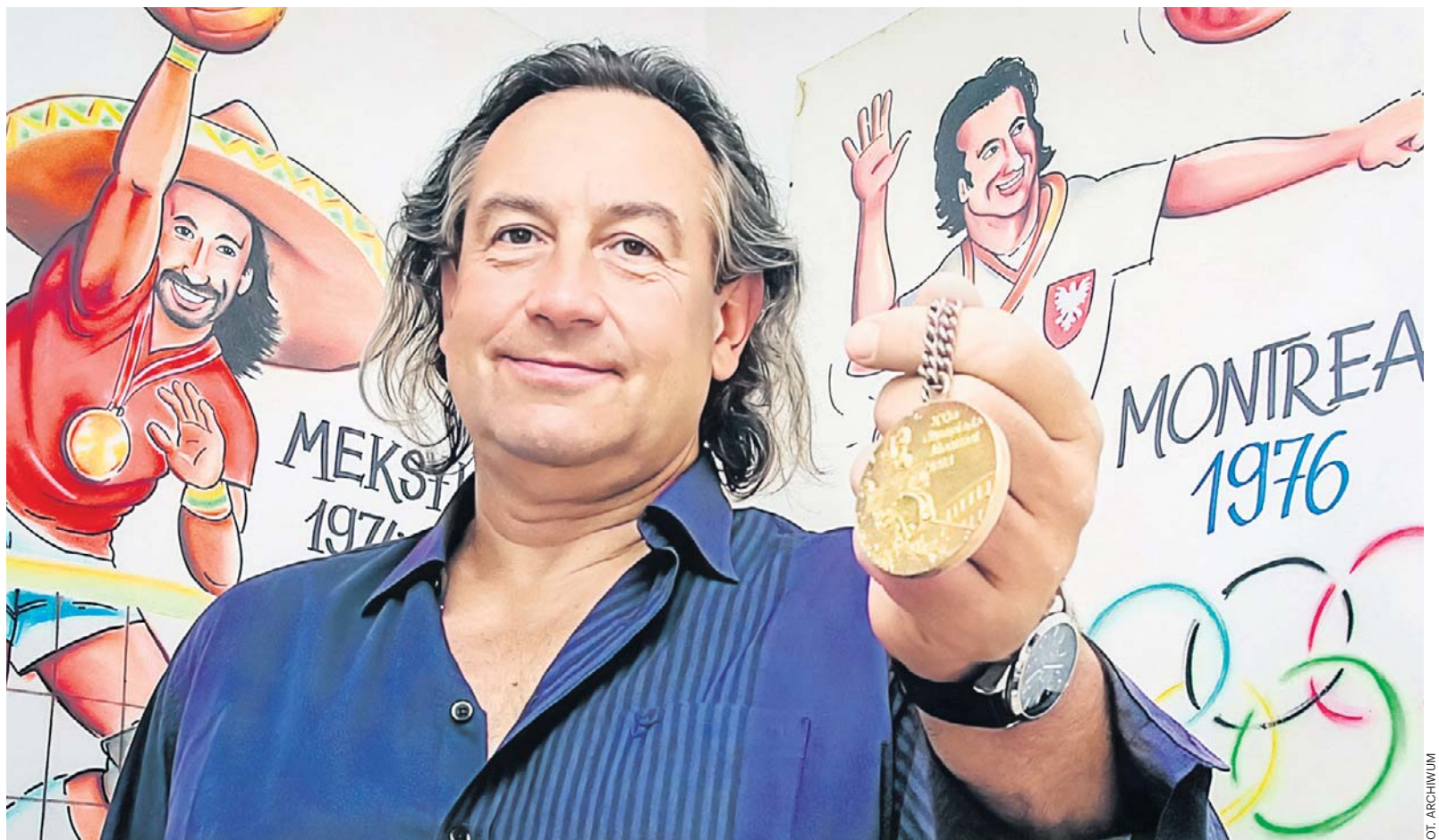
Tomasz Wójtowicz jest jednym z najbardziej utytułowanych siatkarzy w historii tego sportu. Przez Międzynarodową Federację Piłki Siatkowej został wybrany do ósemki najlepszych siatkarzy XX wieku. Znalazł się w siatkarskiej Galerii Sław – Volleyball Hall of Fame

– Muszę przyznać, będąc w pewnym stopniu nieobiektywnym, że tak skonstruowanego siatkarza nie widziałem do tej pory. Umiał zrobić wszystko. Miał charakter stworzony do sportu. Nigdy nie był zestresowany, nawet przed najważniejszymi meczami. Znał swoją rolę i wiedział, że jest killerem, który musi wziąć na siebie odpowiedzialność w najtrudniejszych momentach. Ale na nim to nie ciążyło. To było dla niego naturalne. To dla mnie największy siatkarz do tej pory – wspomina Ryszard Bosek.