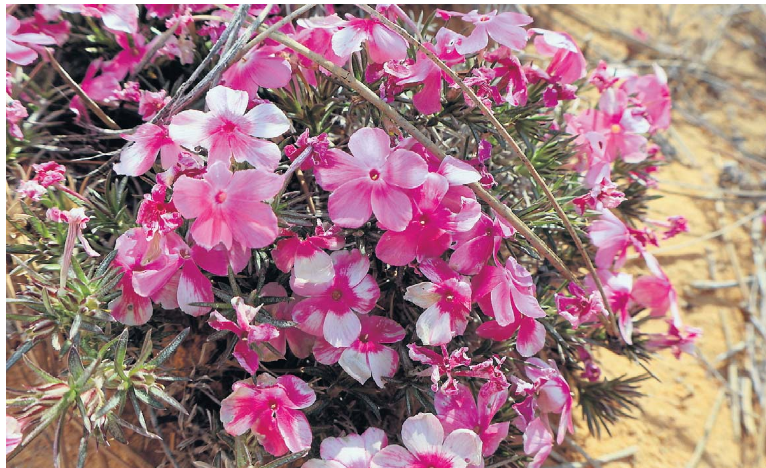
Floksy szydlaste to jedno z podstawowych roślin, jakie warto mieć na skalniaku. Są bardzo niskie, mają płozące pędy pokryte igielkowatymi liśćmi. Ładnie rozrastają się, zadarniając powierzchnię