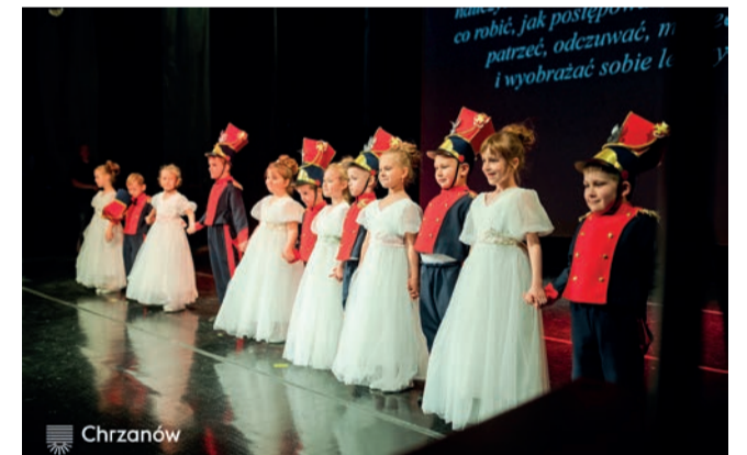
Występy artystyczne podczas obchodów jubileuszowych

że wspólnota, pomoc innym i odpowiedzialność za drugiego człowieka naprawdę mają znaczenie. Myślę, że te doświadczenia mocno wpłynęły również na moje podejście do pracy w przedszkolu.