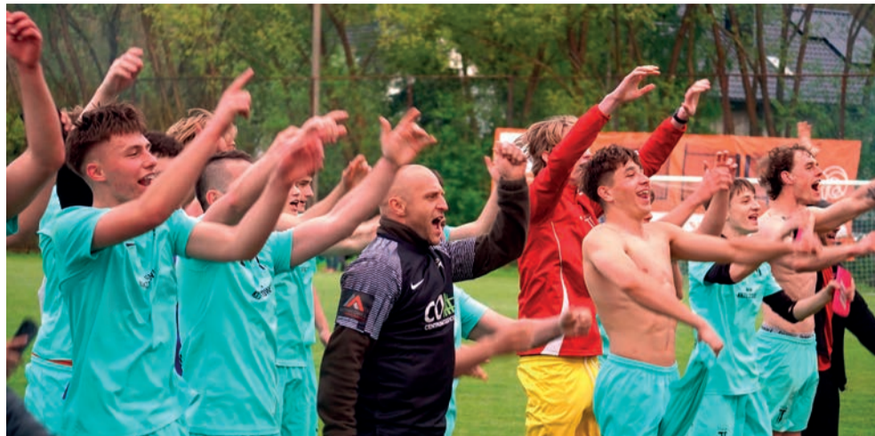
Piłkarze Tęczy cieszą się po wygranej z Fablokiem. Więcej zdjęć i wideo z tego meczu można obejrzeć na przelom.pl.