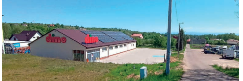
Budynek Dino w Libiążu został wzniesiony latem ubiegłego roku. Do dzisiaj nie został otwarty

„To jest jakaś patologia. Jak można było wydać pozwolenie na budowę takiego budynku o takim przeznaczeniu, jak nie było pozwolenia na dojazd samochodem ciężarowym? – pytał jeden z mieszkańców na Spotted Libiąż na Fb.