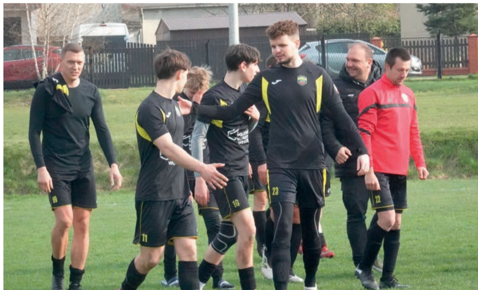
Piłkarze Libiąża przegrali z Jankowicami