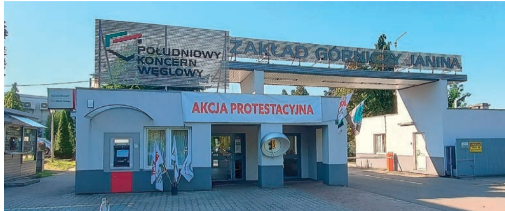
W obecnym stanie prawnym z zewnątrz można fotografować obiekty takie jak m.in. libiąska kopalnia

Regulacje te zostały znacząco zmienione po krytyce wcze-