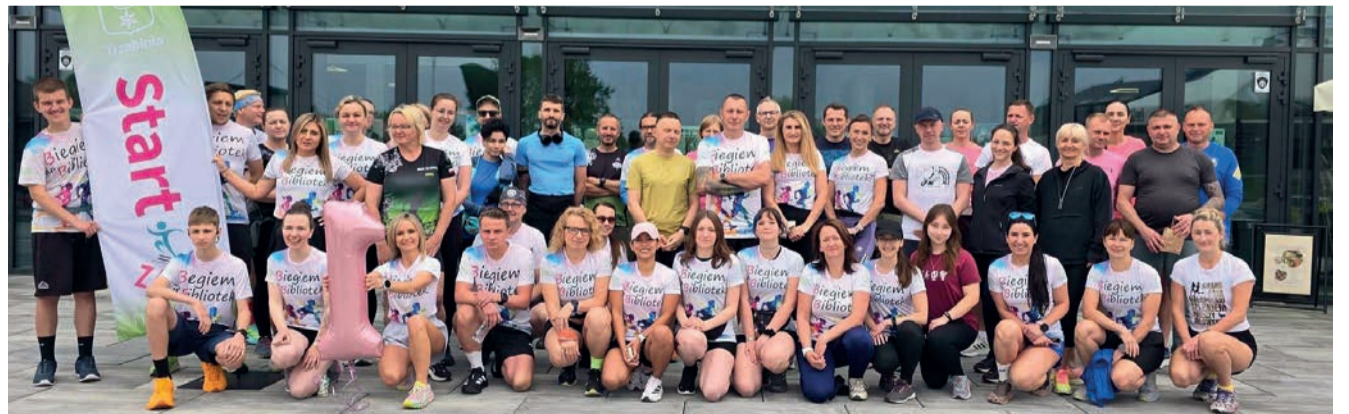
Uczestnicy jubileuszowego spotkania

W ciągu roku grupa bardzo się rozwinęła. Do wspólnego biegania dołączyło około 130 osób, a na treningach regularnie pojawiają się również przedstawiciele innych śro-