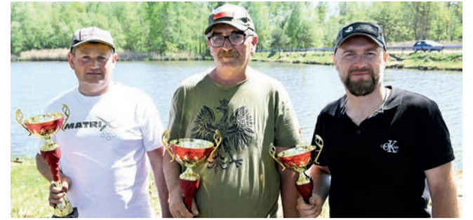
Najlepsza trójka zawodów

Na łowisku Żarki 215 odbyły się Sławikowe Mistrzostwa Koła PZW 33 Libiąż, jedno z ważniejszych wydarzeń sportowych w kalendarzu lokalnych wędkarzy. Zawody tradycyjnie przyciągnęły pasjonatów tej dyscypliny, którzy przez dwa dni rywalizowali o tytuł mistrza koła oraz czołowe miejsca w klasyfikacji końcowej.