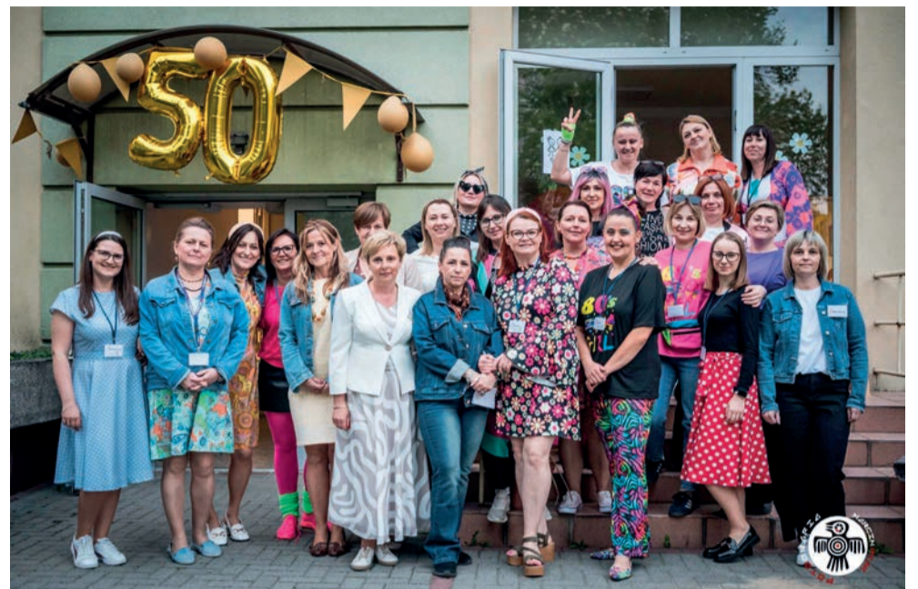
Kadra PS nr 7 w Chrzanowie.

Od 19 lat organizujemy pikniki rodzinne rozpoczynające rok szkolny. Chodzi o to, żeby od początku integrować rodziców i dzieci. Powstał też Teatr „Rodzice Dzieciom”. W tym roku odbyła się premiera „Pięknej i Bestii”. Rodzice występują jako aktorzy, nauczyciele zajmują się reżyserią. To już dziewiąte spotkanie teatralne i poziom artystyczny jest coraz wyższy. Organizujemy też akcje charytatywne, między innymi pieczenie pierniczek dla WOŚP. Prowadzimy wolontariat, akcję „Góra Grosza”. Organizujemy turniej piłki nożnej rodziców o przechodni puchar dyrektora przedszkola. Grają ojcowie, dzieci kibicują. Chodzi nie tylko o sport, ale też o wspólne spędzanie czasu i pokazywanie dzieciom pozytywnych wzorców.