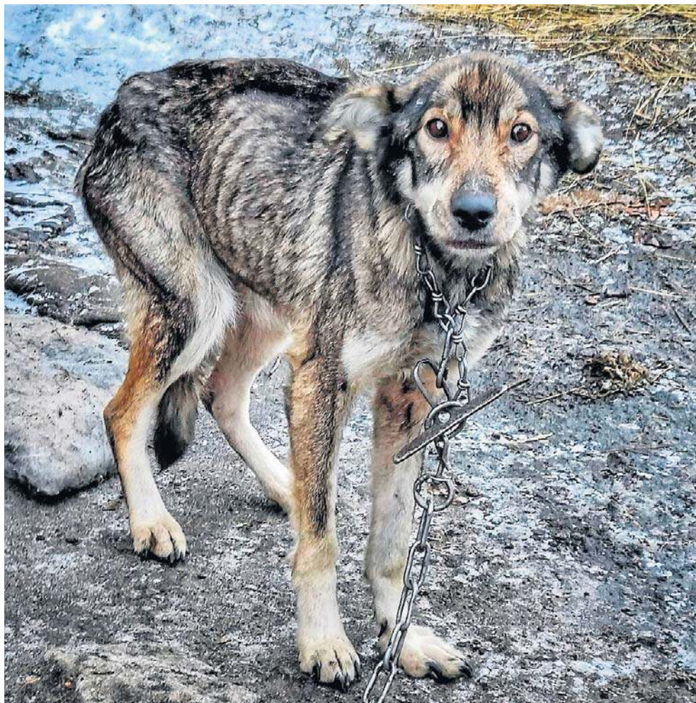
Zulę - wychłodzoną, wygłodzoną, z krótkim łańcuchem przywiązany do budy - odebrali z posesji w gminie Inowrocław policjanci i animalsi