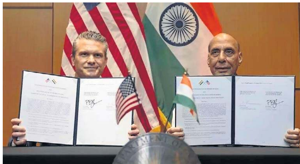
USA i Indie podpisały porozumienie ws. współpracy obronnej. Pokazują ją minister obrony Indii Rajnath Singh (po prawej) oraz jego amerykański odpowiednik Pete Hegseth

W reakcji USA nie wprowadzą stuprocentowego cła na import chińskich towarów, którym jeszcze kilka tygodni temu groził Trump. Co więcej, administracja obniżyła cła nałożone jako kara za dostawy fentanylu i prekursorów z Chin - z 20 do 10 proc. W rezultacie łączne cła na większość chińskich produktów wyniosą 47 proc. W tym samym roku zawieszono stosowanie sankcji wobec chińskich firm, w których udział właścicieli z „czarnych list” przekracza 50 proc. PAP