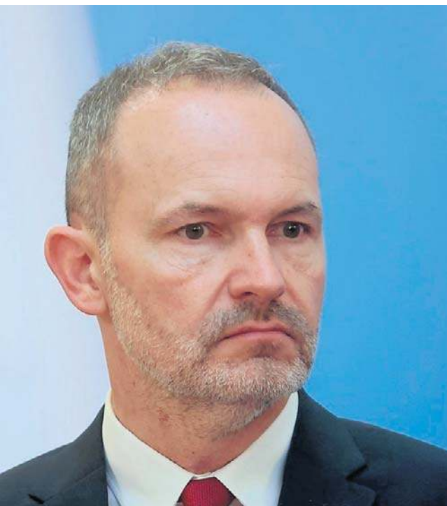
Krzysztof Hetman rozważa możliwość startu w wyborach na przewodniczącego Rady Naczelnej PSL

W ten sposób ludowcy w czasie najbliższych wyborów znajdują się pewnie dokładnie w połowie drogi między prawicą i obozem Tuska. I do ostatnich chwil będzie się ważyć, czy staną się jęczyzkiem u wagi tych wyborów, czy raczej partią, która przez nieuwagę weszła między młot a kowadło.