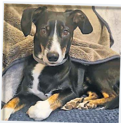
Badi Właściciel: Andrzej, powiat ciechanowski