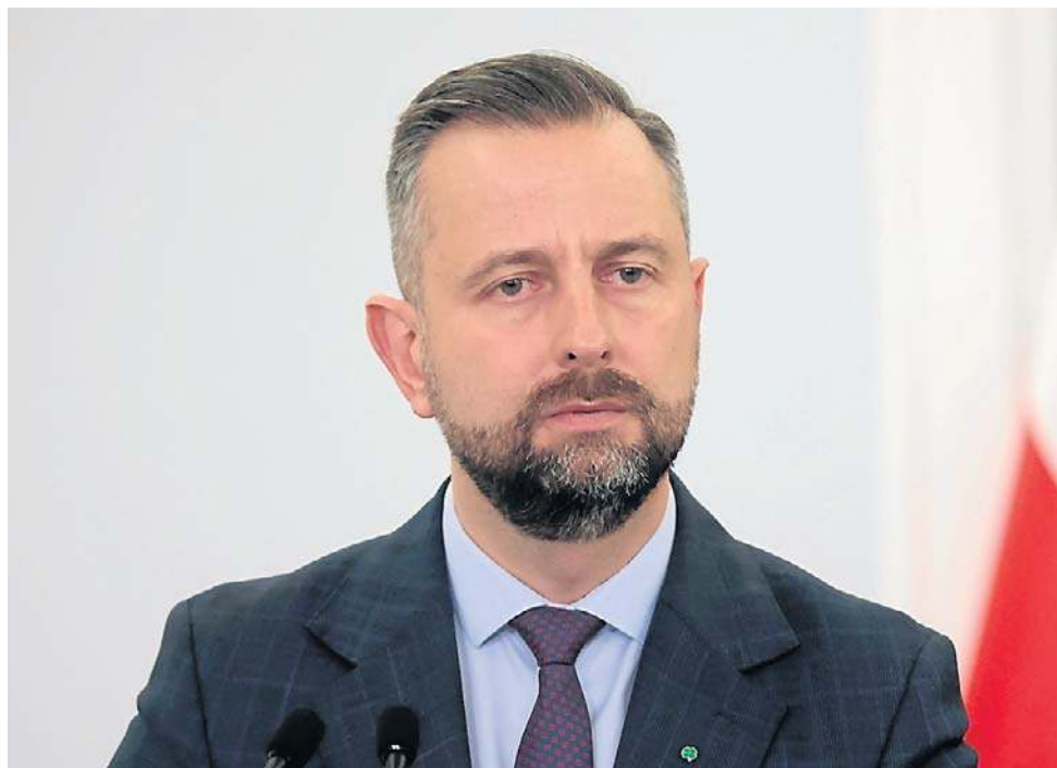
Władysław Kosiniak-Kamysz kieruje PSL od 2015 r. Dziś nikt nie podważa jego pozycji

Nie znaczy to jednak, że na dwa tygodnie przez partyjnym kongresem wszystkie rozstrzygnięcia są już znane. Trwają wybory władz w poszczególnych regionach, PSL wybierze też nowego przewodniczącym Rady Naczelnej. To drugie najważniejsze stanowisko w partii - obecnie sprawuje je Waldemar Pawlak.