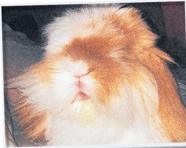
Tupek Właściciel: Róża Dawidowska