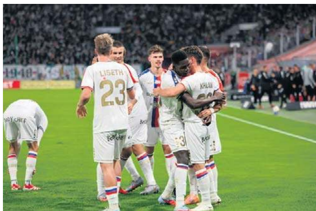
Górniki notuje znakomitą passę: wygrał czwarty ligowy mecz z rzędu u siebie i pozostał liderem rozgrywek

Wliczając rozgrywki Pucharu Polski, Górnik jest niepokonany dokładnie od dwóch miesięcy i zgłasza coraz większe aspiracje do walki o mistrzostwo Polski. To był jego