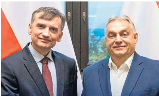
Zbigniew Ziobro spotkał się w Budapeszcie z węgierskim premierem Viktorem Orbánem

Sam zainteresowany przebywa na Węgrzech. Tam w jednym z budapeszteńskich kin wziął udział w pokazie filmu „Przejście” na temat zmian w TVP po wyborach w 2023 roku oraz w dyskusji z szefem kancelarii Viktora Orbana Gergelym Gulyasem. W trakcie swojego wystąpienia Ziobro zaatakował polski rząd, a zwałsz-