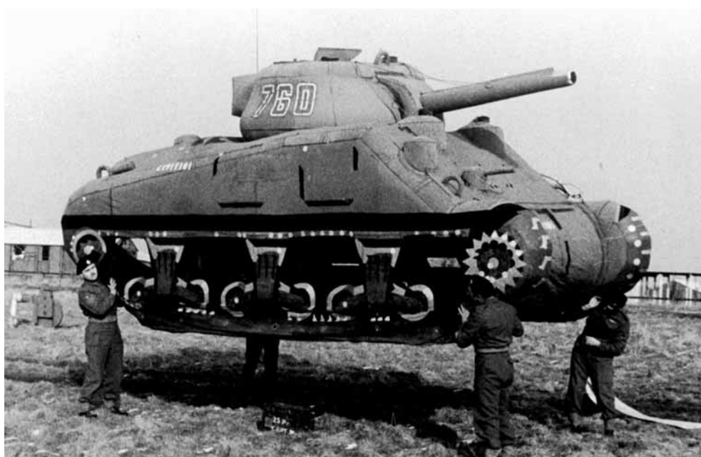
Operacja „Fortitude” służyła przekonaniu Niemców, że prawdziwy D-Day odbędzie się w regionie Pas-de-Calais