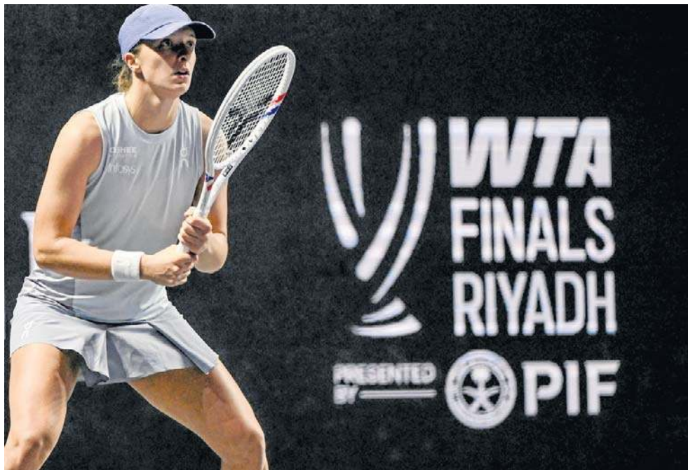
Iga Świątek kapitałnie rozpoczęła turniej finałowy WTA w stolicy Arabii Saudyjskiej

Po jednostronnym pierwszym secie Świątek rozpoczęła również drugą partię od przełamania, ale w kolejnym gemie Madison natychmiast odrobiła straty. Druga w rankingu Polka pozostała niewzruszona i kontynuowała swoją dominację, wygrywając kolejne pięć gemów i zwyciężając z przewagą w wielkim stylu.