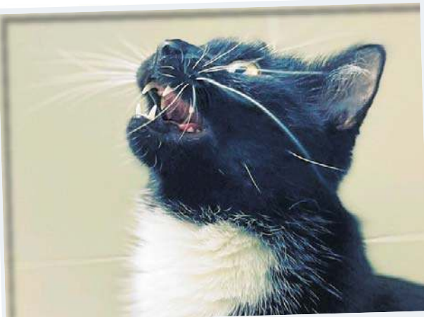
Lola Właściciel: Eunika Szaparkiewicz, powiat otwocki