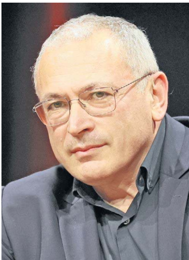
Michaił Chodorkowski był w 2003 r. aresztowany. Teraz mieszka w Londynie

Kasparow, arcymistrz szachowy, który był mistrzem świata w latach 1985-2000, od dwóch dekad poświęca się