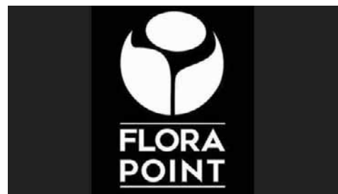
Flora Point Zoologia Warszawa, Mrówcza 212