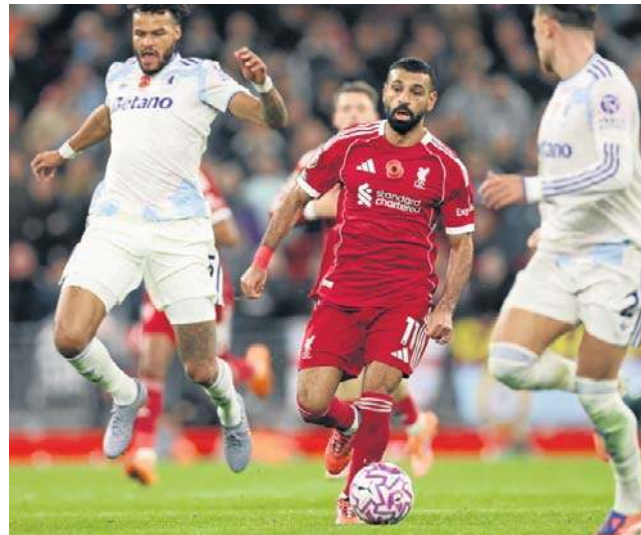
Napastnik Liverpoolu Mohamed Salah w meczu z Aston Villą zdobył swą czwartą bramkę w tym sezonie Premier League

W swojej historii Liverpool miał tylko dwóch skuteczniej-