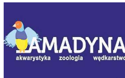
Sklep Zoologiczno-Wędkarski Amadyna Radom, Okulickiego 15

Nasza akcja poświęcona wszystkim czworonogom, ich właścicielom i pomagającym im specjalistom nie byłaby pełna, gdyby nie kategoria Sklep zoologiczny Roku 2025. W końcu to tutaj znaleźć można wszystko, co potrzebne pupilom, by utrzymać ich zdrowie i dobre samopoczucie. O tym, jak ważne dla właścicieli są ekspertyza, zaangażowanie i szeroki asortyment najwyższej jakości, wiedzą doskonale właściciele radomskiego Sklepu Zoologiczno-Wędkarskiego Amadyna.