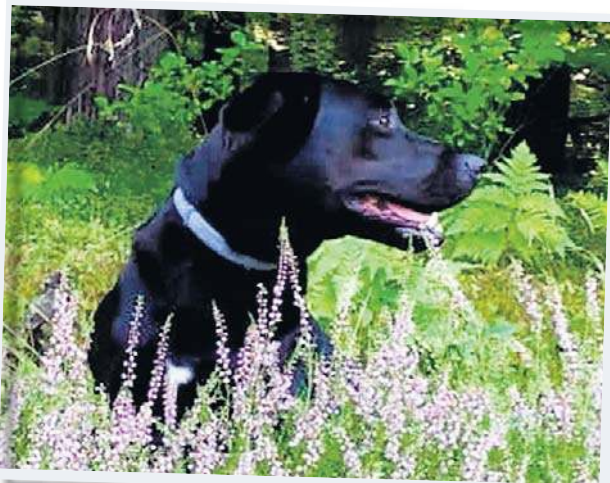
Bunia Właściciel: Wanda Zawrotna, powiat ostrołęcki