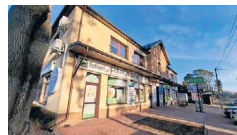
Centrum Zoologiczne TOFIVET Józefów, Wyszyńskiego 6A