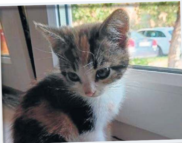
Zadra Właściciel: Agata Gembarska, powiat węgrowski