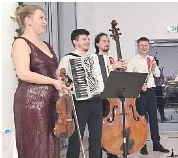
Kolędowanie z grupą Mała Rokiczanka odbyło się przy akompaniamentach profesjonalnych muzyków