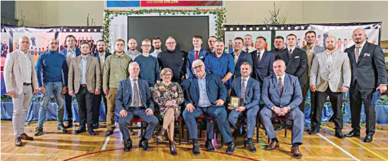
Wydarzenie zgromadziło kilka pokoleń zawodników. Klub przez 35 lat wychował dziesiątki utalentowanych sportowców

„Nie jest łatwo przetrwać i mieć zaufanie ludzi”