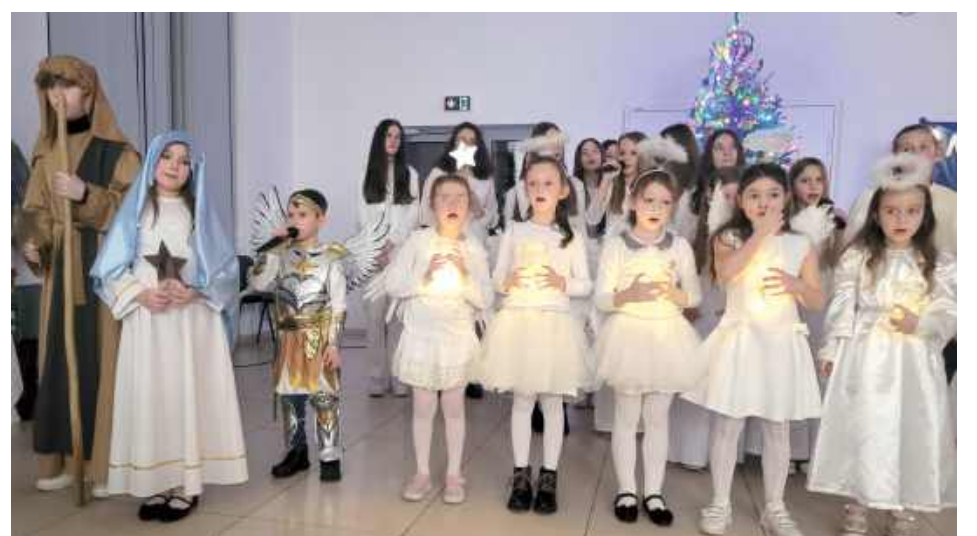
W wykonaniu dzieci można było usłyszeć piękne pastorałki