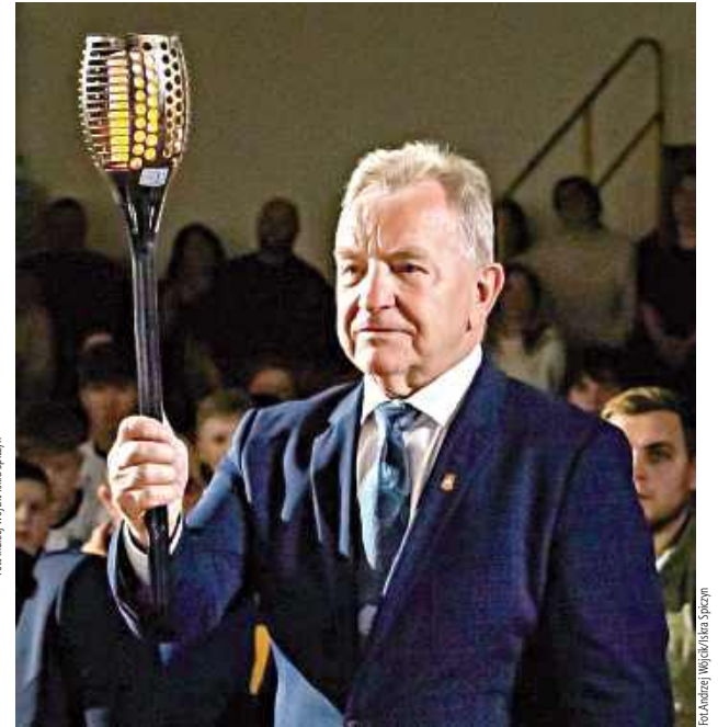
Wśród gości był Andrzej Supron, w przeszłości znakomity zapaśnik, wiceprezes Polskiego Komitetu Olimpijskiego. Jubileusz miał też część artystyczną. Były medalista igrzysk wziął w niej udział, wnosząc znicz olimpijski