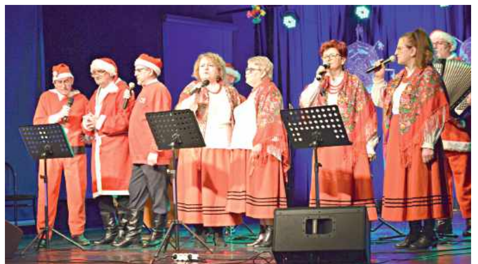
Kolędowanie z Lewartowianami w LOK