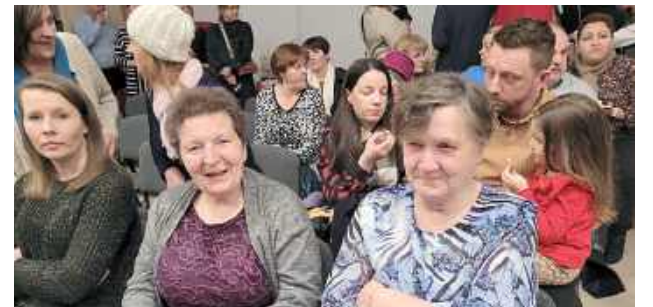
W tym roku świetlica wypełniona była gośćmi po brzegi