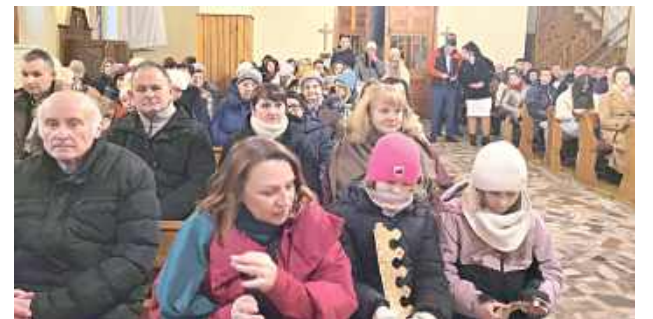
Uroczystość rozpoczęła się mszą świętą w kaplicy pw. NMP Królowej Polski w Nowodworze