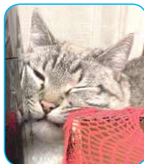
Śnieguś, Ewelina Choma, Zaróbka

Zdjęcia przysyłajcie: 1. mailem: kontakt@24wspolnota.pl 2. MMS-em lub WhatsAppem: 691 648 641 3. dostarczcie osobiście do siedziby redakcji