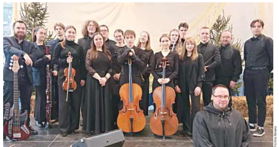
W tym roku uroczystości uświetnił występ zespołu młodzieżowego Eleftheria