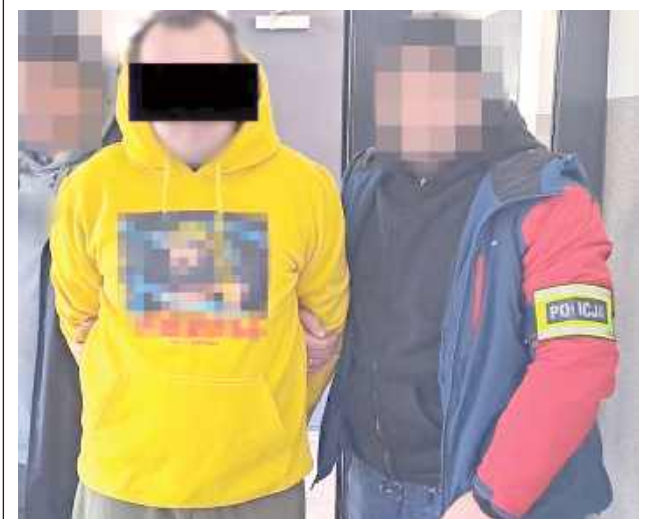
Grozi mu kara do 5 lat pozbawienia wolności

Opole Lubelskie: Policjanci zatrzymali 36-letniego mieszkańca Poniatowej, który będąc pod wpływem alkoholu, groził swoim rodzicom pozbawienia ich życia. Odpowiadał już za przestępstwo znęcania się nad rodzicami, a teraz dodatkowo zlekceważył wydany przez sąd zakaz zbliżania się i kontaktowania się z bliskimi.