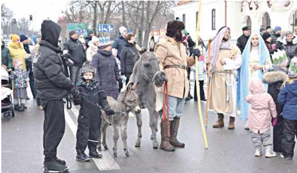
Osiołki gotowe do wymarszu na czele orszaku