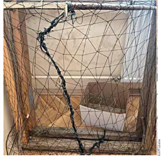
Jedna z pułapek znalezionych przez policję

Policja znalazła wnyki i pułapki na ptaki. 43-latek podejrzany o kłusownictwo