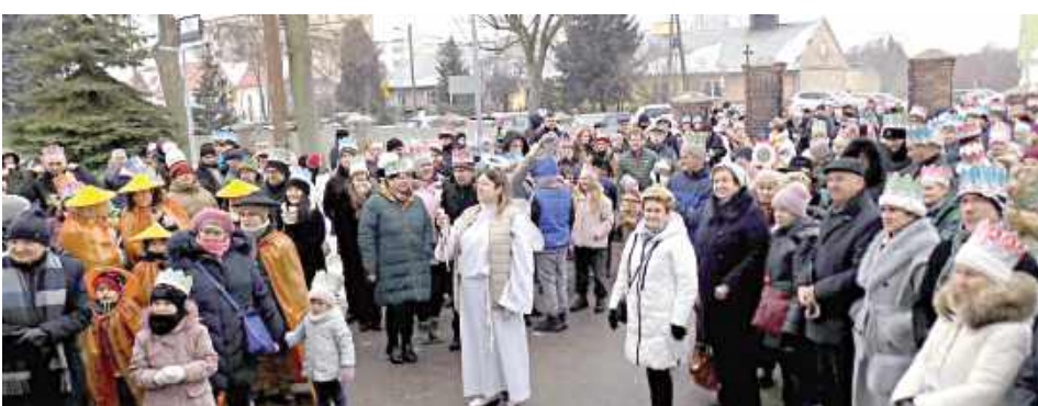
Orszakowi towarzyszyło wielu mieszkańców