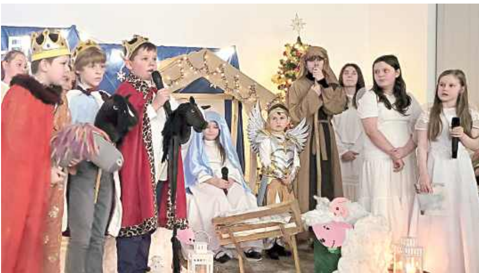
Jasełka w wykonaniu dzieci z SP w Nowodworze