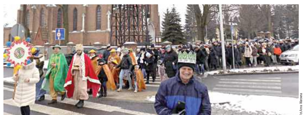
Orszak Trzech Króli