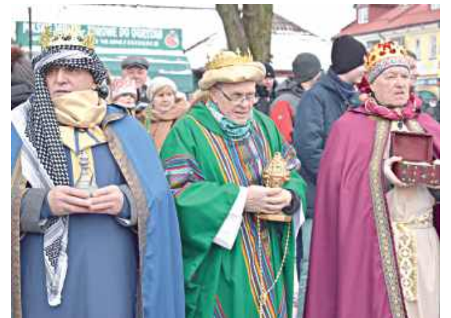
Trzej Królowie w Lubartowie