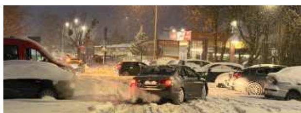
Zasypane drogi i chodniki. Zimowa codzienność w powiecie łęczyńskim

Zasypane drogi, chodniki i pobocza powodują utrudnienia, a służby drogowe pracują praktycznie bez przerwy. W ostatnich dniach zimowa