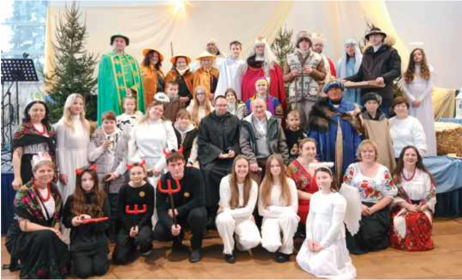
Twórcy Orszaku Trzech Króli

Mieszkańcy gminy Niemce i okolic mieli możliwość uczestniczenia w podniosłych uroczystościach Święta Trzech Króli. Orszak zawitał do parafii św. Ignacego Loyoli już po raz czwarty i jak zawsze towarzyszyło mu wielu wiernych.