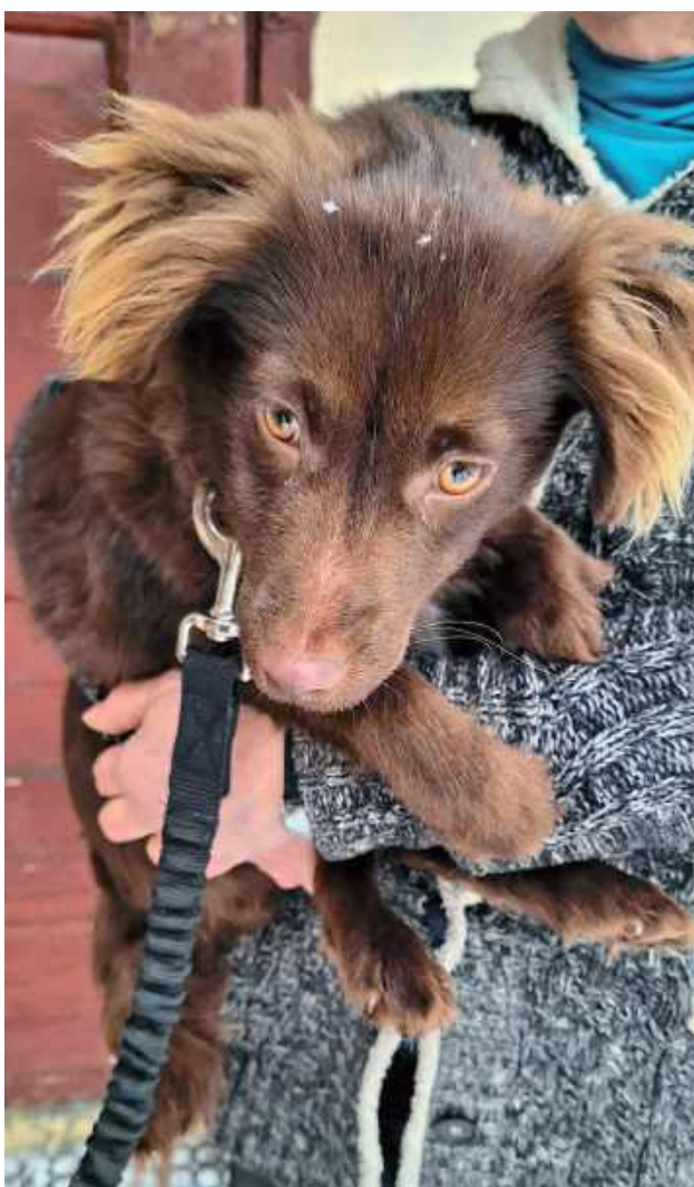
Gacek to młody, około półroczny piesek, ważący niespełna osiem kilogramów, który pilnie potrzebuje domu tymczasowego lub stałego

Osoby zainteresowane pomocą lub adopcją proszone są o bezpośredni kontakt ze Stowarzyszeniem Milejów Dla Zwierząt, które prowadzi sprawę i udziela wszelkich informacji dotyczących Gacka.