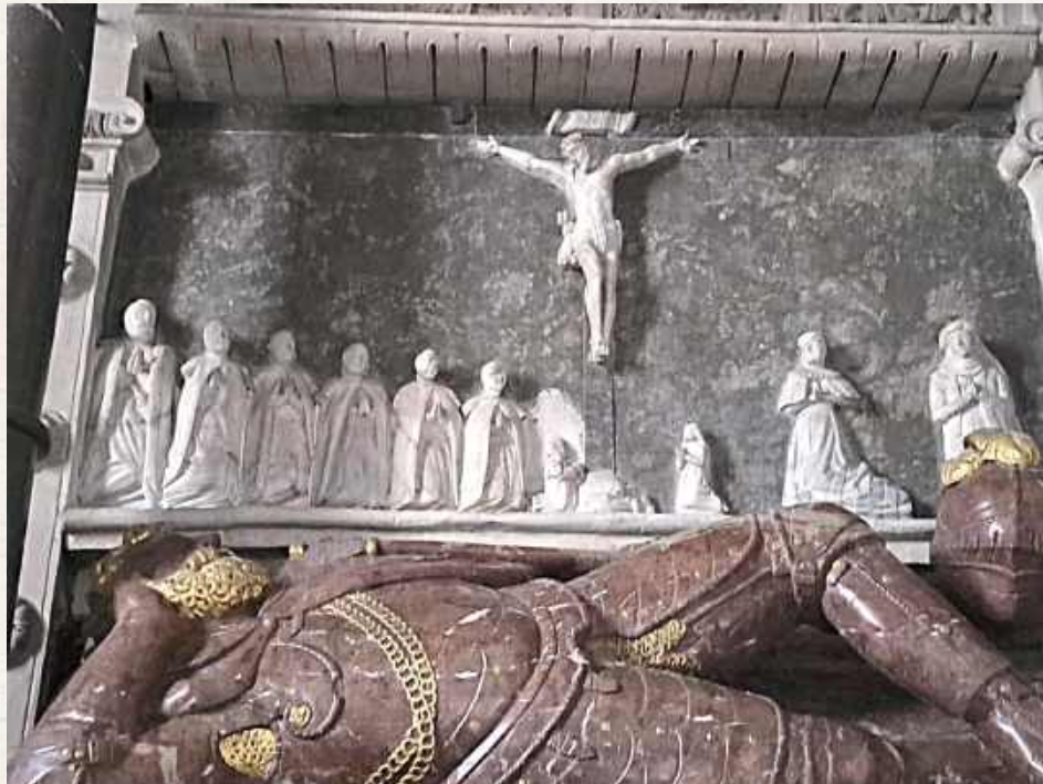
Jednym z najciekawszych zabytków regionu jest nagrobek Mikołaja Mniszcha (młodsze) w kościele Świętej Trójcy w Radzynie Podlaskim. Nad leżącym rycerzem mamy scenę pokazującą innych członków rodu

i czopowego, wykup młynów, doszła mu w r. 1540 dzierżawa królewskiego miasteczka Kozirynek (Radzyń Podlaski) wraz z należącymi doń wsiami. Dn. 1 VIII 1548 Zygmunt August połączył zapisy Mniszcha na Łukowie i Kozimryнку w ogólną sumę 6 462 złp. wliczając w nią gratyfikację z tytułu nakładów poniesionych przez Mniszcha po pożarze miasta i dworu oraz z racji wydatków na lokowanie nowych wsi z folwarkami, a w kilka dni później nadanie to zostało umocnione przyznaniem Mniszchowi oraz jego żonie i najstarszemu synowi dożywocia”. Za nadaniami tymi staje w dużej części świetna relacja z Boną. W 1537 roku królowa wykupiła dobra wokół Łukowa i Radzyna od rodziny Kaznowskich i przekazała je Mikołajowi, co było zresztą niemalym skandalem. Kolejnym jego patronem został Zygmunt August, po którego stronie stanął w czasie konfliktów z matką po śmierci jego ojca. Potrafił też zadbać