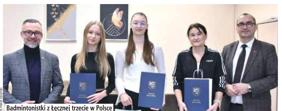
Badmintonistki z Łęcznej trzecie w Polsce