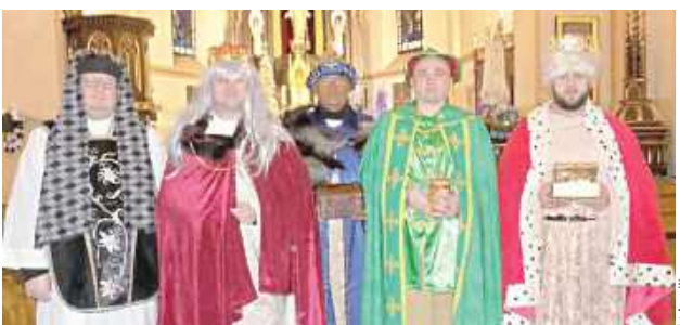
Orszak wyruszył z kościoła w Niemcach