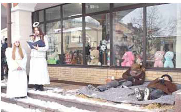
Anioły budzą pasterzy w Betlejem