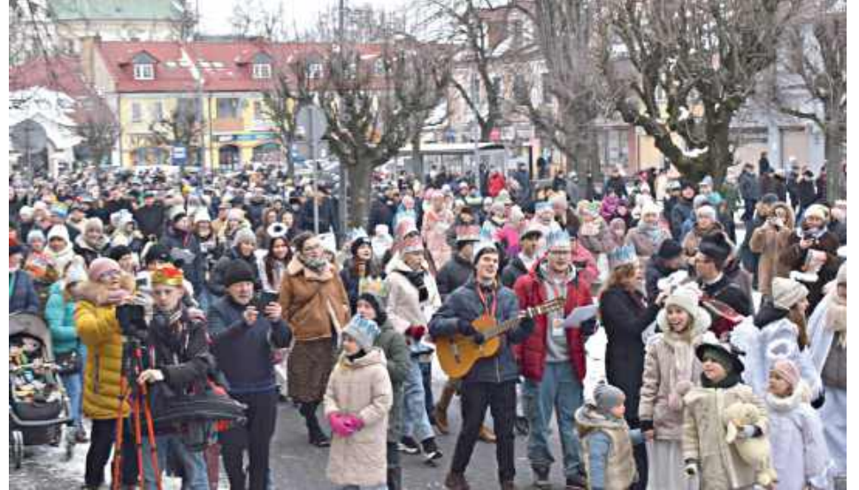
Uczestnicy orszaku zapelnili cały lubartowski rynek

Zainteresowanie, zwłaszcza najmłodszych uczestników Orszaku Trzech Króli, wzbudził mały osiołek i jego mama krocząca na czele pochodu.