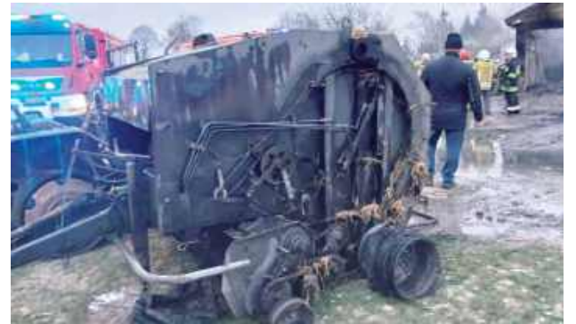
Ogień całkowicie zniszczył warsztat oraz oborę, spłonęły budynki, sprzęt, narzędzia i zaplecze do codziennej pracy

- Zbiórka wciąż trwa, bo przed nami jeszcze wiele pilnych rzeczy, m.in. dach nad zwierzętami, narzędzia, odbudowa