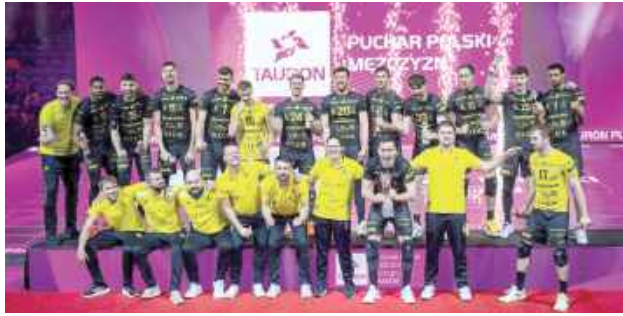
Bogdanka LUK Lublin - triumfatorzy Tauron Pucharu Polski

Po raz pierwszy w historii klubu Bogdanka LUK Lublin sięgnęła po Tauron Puchar Polski. W wielkim finale turnieju w Krakowie żółto-czarni pokonali Asseco Resovię Rzeszów.