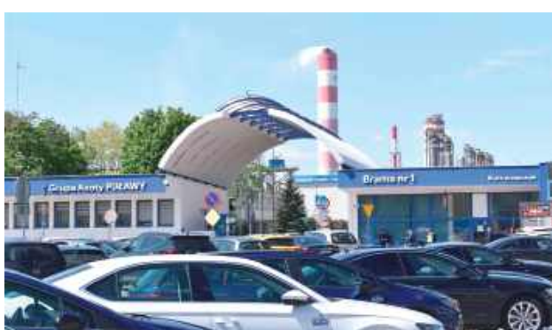
Związkowcy dali premierowi 14 dni na odpowiedź na pytania o przyszłość dla puławskiego zakładu

O tym, że sytuacja puławskich zakładów nie jest łatwa, na naszych łamach pisaliśmy już nie raz. Spółka realizuje plan naprawczy, zawiesiła wszelkie formy sponsoringu, wyprzedaje majątek niezwiązany bezpośrednio z jej działalnością. Także związkowcy po raz kolejny biją na alarm. W ostatni dzień minionego roku NSZZ „Soli-