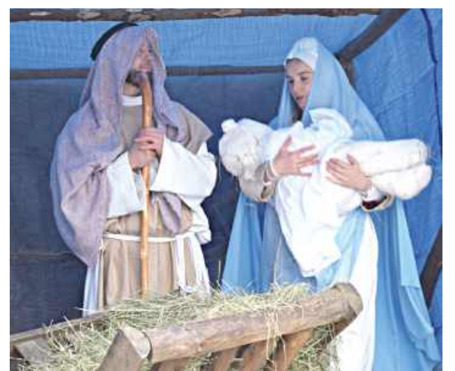
Święta Rodzina w stajence