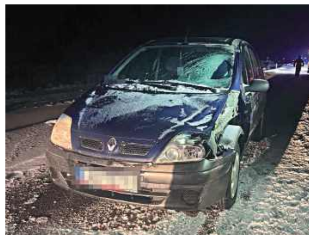
Renault potrafił śmiertelnie kierować Volkswagena, który wysiadł z pojazdu

Do tragedii doszło 8 stycznia w pobliżu Niedźwiady. - Kierujący samochodem osobowym marki Volkswagen, podczas jazdy źle się poczuł, zatrzymał pojazd i wyszedł na jezdnię.