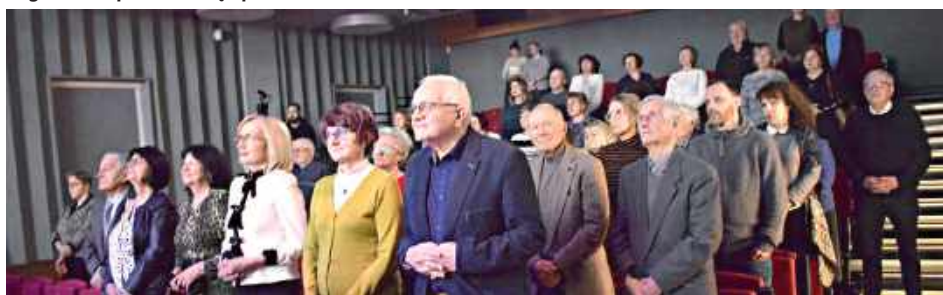
Regionaliści na spotkaniu opłatkowym