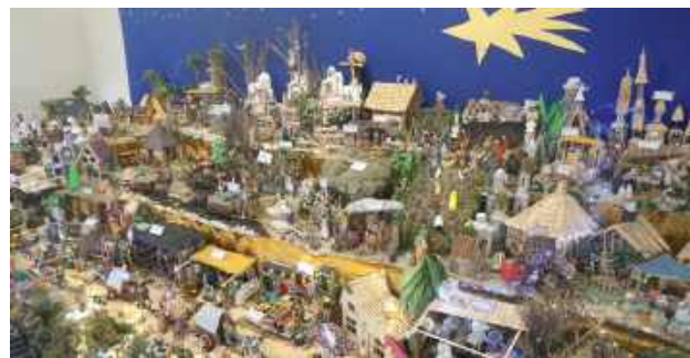
Widok jest naprawdę niesamowity. Trzeba to zobaczyć na własne oczy i... powolutku oglądać partiami, żeby niczego nie przegapić. Ale zapewniamy Was, że oglądając po raz kolejny, dopatrzycie się nowych szczegółów i postaci...

Szopka przedstawia już 43 stare zawody (znalście zawód ludwisarza??? to ten, który dawniej robił dzwonki...), ale lista planów jest znacznie dłuższa – w kolejnych latach mają pojawić się m.in. kopalnia diamentów, gęsiarka, wypas kóz, murarz, złotnik czy