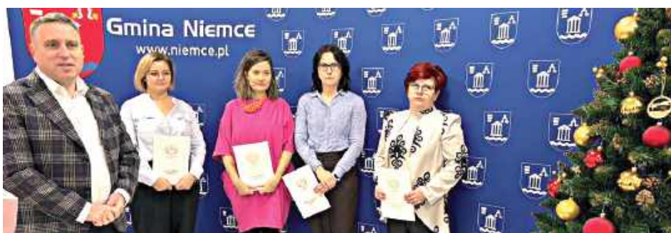
Kolejni nauczyciele ze szkół gminy Niemce z awansami

Gmina Niemce otrzymała nieodpłatnie 129 laptopów, 40 laptopów przeglądarek (różnica w oprogramowaniu) oraz 76 tabletek.