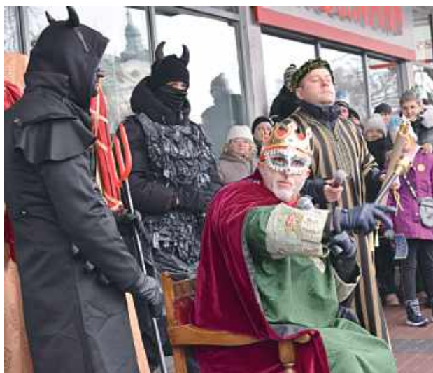
Orszak po drodze odwiedził też króla Heroda