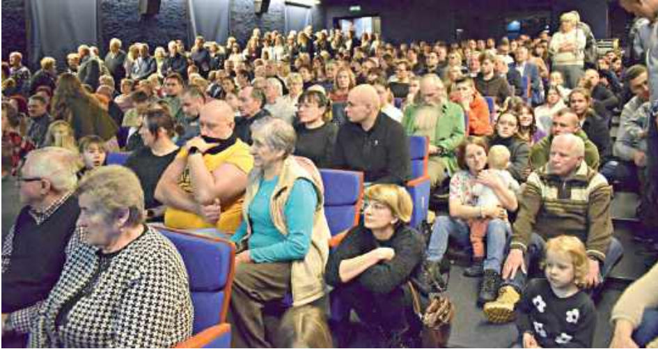
Cała sala była wypełniona, część publiczności siedziała na podłodze

Dla widzów zabrakło miejsc, mimo dostawionych krzeseł. Wiele osób wybrało siedzenie na podłodze, ale i tak wszyscy doskonale się bawili. Jak zawsze na koncercie lubartowskiej orkiestry dętej.