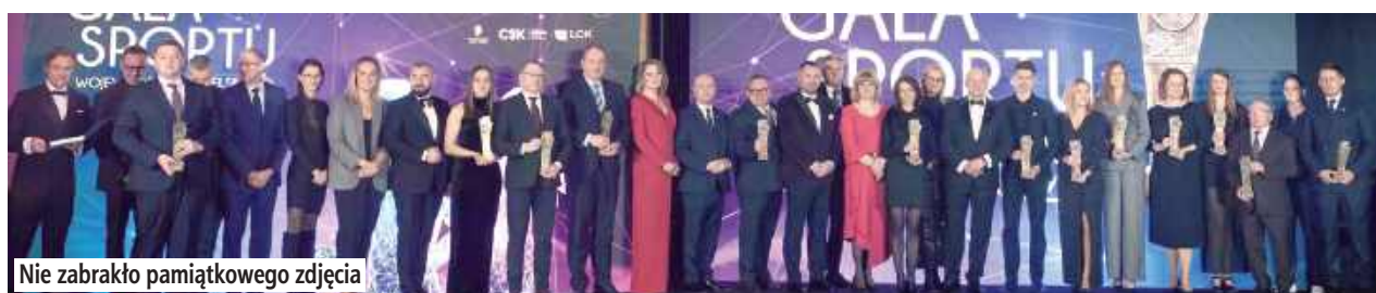
Nie zabrakło pamiątkowego zdjęcia

Za nami IV Gala Sportu Województwa Lubelskiego. Sportowcem roku została Aleksandra Mirosław.