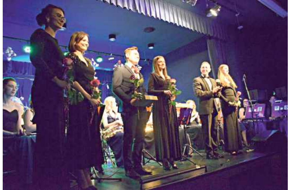
Wraz z orkiestrą wystąpili wokaliści - na zakończenie koncertu dostali kwiaty