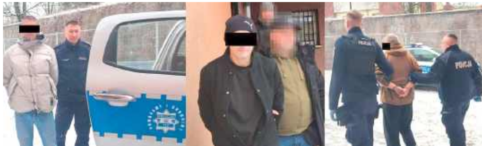
Mieszkańcy powiatu puławskiego w wieku 30, 44 i 53 lat trzy najbliższe miesiące spędzą w areszcie

- Nie tylko włamali się do mieszkania, ale także grozili jego właścicielce pozbawieniem życia i ukradli jej leki - mówi nadkom. Ewa Rejn-Kozak, rzecznik prasowy Komendy Powiatowej Policji w Puławach.