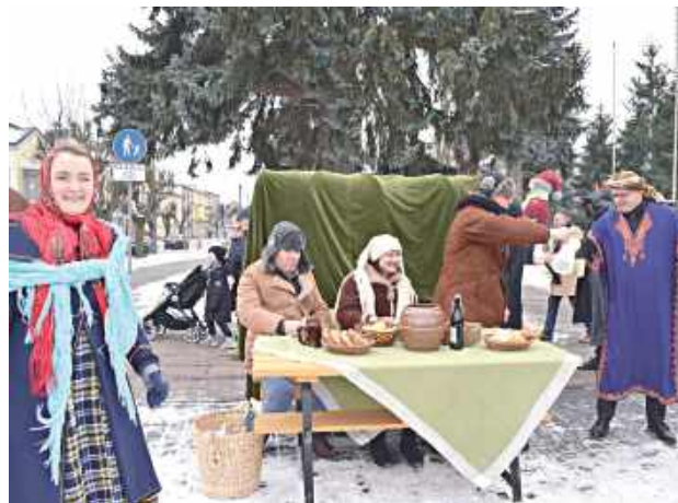
Gospoda, w której zabrakło miejsca dla Józefa i Maryi