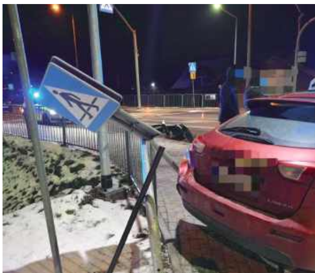
Do kolizji doszło 5 grudnia przed godz. 16

Doszło do zderzenia pojazdów. Kierujący Nissanem 37-letni mieszkaniec gminy Niedźwia-