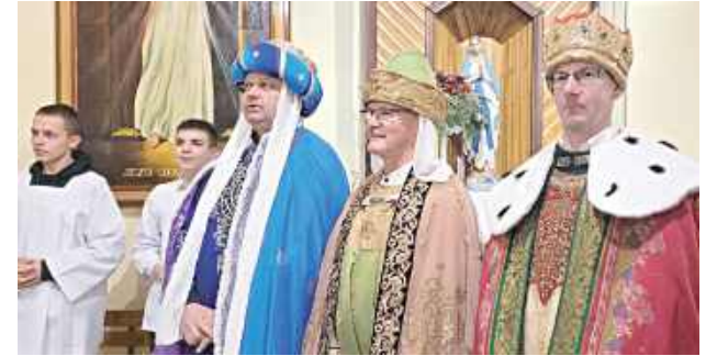
Trzej Królowie podczas mszy świętej w kaplicy w Nowodworze