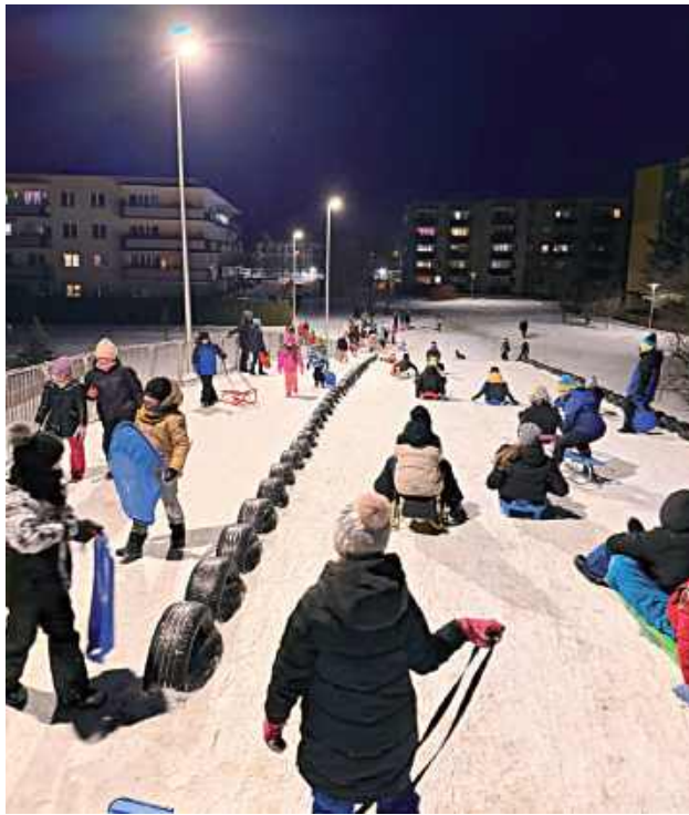
Odnowiona górka saneczkowa znów tętni życiem

Historia górki to dobry przykład tego, jak konsekwentne zmiany potrafią tchnąć nowe życie w miejską przestrzeń.