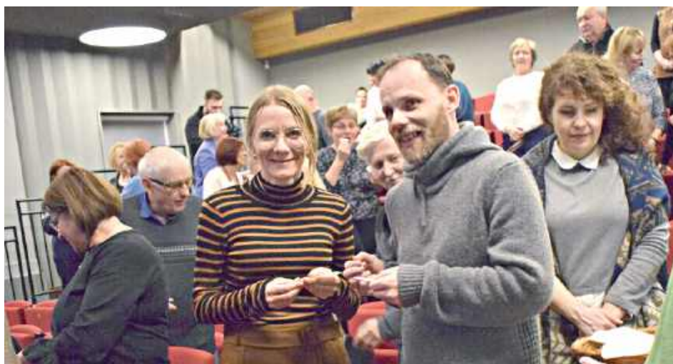
Regionaliści podzielili się opłatkiem