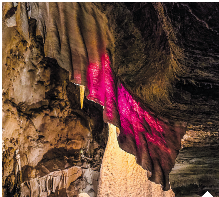
„Záclona”, czyli „Zasłona” – jedna z najbardziej niezwykłych formacji w czeskich Jaskiniach Javoříckich

Jaskinie kojarzą się przede wszystkim z atrakcją turystyczną. Tymczasem schodząc pod ziemię, trafiamy do miejsc, które od wieków pobudzają ludzką wyobraźnię. Naciekowe formacje przypominające świątynie, postacie czy zwierzęta, legendy związane z dawnymi władcami, ślady prehistorycznych mieszkańców i niezwykła gra światła sprawiają, że niektóre podziemne korytarze można odbierać niczym galerie sztuki stworzone przez naturę.