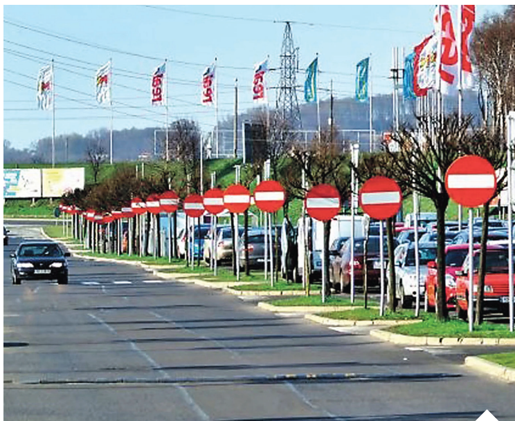
Znaki pionowe i poziome na drodze powinny ułatwiać kierowcy jazdę i informować go o faktycznych zagrożeniach. Ale nie u nas...

Podobnie jest ze znakami poziomymi. Polska została pokryta gęstą siecią linii ciągłych. Często absurdałnych, w miejscach, w których bez