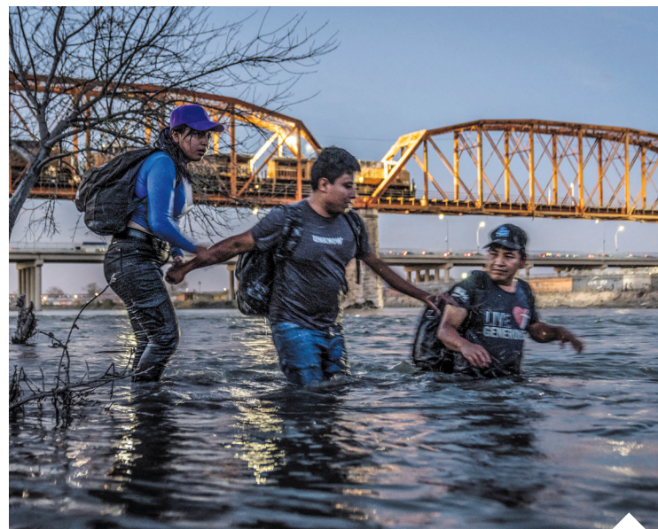
Nielegalna imigracja to nadal jedno z najpoważniejszych wyzwań dla bezpieczeństwa USA

Sąd przyznał, że były przypadki, w których tej procedury użyto do deportowania imigrantów, którzy nie powinni być w ten sposób potraktowani. Stwierdził jednak, że chociaż było to nielegalne, to winni temu byli funkcjonariusze służb imigracyjnych, którzy nieprawidłowo zastosowali prawo – i w żaden sposób