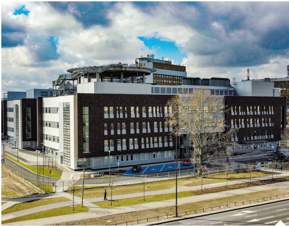
Sygnalista w wiadomościach do prezydenta Warszawy pisał: „Zarządzanie Szpitalem Południowym wymyka się normom etycznym, zdroworozsądkowym i merytorycznym”. Rafał Trzaskowski ten alarm lekarza zignorował

Na pokazanym materiale zaznaczono, że pacjent nie miał