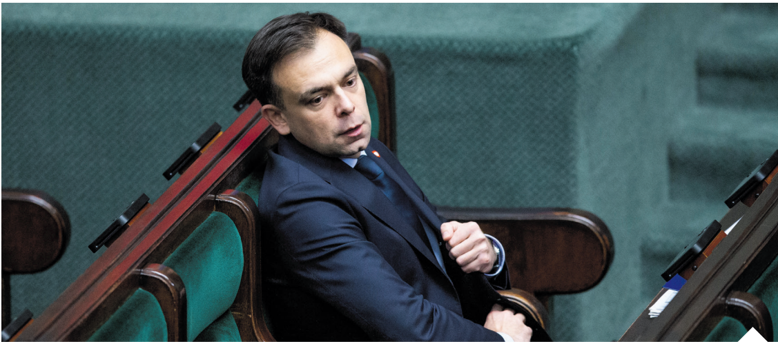
Pod presją przedsiębiorców resort finansów wycofał się z części nowych regulacji. Od 20 czerwca krajowy handel odzieżą i obuwiem nie podlega już systemowi SENT

Przedsiębiorcy przekonywali, że nowe obowiązki administracyjne utrudniają prowadzenie działalności, a dodatkowym problemem były wysokie sankcje za naruszenie przepisów. Minimalna kara została ustalona na poziomie 20 tys. zł. W odpowiedzi na nowe regulacje rozpoczęły