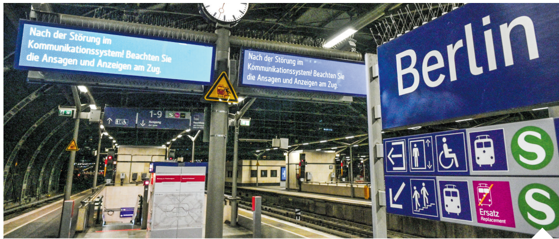
Slużby wykluczyły celowe działanie osób trzecich jako przyczynę paraliżu na kolei | fot. AA/ABACA/Abaca Press/Forum

W e wtorek późnym wieczorem doszło do ogólnokrajowej awarii cyfrowego systemu radiowego GSM-R w sieci Deutsche Bahn, która spowodowała niemal całkowite