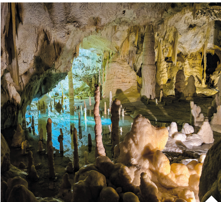
Frasassi – w części komór nacieki odbijają się w wodzie, tworząc krajobrazy przypominające scenografie filmów fantasy