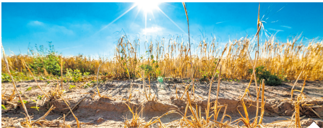
Szczególnie trudna sytuacja występuje w woj. kujawsko-pomorskim i mazowieckim, gdzie problem dotyka wszystkich gmin

Susza obejmuje już większość regionów w kraju i dotyka kolejne grupy upraw. Najbardziej zagrożone są zboża, ale także plantacje truskawek, sady, pola kukurydzy i rośliny strączkowe. Wraz z suszą powraca temat szacowania strat. Rolnicy chcą powrotu komisji na pola.