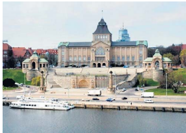
W nowelizacji budżetu zapisano 25 tys. zł na nagrody w konkursie na projekt modernizacji bulwarów nad Odrą

Przed głosowaniem doszło do dziwnej sytuacji związanej z inicjatywą radnych PiS, którzy w tej kadencji zasiadają w ławach opozycji. Radny Krzysztof Romianowski, zapowiedział, że chce się skupić na wątku społecznym zmian budżetowych. Dlatego klub zaproponował cztery poprawki dotyczące pod-