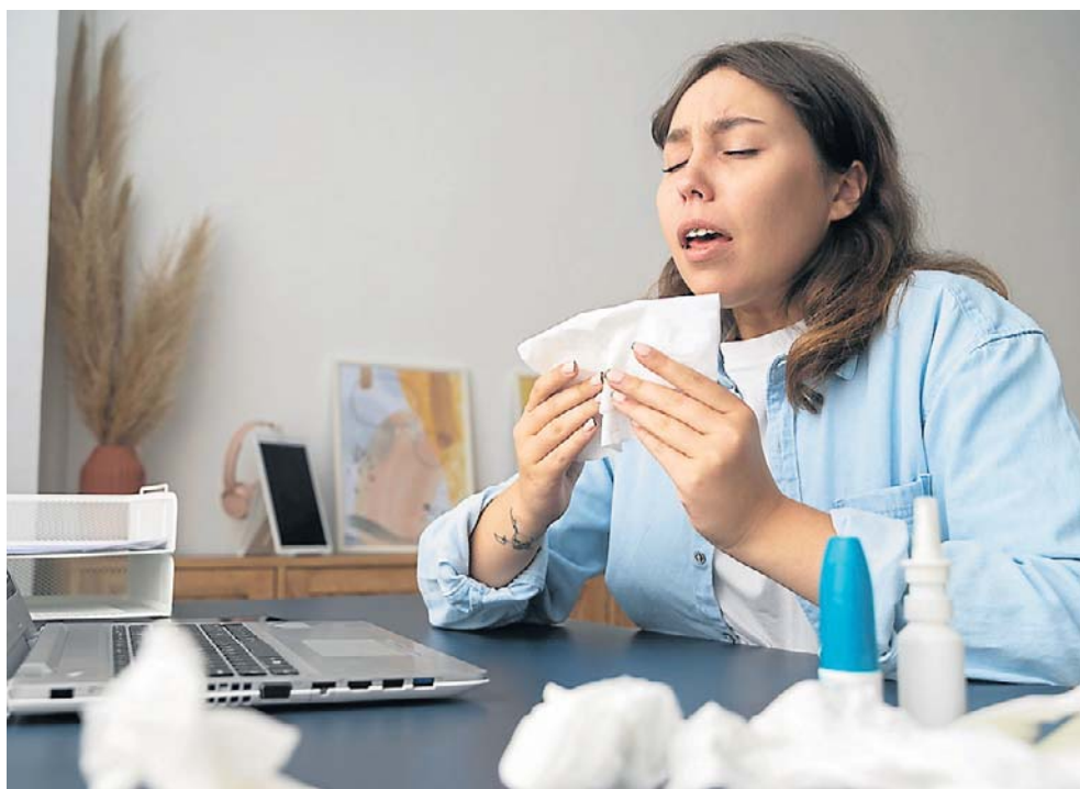
Jak odróżnić alergię od przeziębienia?

Alergia z kolei może wystąpić nagle, szczególnie w odpowiedzi na kontakt z alergenem,