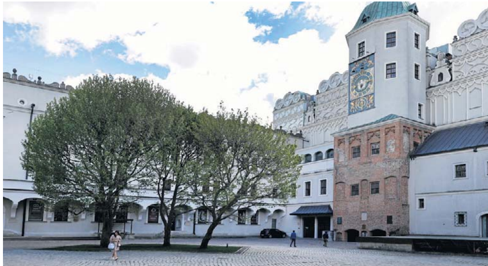
Remont dziedzińców to zwieńczenie kompleksowej modernizacji Zamku Książąt Pomorskich. W planach jest jeszcze nowe oświetlenie

- To będzie zwieńczenie kompleksowej modernizacji Zamku Książąt Pomorskich - zawyrokował tuż przed podpisaniem umowy z wykonawcą