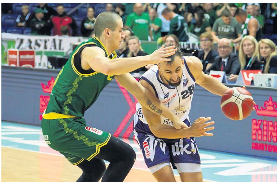
Kto lepiej otworzy play-offy? Wyżej stoją notowania Kinga