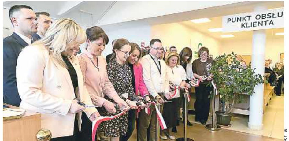
Oficjalnego przecięcia wstęgi dokonali sami zainteresowani, czyli pracownicy.

W Siedlcach rozważano oba scenariusze, ale ostatecznie wybrano ten pierwszy. Wymagało to rozmów z prezesem sieci