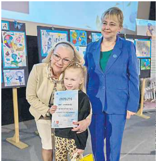
Najważniejszym momentem było wręczenie nagród laureatom.

Uroczysty finał w Siedlcach 9 kwietnia w Kinie Helios