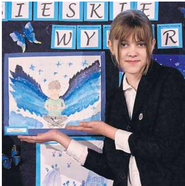
Konkurs plastyczny „Niebieskie skrzydła wyobraźni”.

Najważniejszym momentem było wręczenie nagród laureatom – młodym artystom, których prace zachwyciły jury oryginalnością i wrażliwością. Nagrodzone dzieła, pełne fantazji i niebieskich akcentów, stały się symbolem wyobraźni bez granic.