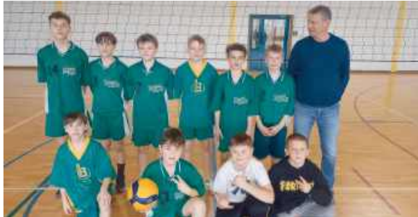
Młodsza grupa triumfowała na Powiatowych Igrzyskach.

Choć jest niezbyt duża wsią, uczniowie tutejszej szkoły odnoszą kolejne sukcesy w siatkówce i minisiatkówce chłopców.