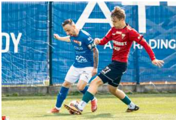
Pogoń przegrywa z GKS Tychy po meczu bez jakości i pomysłu.