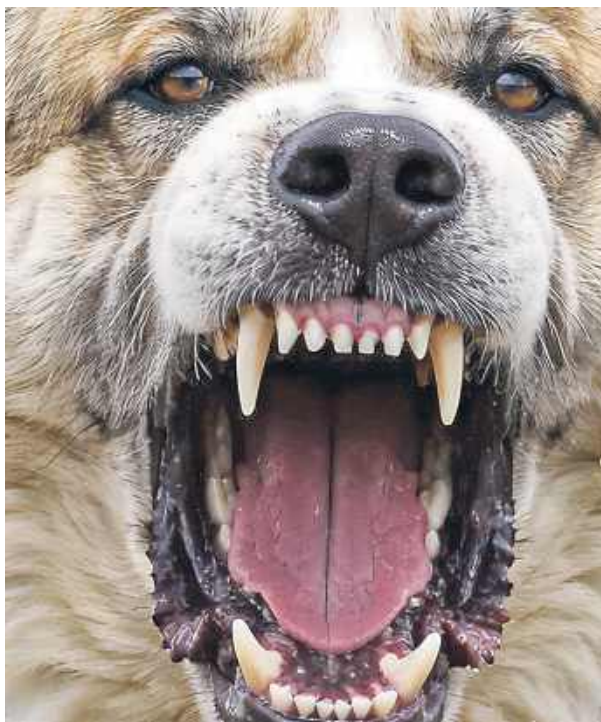
– Psy wpadają w taką furję, że aż ziemia drży – mówią mieszkańcy.

Z relacji mieszkańców wynika, że w przeszłości zwierzęta nie zawsze przebywały tylko na