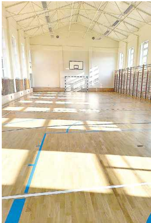
Zmodernizowana sala gimnastyczna w szkole w Borkach-Kosach

Równolegle przeprowadzono modernizację przeciwpożarowej instalacji hydrantowej w ca-