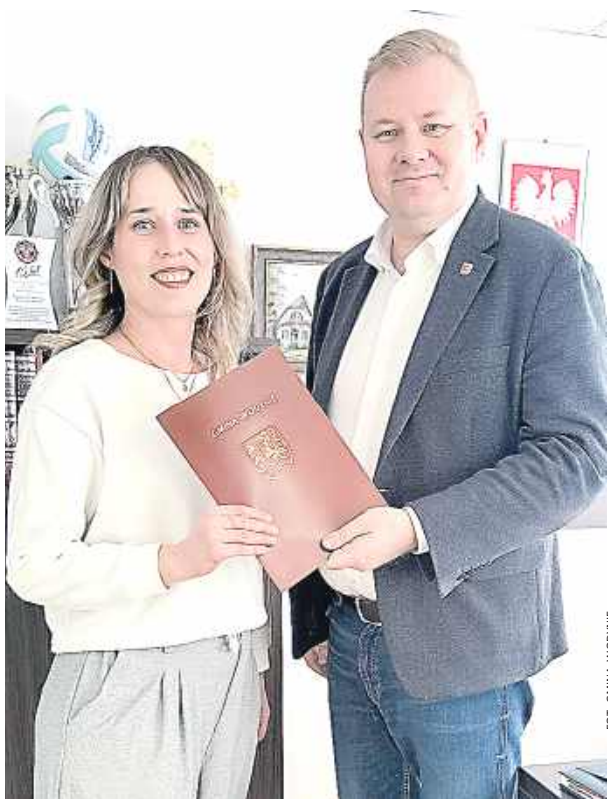
Etap projektowy jest kluczowy dla całej inwestycji.

Inwestycja ta ma szczególne znaczenie dla lokalnej społeczności, ponieważ Oleśnica jest jedną z większych miejscowości w gminie, w której dotychczas nie funkcjonował wyodrębniony, dedykowany budynek świetlicy wiejskiej. Oznacza to brak