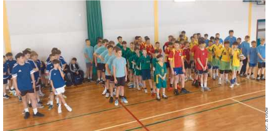
Starsza grupa też pokonała rywali.

Z kolei 31 marca w Skórcu odbył się finał Powiatowych Igrzysk Młodzieży w piłce siat-