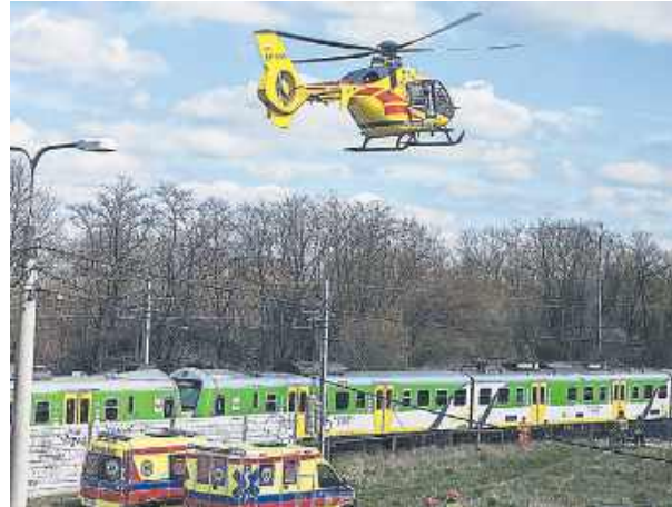
W akcji brał udział śmigłowiec LPR.

Do zdarzenia doszło 13 kwietnia po godzinie 13, na trasie między stacjami Siedlce Zachodnie a Siedlce, w okolicach ulicy Przymiarki. Z niewyjaśnionych na tę chwilę przyczyn pod nadjeżdża-