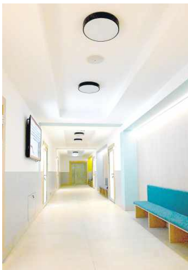
W szkole w Izdebkach-Kosnach wyremontowano korytarz.

Szkoła Podstawowa w Krzesku-Królowej Niwie jako pierwsza w ubiegłym roku wkroczyła w nową, ekologiczną erę funkcjonowania. Od stycznia 2025 r.