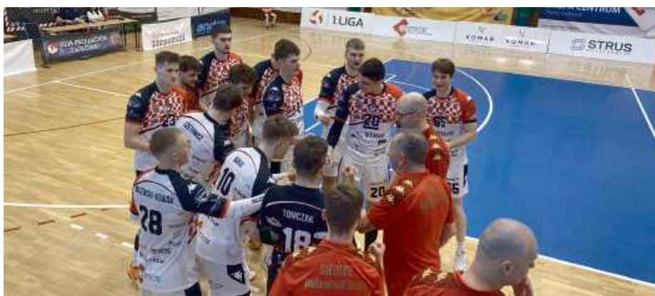
KPS Siedlce może schodzić z parkietu z podniesioną głową.

Sobotnie spotkanie miało w Siedlcach wyjątkową atmosferę. KPS, jako drużyna silnie związana z regionem, mógł li-