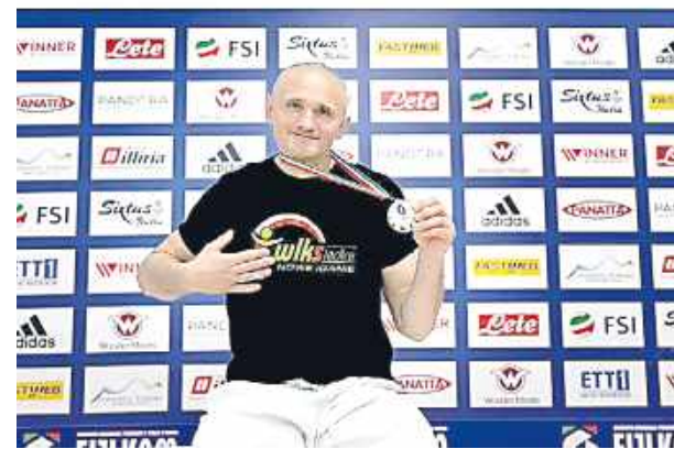
Złoty medal to kolejny ważny rozdział w sportowej historii.

Świetny występ przełożył się na końcowy triumf w kategorii i kolejne złoto w dorobku klubowym WLKS. To kolejny dowód na utrzymanie bardzo wysokiej formy przez zawodnika oraz konsekwentną pracę treningową.