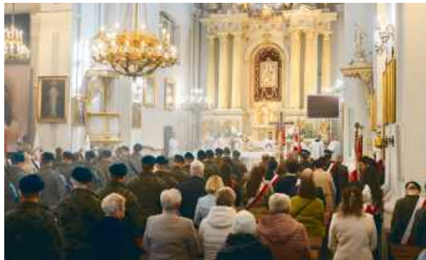
W murach kościoła św. Stanisława wybrzmiała wspólna modlitwa.

Wskazał również na trudny proces odzyskiwania prawdy. – To rana, która przez dziesięciolecie była zakłamywana i przemilczana, a mimo to przetrwała w sercach rodzin ofiar