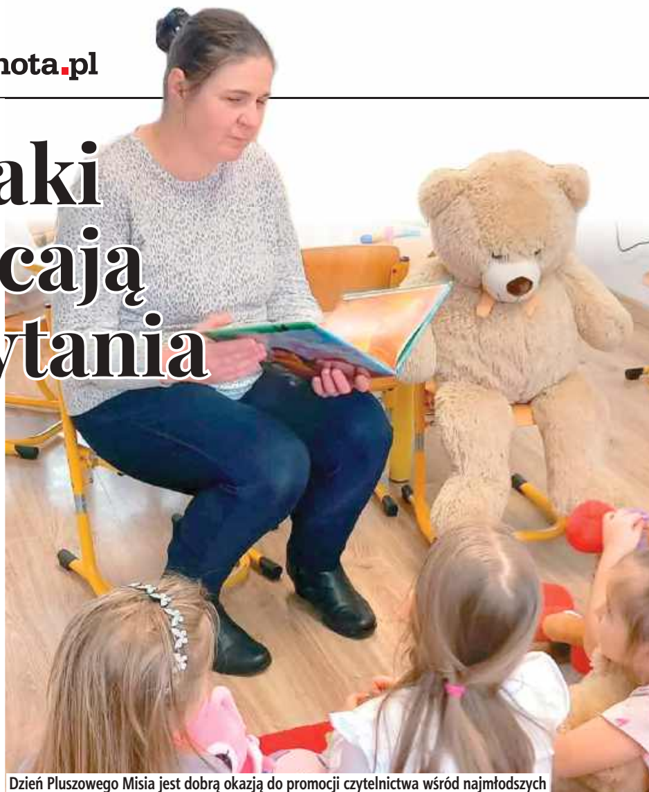
Dzień Pluszowego Misia jest dobrą okazją do promocji czytelnictwa wśród najmłodszych