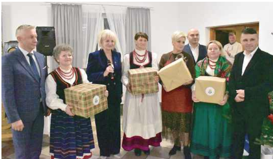
W konkursie dla Kół Gospodyń Wiejskich na prowiant przetrwania wygrały reprezentacje z: Grabowa Ryckiego, Starej Rokitni, Rososzy oraz Kletni