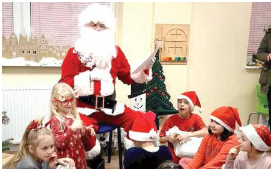
W Kuźni Uśmiechu dzieci przygotowywały bożonarodzeniowe dekoracje, a także miały okazję spotkać Świętego Mikołaja, który obdarował je prezentami. To był czas radości, kreatywności i wspólnej zabawy

Kulminacyjnym punktem tego świątecznego wydarzenia