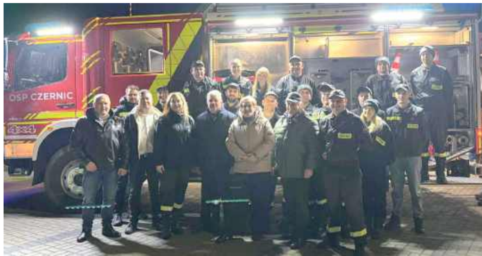
Nowe auto dla OSP Czernic