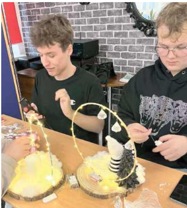
Uczniowie bardzo się starali i stworzyli piękne ozdoby świąteczne, pokazując swoje umiejętności plastyczne

W Zespole Szkół Zawodowych nr 2 w Dęblinie odbył się konkurs na najpiękniejszą dekorację świąteczną.