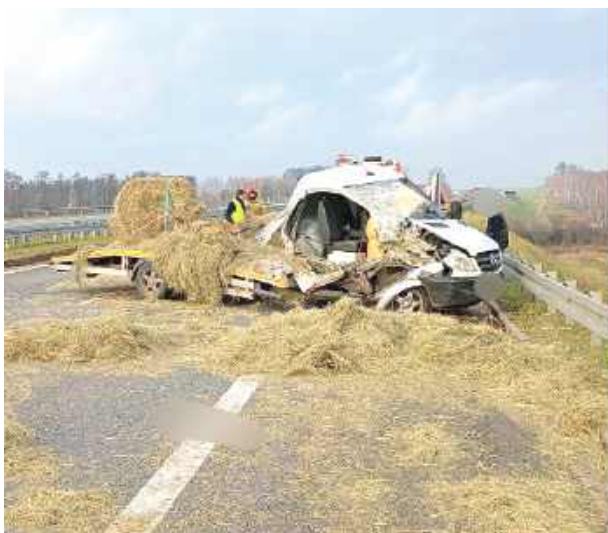
Ciężarówką MAN kierował 41-letni mieszkaniec powiatu ryckiego. W wyniku zdarzenia uszkodzone zostały oba pojazdy, w tym auto laweta, na której znajdował się inny samochód dostawczy

Zderzenie pojazdów dostawczych w rejonie Chrustnego