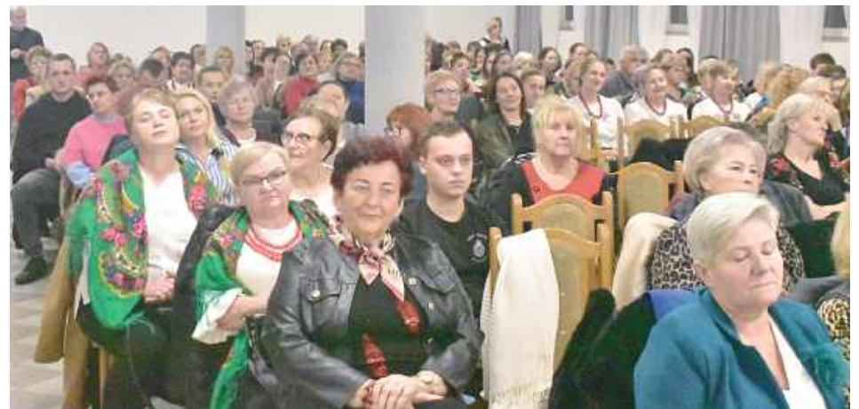
W wydarzeniu wzięło udział przeszło 200 osób