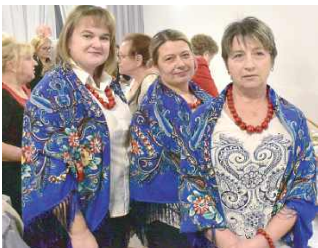
Przedstawicielki z KGW Niedźwiedz