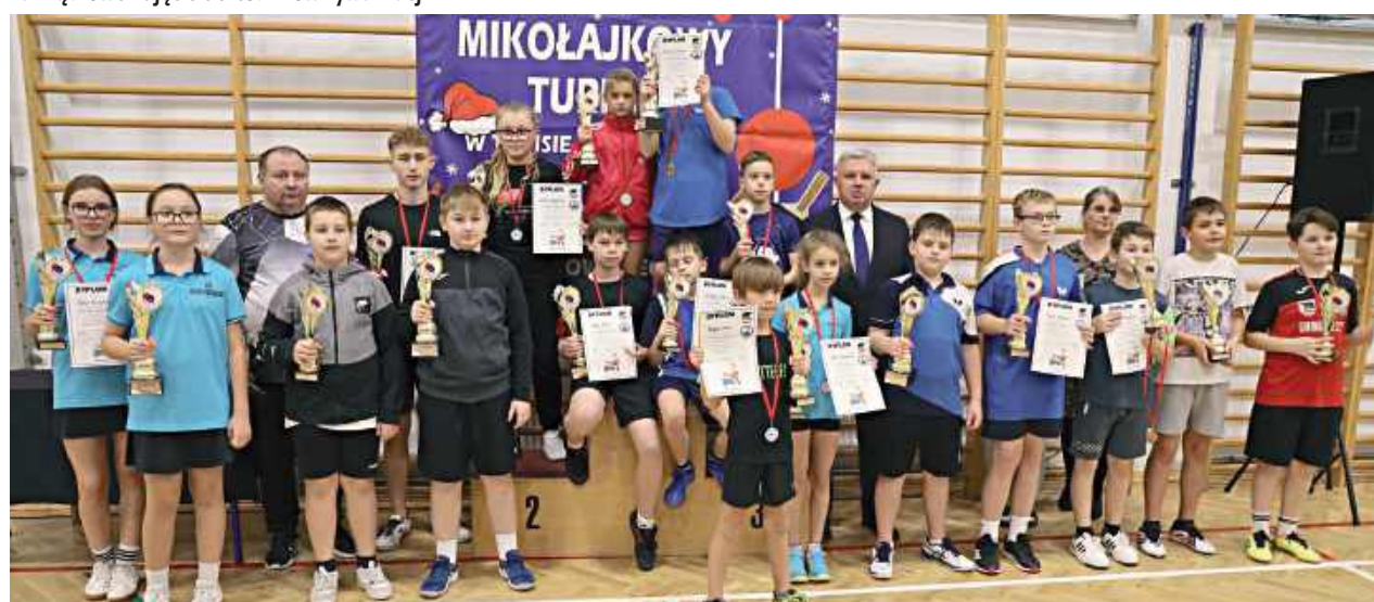
Najlepsi z najlepszych na wspólnym zdjęciu

W Kłoczewie rozegrano IV Mikołajkowy Turniej Tenisa Stołowego o Puchar Wójta Gminy Kłoczew, który zgromadził młodych zawodników ze szkół podstawowych z kilku powiatów regionu.