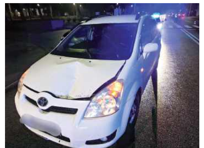
Kobieta została potrącona na oznakowanym przejściu dla pieszych przez samochód osobowy. Kierowcy zatrzymano prawo jazdy

W czwartek nad ranem, przed godziną 6 na ulicy Warszawskiej w Rykach, w rejonie dworca PKS, doszło do poważnego wypadku drogowego z udziałem pieszej.