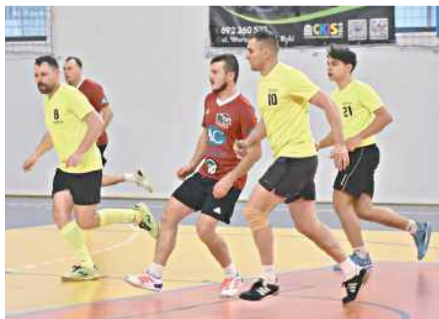
Roztentegowywacze pewnie wygrali z DoRyk Team i po trzech kolejkach mają komplet punktów!