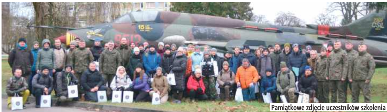
Pamiątkowe zdjęcie uczestników szkolenia

W Centrum Szkolenia Inżynieryjno-Lotniczego w Dęblinie odbyło się szkolenie w ramach pilotażowego Programu Powszechnych Dobrowolnych Szkoleń Obronnych „#wGotowości”. Inicjatywa ma na celu przygotowanie obywateli do właściwego reagowania w sytuacjach kryzysowych oraz podniesienie ogólnego poziomu bezpieczeństwa społeczeństwa.