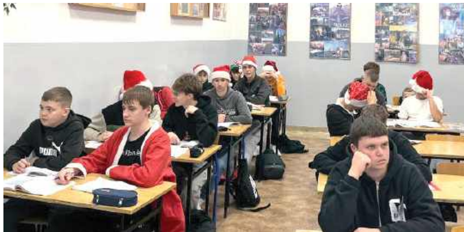
Uczniowie, zgodnie z tradycją, przyszli do szkoły ubrani w świąteczne stroje, a w klasach panowała radosna i pełna życzliwości atmosfera.

W Zespole Szkół Zawodowych nr 1 w Dęblinie 5 grudnia ponownie zagościł mikołajkowy nastrój. Uczniowie, zgodnie z tradycją, przyszli do szkoły ubrani w świąteczne stroje, a w klasach panowała radosna i pełna życzliwości atmosfera.