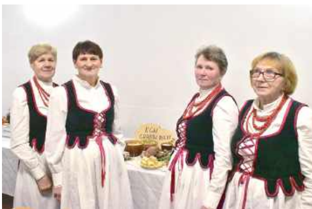
Panie z KGW Grabów Rycki otrzymały wyróżnienie. Brawo!