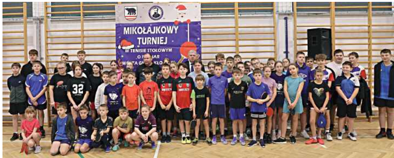
Pamiątkowe zdjęcie uczestników rywalizacji