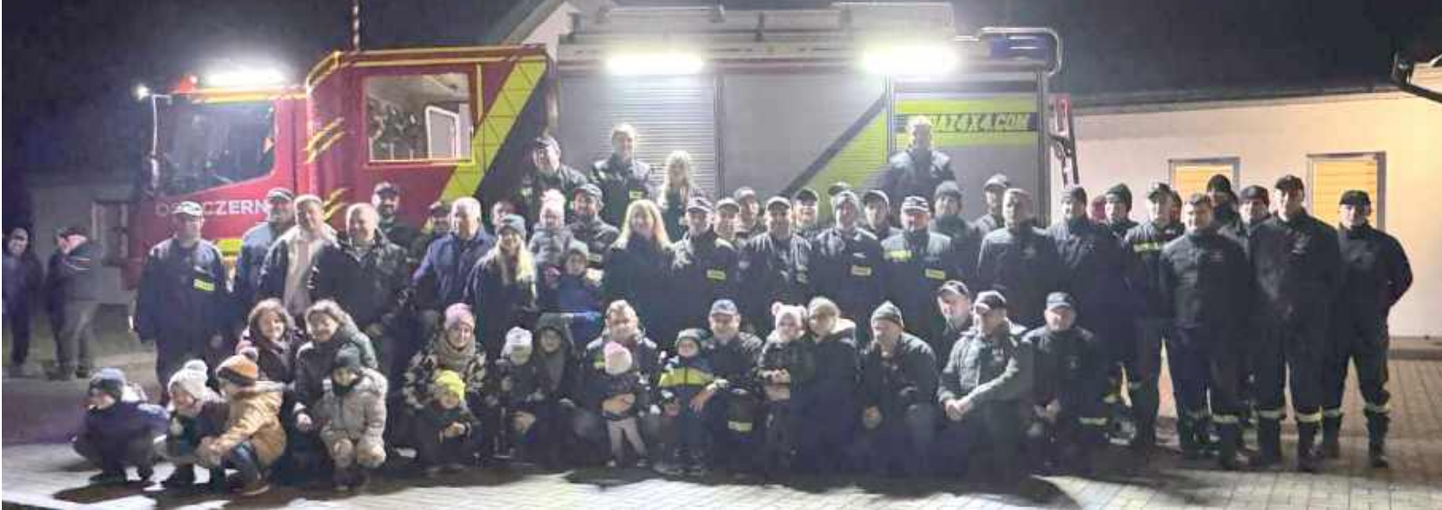
Powitanie było niemal królewskie. Nowe wozy wkrótce rozpoczną służbę na terenie gminy

Gmina Kłoczew odnotowała w ostatnich dniach jedno z największych wzmocnień służb ratowniczych w swojej historii.