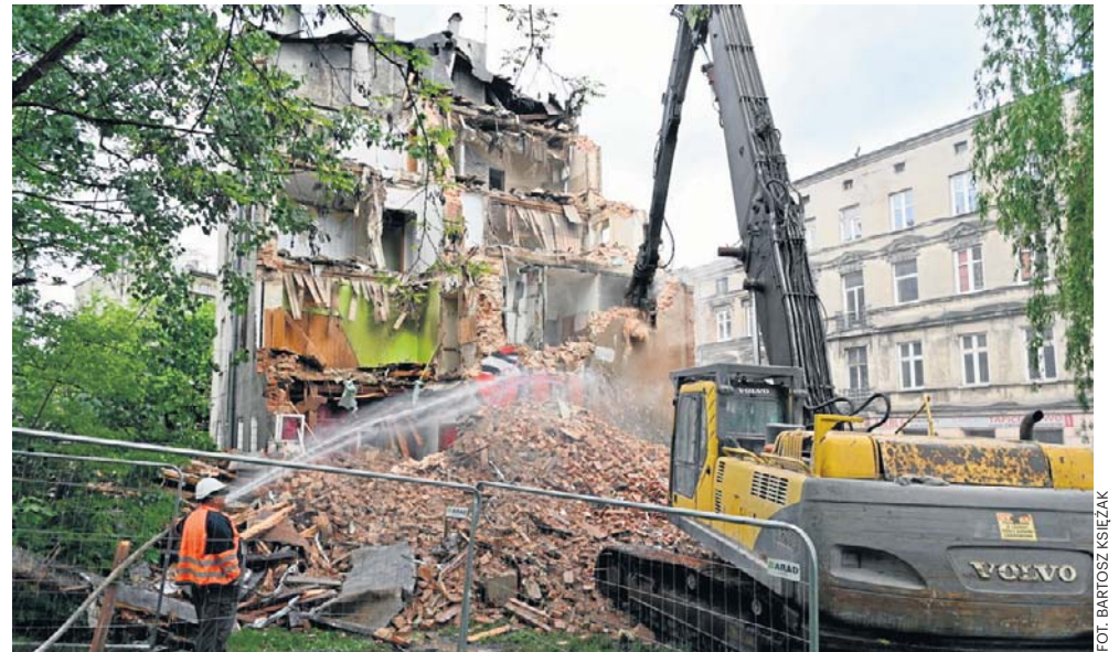
Podczas wojny kamienica przy Franciszkańskiej 8 znalazła się na zapleczu Getta. W latach 1940-44 funkcjonowała w niej kuchnia dla mieszkańców Getta

Kamienica Arbejtera miała wpasować się w narożnik