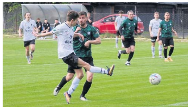
MKP-Boruta II Zgierz (białe stroje) już w Klasie Okręgowej