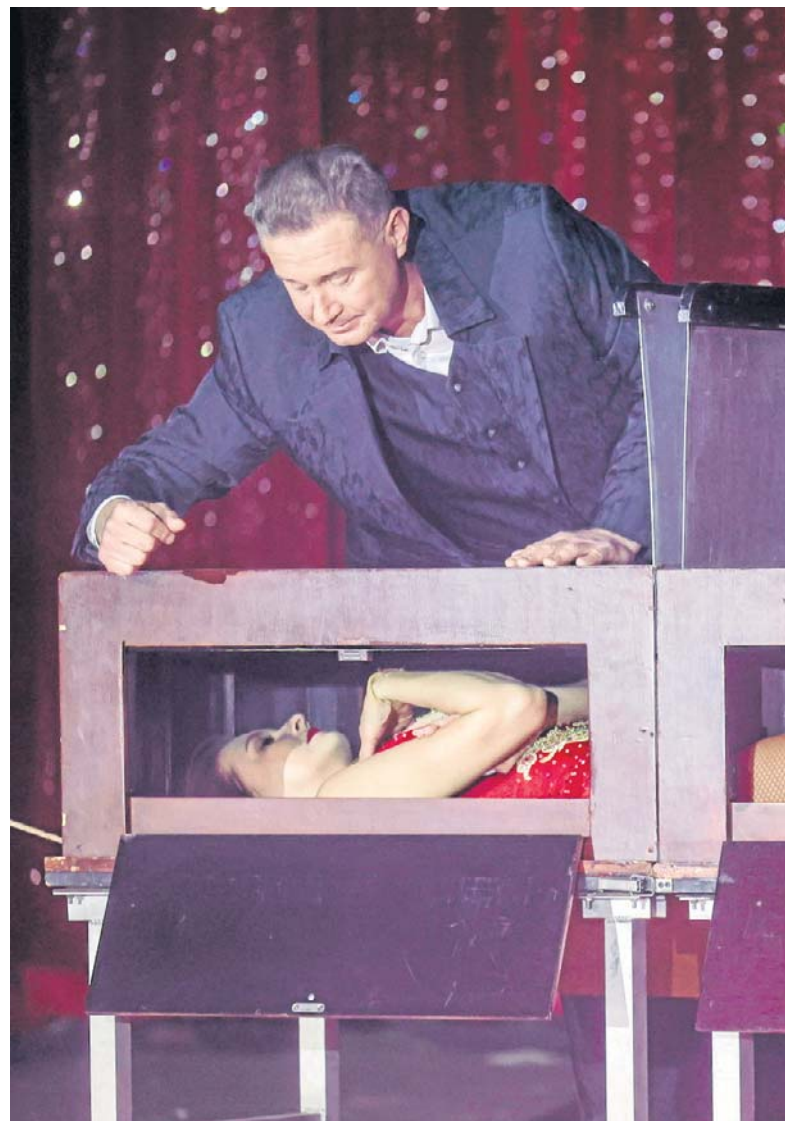
FOT. ADAM JASTRZĘBOWSKI