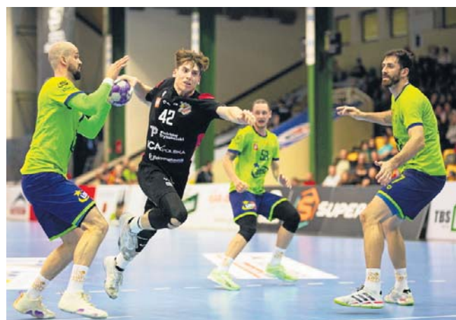
Piotrkowianin (czarne stroje) pokonał w Hali Relax Lotto Puławy i będzie grał o utrzymanie w barażach z Pogonią

Piotrkowianin-Lotto Puławy 40:37 (18:17).