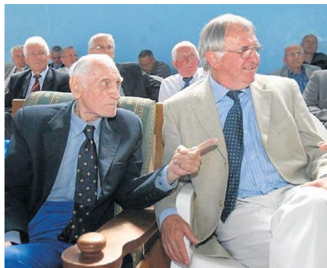
Kazimierz Górski 1974 i Antoni Piechniczek 1982 zdobyli z reprezentacją Polski medale na mundialach

W tym gronie mogli być Kazimierz Górski, Antoni Piechniczek, a na pewno selekcjoner Polski 1978 Jacek Gmoch. ©©