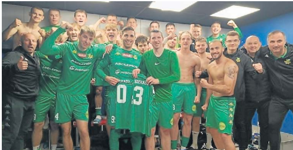
Jest zwycięstwo, to jest i okazja do radości. Piłkarze Warty Sieradz strzelili trzy gole w Wasilkowie i pokonali tamtejszy KS 3:0. Droga do drugoligowych baraży jeszcze daleka