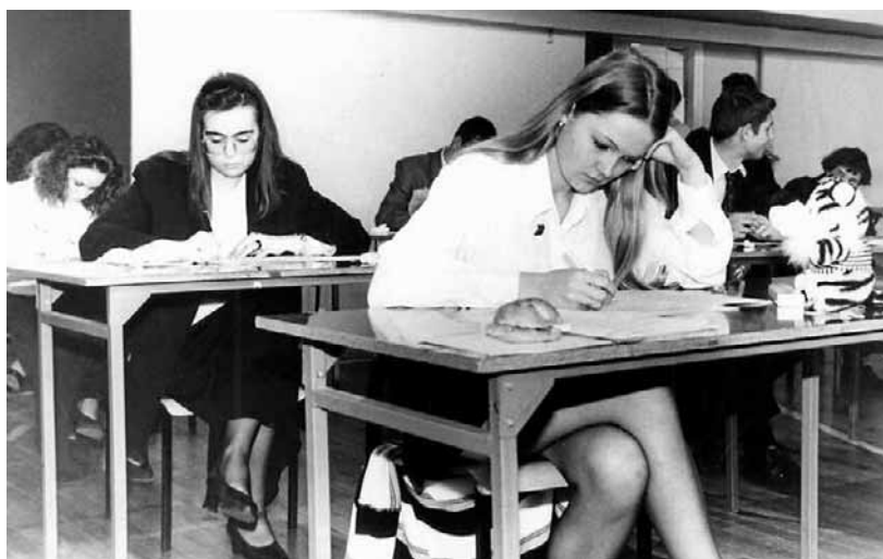
Maskotki na ławce miały przynieść szczęście zdającym. Taki talizman zabierali ze sobą niemal wszyscy

W Łodzi, gdzie dominowała klasa robotnicza, rozwój szkolnictwa średniego miał szczególne znaczenie. Powstawały nowe licea i technika, a dostęp do edukacji był coraz szerszy. Sama matura jednak wciąż miała charakter bardziej „wewnętrzny”. Tematy maturalne były często ustalane centralnie przez Ministerstwo Edukacji lub lokalnie przez kuratoria oświaty, a następnie przekazy-