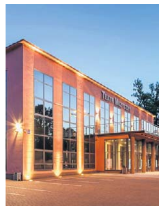
Teatr Muzyczny w Łodzi wystawi „Krajinę lodu”

Teatr Muzyczny w Łodzi przygotowuje casting do głównych ról w pierwszej polskiej produkcji broadwayowskiego megahitu. Zaplanowano go w dwóch etapach. W pierwszym zainteresowani powinni do 1 czerwca przesłać do teatru zgłoszenie (w tym tzw. self-tape) z krótką informacją o sobie i dotychczasowym doświadczeniu oraz z wykonaniem utworów wskazanych w ogłoszeniu do wybranej roli. Szczegóły dotyczące castingu,