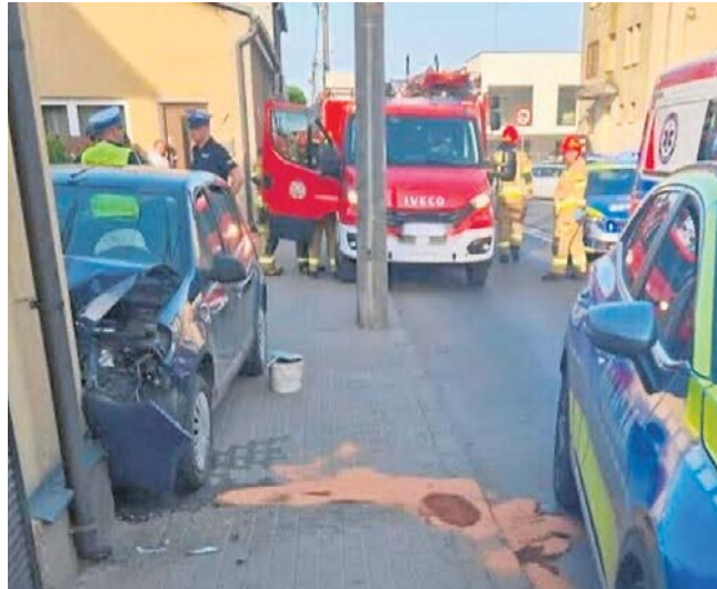
Jak wynika ze wstępnych ustaleń, 37-letni mieszkaniec gminy Poddębice podczas kierowania pojazdem stracił przytomność, w wyniku czego zjechał na prawą stronę jezdni i uderzył w ścianę budynku mieszkalnego

Policji w Poddębicach mł. asp. Alicja Bartczak, do zdarzenia na drodze krajowej nr 72 (którą stanowi ul. Łódzka) doszło w kierunku Uniejowa. Jak wynika ze wstępnych ustaleń, 37-letni mieszkaniec gminy Poddębice podczas kierowania Dacją stracił przytomność, w wyniku czego zjechał na prawą stronę jezdni i uderzył w ścianę budynku mieszkalnego. Pięć podróżujących autem osób przewieziono do szpitala na badania, w wyniku których obrażenia stwierdzono u dwóch z nich. Według obecnych informacji ich życiu i zdrowiu nie zagraża niebezpieczeństwo. Badanie wykazało, że kierujący był w stanie po użyciu alkoholu. Stwierdzono u niego 0,4 promila.