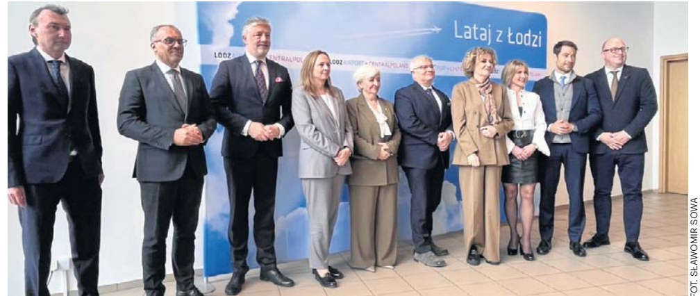
Podpisanie listu intencyjnego w sprawie współpracy między łódzkim lotniskiem a CPK zgromadziło szerokie gremium notabli z Warszawy i Łodzi. Bardzo szerokie

- Chcemy przede wszystkim myśleć o kształceniu kadr, o tym, żeby tutaj przyszli pracownicy zdobywali doświadczenie, abyśmy tutaj mogli też przeprowadzać testy i badać skuteczność pewnych rozwiązań. Lotnisko w Łodzi będzie naturalnym zapleczem i jeśli chodzi o rozwiązania techniczne i jeśli chodzi o kwestie zapotrzebowania