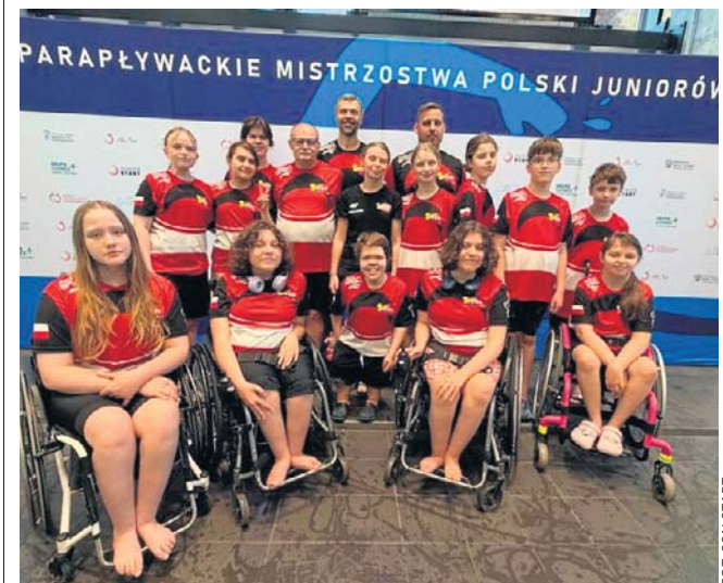
Reprezentanci SSN Start odnieśli bardzo duże sukcesy na parapyłwackich mistrzostwach Polski