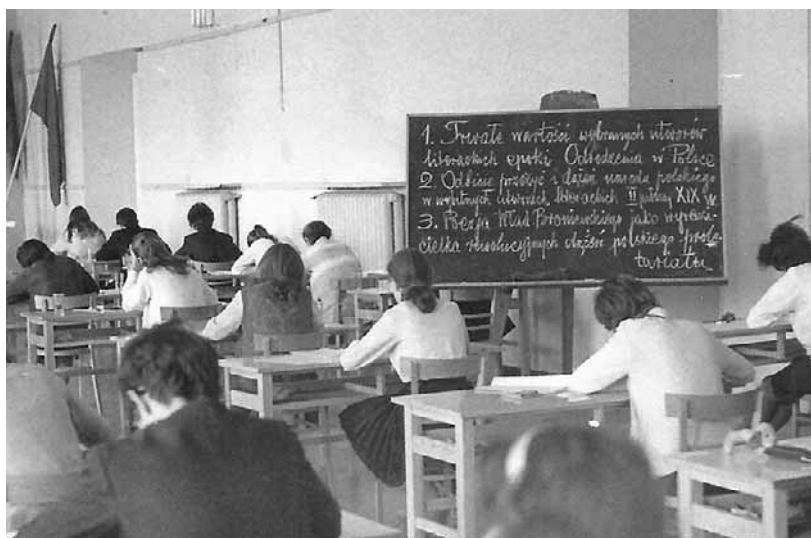
Matura z języka polskiego. Jak widać, zamiast arkuszy z owianymi tajemnicą tematami: tablica i kreda