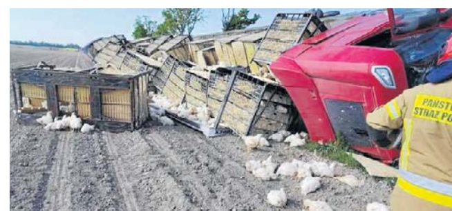
Jak informują wieluniscy strażacy, ciężarówka, która przewróciła się w Popowicach przewożyła ponad 4,6 tys. kurczaków, z których nawet jedna czwarta mogła nie przeżyć wypadku

Jak z kolei informuje Komenda Powiatowa Państwowej Straży Pożarnej w Wieluniu, ciężarówką przewożonych było 4620 kurczaków. Jak szacują strażacy, wypadku mogła nie przeżyć jedna czwarta z nich, co daje ponad tysiąc sztuk.