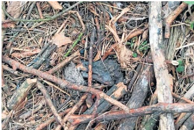
Lasy w rejonie Poddebic straciły parę bielików, które już w to miejsce nie wrócą

Dziennik Łódzki ☎ 42 715 80 68 bok.prenumerata@polskapress.pl prenumerata.dzienniklodzki.pl