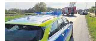
19-letni kierowca stracił panowanie nad pojazdem

- Na miejsce skierowany został patrol ruchu drogowego, który ustalili, że w zdarzeniu uczestniczył jeden pojazd marki Opel Vectra kierowany przez 19-latkę. Z relacji świadków wynika, że mężczyzna podczas omijania oczekującego na skręt osobowego BMW stracił panowanie nad pojazdem i uderzył w słup energetyczny, a następnie doprowadził do dachowania. W pojeździe podróżowało troje pasażerów w wieku od 18 do 20 lat. Wszyscy uczestnicy to mieszkańcy powiatu wierszowskiego. W wyniku zdarzenia hospitalizowany został kierujący pojazdem oraz 18-letni pasażer - relacjonuje st. asp. Piotr Siemicki, oficer prasowy