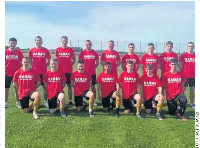
Piast Błaszki wygrał derbowy mecz z Kalinową 7:1, a triumf zadeedykował kontuzjowanemu Albertowi Kamańczykowi