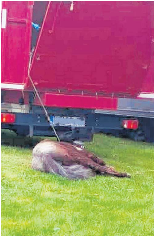
Cierpiący kuc przywiązany do samochodu