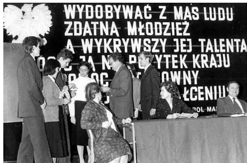
Matura w czasach PRL przestała być przywilejem wąskiej grupy, choć nie była tak powszechna jak dziś

wane do szkół. Często zdarzało się, że tematy były kopertowane i otwierane dopiero w dniu egzaminu, a nauczyciel wypisywał je na tablicy w sali, gdzie zasiadali piszący. W okresie PRL tematy maturalne były mocno przesycone ideologią socjalistyczną, a ich przygotowaniem sterowały władze oświatowe podległe politycznie. Prace maturalne sprawdzali i oceniali nauczyciele z danej szkoły. Zнали oni doskonale swoich uczniów i ich możliwości.