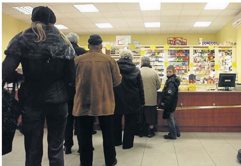
Do aptek trafia czasami raptem kilka opakowań leku, a potrzeby pacjentów są większe

Nie jedz byle gdzie i nie śpij z byle kim Z wojaży przywozimy malarię i choroby weneryczne str. 3