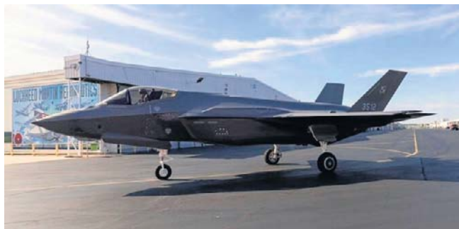
Amerykane dostarczą naszym siłom powietrznym trzydzieści dwa samoloty