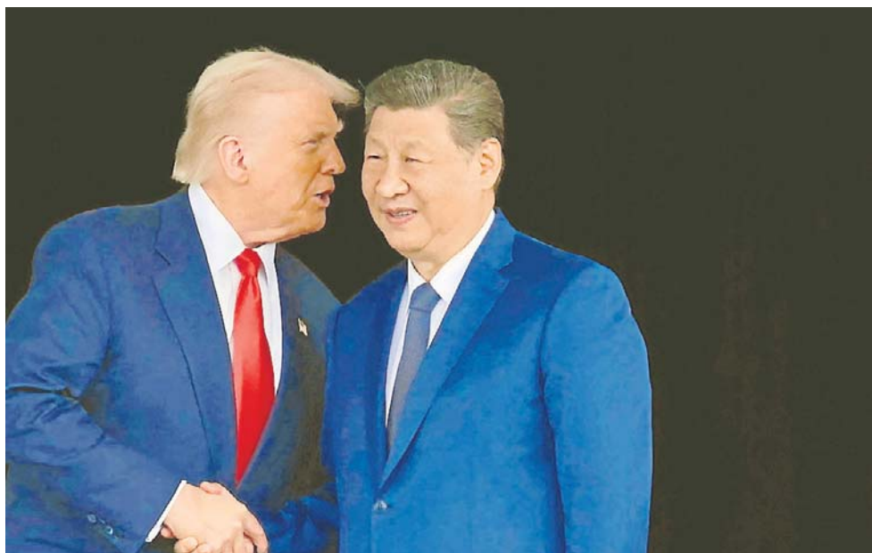
Przywódcy USA i Chin podczas ostatniego spotkania w październiku 2025 roku w Korei Południowej

Jak zapowiedziała wice-rzeczniczka Białego Domu Anna Kelly, porozumienia mają na celu zrównoważenie handlu USA z Chinami. Przedstawiciele Białego Domu nie zdradzili wielu szczegółów na temat tych planów. Zaprzeczyli jednak informacjom, by Chiny miały złożyć propozycję „potężnych” inwestycji w USA. Zaznaczyli też, że zawarty w ub.r. układ z Chinami, dotyczący zawieszenia przez Pekin restrykcji eksportowych na metale ziem rzadkich, nadal jest w mocy. Porozumienie ma trwać do października, lecz urzędnicy Białego Domu odmówili deklaracji, czy zostanie przedłużone.