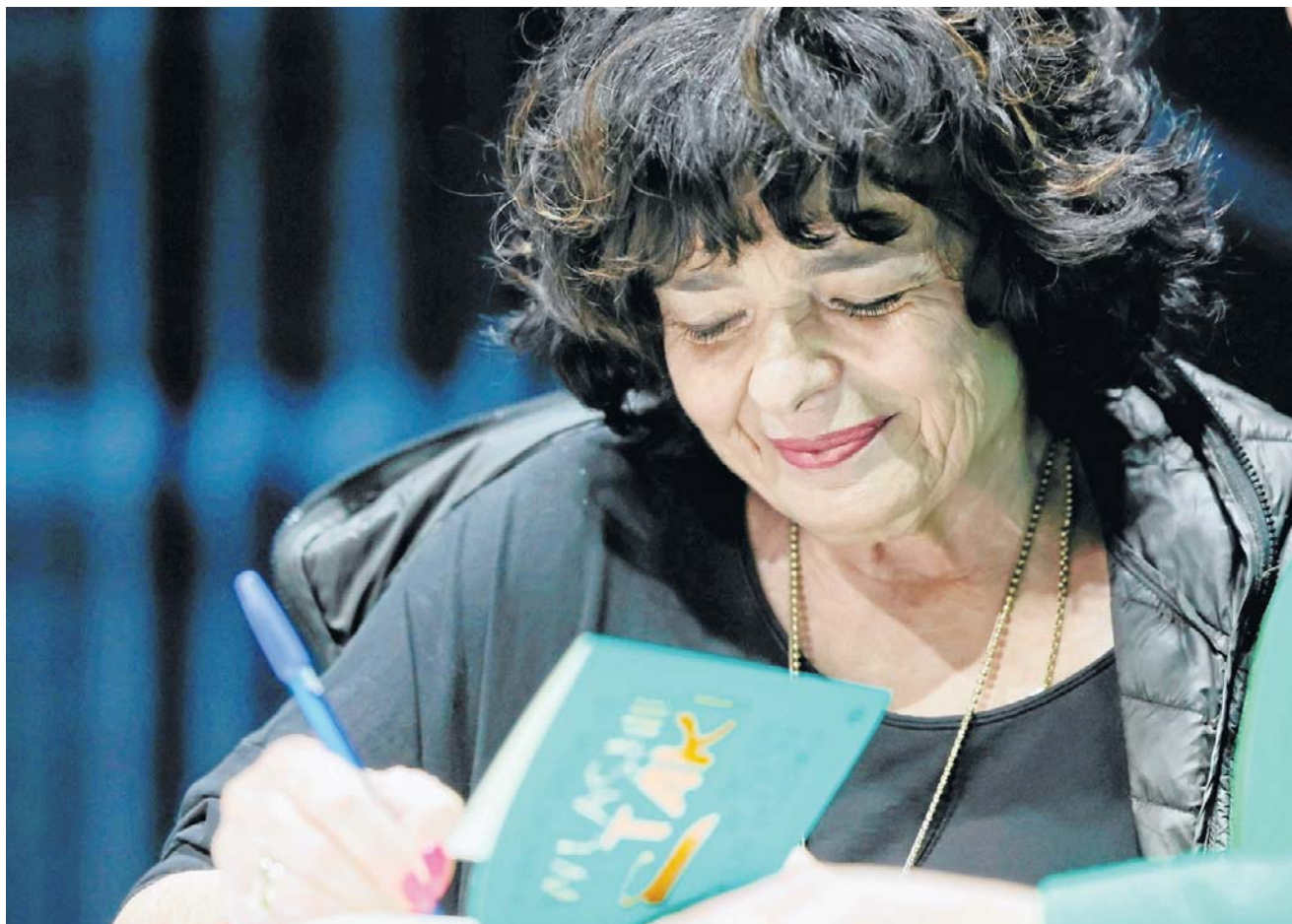
Katarzyna Grochola: Warto budzić się każdego dnia z wdzięcznością za to, co się stało. I z nadzieją, że dziś będzie wspaniały dzień

Wyobraźmy sobie taką scenę: siedzi pani w kuchni, wchodzi