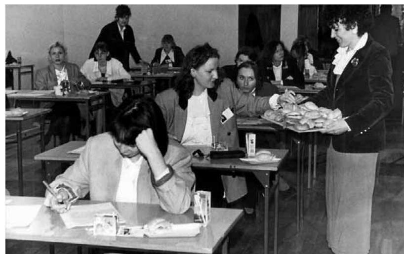
Łódzcy maturzyści sprzed lat podczas egzaminu mogli posilić się kanapkami przygotowywanymi przez mamy