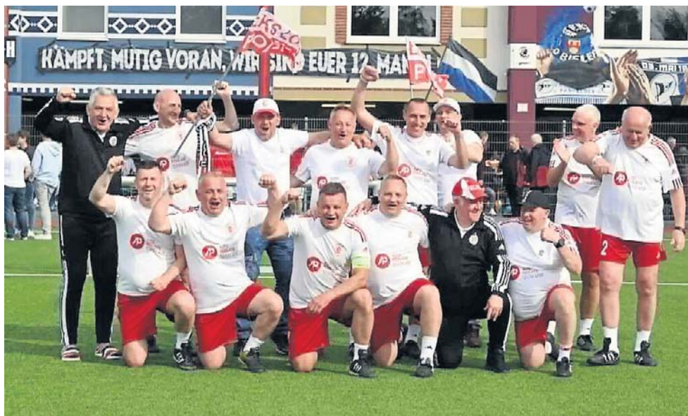
Zwycięzcy turnieju w Bielefeld - drużyna ŁKS Łódź Walking Futbol

Jesteśmy dumni, że jako jedyni zremisowaliśmy mecz z ŁKS. Grają świetnie ale poza tym, to bardzo sympatyczni lu-