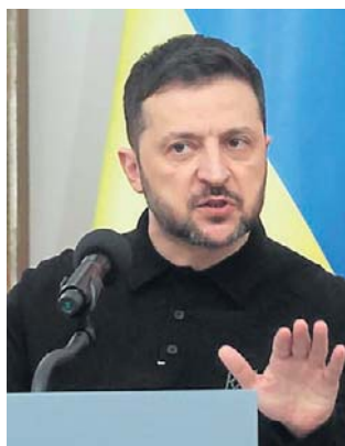
„Rosja zdecydowała o zakończeniu ciszy”

„Rosja sama zdecydowała o zakończeniu częściowej ciszy, która utrzymywała się przez kilka dni. Tej nocy wystrzeliła przeciwko Ukrainie ponad 200 dronów uderzeniowych. Na froncie ponownie użyto bomb lotniczych - ponad 80, odnotowano także ponad 30 uderzeń lotniczych” - napisał Zelenski w serwisach społecznościowych.