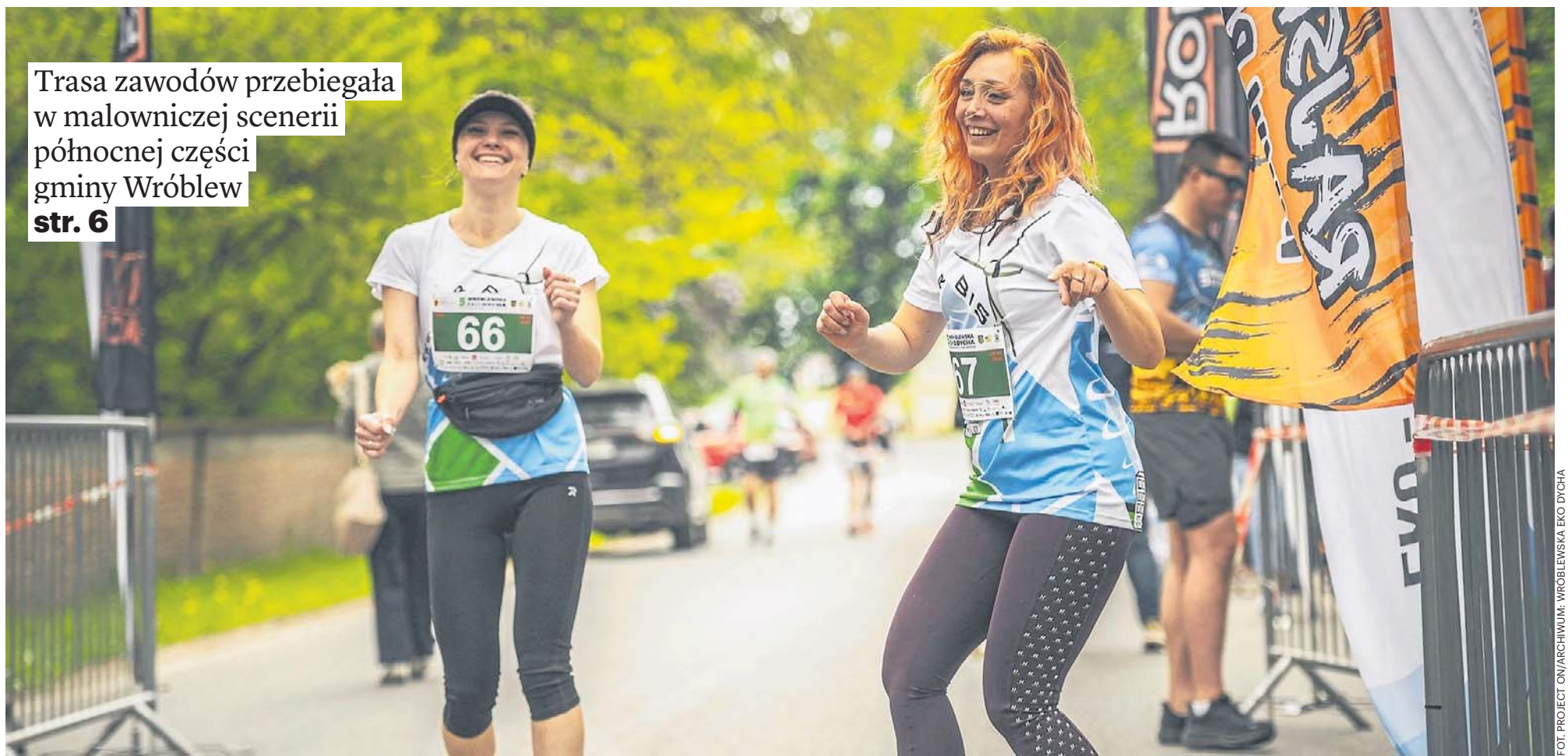
FOT. PROJECT ON/ARCHIWUM: WRÓBLEWSKA EKO DYCHĄ

Trasa zawodów przebiegała w malowniczej scenerii północnej części gminy Wróblew str. 6