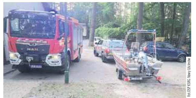
W akcji ratowniczej brały udział jednostki straży pożarnej z powiatu lubartowskiego i z Lublina

Do tragedii doszło w niedzielę, 28 czerwca około godz. 18.