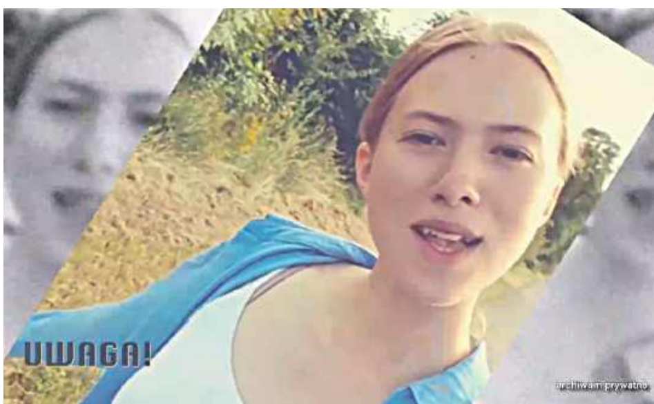
W programie „UWAGA!” matka Gabrieli opowiada o córce, pokazuje jej zdjęcie, na którym widać uśmiechniętą, pełną życia nastolatkę...