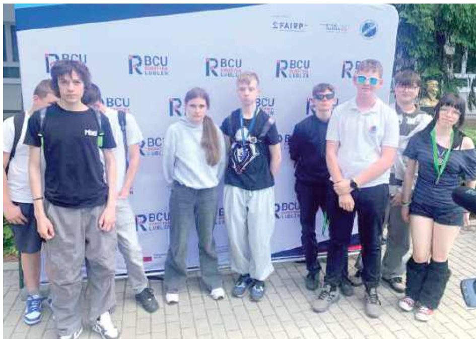
Do finału zakwalifikowało się aż 12 uczniów SP 2 im. Królowej Jadwigi w Parczewie

Do finału I Wojewódzkiego Konkursu Wiedzy o Cyberbezpieczeństwie i Nowych Technologiach „CyberMind” zakwalifikowało się aż 12 uczniów SP 2 im. Królowej Jadwigi w Parczewie.