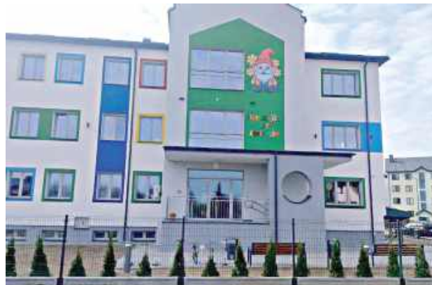
Za 10,9 mln zł budynek został zaadaptowany na przedszkole publiczne z oddziałem żłobkowym

Przedszkole przeniosło się na Harcerską na wiosnę tego roku.