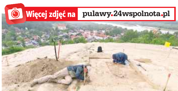
Podczas prac wykopaliskowych w miejscu odnalezienia czaszki archeolodzy odkryli dwa groby dziecięce

Oględziny konserwatorskie potwierdziły, że zabezpieczone przez policję szczątki pochodzą ze zniszczonego w wyniku intensywnych procesów erozyjnych pochówku ludzkiego. Jest to ko-