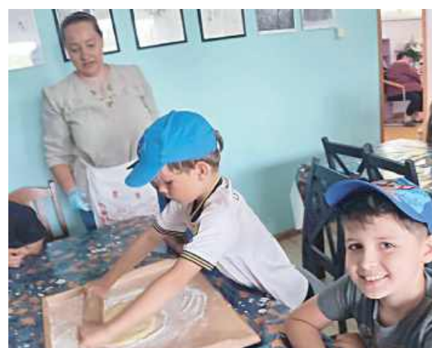
Podczas warsztatów „Od ziarenka do bochenka” dzieci poznały proces powstawania pieczywa – od ziarna aż do gotowego chleba