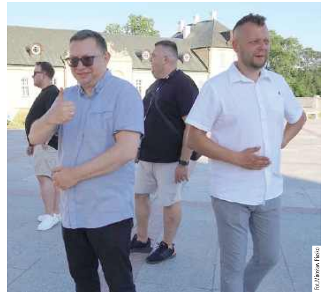
Twórcy programu postanowili pokazać Radzyna Podlaską z nieco innej perspektywy. Zamiast klasycznego programu kulinarnego powstała opowieść łącząca historię Pałacu Potockich z lokalnymi produktami i współczesną kuchnią inspirowaną tradycją

Realizacja programu na terenie jednego z najcenniejszych zabytków Lubelszczyzny to jednocześnie promocja Radzyna Podlaskiego jako miejsca, w którym historia