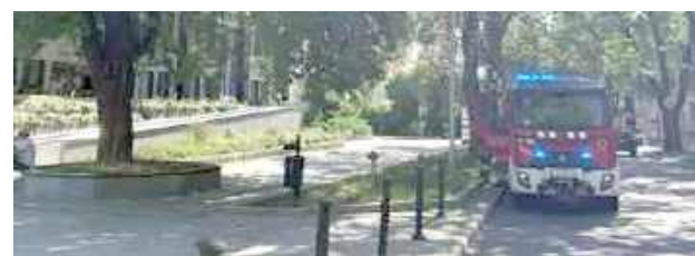
Strażacy pod budynkiem Filharmonii Lubelskiej

Lublin: Dzień po dniu pojawiły się zgłoszenia o podłożeniu ładunków wybuchowych.