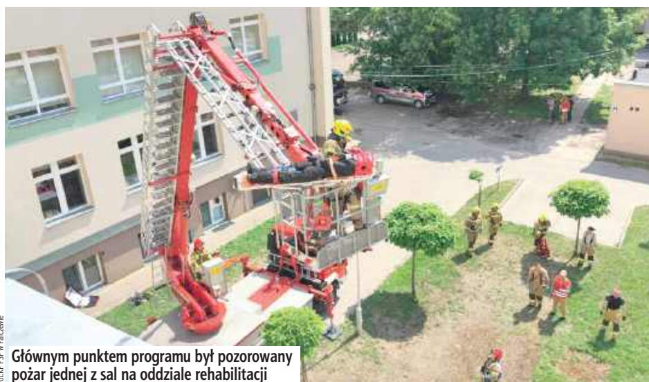
Głównym punktem programu był pozorowany pożar jednej z sal na oddziale rehabilitacji

Głównym punktem programu był pozorowany pożar jednej z sal na oddziale rehabilitacji, gdzie poszkodowanych zostało czterech pacjen-