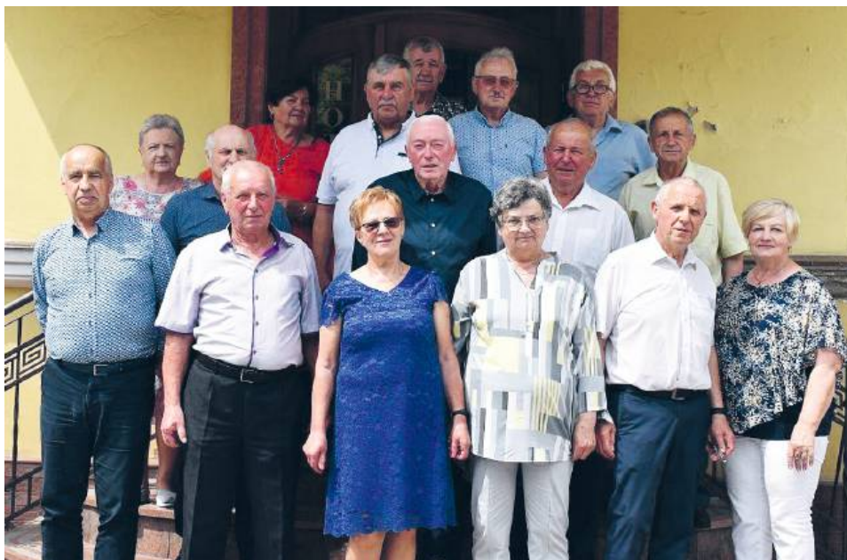
Zdjęcie grupowe – jak zawsze – na schodach Staromiejskiej. Tam, gdzie wspomnienia spotykają się z teraźniejszością

Obecnie budynek szkoły to „kolos”, jak mówią uczestnicy spotkania – dużo więcej klas, kierunków, nauczycieli. A wtedy? Tylko Technikum Rolniczo-Chmielarskie. Pięć klas, znajome twarze, młodzieńcze marzenia i obowiązki, które zdawały się wielkie, ale z perspektywy lat stają się czułymi anegdotami.