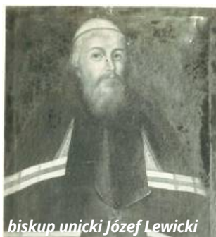
biskup unicki Józef Lewicki