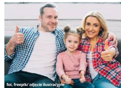
fol. freepik/ zdjęcie ilustracyjne

try, że obywatel Ukrainy otrzyma 800+ pod warunkiem, że jego dziecko chodzi w Polsce do szkoły lub „zerówki”. Ta zmiana nie dotyczy najmłodszych dzieci, które nie mają jeszcze obowiązku nauki w placówce oświatowej - dodaje Korba.