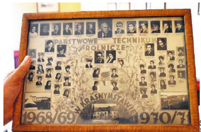
Tablo absolwentów Państwowego Technikum Rolniczego w Krasnymstawie rocznika 1971