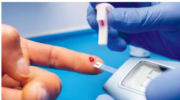
Podczas spotkania będzie można wykonać badanie poziomu cukru we krwi metodą paskową