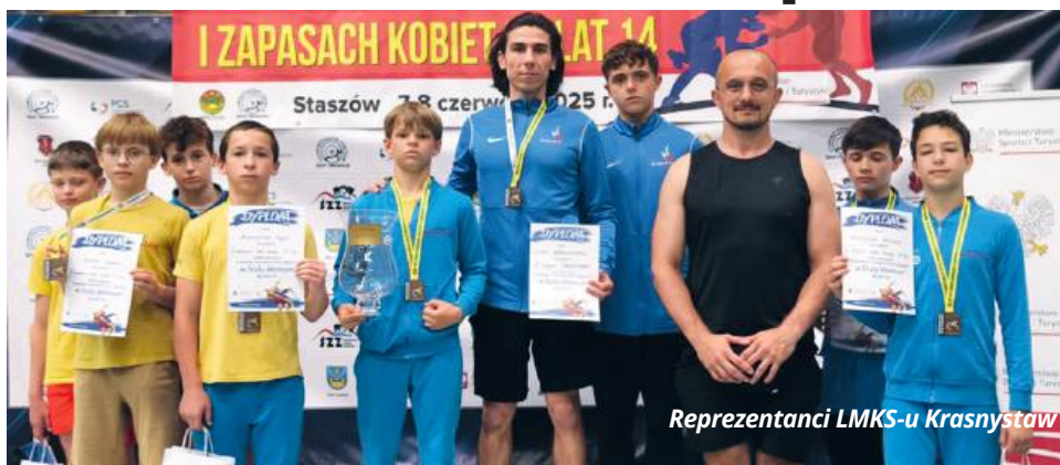
Reprezentanci LMKS-u Krasnystaw

ZAPASY Reprezentanci LMKS-u Krasnystaw oraz MLUKS-u Włodawa dorzucili do klubowego dorobku kolejne cenne medale, tym razem wywalczone na matach Staszowa.