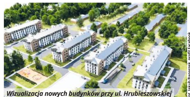
Wizualizacja nowych budynków przy ul. Hrubieszowskiej