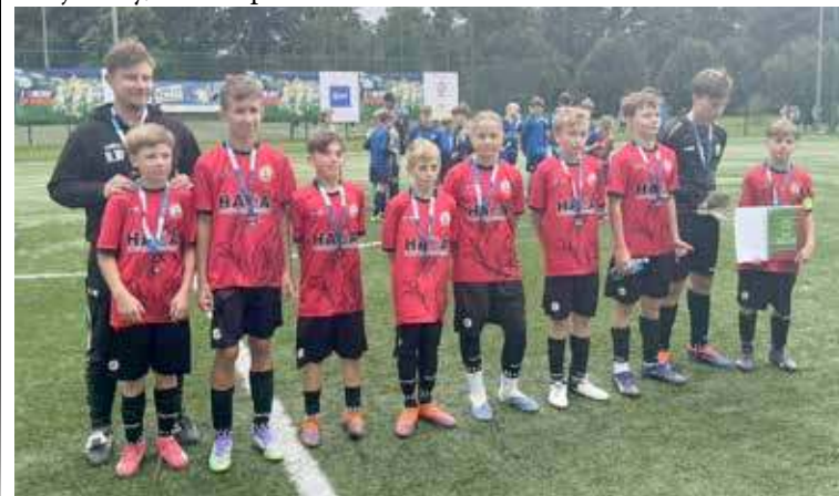
Pokonanie trzech drużyn zapewniło awans do kolejnej fazy turnieju