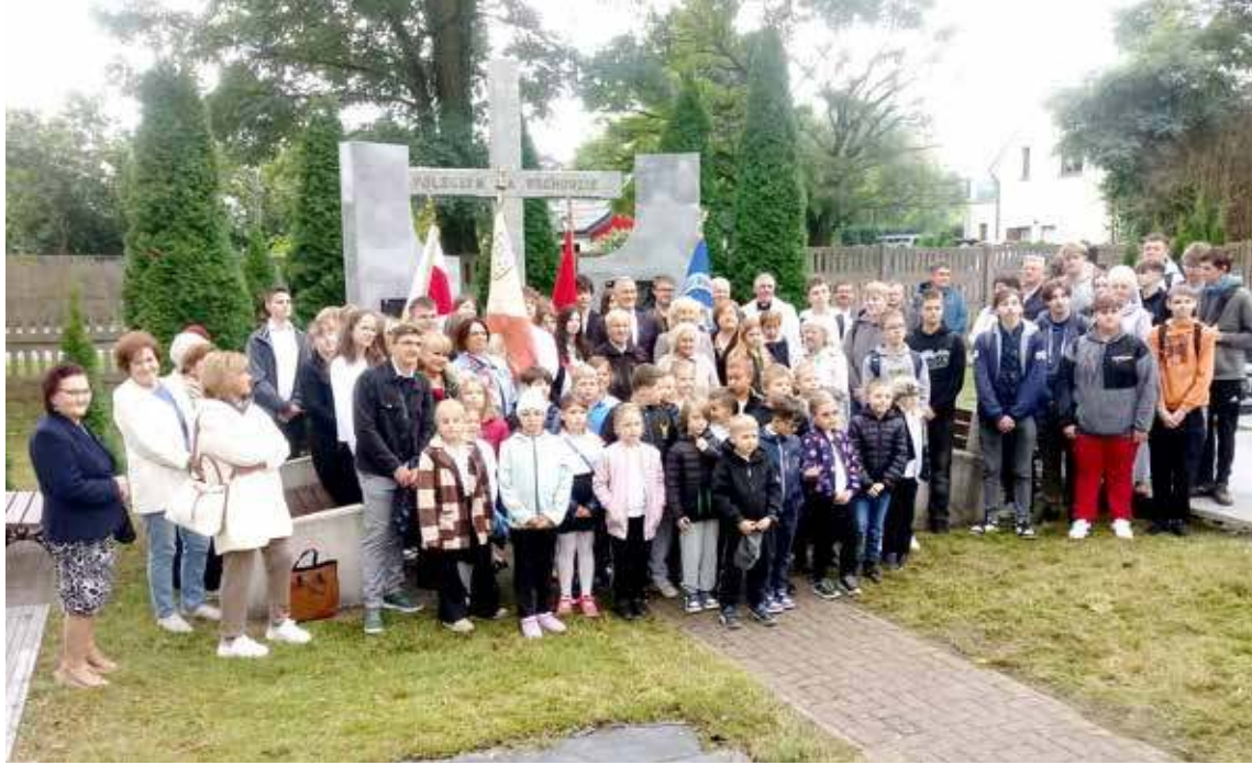
Na zakończenie wydarzenia wspólne zdjęcie