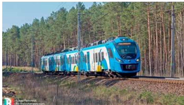
W trakcie tygodnia mobilności PolRegio zachęca do korzystania ze swoich usług

W ramach promocji przygotowano łączną pulę 25 tys. biletów, które można wykorzystać w dowolnym dniu między 16 a 22 września 2025 r. Oferta obejmuje niemal wszystkie województwa, w tym zachodniopomorskie. Szczegółowe informacje o promocji oraz jej regulamin są