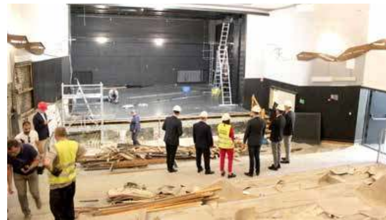
Do efektywnych wyburzeń części pomieszczeń w NDK doszło w sierpniu

Już nie na palcu Wolności, ale w budynku gminnym przy ul. 700-lecia (przy ZBK) prowadzi swoją tymczasową działalność dyrekcja oraz pracownicy Nowogardzkiego Domu Kultury. To skutek pospiesznie wykonanych prac przygotowawczych zainicjowanych jeszcze w sierpniu w budynku przy placu Wolności.