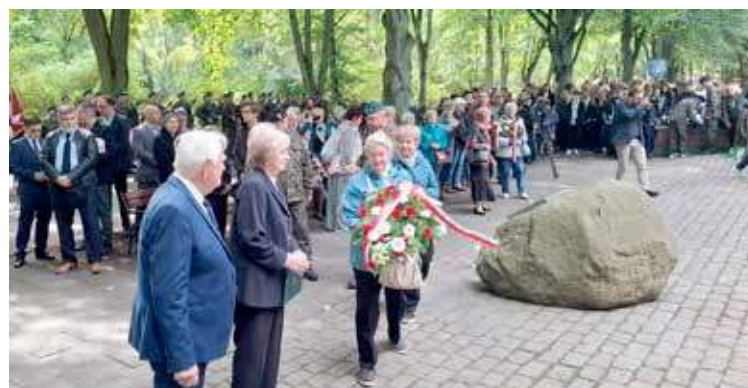
Przedstawiciele Związku Sybiraków składają wieniec pod pomnikiem upamiętniającym męczeństwo naszych rodaków w trakcie deportacji

świadkowie tamtych tragicznych wydarzeń, którzy jako dzieci, byli wraz ze swoimi najbliższymi, za-