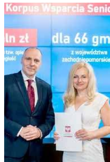
Do zwolnienia dyrektor OPS doszło w 2024 roku na chwilę po podpisaniu umowy o dofinansowanie w ramach programu rządowego