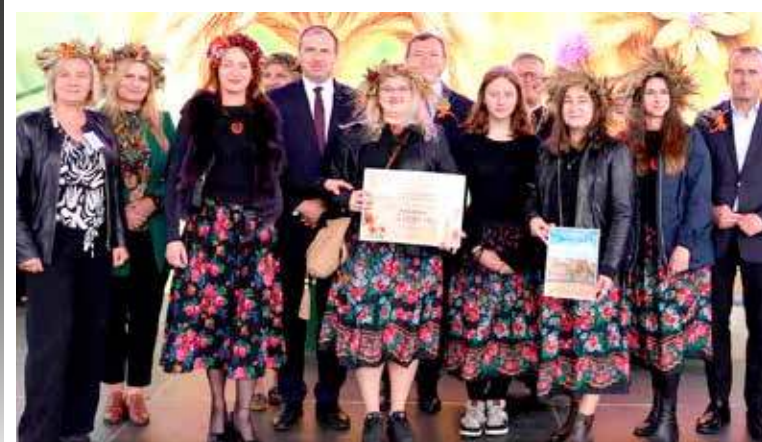
Final konkursu i wręczenie nagród odbyło się w trakcie dożynek w Barzkowicach