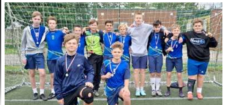
Zwycięska ekipa SP nr 3 pojedzie teraz na turniej etapu powiatowego