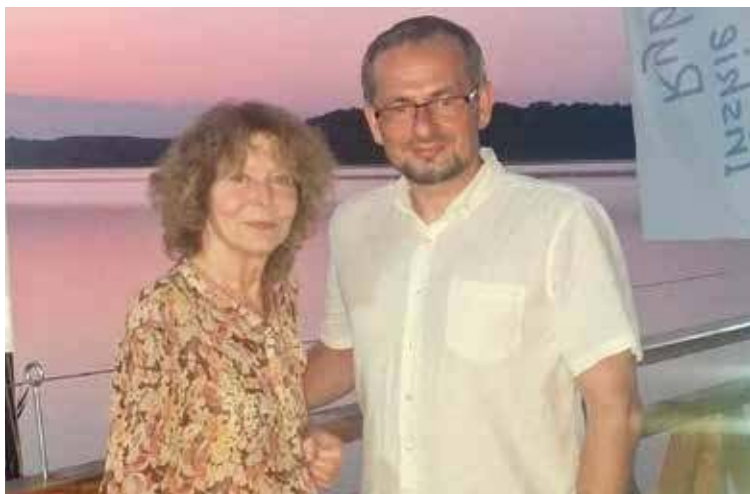
Anna Romantowska i Piotr Słomski

Zadebiutowała Pani rolą Elwiry w spektaklu „Trzy po trzy” według Aleksandra Fredry w reżyserii