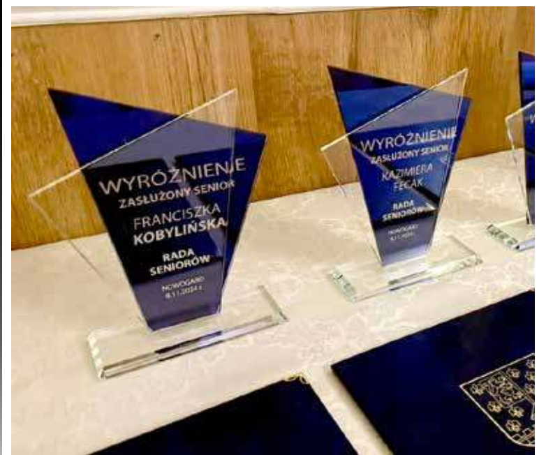
Dla laureatów przygotowane zostaną statuetki