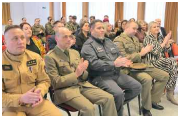
W wydarzeniu udział wzięli przedstawiciele służb mundurowych oraz lokalnej władzy samorządowej