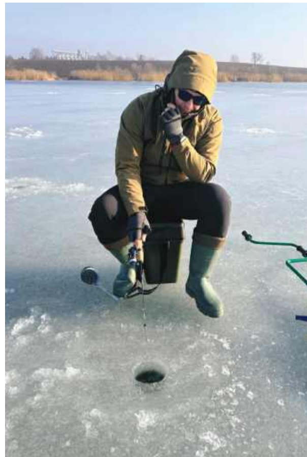
Jednym z akwenów, na którym wędkarze podlodowi lubią łowić spod lodu jest polder zalewowy w Przewornie. Jak nas poinformowali, lód w ostatnich dniach ma tam grubość około 15 - 20 centymetrów

Najczęściej stosowaną metodą jest mormyszka,