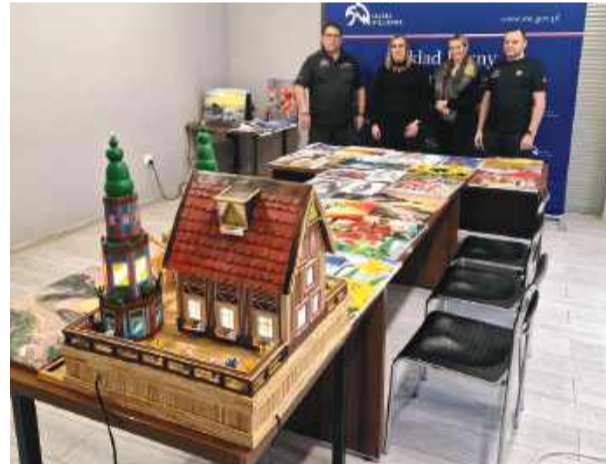
W tym roku strzeleński zakład karny przekazał ponad dwadzieścia prac na rzecz finału WOŚP.