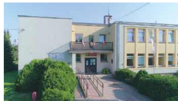
Punkt wsparcia działa w budynku Urzędu Gminy Przeworno w gabinecie nr 5, zlokalizowanym na parterze