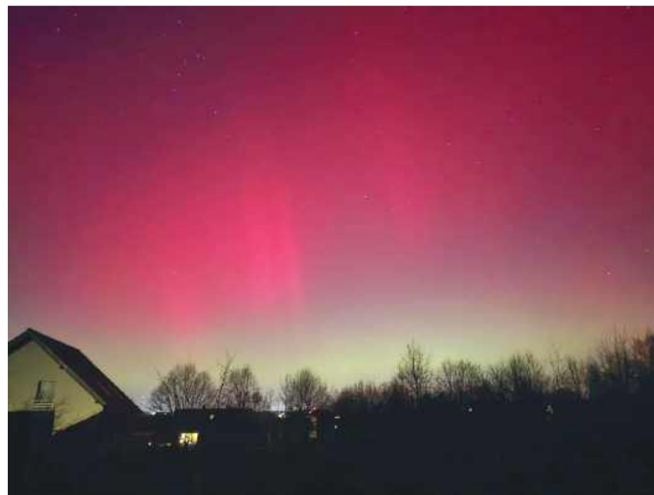
Zorza widoczna nad Gęsińcem w nocy z 19 na 20 stycznia.