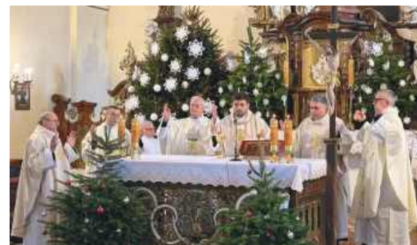
Spotkanie rozpoczęło się uroczystą Mszą św.