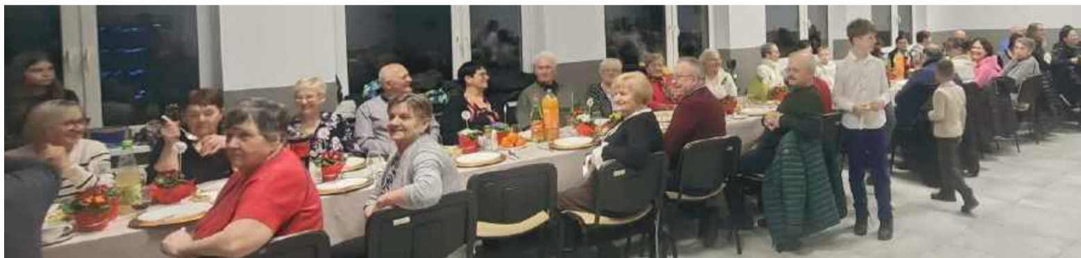
Dziadkowie podczas obchodów swojego święta w Ludowie Śląskim