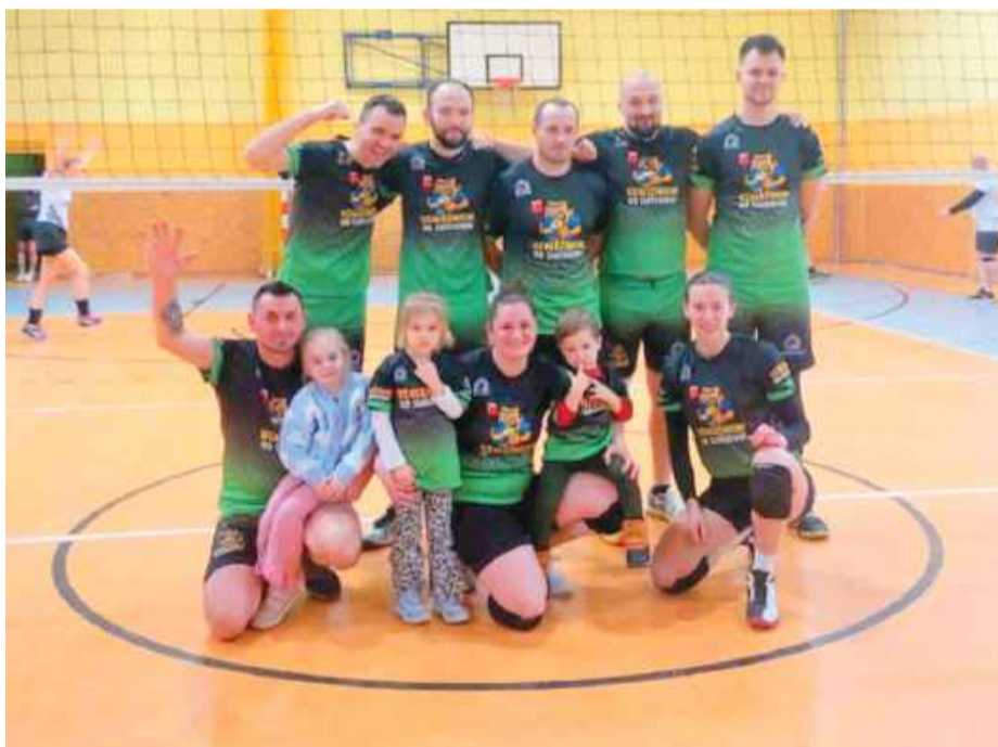
Zwycięski zespół Uzależnionych od Siatkówki

W niedzielę, 18 stycznia, w sali sportowej przy ul. Staromiejskiej w Strzelinie rozegrano kolejne mecze Amatorskiej Ligi Piłki Siatkowej organizowanej przez Strzeleńskie Centrum Sportowo-Edukacyjne. Kibice nie mogli narzekać na brak emocji, a na parkiecie doszło do kilku interesujących rozstrzygnięć. Najbardziej zapracowaną drużyną tego dnia były Srogie Szoty, które rozegrały aż dwa spotkania. W pierwszym pojedynku musiały uznać wyższość zespołu Uzależnieni od Siatkówki, przegrywając 1:3. W dru-