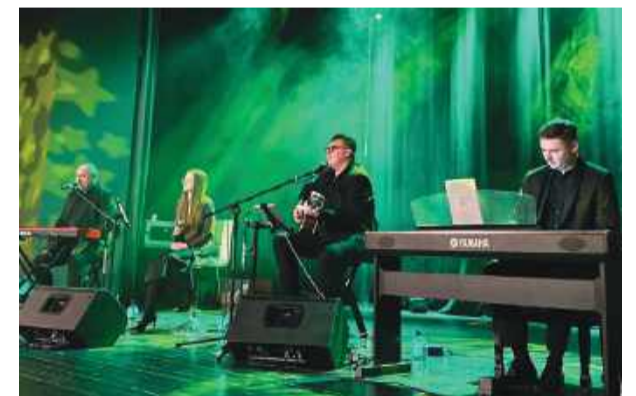
Noworoczny koncert zespołu Fryt Band