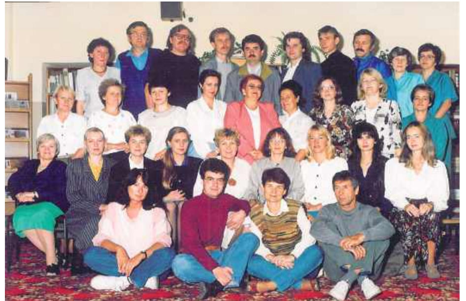
Grono pedagogiczne szkoły nr 1 z roku szkolnego 1994/95

- Był taki Poniedziałek Wielkanocny, w który zaplanowali sobie śmigus-dyngus, świetnie się bawili,