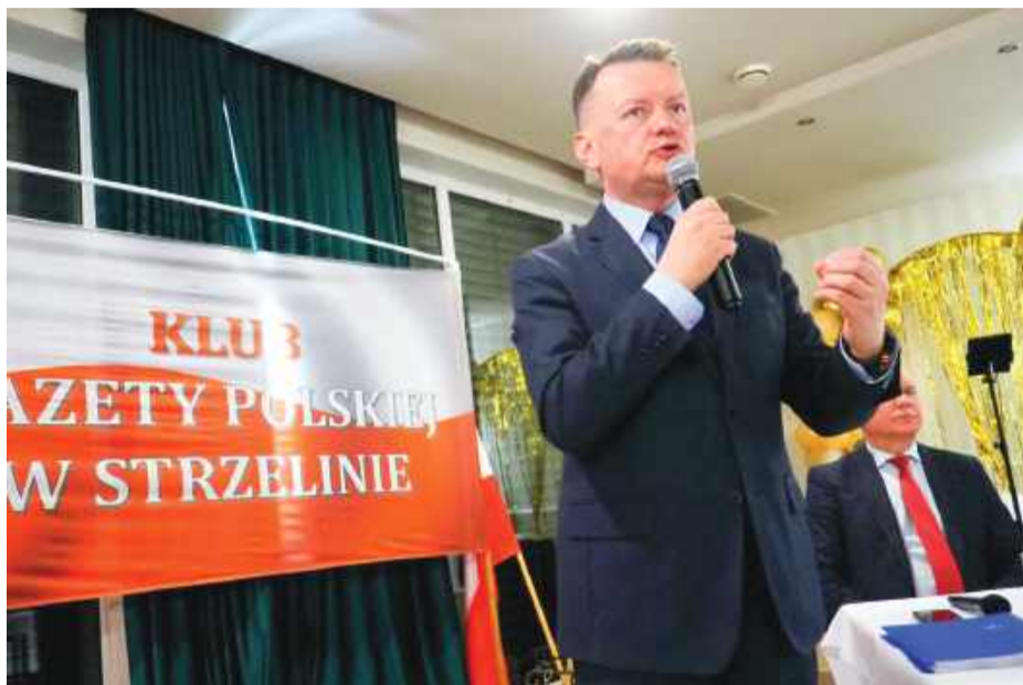
– Przymierzaliśmy się do budowy fabryki w powiecie strzelińskim – mówił Mariusz Błaszczak, wiceszef PiS-u

– W powiecie strzelińskim panują idealne warunki dla rozwoju przemysłu zbrojeniowego. Prawo i Sprawiedliwość przymierzało się do tego. Niestety, zmienił się rząd i relacje z Koreą osłabły – mówił w Strzelinie Mariusz Błaszczak, przewodniczący Klubu Parlamentarnego PiS.