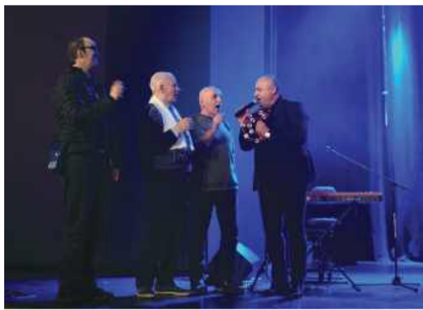
Zespół zaprosił publiczność do wspólnego śpiewu.

W czwartek, 15 stycznia, sala Strzelińskiego Ośrodka Kultury wypełniła się po brzegi mieszkańcami spragnionymi wspólnego świętowania. Tego wieczoru na scenie pojawił się zespół Fryt Band, który zaprezentował najpiękniejsze polskie kołеды i pastorałki w aranżacjach łączących tradycję z ogromną dawką pozytywnej energii.