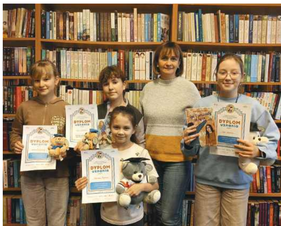
Czytelniczki z powodzeniem ukończyły wszystkie etapy konkursu, wykazując się wyjątkową wytrwałością