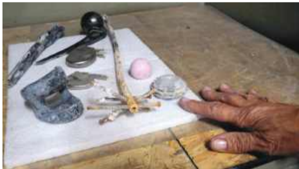
Wszystkie przedmioty wyciągnięte ze zwłok przeznaczone są do utylizacji. Co pewien czas zabiera je specjalistyczna firma

ruje, że chciałoby posiadać w domu małą urnę z prochami zmarłego. Niektórzy miniaturowe urny noszą z krzyżykiem na szyi. Istnieją też związki wyznaniowe, które postulują, aby prochy zmarłych nie zamurowywać