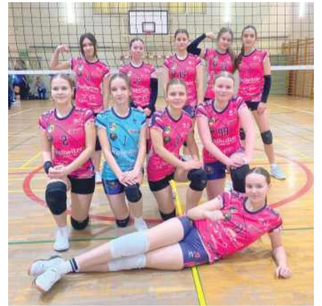
Strzeleńskie siatkarki rywalizowały w Jaworze

gali z okazji 25-lecia klubu Tygrysy Strzelin, jednak z powodów osobistych nie mógł wziąć udziału w tym wydarzeniu. Podczas jubileuszowej gali Złotą Odznakę