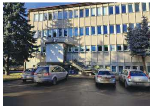
Dokumentomat zainstalowany zostanie obok wejścia do Wydziału Komunikacji

Korzystanie z dokumentomatu będzie dobrowolne. Tradycyjny odbiór dokumentów w urzędzie pozostanie bez zmian. Nowe rozwiązanie ma jednak odciążać Wydział Komunikacji i skrócić kolejki. – Pracownicy zamiast wydawania dokumentów będą mogli w tym czasie obsługiwać