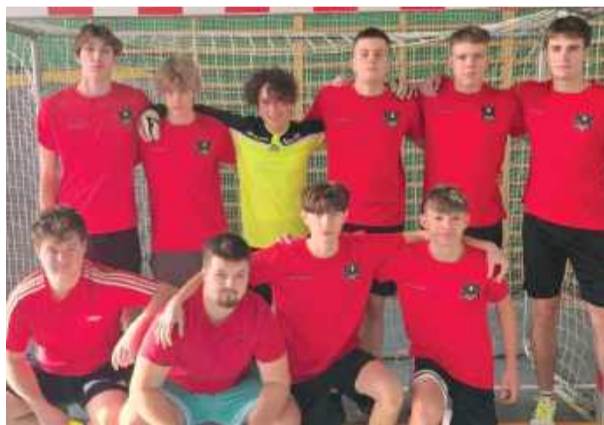
Grzegorzowianka zanotowała pierwsze zwycięstwo

wydarzeniem była zmiana na pozycji lidera. Nowym liderem rozgrywek została drużyna Kaczerki Gym, która w niezwykle zaciętym i widowiskowym meczu pokonała Czarnych Kondratowice 6:5. Kaczerki awansowały z trzeciego miejsca na fotel lidera tabeli. Zespół wykorzystał