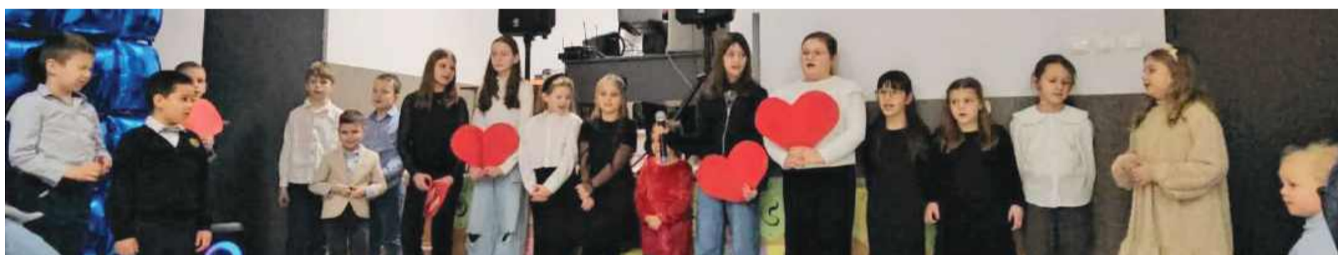
Wnuki wystąpiły dla swoich dziadków.