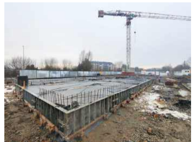
Tak obecnie wygląda plac budowy. Pod koniec ubiegłego tygodnia wylano fundamenty.

Czy wszystkie mieszkania znalazły już najemców, czy wciąż osoby zainteresowane mogą składać wnioski? – Nabór nadal trwa – podkreśla szefowa gminy. – Wciąż można składać wnioski dotyczące najmu mieszkań w nowym budynku przy ul. Okulickiego oraz zawarcia umowy partycypacyjnej ze spółką DTBS. Do tej pory wpłynęło już ponad 50 takich wniosków. Ich weryfikacja i ostateczna kwalifikacja zakończy się do końca pierwszego kwartału 2026 roku.