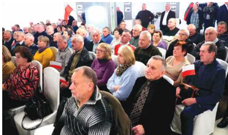
Spotkanie zorganizowano w Restauracji Strzeleńskiej przy ulicy Kolejowej

Obywatelstwo mają otrzymywać osoby niekarane, zasymilowane i posiadające odpowiednią wiedzę. Dla obcokrajowców podwyższony ma zostać egzamin z języka polskiego z poziomu B1 do C1. O planowanych inwestycjach mówił Mariusz Błaszczak. Jedną z nich ma być m.in. Port Haller, który ma otworzyć nowy rozdział w polskiej logistyce i bezpieczeństwie. Ma być zlokalizo-