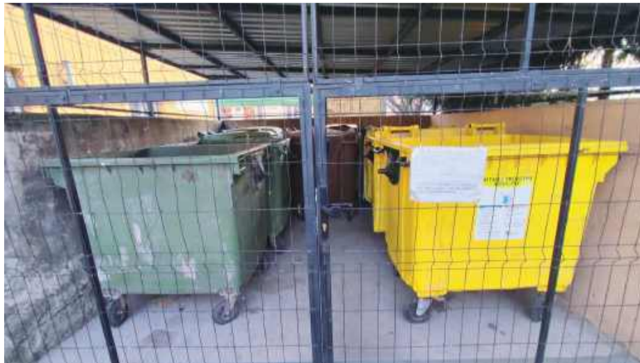
W tym roku zostaną wprowadzone nowe zasady dotyczące pojemników na śmieci

Drugi powód to koszty. Pojemniki są osobną pozycją w ofertach składanych przez firmy i ich cena jest później wliczana w stawkę opłaty śmieciowej dla wszystkich mieszkańców. W praktyce wszyscy przez lata „spłacamy” pojemniki w ratach, chociaż formalnie nie są one naszą własnością. Te koszty z roku na rok wyraźnie rosną. Z naszego rozeznania wynika też, że jesteśmy jedyną gminą w regionie, która do tej pory zapewniała mieszkańcom pojemniki i worki. W sąsiednich samorządach od lat jest to obowiązek właścicieli nieruchomości. My przez długi czas staraliśmy się mieszkańców z tego