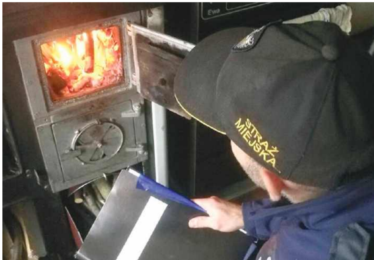
Czy straż miejska w najbliższym czasie planuje kontrole pieców i kominków? Fot. ilustracyjne

Od wielu dni ogólnopolskie media informują, że w teren ruszyli strażnicy miejscy, aby kontrolować kominki i kopciuchy w prywatnych domach. Restrykcyjne prawo weszło w życie 1 stycznia w kilku województwach. Jak sytuacja wygląda u nas?