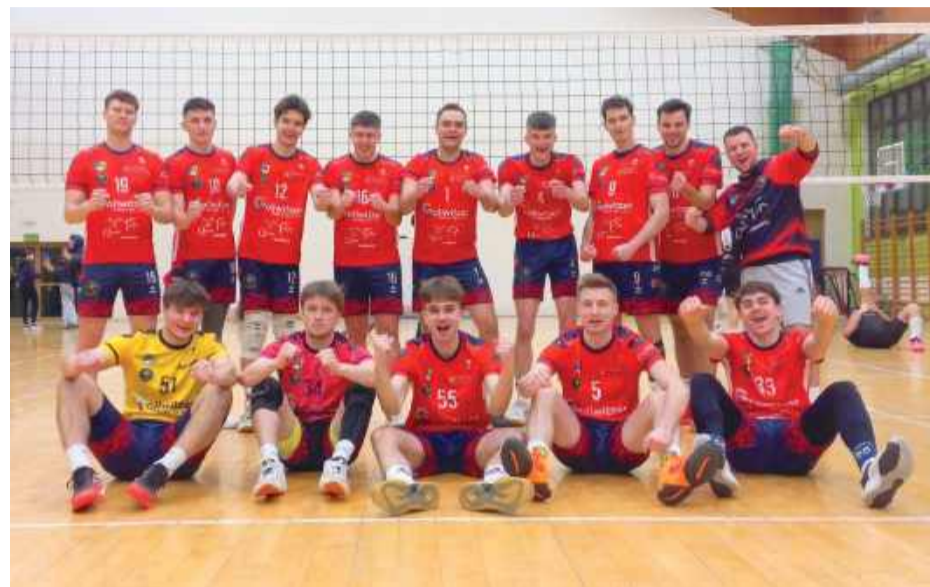
Siatkarze po kolejnym zwycięstwie