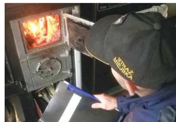
Straż miejska w najbliższym czasie nie planuje restrykcyjnych kontroli pieców i kominków. Fot. ilustracyjne