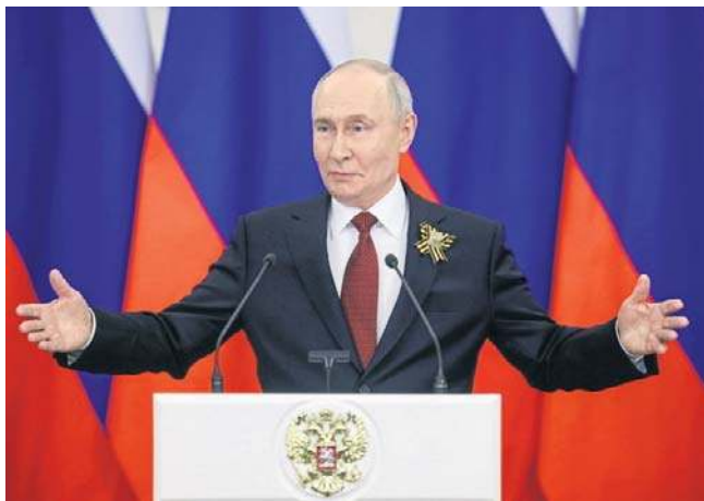
Putin powiedział, że jego zdaniem „specjalna operacja wojskowa”, czyli wojna w Ukrainie, ma się ku końcowi

Rosyjski dyktator został także zapytany o możliwość negocjacji z Europą. Tu wskazał na potencjalnego mediatora - miałby nim być były kanclerz Niemiec Gerhard Schröder.