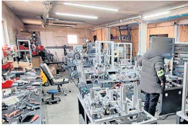
Funkcjonariusze w jednej z lokalizacji wykryli działającą fabrykę, w której zabezpieczono ponad 13 mln sztuk wyrobów tytoniowych bez akcyzy

W szeroko zakrojonej akcji rozbijania tego gangu udział wzięli funkcjonariusze z Dolnośląskiego Urzędu Celno-Skarbowego we Wrocławiu, Łódzkiego Urzędu Celno-Skarbowego w Łodzi, Kujawsko-Pomorskiego Urzędu Celno-Skarbowego w Toruniu oraz NOSG. Działali na polecenie Prokuratury Okręgowej w Jeleniej Górze.