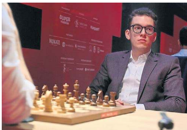
Jan-Krzysztof Duda gra w szachy od 5. roku życia. Tytuł arcymistrza otrzymał mając zaledwie 15 lat i 21 dni!

Po czterech dniach rywalizacji, Jan-Krzysztof Duda zajmował 6. miejsce. Jednak ostatniego dnia, arcymistrz z Wieliczki zanotował dwa remisy i aż cztery porażki.