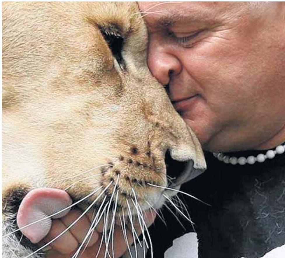
Odwiedziny w głogowskim ZOO. Fotoreporterzy uwieczniają obrazy pokazujące niezwykłą więź, jaka łączy dzikiego kota i jego opiekuna