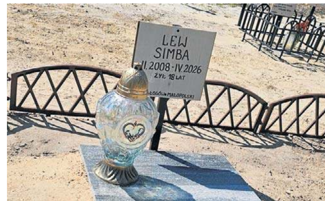
Lew został pochowany na cmentarzu dla zwierząt w Węgliskach koło Rakszawy

rosł na prawie 300-kilogramowego drapieżnika.