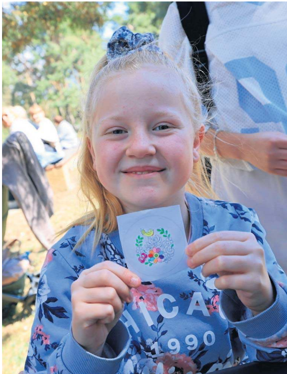
Sobotnie „Malowanie na trawie” w lasku na Skarpie było okazją relaksu na łonie natury