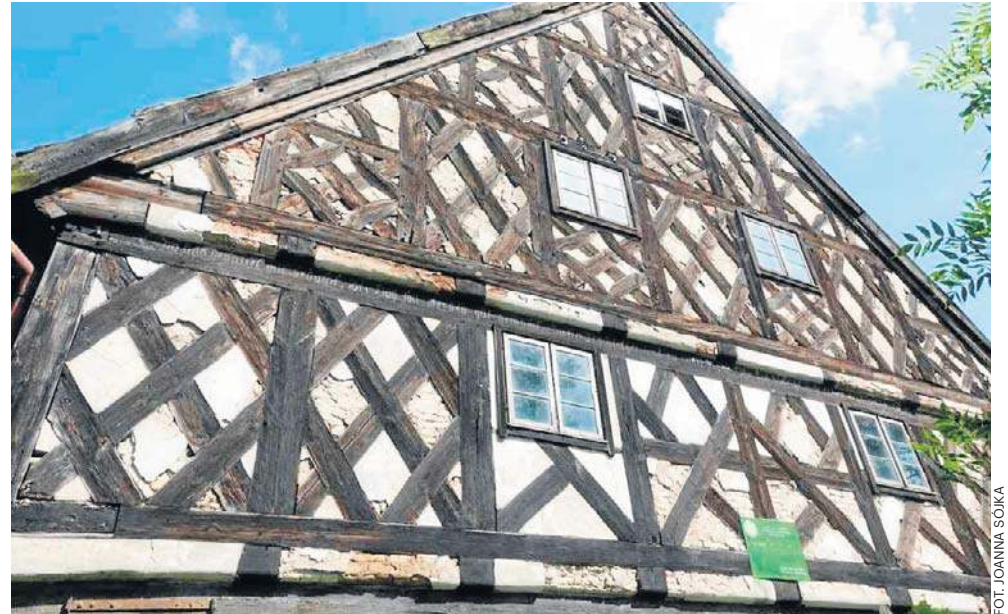
Dom ze Stalewa to konstrukcja typowa dla architektury Żuław - z murowanym przyziemem i szkieletową górną kondygnacją