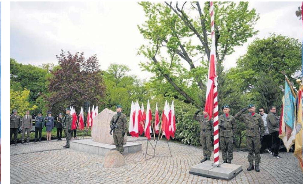
Główna uroczystość rocznicy zakończenia II wojny światowej odbyła się 8 maja