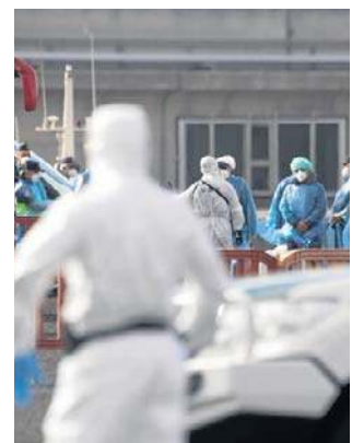
Pierwsi statek opuścili Hiszpanie

Na statku należącym do holenderskiej firmy Oceanwide Expeditions znajduje się około 150 osób z ponad 20 krajów. Proces zejścia na ląd będzie nadzorowany przez trzech hiszpańskich ministrów, w tym minister zdrowia Monikę Garcíę i ministra spraw wewnętrznych Fernando Grande-Marlasque, a także szefa Światowej Organizacji Zdrowia (WHO) Tedrosa Adhanoma Ghebreyesusa. W nocy z soboty na niedzielę Garcia ponownie zapewniła, że