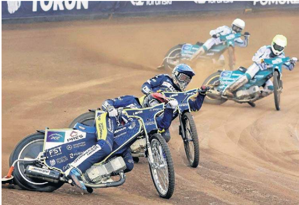
Na Motoarenie gospodarze jeździli głównie z przodu i pewnie pokonali Falubaz