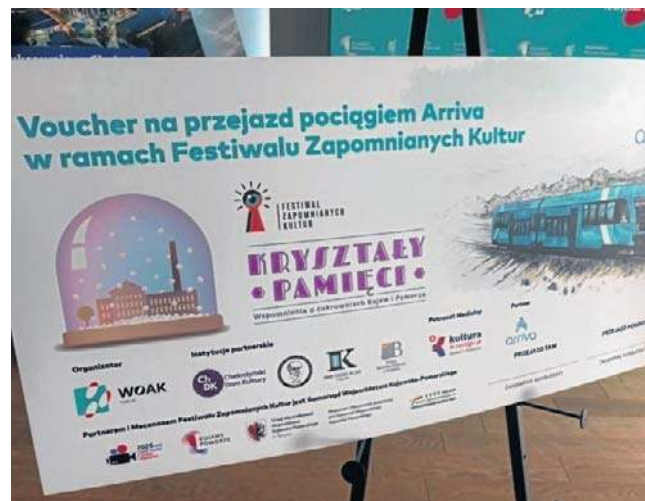
Arriva przygotowała darmowe vouchery na przejazdy do Chełmży i Unisławia

W sobotę, 16 maja festiwal zagości w Chełmży. Jednym z głównych punktów programu będzie zwiedzanie cukrowni, które pozwoli zajrzeć do przestrzeni na co dzień niedostępnej dla mieszkańców i gości. Na uczestników czeka również słuchowisko „Głosy dawnej Cukrowni”, przywołujące pamięć o ludziach i codziennym życiu dawnego zakładu.