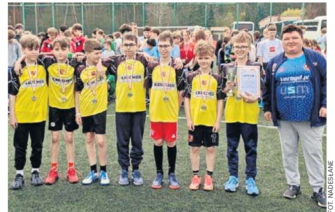
Chłopcy z SP Czernikowo zdobyli złote medale i tytuły mistrzów powiatu w roczniku 2013 i młodszy (na zdjęciu)