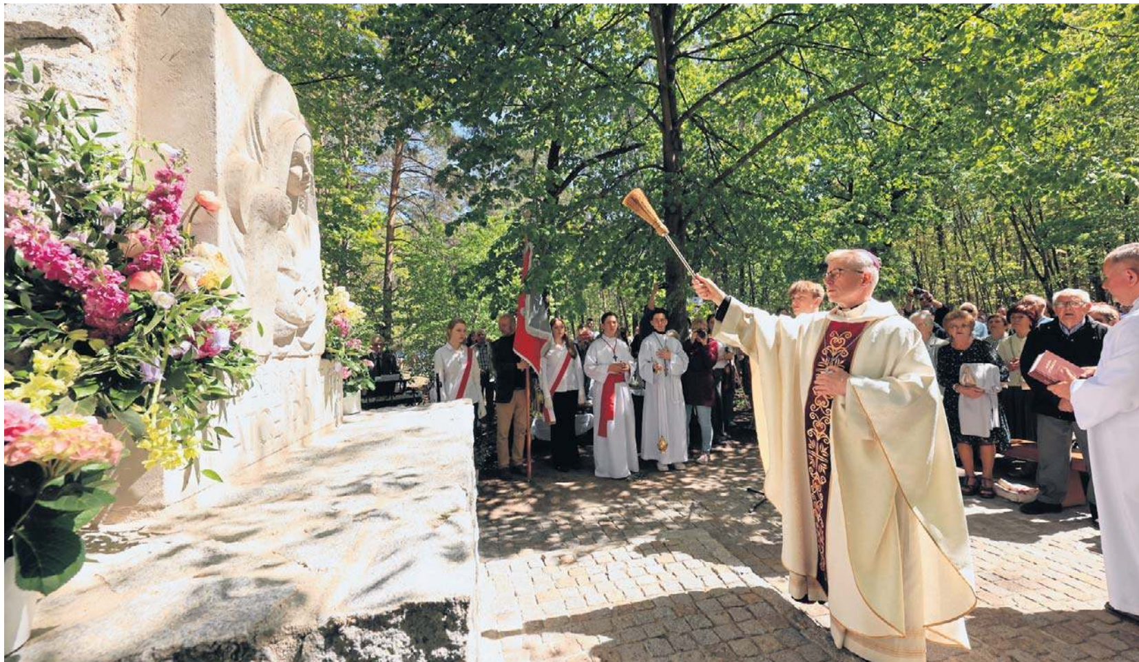
W niedzielę ponownie poświęcono odrestaurowaną kapliczkę przy drodze z Wrzosów na Barbarkę, ozdobioną płaskorzeźbą Ignacego Zelka