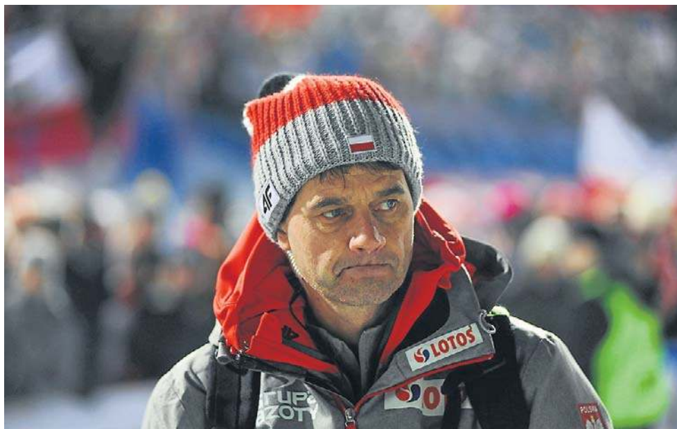
Stefan Horngacher zamierza ponownie wprowadzić polskich skoczków na szczyt

Taka decyzja zapadła po osobistej rozmowie w moim biurze związku z Adamem Małym