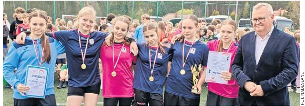
Wśród dziewcząt w roczniku 2011-2012 I m. zajęły reprezentantki SP Zławieś Wielka (na zdjęciu), przed SP Lubicz Górny i SP Mała Nieszawka