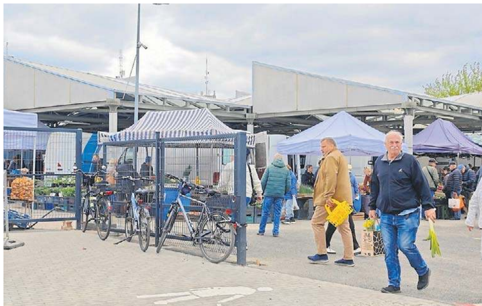
Nowa brama w ogrodzeniu Targowiska Miejskiego przy Szosie Chełmińskiej jest na razie dostępna tylko dla pieszych

- Gotowa jest nowa trasa, także parkingi, a kolejny dzień nie można z nich korzystać. Dla nas ich udostępnienie jest bardzo ważne. Chodzi o klientów, którzy zyskują łatwiejszy dostęp do targowiska. Zaparkują samochód w pobliżu i dzięki temu będą mogli zrobić większe zakupy. Parkingi wzdłuż Szosy Chełmińskiej są niewy-