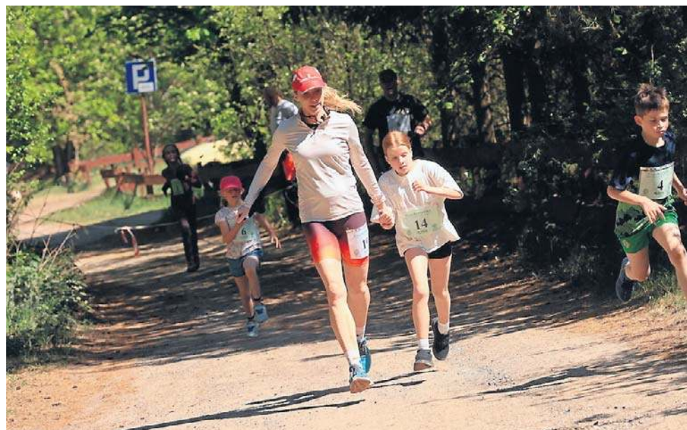
Po zimowej przerwie wrócił cykl biegów przełajowych Cross Barbarka w Toruniu