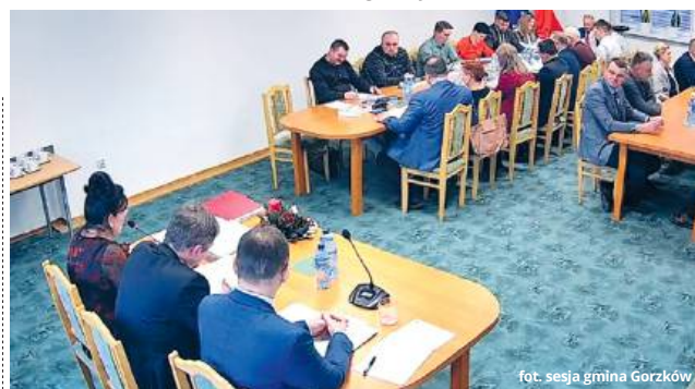
fol. sesja gmina Gorzków

W budżecie na 2026 rok nie zabrakło też inwestycji związanych z ochroną środowiska i dokumentacją projektową przyszłych przedsięwzięć, w tym opracowania planu ogólnego dla gminy oraz utworzenia Punktu