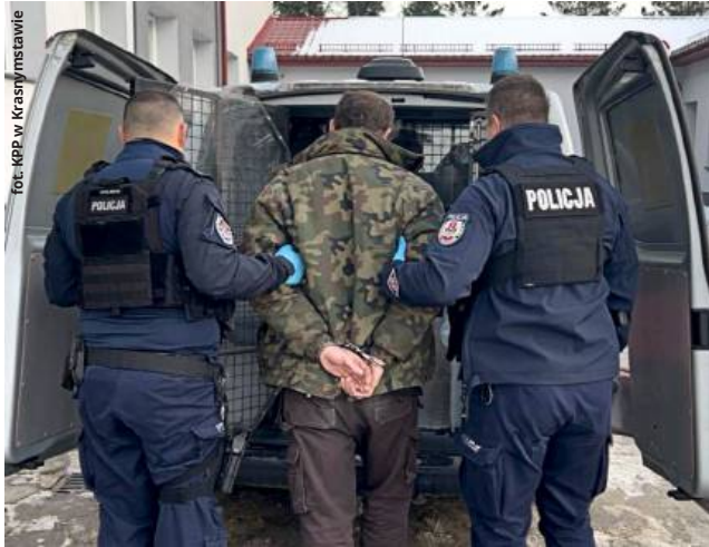
Podczas interwencji mundurowych 41-latek zachowywał się agresywnie. (apm)

Policjanci zatrzymali 41-letniego syna kobiety. Jak ustalili funkcjonariusze, mężczyzna pastwił się nad matką fizycznie i psychicznie. Wszczywał awantury domowe, podczas których bił kobietę rękami po ciele, a także kierował wobec niej groźby pozbawie-