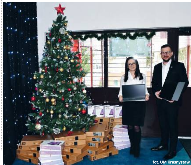
fol. UM Krasnystaw

● KRASNYSTAW Nowoczesny sprzęt komputerowy trafił do uczniów Publicznej Szkoły Podstawowej nr 4 w Krasnymstawie. Dzięki współpracy miasta z Naukową i Akademicką Siecią Komputerową placówka wzbogaciła się o 51 nowych urządzeń, które zastąpią wyśłużone komputery.