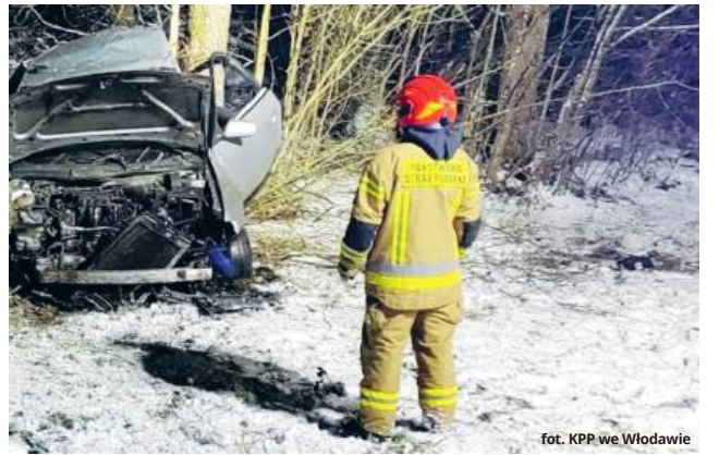
fol. KPP we Włodawie

Jak wynika ze wstępnych ustaleń funkcjonariuszy, 38-letni mężczyzna poruszał się drogą przez Macoszyn Duży, gdy nagle stracił panowanie nad pojazdem. Samochód zjechał