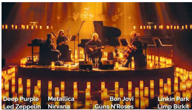
Deep Purple, Metallica, Bon Jovi, Linkin Park, Led Zeppelin, Nirvana, Guns N' Roses, Limp Bizkit

Bilety na koncert w cenie od 149 zł. szer