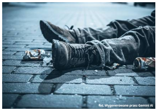
fol. Wygenerowane przez Gemini AI

Na miejsce natychmiast skierowano patrol policji. Funkcjonariusze zastali tam zgłaszającego, który starał się pomóc 48-letniemu mieszkańcowi gminy Wyryki. Mężczyzna znajdował się pod silnym wpływem alkoholu, a jego organizm był już mocno wychłodzony. Ze względu na realne zagrożenie życia, na miejsce wezwano zespół ratownictwa medycznego, który przewiózł 48-latkę do szpitala.