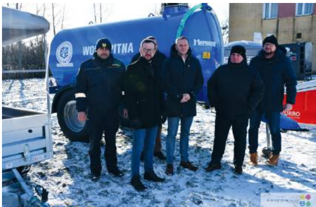
fol. UM Krasnystaw

Zakupione wyposażenie znacząco podnosi zdolność miasta do