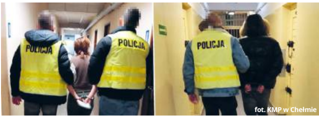
fol. KMP w Chełmie

Młody mężczyzna został doprowadzony do prokuratury.