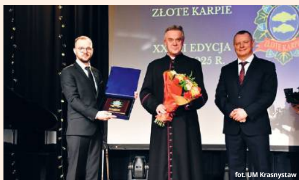
fol. UM Krasnystaw

Wyróżnienie „Złote Karpie” od lat stanowi formę docenienia osób, które swoją codzienną pracą, pasją i zaangażowaniem wpływają na życie lokalnej społeczności. To mieszkańcy oraz organizacje pozarządowe działające na