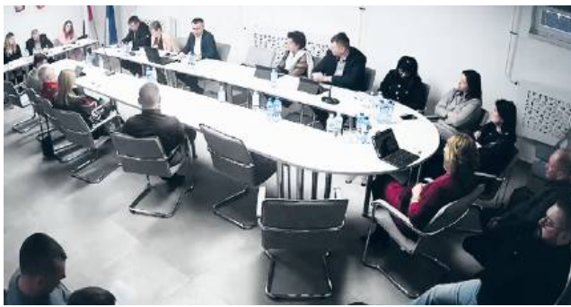
Gruntowna analiza budżetu miała miejsce 30 grudnia

Władze gminy dopełniły nakreślonych przez ustawodawcę procedur i do 15 listopada przedstawiły radzie gminy projekt budżetu na 2026 roku. Analiza dokumentu i głosowanie nad nową uchwałą budżetową miały natomiast miejsce w czasie ostatniej sesji – 30 grudnia 2025 roku. Na jakich zagadnieniach samorządowcy skupią się w tym roku?