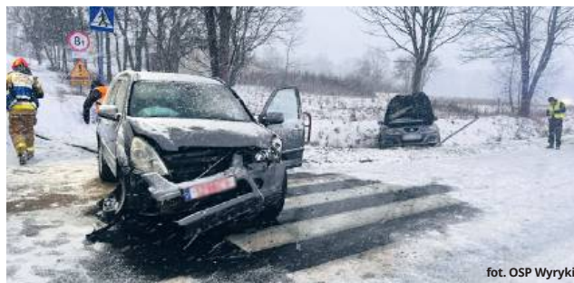
fol. OSP Wyryki

Na miejscu szybko pojawił się Zespół Ratownictwa Medycznego, który udzielił pierwszej pomocy uczestnikom zdarzenia. Jedna osoba z obrażeniami ciała została zabrana do szpitala.