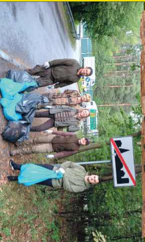
Akcja sprzątania Mielca „W naturę z kulturą”. Leśnicy uprzątnęli śmieci w lesie miejskim przy Orleniarzu komunalnym w Mielcu.