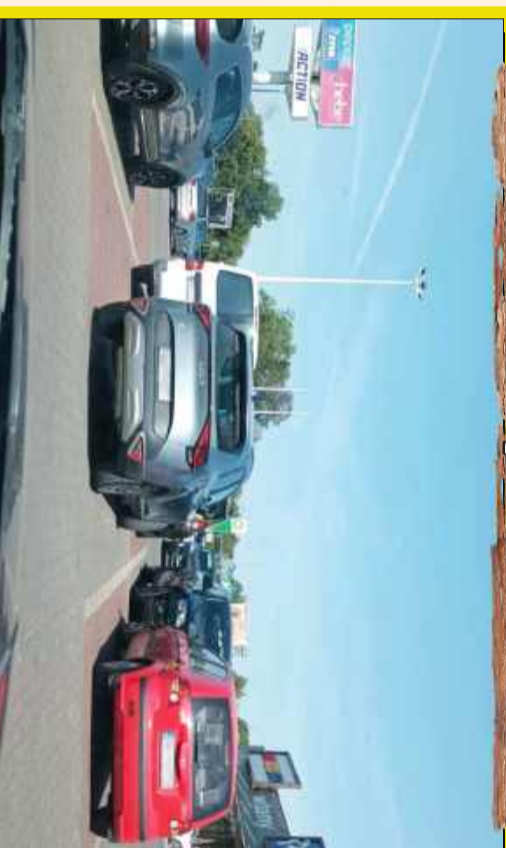
Mistrz parkowania zasługuje na dwa miejsca!