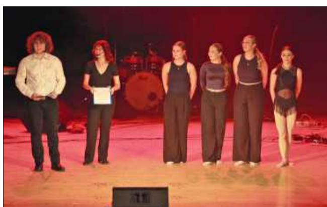
Wydarzenie zwińczyły efektowne występy taneczne uczennic V Liceum Ogólnokształcącego.