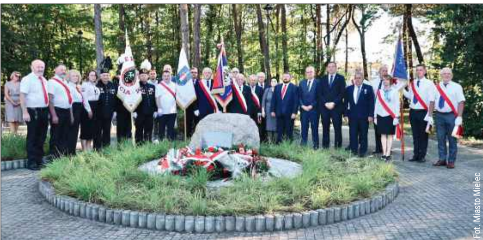
Członkowie Klubu HDK przy WSK „PZL-Mielec”.

W minioną sobotę w Mielcu odbyła się uroczystość upamiętniająca 55-lecie działalności Stowarzyszenia Honorowych Dawców Krwi RP - Klubu HDK przy WSK „PZL-Mielec”. To wyjątkowe wydarzenie zgromadziło dawców, sympatyków oraz przedstawicieli instytucji i organizacji, którzy na co dzień wspierają ideę krwiodawstwa.