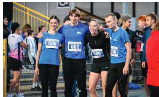
Walka z czasem, sobą i... lekkim wiatrem w oczy.