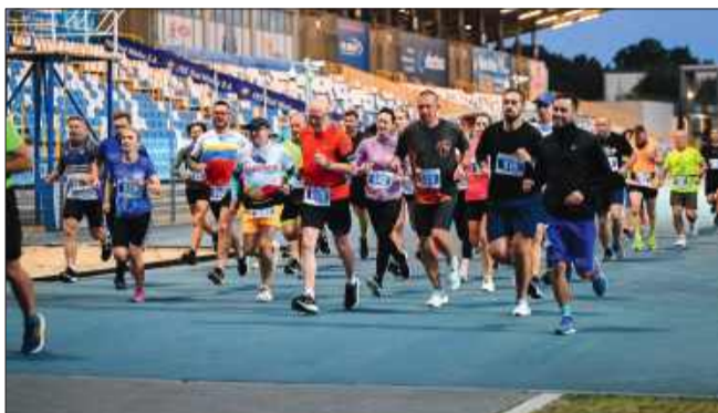
Meta już blisko!

Organizatorzy już teraz zapraszają na przyszłoroczną, jubileuszową edycję biegu, która z pewnością dostarczy jeszcze więcej emocji i sportowych wrażeń. jb