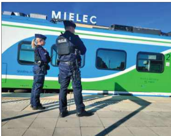
Akcja RAW w Mielcu. Kierowcy i piesi pod lupą policji.

W ramach akcji policjanci kontrolowali także mosty, wiadukty i tunele kolejowe, aby