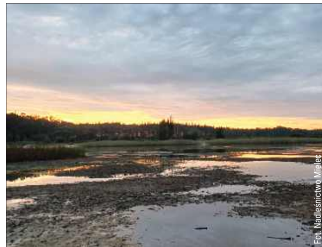
Stawy Cyranowskie obecnie.

Przyroda znalazła się w punkcie krytycznym i czeka na ratunek. Każdy kolejny suchy tydzień pogłębia kryzys, który dotyka nie tylko Cyranowskich Stawów, ale i całego regionu. jb