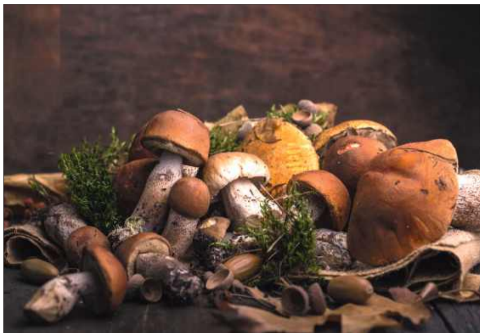
Na grzybobranii trzeba być ostrożnym!

Zatrucie tym grzybem, doprowadzając do uszkodzenia wątroby a następnie niewydolności wielonarządowej, często jest śmiertelne. Jedynym wówczas