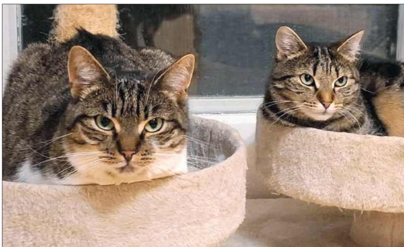
Jedne z podopiecznych Pu-chatki.

Tymczasowe zwiększenie limitu miejsc dla kotów w schronisku – Obecne ogra-