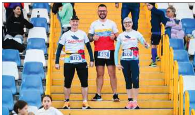
Uśmiech na twarzy - oto duch sportu!