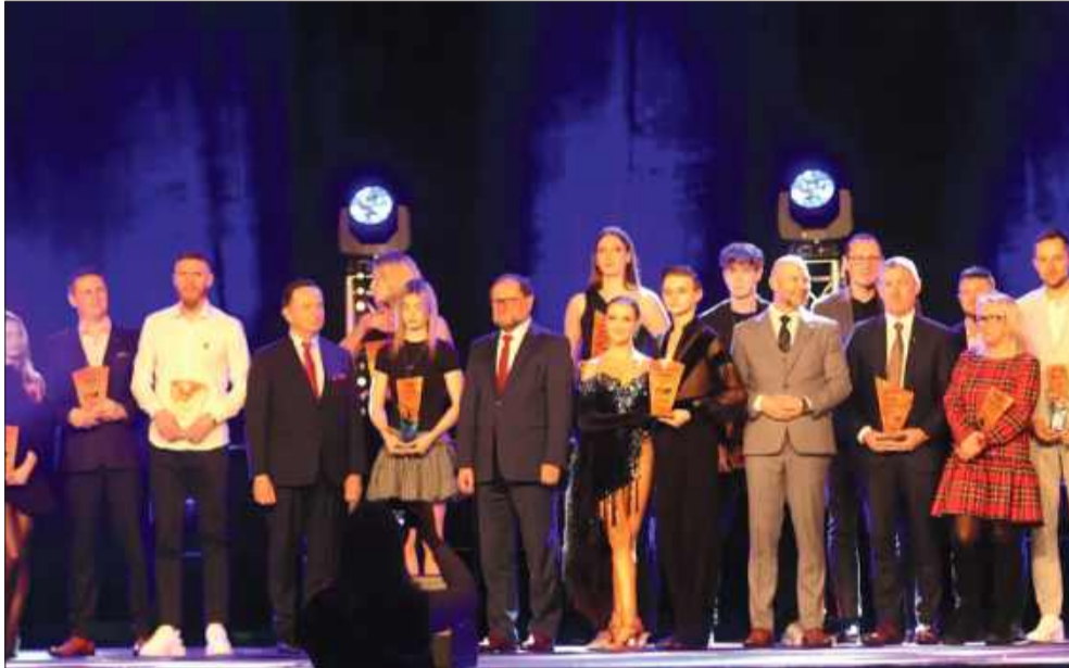
Oto zwycięzcy z poprzedniego roku.

Trener Roku – dla szkoleniowca, który udowodnił, że sport to nie tylko taktyka i trening, ale też pasja i serce.