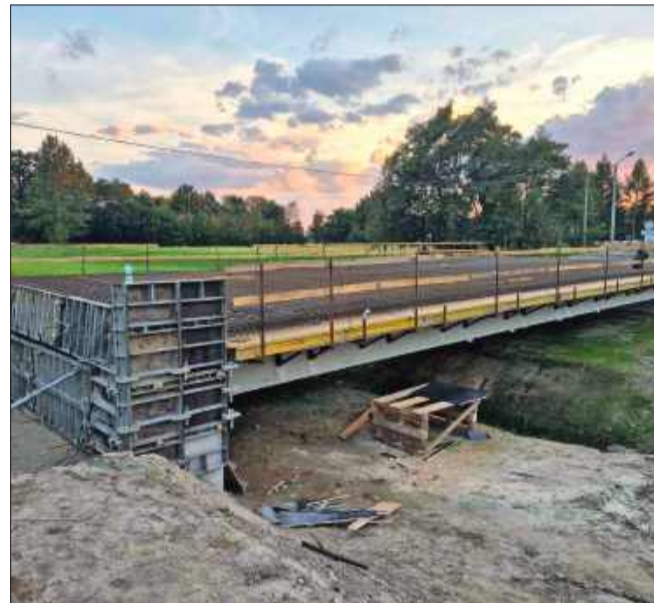
Prace idą pełną parą!

Równoległe inny wykonawca rozpoczął roboty ziemne przy poszerzaniu drogi prowadzącej do nowego obiektu. Odcinek o długości jednego kilometra zyska nową nawierzchnię oraz parametry dostosowane do