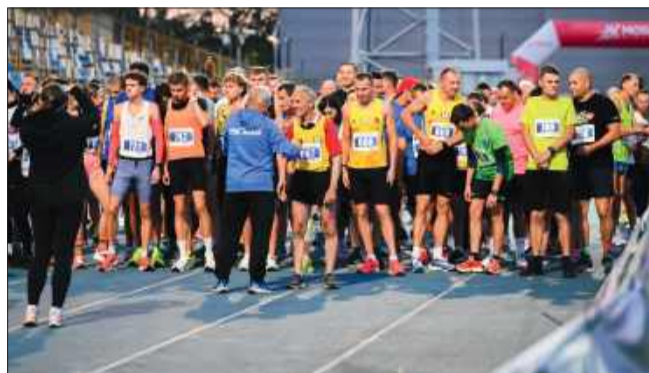
Do biegu... gotowi...!