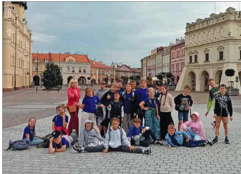
„Ziemia Mielecka” na festiwalu w Rudolowicach.

Dziecięcy Zespół Tańca „Ziemia Mielecka”, działający przy Domu Kultury Samorządowego Centrum Kultury w Mielcu, zachwyił publiczność podczas pierwszej edycji Festiwalu Folklorystycznego „Na Rudolowską Nutę” w Rudolowicach. Wydarzenie odbyło się 14 września i zgromadziło liczne zespoły z różnych regionów Polski.