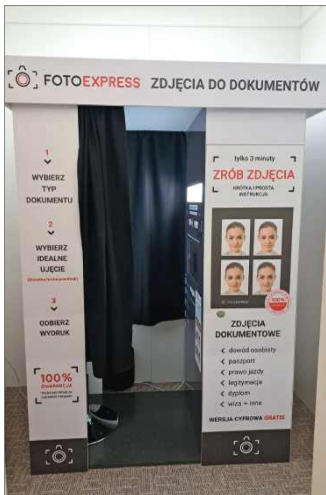
Tuszów Narodowy wprowadza ułatwienie dla mieszkańców – fotobudka w urzędzie.

Nowa fotobudka ma ułatwić mieszkańcom załatwienie formalności i skrócić czas potrzebny do uzyskania dokumentów.