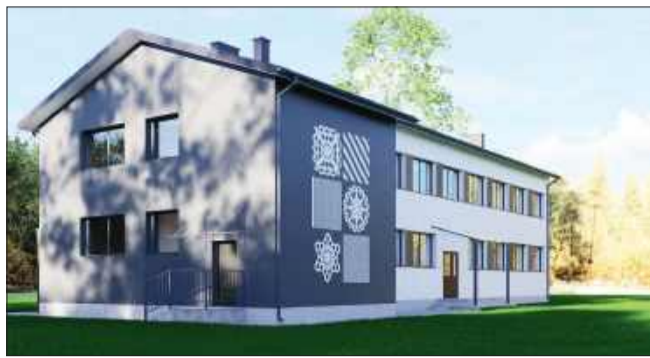
Tak ma wyglądać nowy Dom Seniora w Zabrnju.

- utworzenie na piętrze profesjonalnego centrum rehabilitacji, jadalni, pomieszczeń socjalnych i wypoczynkowych