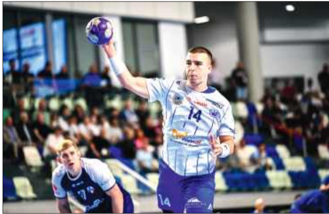
Dzięki zwycięstwu mielczanie mogą cieszyć się z kompletu punktów.