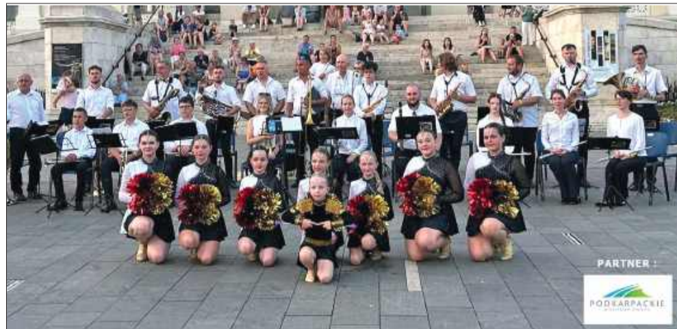
Wyjazd na festiwal to okazja do artystycznych występów i budowania wspólnych wspomnień.

Podczas drogi powrotnej do kraju członkowie zespołu mieli okazję zwiedzić Budapeszt. Z przewodnikiem odwiedzili