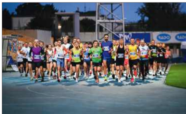
Start! Energia, emocje i tłum biegaczy gotowych na wyzwanie.