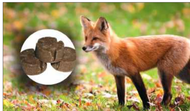
Program szczepienia lisów realizowany jest cyklicznie - każdej wiosny i jesieni.