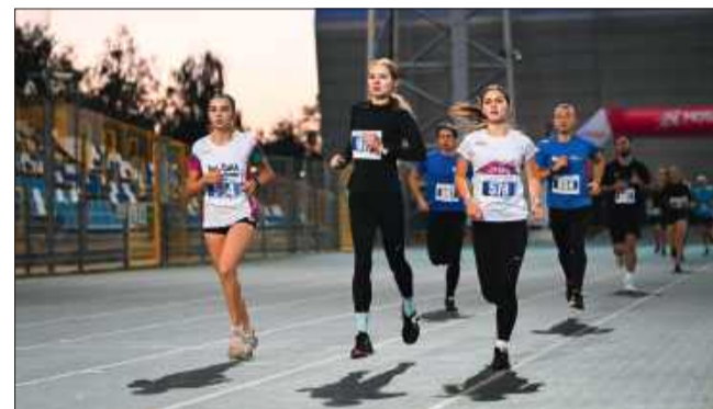
W biegu udział wzięli młodzi i starsi.