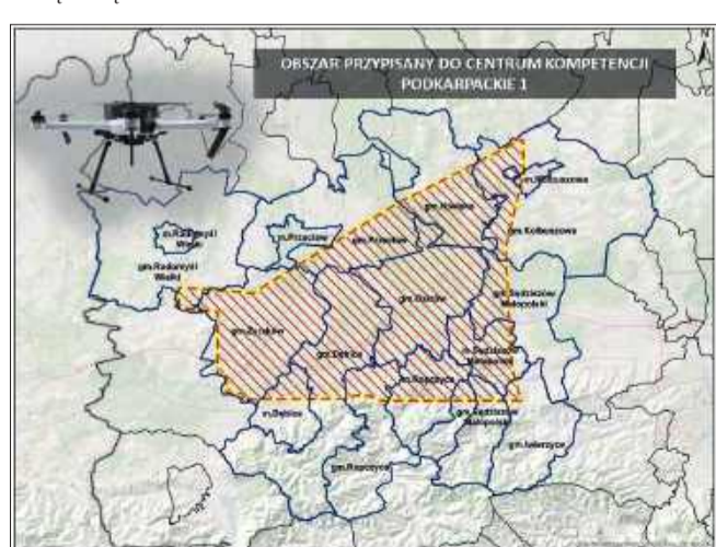
Projekt obejmie też powiat mielecki.

Nowe jednostki mają pełnić rolę zaawansowanych środowisk testowych i operacyjnych, umożliwiając realizację dynamicznych lotów dronów na masową skalę.