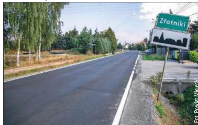
Nowa nawierzchnia w Złotnikach.