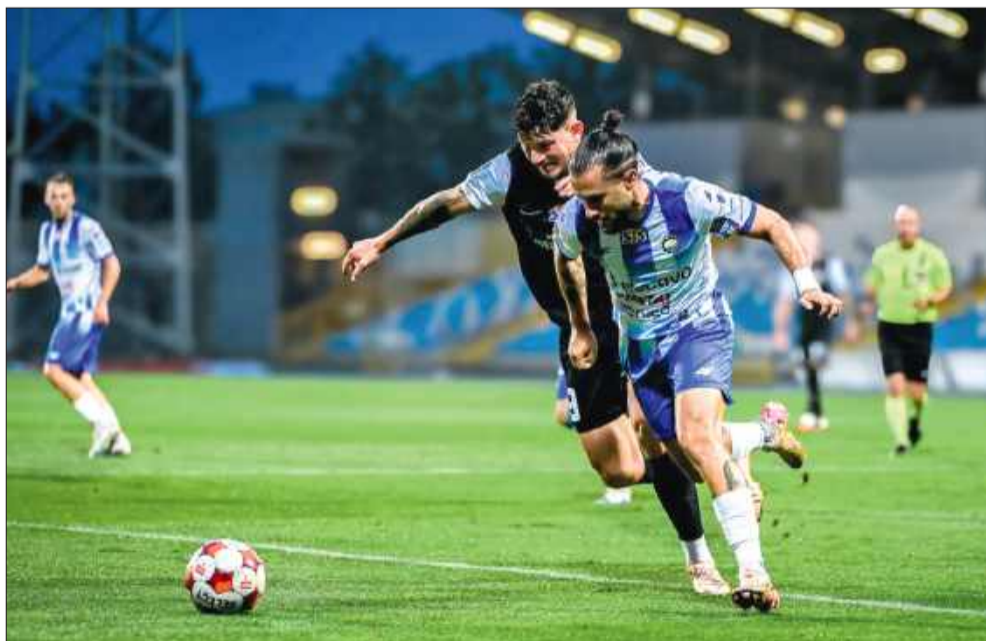
Stal Mielec szybko kończy przygodę w Pucharze Polski.