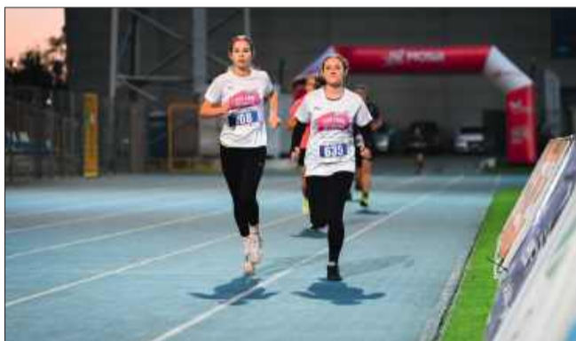
We własnym tempie.