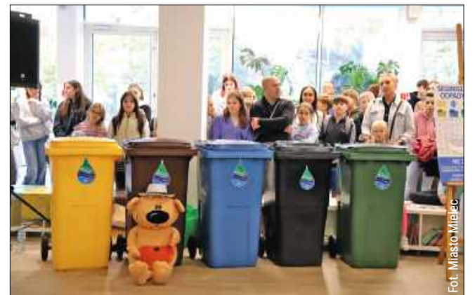
Wspólna akcja sprzątania to praktyczna lekcja odpowiedzialności.

Tegoroczne przedsięwzięcie nie mogłoby się odbyć bez wsparcia partnerów. Wsparcie organizacyjne i merytoryczne zapewnił: PZL Mielec Sp. z o.o. oraz BOO Organizacja Odzysku Opakowań i Odpowiedzialności Producenta S.A. jb