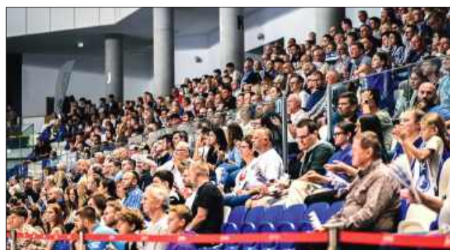
Trybuny pełne wiernych kibiców.