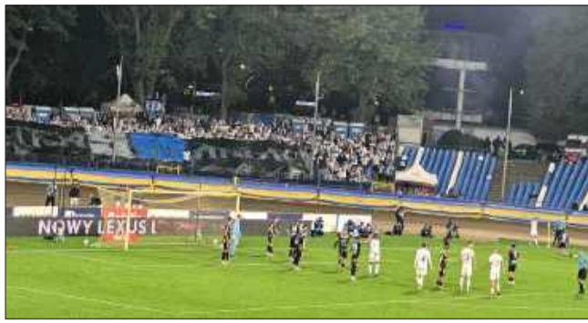
Porażka w derbach to już czwarta porażka z rzędu mielczan.

Pomimo przewagi gospodarzy najbliższy pierwszego gola w me-