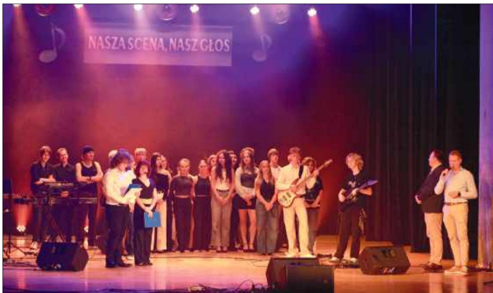
Zdolna mielecka młodzież.

W środę, 24 września, sala widowiskowa Domu Kultury SCK wypełniła się po brzegi. Wszystko za sprawą koncertu „Nasza scena, nasz głos”, w którym swoje talenty zaprezentowali uczniowie mieleckich szkół średnich.