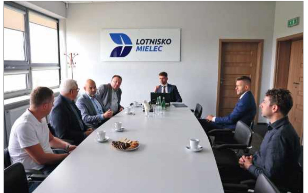
Lotnisko Mielec otwiera drzwi dla studentów Politechniki Rzeszowskiej.

Lotnisko w Mielcu coraz mocniej zaznacza swoją pozycję na lotniczej mapie Polski. Dzięki unikalnym uprawnieniom do prowadzenia szkoleń dla Służb Informacji Powietrznej (AFIS), już wkrótce stanie się ważnym centrum edukacyjnym dla studentów Politechniki Rzeszowskiej.