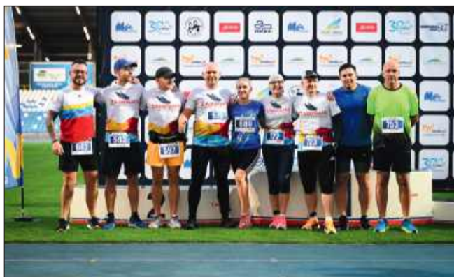
Prawdziwa moc biegania.