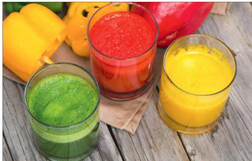
Jesienią szoty pomagają budować odporność.