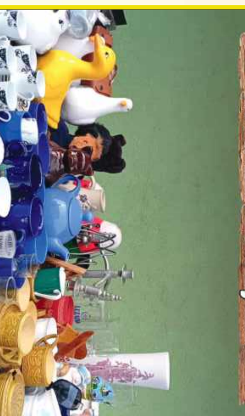
Co miesiąc na pchlim targu w Mielcu można znaleźć prawdziwe cudenka.