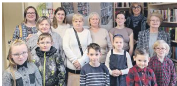
Najlepsi Czytelnicy 2024 roku ze swoimi bibliotekarkami i dyrektorem GBP w Borowie.

Strzelin, ul. Fabryczna 29 - naprzeciwko hurtowni stali