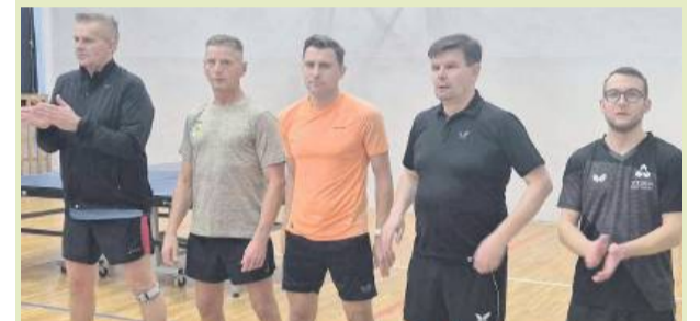
Granit Strzelin będzie walczył o mistrzostwo trzeciej ligi

zawodnicy pierwszy mecz drugiej części rozgrywek zagrają 22 lutego na wyjeździe z Orionem Brandą Szewce. Liderami naszej ekipy są Zbigniew Sobków,