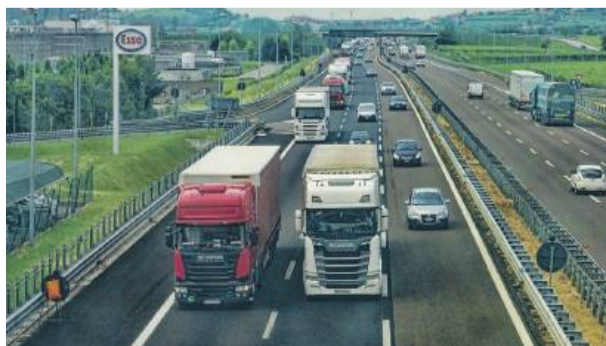
Nowa nitka autostrady A4 na południe od Wrocławia będzie miała trzy pasy plus jeden pas awaryjny. Fot. poglądowe