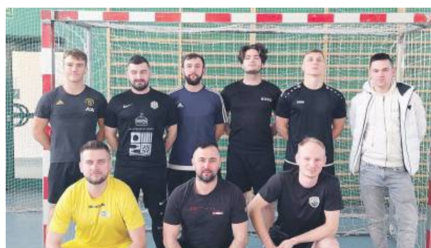
Buła i Spóła zajęła drugie miejsce