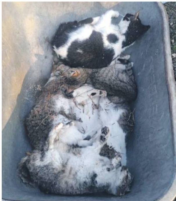
To kilka znalezionych kotów, które noszą ślady strasznej męki przed śmiercią