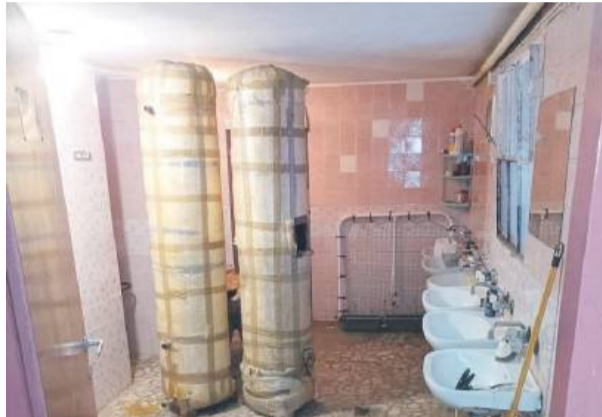
Tak kiedyś wyglądała łazienka piłkarzy Strzelinianki