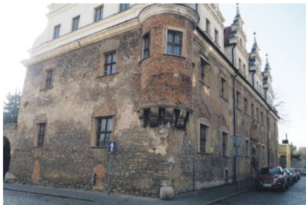
Zabytkowy dwupiętrowy obiekt przy strzelińskim rynku jest perełką Strzelina