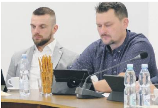
Radni pytali o wywóz odpadów na teren kopalni w Jegłowej

– Zakład produkcyjny, o którym mówimy, zwrócił się do marszałka województwa dolnośląskiego o zgodę na przetwarzanie odpadów w odpowiednich kodach. Ta procedura jest taka sama, wójt tylko opiniuje. Wydałem decyzję negatywną. Ta decyzja została zaskarżona do sądu i sąd uchylił moją negatywną decyzję. Ponownie odwołałem się od tej decyzji