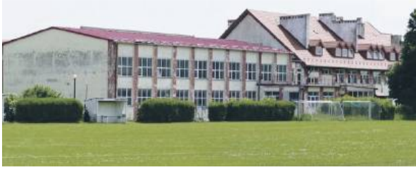
W Gminnym Przedszkolu Publicznym w Przewornie od września ma powstać nowy oddział przedszkolny

Celem nowego programu „Asystent osobisty osoby z niepełnosprawnością”, który będzie realizowany w 2025 roku przez Gminny Ośrodek Pomocy Społecznej w Przewornie, jest wprowadzenie usług asystencji osobistej w formie wsparcia w wykonywaniu codziennych czynności, a także zwiększenie szans osób z niepełnosprawnościami na prowadzenie bardziej