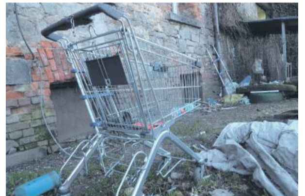
Po dawnych mieszkańcach wywieziono 10 ton odpadów. Obecnie pozostały jedynie drobne rzeczy

Pani kierownik informuje, że budynek został wyłączony