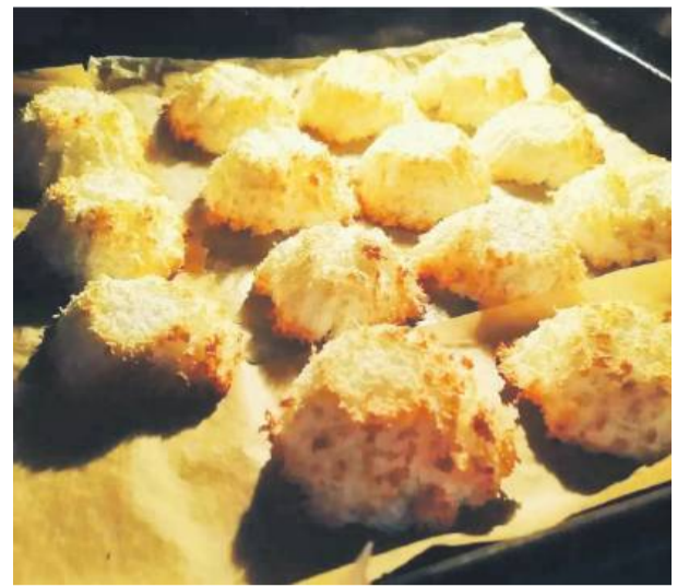
Upieczone słodkości szybko znikają z blachy