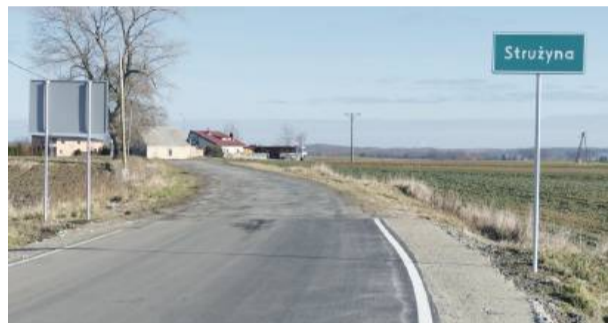
Kierowcy zastanawiają się, dlaczego remont nie został przeprowadzony do końca, pozostawiając na odcinku prowadzącym do wsi nierówności i wertepy

Remont rozpoczęto od strony Przeworno. Według