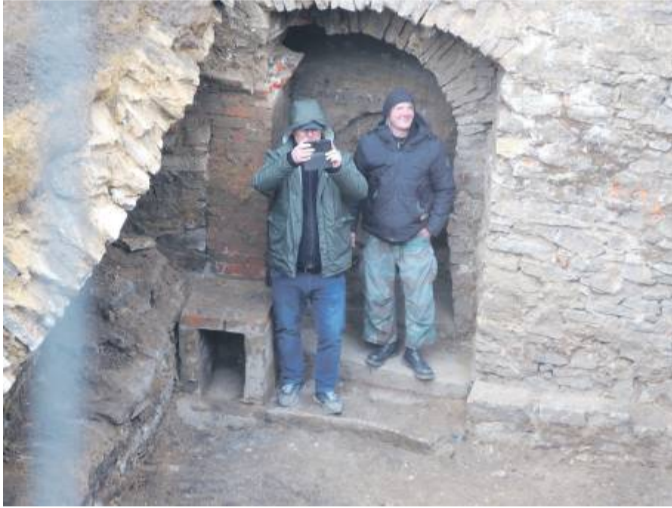
Odgruzowanie pomieszczeń i inwentaryzacja mają potrwać do przyszłego tygodnia

– W piwnicach znajdował się gruz po wyburzonych kamienicach. Po wojnie zasypano nim pomieszczenia. Archeolodzy tłumaczą, że dawniej mogły być tu magazynowane np. beczki z piwem. Mieszkańcy opowiadają, że w młodości