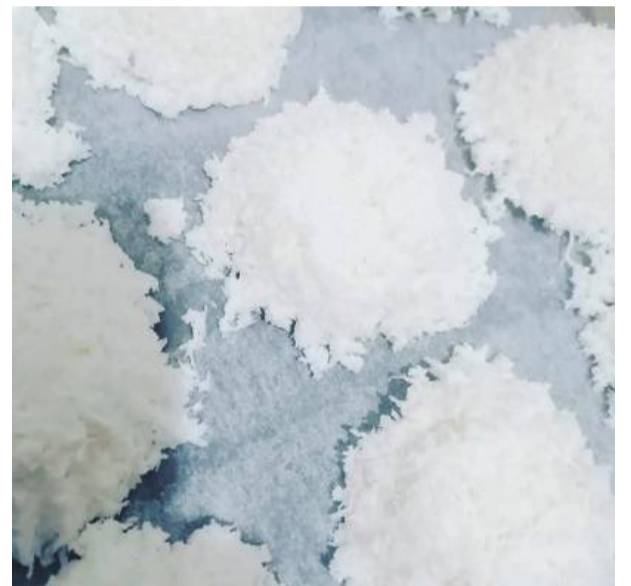
Ciasto jest luźne i może się troszkę rozpląwać, dlatego kokosanki warto układać troszkę dalej od siebie