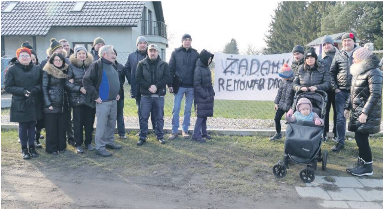
Ludzie domagają się remontu drogi i zapowiadają protest

Mieszkańcy Trześni domagają się konkretnych deklaracji. Pytają, czy oraz kiedy droga powiatowa w ich miejscowości zostanie wyremontowana i zapowiadają protesty, jeśli nie otrzymają wiążącej odpowiedzi. Jak mówią, nie mają nic do stracenia.