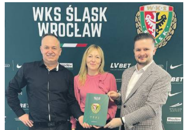
Przedstawiciele Świtezi i Śląska Wrocław podpisali umowę o współpracy