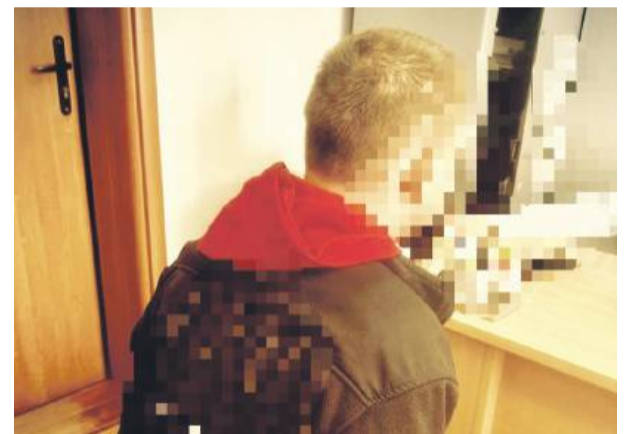
Pijany 32-latek trafił do policyjnego aresztu. Po wytrzeźwieniu usłyszał zarzuty.

Zgodnie z kodeksem karnym, zabór pojazdu w celu krótkotrwałego użycia zagrożony jest karą do 5 lat pozbawienia wolności. Jeśli