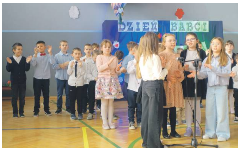
Występ artystyczny uczniów ze szkoły w Zielenicach.