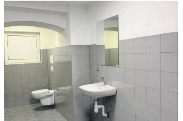
Jedno z pomieszczeń po remoncie

cjonalne i nowoczesne zaplecze dla strzeleckich piłkarzy. Szatnie w budynku klubowym przy ul. Okrzei w Strzelinie mają długą historię. Pierwotnie funkcję przebieralni pełniła tak zwana „sala kominkowa” na parterze, a na początku lat 90. ubiegłego wieku przeniesiono szatnię do pomieszczeń piwnicznych, które wcześniej służyły jako magazyny. Od tego czasu wnętrza nie były