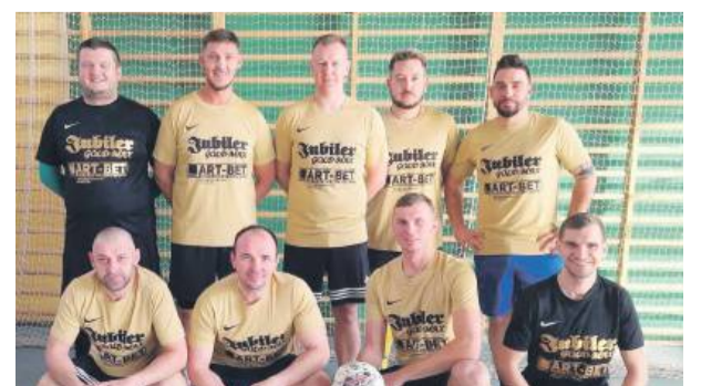
Jubiler Goldmax zamyka ligową stawkę