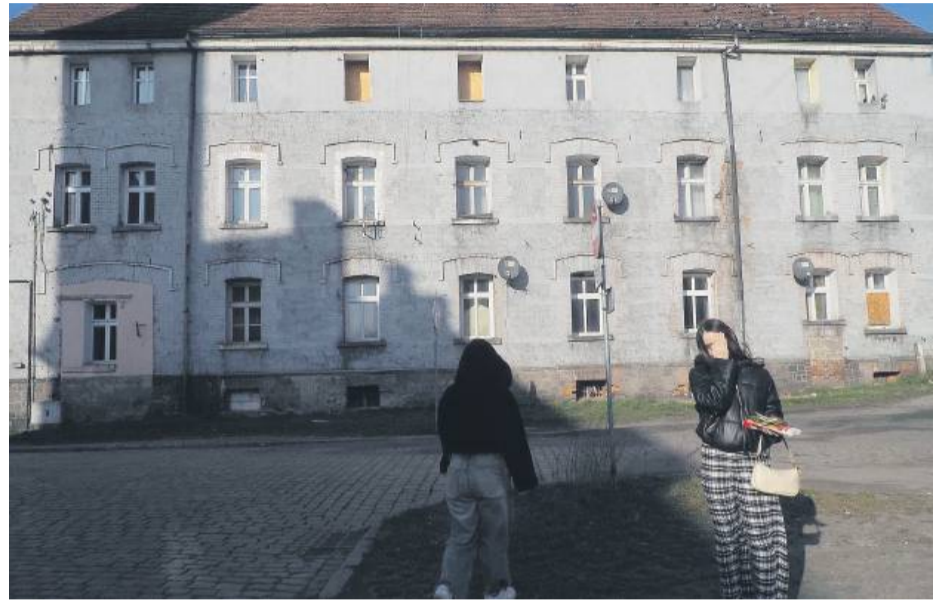
„Belweder” stoi pusty. Kilka tygodni temu wysiedlono ostatnich lokatorów

– „Belweder” opuściłem 7 lat temu i obecnie mieszkam przy ulicy Żeromskiego. Mam pokój z kuchnią, łazienką i ogrzewanie. Lokatorów wysiedlono do czystych lokali z centralnym ogrzewaniem. Tu musieli