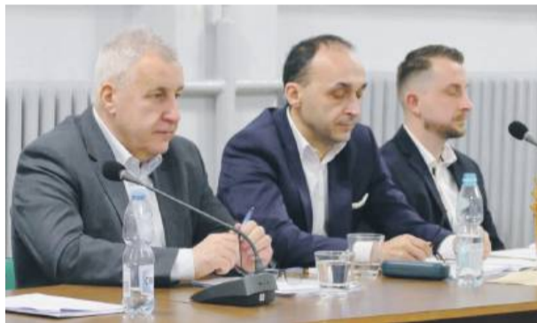
Przedłużono termin utworzenia żłobka w Jegłowej

Jest decyzja o nowym przebiegu autostrady A4 pod Wrocławiem