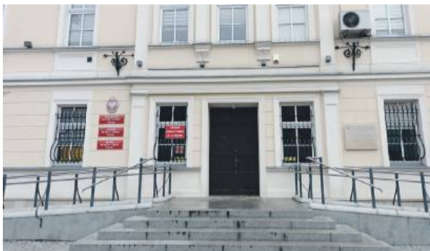
W wiązowskim ratuszu trwają prace remontowe, ale urząd pracuje normalnie