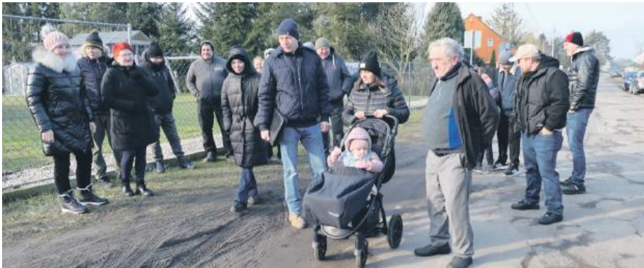
Fatalny stan drogi powiatowej w Trześni jest zmartwieniem mieszkańców

Sołtys podkreśla, że stan drogi znacznie pogorszył się około dwadzieścia lat temu, kiedy w pobliżu zaczęła działać międzynarodowa firma. – To była piękna droga, pod spodem jest dobrze ułożona kostka granitowa, ale ciężki transport ją zniszczył. Pod ziemią zniknęły krawężniki, wtedy oberwały pobocza, zapa-