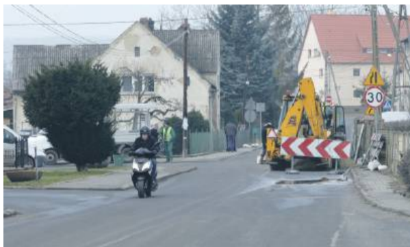
W związku z naprawą infrastruktury, droga była tymczasowo zamknięta, a obecnie wciąż obowiązują utrudnienia

wykop i odtworzono cały kanał burzowy, zastępując go szczelnie połączoną rurą karbowaną. Jest ona połączona z dwiema studzienkami – po obu stronach drogi – co ma zapobiec przyszłym awariom.