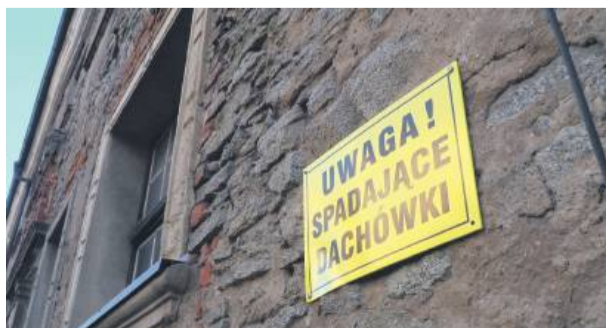
Najczęściej podczas wichur z budynku lecą dachówki

Czy dojdzie do zmian w Zarządzie Powiatu Strzelińskiego?