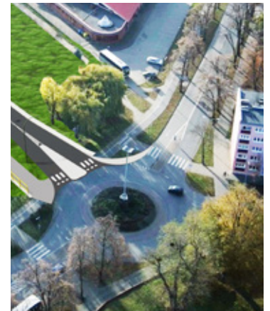
Przebudowa głównych dróg w mieście i budowa rond, nie zawsze miała zwolenników. Dziś wszyscy z tych dróg korzystają.