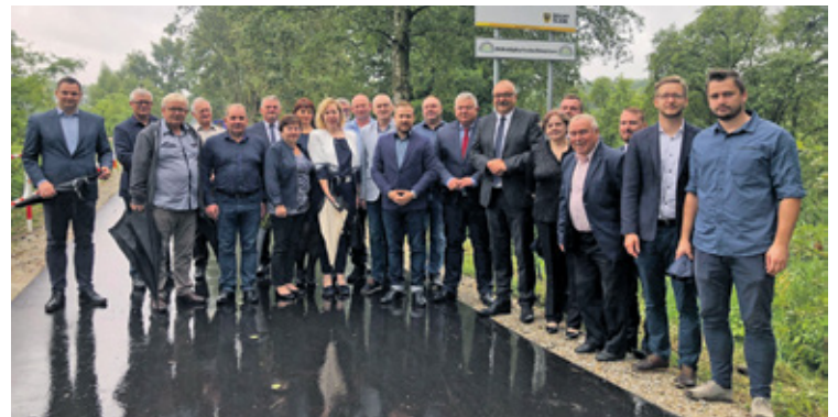
Samorządowcy, którzy stali za burmistrzem i jego inwestycjami dla Gminy Wołów. Zaufali mu.