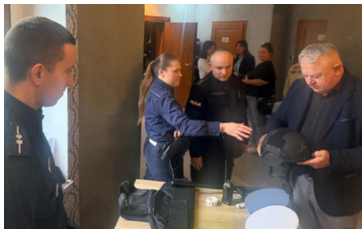
Policjanci prezentowali swój sprzęt do obrony.

To proste narzędzie – ale w kryzysie może okazać się bezcenne.