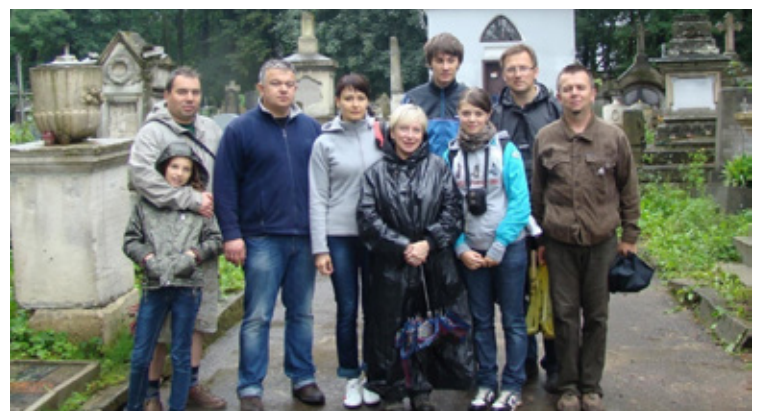
Remonty cmentarzy na Kresach, zaangażowanie w pomoc Polakom, którzy tam zostali po wojnie - te projekty zaczęły się jeszcze przed 2010 rokiem bez wsparcia samorządu. Pomimo krytyki, hejtu jaki wylewał się na burmistrza, pomoc trwa do dziś. Dziękujemy w imieniu tych, którzy ciągle tej pomocy potrzebują mieszkając na terenie objętym wojną. Są tam i żyją Polacy.