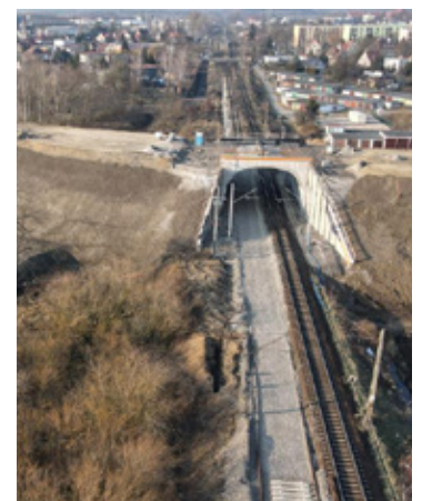
Wiadukt w trakcie budowy wraz drogami.