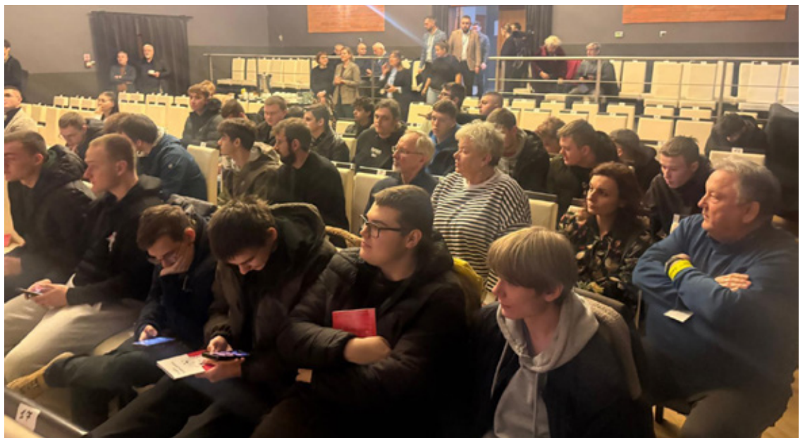
Na spotkaniu z samorządowcami byli zaproszeni uczniowie jednej ze szkół, którzy odebrali już poradniki.