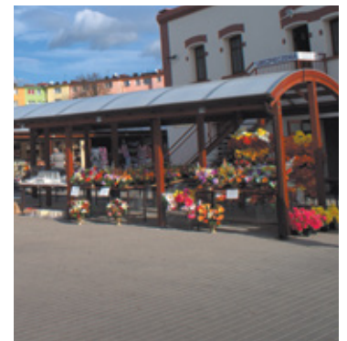
Targowisko Miejskie. Długowieczna tradycja targów w Wołowie została doceniona. Remont wart 1 764 154,60 zł współfinansowany był ze środków Europejskiego Funduszu Rolnego w ramach Programu Rozwoju Obszarów Wiejskich na lata 2007 – 2013 oraz budżetu gminy Wołów - pisaliśmy w Kurierze Gmin. To również jedna z pierwszych zrealizowanych inwestycji nowego burmistrza w latach 2010-2014.