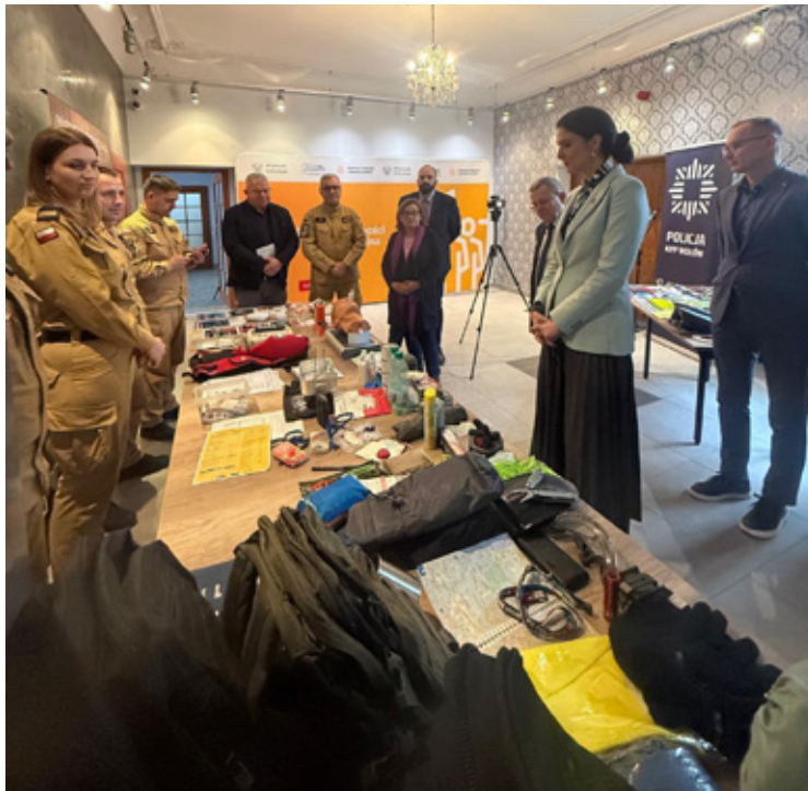
Straż pożarna i policja prezentowały swoje wyposażenie.

To właśnie podczas tych rozmów akcentowano potrzebę: - dotarcia z rzetelną informacją bezpośrednio do mieszkańców,