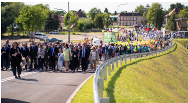
Otwarcie wiaduktu wraz z śródmiejskim obejściem Wołowa.