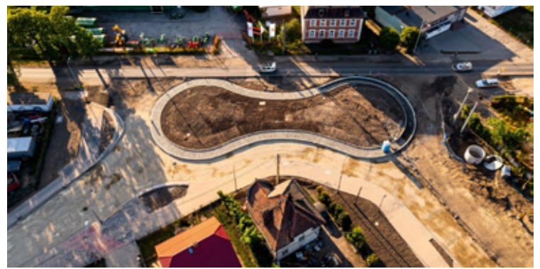
Piękne rondo biskoptowe, dziś miasto może się nim pochwalić. W czasie budowy przeciwnicy zmian krytykowali pomysł.