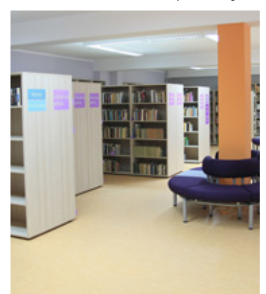
Wyremontowana biblioteka. To jedna z kolejnych inwestycji, które powstały w Wołowie.