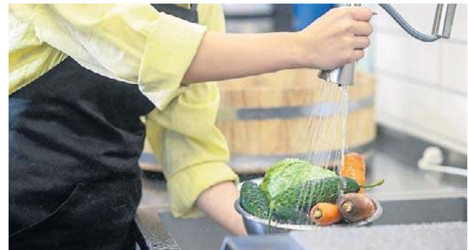
Jak zmniejszyć ilość pestycydów w jedzeniu? Jednym ze sposobów jest właściwe mycie