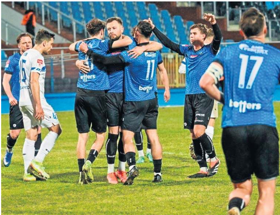
Zawisza Bydgoszcz zdobył w Niechorzu aż 7 goli i umocnił się w fotelu lidera