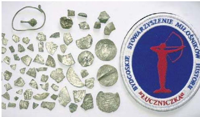
Znaleziona dotychczas część skarbu składa się z całych i pofragmentowanych monet oraz wyrobów jubilerskich w postaci złomu kruszcowego

Najstarszą monetą jest dirhem abbasydzkiego kalifa Harūna ar-Rašīda wybita w Madinat Bal w AH 185–88 (AD 801/2–803/4).