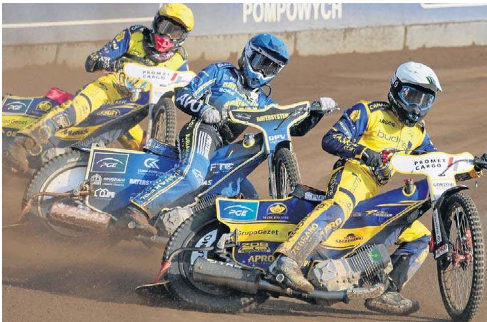
Stal Gorzów okazała się nadspodziewanie mocnym rywalem dla GKM

To był sygnał, że tego dnia gorzowianie świetnie czują się na gruziędzkim torze. Niewiel-