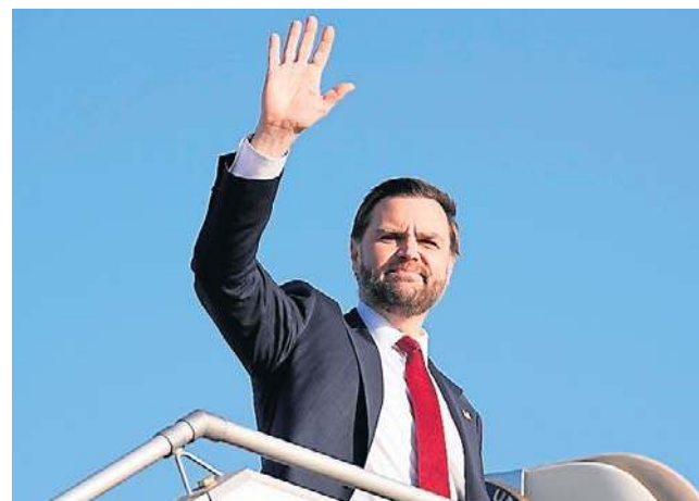
Wiceprezydent USA J.D. Vance opuścił w niedzielę Islamabad po fiasku rozmów z Iranem na temat pokoju na Bliskim Wschodzie

Prowadzone w sobotę w stolicy Pakistanu negocjacje pokojowe między Iranem a USA zakończyły się niepowodzeniem, co przyznały zarówno irańskie oficjalne media, jak i stojący na czele amerykańskiej delegacji wiceprezydent J.D. Vance. Delegacje obu krajów już wyjechały z Pakistanu. Wcześniej na konferencji prasowej Vance mówił, że „wraca do Stanów Zjednoczonych bez osiągnięcia porozumienia” po 21 godzinach