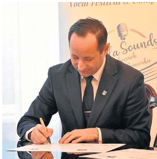
Referendum w sprawie odwołania burmistrza Ciechocinka, będzie kulminacją trwającego od miesięcy sporu o kierunek rozwoju uzdrowiska

Choć początkiem konfliktu była planowana budowa biogazowni z kompostownią w pobliżu tężni, dziś spór ma znacznie szerszy charakter. Organizatorzy referendum podkreślają,