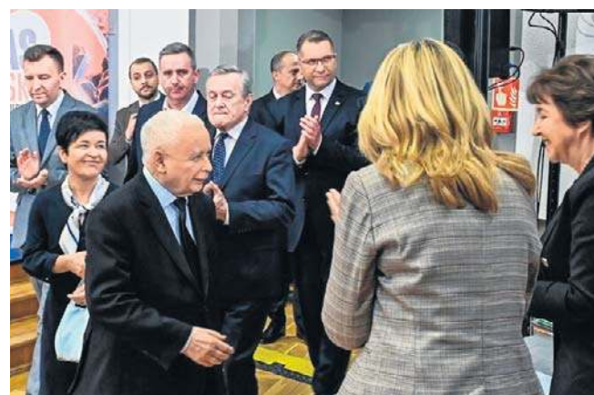
Podczas konwencji Prawa i Sprawiedliwości zapowiedziano zwiększenie wydatków na naukę do 3 PKB