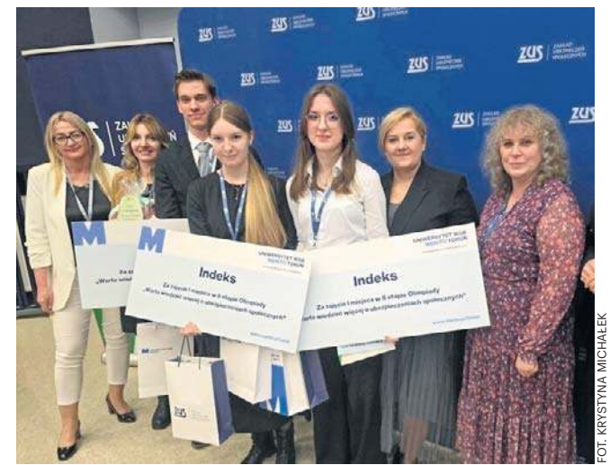
Olimpiada jest zwieńczeniem projektu „Lekcje z ZUS”

Na zwycięzców czekają nagrody rzeczowe: laptopy za I miejsce, tablety za drugie oraz czytniki e-booków za trzecie