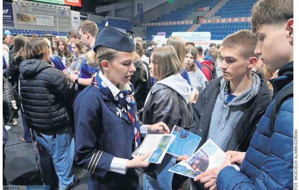
Uczniowie mieli też okazję poznać ofertę szkół średnich podczas Targów Edukacyjnych

W ubiegłym tygodniu w Hali Mistrzów zorganizowano Włocławskie Targi Szkół, na których szkoły prezentowały swoje oferty. Szkoły otworzyły też swoje podwoje dla ósmoklasistów. Zespół Szkół Budowlanych i Zespół Szkół Ekonomicznych i Zespół Szkół Chemicznych, Zespół Szkół Samochodowych we Włocławku, zaprosiły uczniów już w tym tygodniu, by zaprezentowały ofertę przygotowaną na nadchodzący rok szkolny. Ze-