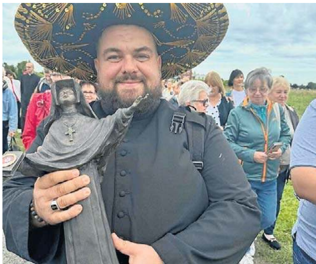
Ksiądz z Lipna walczy o życie po wypadku w Łochocinie. Wierni modlą się o jego zdrowie

Adres e-mail: redakcja.wloclawek@polskapress.pl