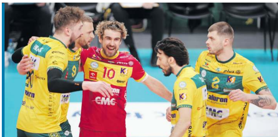
Zawiercianie muszą poprawić grę, by złoto nie przeszło im koto nosa.

RZESZÓW, 17.30: Asseco Resovia – PGE Projekt Warszawa (1-2)