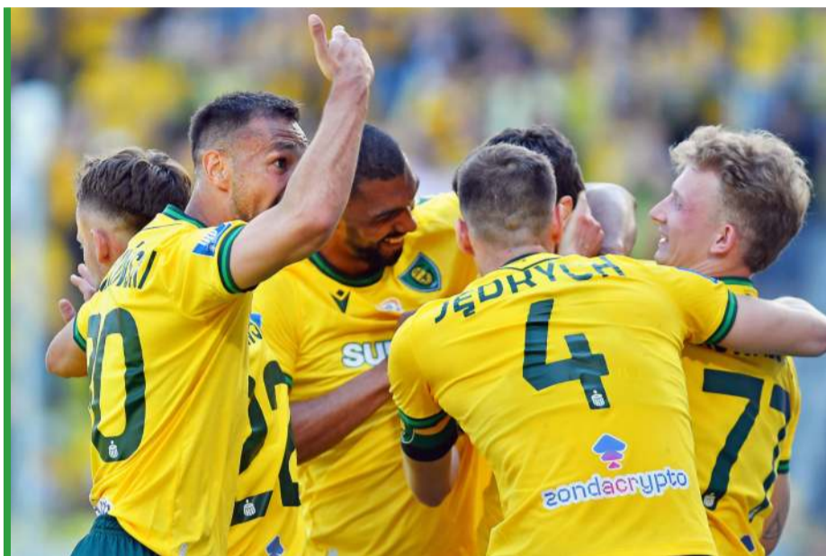
Czy latem zobaczymy Katowiczan w Europie?