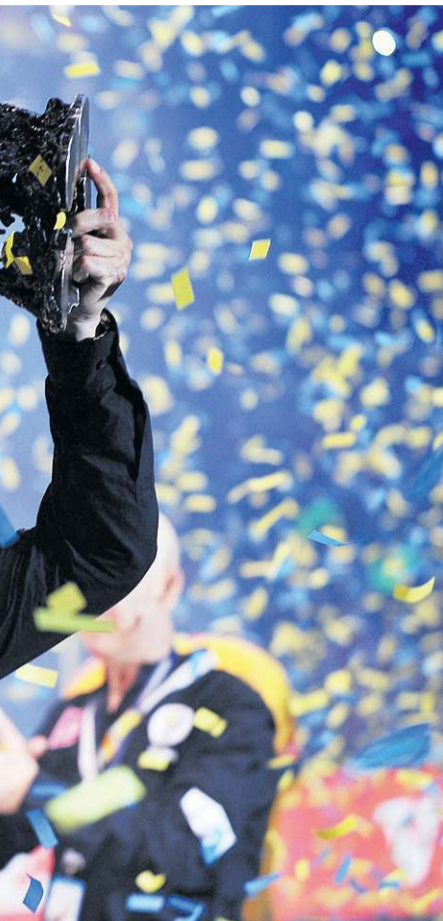
Wycięstwo w Lidze Mistrzów w 2016 roku.