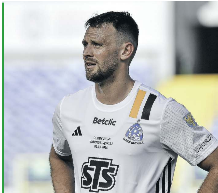
Watson zaliczył niefortunne wejście do Ruchu, ale ostatnio z Odrą pokazał się z dobrej strony!