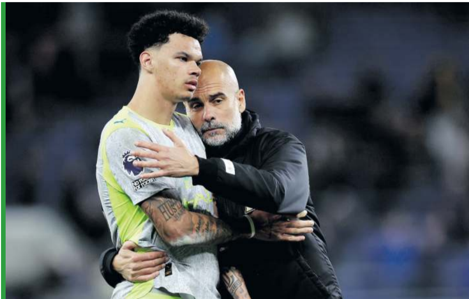
Po remisie z Evertonem Pepowi Guardioli (z prawej) pozostało tylko się przytulić.

Do końca sezonu Premier League zostały trzy kolejki, ale ekipa z błękitnej części Manchesteru ma jeszcze zaległy mecz z Crystal Palace. Gdyby ogrzała i Everton, i Palace, oznacza-