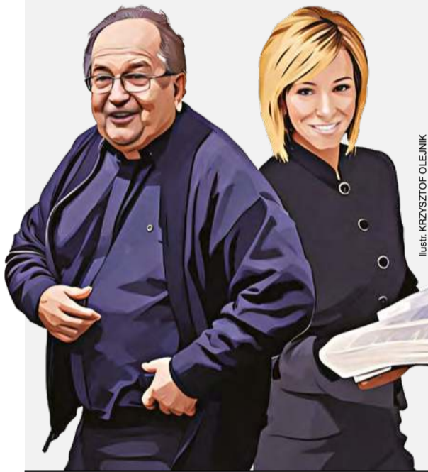
ILUSTRACJA: KRZYSZTOF OLEJNIK

Oto krótkie zestawienie duchowych przywódców z Polski i USA z konserwatywnych fabryk religijnego zamordyzmu na wypadek, gdyby w nowym porządku amerykańskiej dyktatury Trumpa pod groźbą łamania kołem i wyrywania paznokci przyszło opowiedzieć się za jedną z opcji.