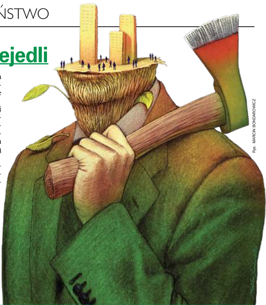
Rys. MARCIN BONDAROWICZ

Ekologom na takie dictum poopały szczęki. A potem znowu, kiedy okazało się, że nasze 210 tys. dzików przeznaczonych do wybitcia w 2019 r.