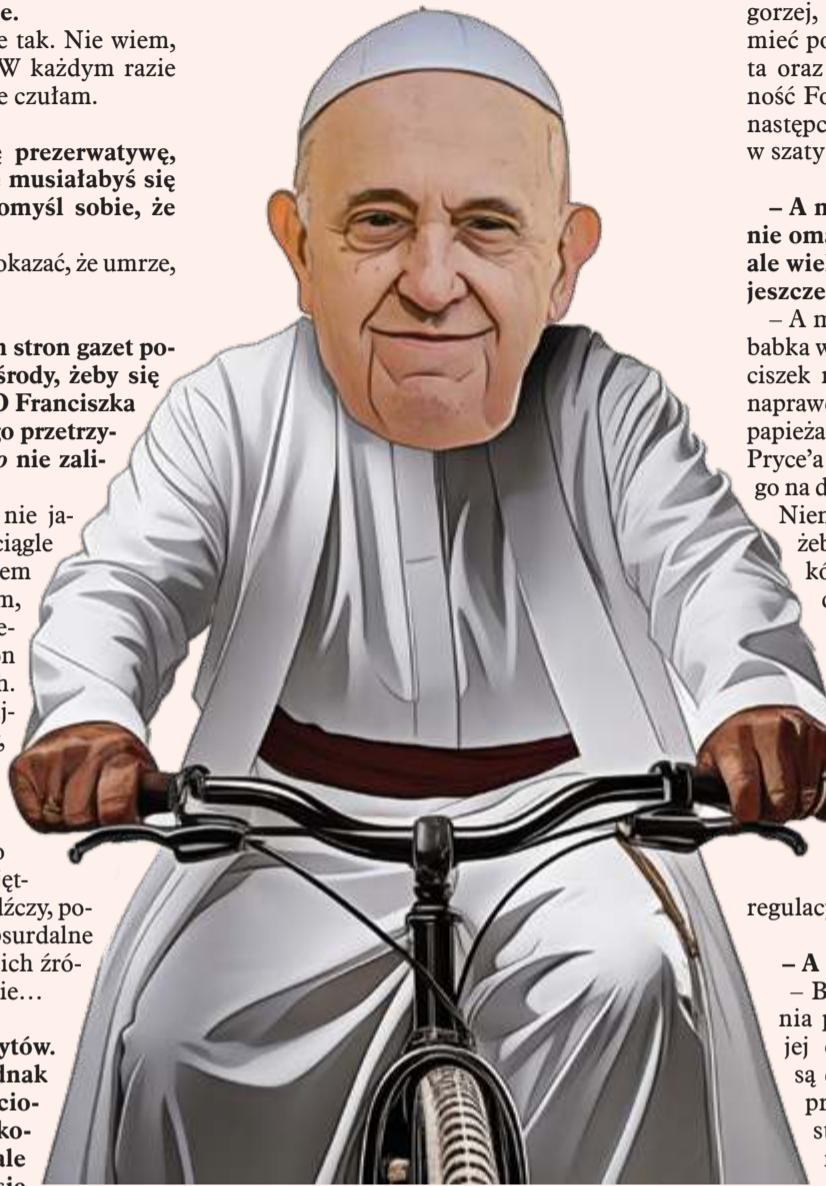
Ilustr. KRZYSZTOF OLEJNIK

– Cierpienie dupy kardynała na fotelu Fiata Punto było tego warte. No i nie należy zapominać o tym, że NATO szczekało u drzwi Rosji, z czym się absolutnie zgadzam.