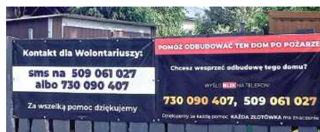
Każda złotówka ma znaczenie...