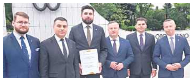
Wśród inicjatorów założenia Komitetu Obywatelskiej Inicjatywy Ustawodawczej „Stop banderyzmowi” są prezydenci Chełma i Puław, a także inni politycy z Lubelszczyzny

W skład komitetu weszli samorządowcy, działacze społeczni oraz osoby zaangażowane w upamiętnianie ofiar zbrodni dokonanej