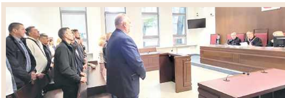
Sala rozpraw była w czwartek wypełniona do ostatniego miejsca. W sądzie stawili się bowiem zwolennicy burmistrza w sile około 20 osób. Wniosek o możliwość uczestnictwa w procesie zgłosiły cztery organizacje, w tym dwie ochotnicze straże pożarne. Dwie z tych organizacji dostały zgodę sądu i zabrały głos

Dostarczono listę podpisów mieszkańców, którzy podpisali się