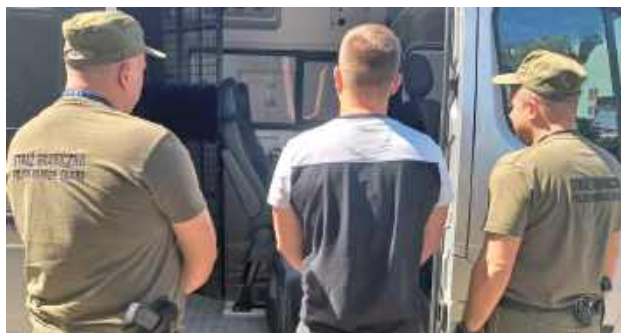
Przez okres sześciu lat nie będzie mógł powrócić do Polski. Ma też zakaz wjazdu do krajów strefy Schengen

- Ustalono, że mężczyzna organizował transporty nielegalnych migrantów z rejonu