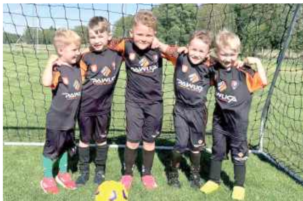
Akademia Malucha została stworzona dla najmłodszych pociech z roczników 2020-2022

Klub Sportowy Drelów wychodzi naprzeciw oczekiwaniom mieszkańców. Z myślą o dzieciach, które stawiają swoje pierwsze kroki w sporcie, ruszyła „Akademia Malucha”. Dzięki strategicznemu partnerstwu z lokalną firmą Pawlica, nowi adepci piłki nożnej mogą liczyć na profesjonalne stroje, a przez pierwsze miesiące – na całkowicie darmowe treningi.