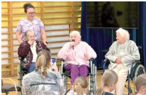
Wizyta gości wywołała ogromny entuzjazm zarówno wśród najmłodszych dzieci, jak i starszej młodzieży

Z okazji Dnia Dziecka 3 czerwca w murach Publicznej Szkoły Podstawowej im. Henryka Sienkiewicza w Halasach zagościli zaprzyjaźnieni pensjonariusze z „Lawendowego Zakątką”.