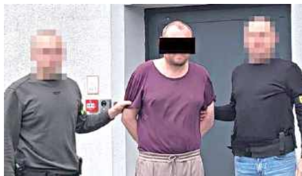
Jak wynika z ustaleń policji, sprawcą zdarzenia był 55-letni obywatel Ukrainy kierujący samochodem marki Volkswagen

Policja zatrzymała na miejscu 39-letniego pasażera, który miał ponad 2 promile alkoholu w organizmie. Pozostałych dwóch mężczyzn zatrzymano w wyniku działań funkcjonariuszy w Bełżycach. W chwili zatrzymania