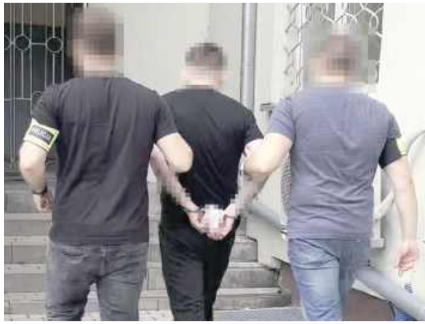
Grozi mu kara do 10 lat pozbawienia wolności

- W trakcie prowadzonych czynności policjanci potwierdzili posiadane informacje. W miejscu zamieszkania mężczyzny, garażu, a także aucie