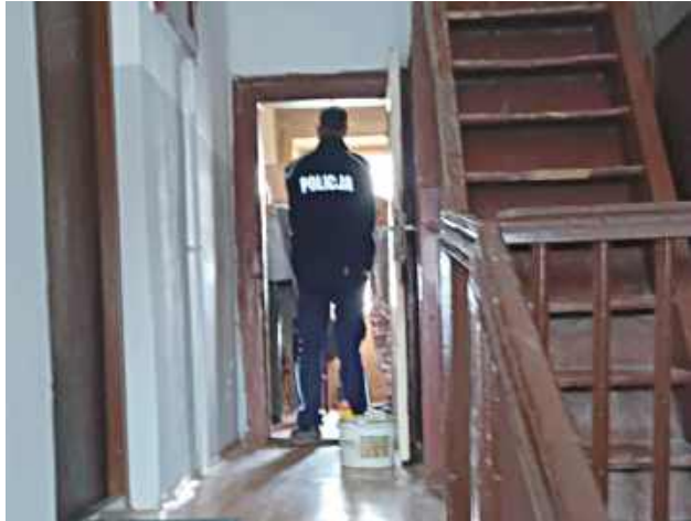
Komornik wszedł do lokalu w asyście policjanta