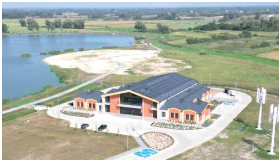
Gminne Centrum Kultury w Kobylanach ma imponujące rozmiary oraz nowoczesne wyposażenie. To tam zostanie zorganizowany 21. Festiwal „Kultura bez Granic” 2026

Przygotowane opracowanie ma na celu umożliwienie Państwu szerszego spojrzenia na decyzje podejmowane przez władze gminy oraz przybliżenie ich realizacji i efektów. Nasze wspólne dokonania są konkretne i niezaprzeczalne, są dowodem aktywności władz samorządowych, sołtysów, pra-