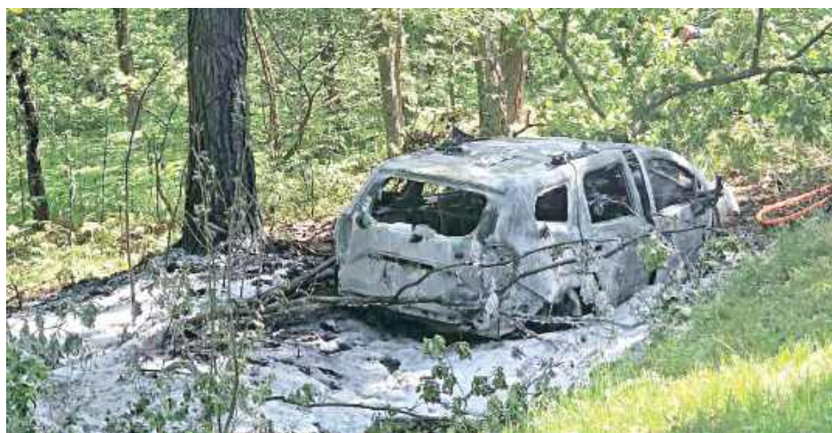
Pojazd wpadł do przydrożnego rowu, uderzył w drzewa, po czym stanął w płomieniach

Pojazd wpadł do przydrożnego rowu, po czym z ogrom-