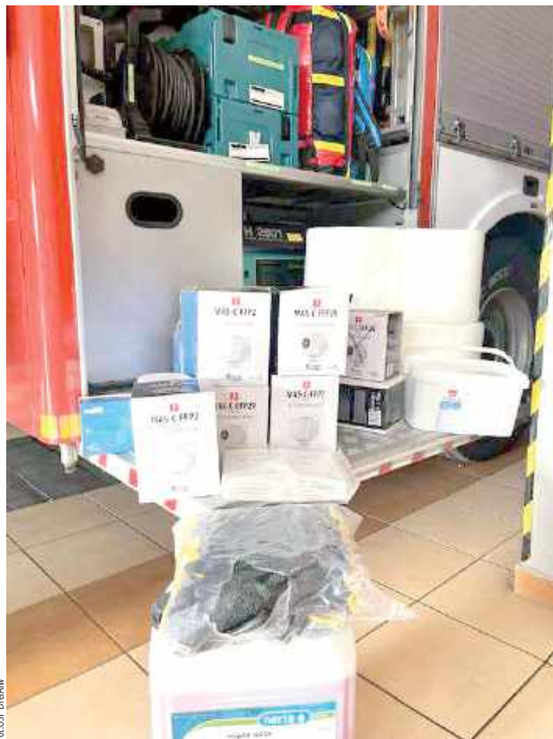
Jednostka otrzymała maseczki ochronne, rękawiczki jednorazowe, profesjonalną chemię do mycia aut oraz inne materiały eksploatacyjne

W ramach darowizny do remizy OSP trafił okazały zapas asortymentu pierwszej potrzeby. Wśród przekazanych materiałów znalazły się m.in. maseczki ochronne i rękawiczki jednorazowe, które są absolutnie kluczowe dla zachowania standardów sanitarnych podczas interwencji medycznych i ratunkowych. Ponadto stra-