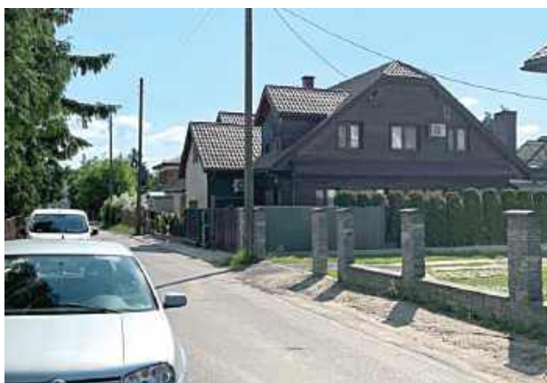
Do zbrodni doszło w jednym z budynków mieszkalnych przy ul. Polnej w Białej Podlaskiej

Miała bardzo wysoką średnią i wzorowe zachowanie.