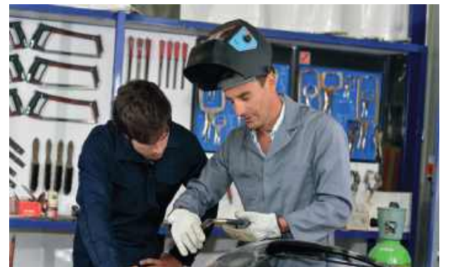
Wydatek finansowany ze środków KPO w ramach inwestycji A3.1.1 KPO pn. „Wsparcie rozwoju nowoczesnego kształcenia zawodowego, szkolnictwa wyższego oraz uczenia się przez całe życie”

modelu, w którym człowiek przez całe życie gromadzi potwierdzenia kolejnych kompetencji, budując własny „portfel umiejętności”. Dzięki temu łatwiej będzie dostosowywać się do zmian na rynku pracy, rozwijać zainteresowania i podejmować nowe wyzwania zawodowe.