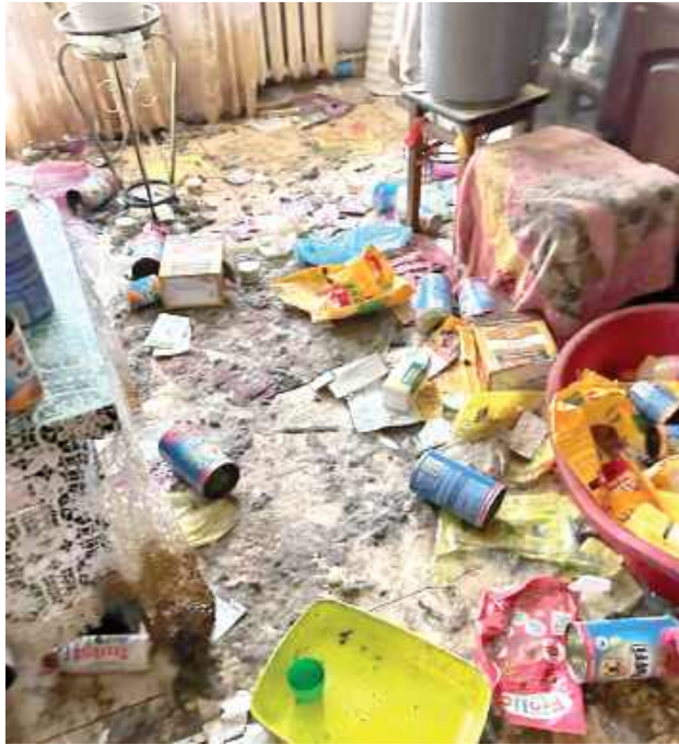
Taki widok zastali wolontariusze fundacji Po Ludzku do Zwierząt „Przyjazna Łapa” oraz interweniujące w mieszkaniu służby