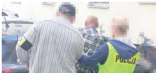
Podczas jednej z ostatnich interwencji miał dodatkowo grozić żonie pozbawieniem życia, używając noża

61-letni mężczyzna został tymczasowo aresztowany w związku z podejrzeniem znęcania się nad żoną oraz kierowania pojazdem w stanie nietrzeźwości. Decyzję w tej sprawie podjął sąd na wniosek prokuratury i policji.