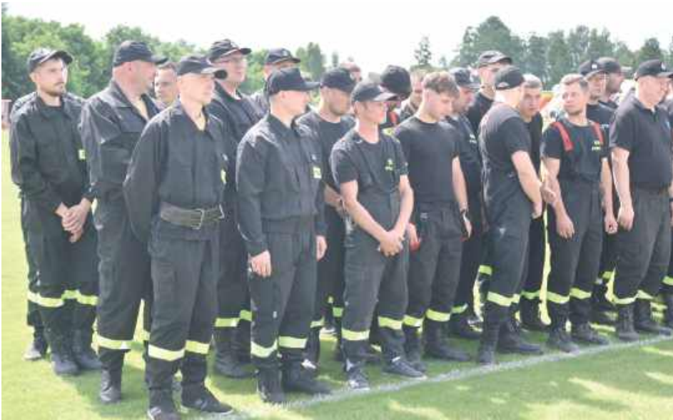
W zawodach wzięło udział blisko 30 drużyn z miasta i gminy Międzyrzec Podlaski oraz gminy Drelów

Stadion MOSiR w Międzyrzeczu Podlaskim zamienił się 7 czerwca w prawdziwą arenę zmagania strażackich. Odbyły się tam XXXIV Miejsko-Gminne Zawody Sportowo-Pożarnicze Ochotniczych Straży Pożarnych.