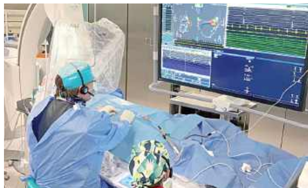
Uniwersytecki Szpital Kliniczny nr 4 w Lublinie jako pierwszy ośrodek w województwie lubelskim wdrożył innowacyjny system diagnostyki i terapii złożonych arytmii Affera™ Mapping and Ablation System

- Wykorzystana przez nas technologia jest pierwszą, która łączy w sobie trzy rzeczy. Za pomocą jednego systemu