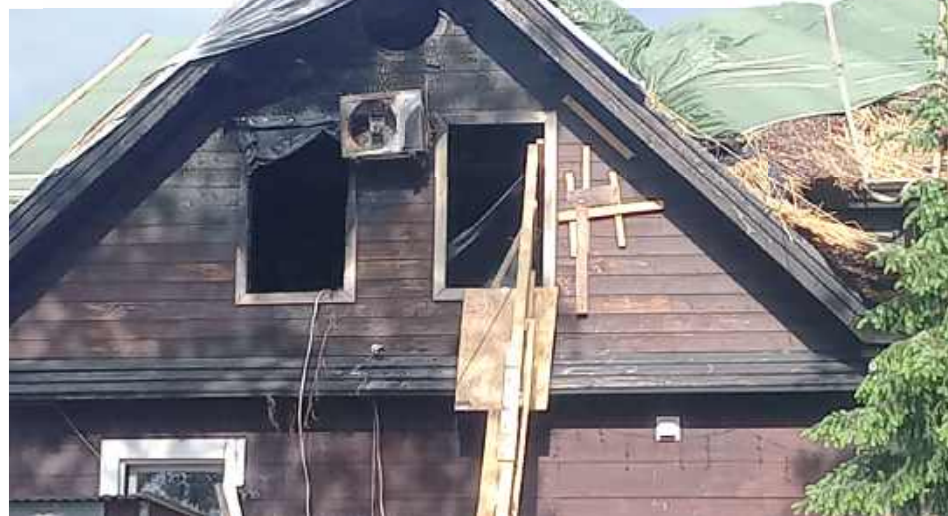
Przed rodziną trudne zadanie odbudowy starego domu

Drewniany dom ma około stu lat. Został wybudowany w tradycyjnej technologii. Aby zachować dawny charakter i niepowtarzalny klimat, zastosowano pokrycie trzciną. Budynek wyróżniał się charakterystycznym wyglądem