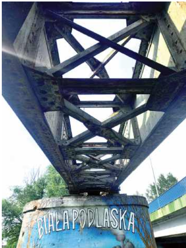
W Białej Podlaskiej zachował się most, po którym jeździła wąskotorówka

Wśród obiektów objętych procedurami znajdują się dawne budynki stacyjne w Białej Podlaskiej – zarówno stacja Biała Podlaska Miasto, jak i Biała Podlaska Wąskotorowa – a także stacja w Leśnej Podlaskiej oraz budynek dawnej stacji w Janowie Podlaskim, wybudowany w latach 20. XX