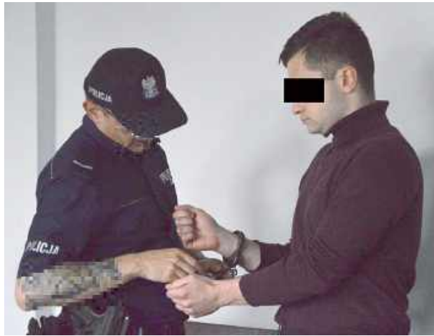
- Zapewniłem mu nocleg, jedzenie. Nie miałbym nigdy zamiaru zabić takiej osoby - wytłumaczył się krótko w czwartek w sądzie Krzysztof N.

Przy okazji zgłaszający znieważał dwóch dyspozytorów numeru alarmowego, obrażając ich wulgarnie oraz ich rodziny.