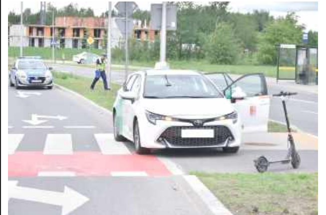
W chwili zdarzenia kierujący pojazdami byli trzeźwi

Kierujący Toyotą zderzył się z kobietą jadącą hulajnogą elektryczną. Do zderzenia doszło na przejeździe dla rowerów.