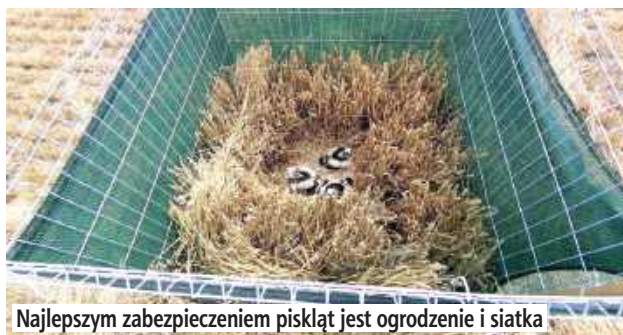
Najlepszym zabezpieczeniem piskląt jest ogrodzenie i siatka

Błotniak łąkowy to ptak terenów otwartych, silnie związany z krajobrazem rolniczym. Żywi się głównie gryzoniami polnymi oraz dużymi owadami, dzięki czemu pomaga w naturalny sposób