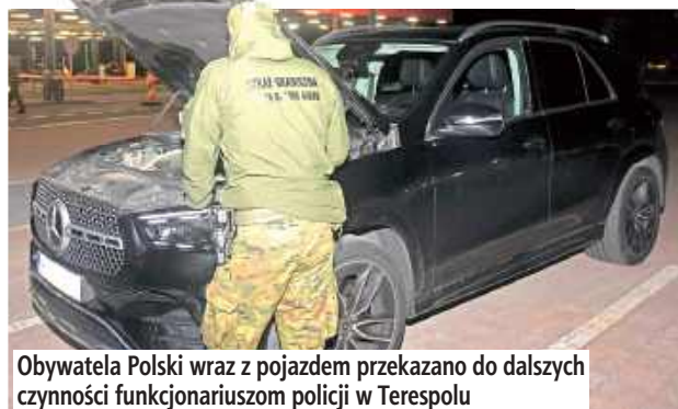
Obywatela Polski wraz z pojazdem przekazano do dalszych czynności funkcjonariuszom policji w Terespolu

Obywatela Polski wraz z samochodem przekazano do dal-