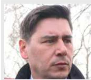
Dariusz Stefaniuk, poseł na Sejm RP

Kilkanaście tysięcy pacjentów i kadra Mental-Med w Białej Podlaskiej nadal nie mają pewności, czy od 1 lipca będą świadczenia psychiatryczne finansowane z NFZ. Szwankuje eksperyment z pilotażowym programem Centrum Zdrowia Psychicznego w Radzynie Podlaskim, które miało objąć zasięgiem Białą Podlaską i powiat biały.