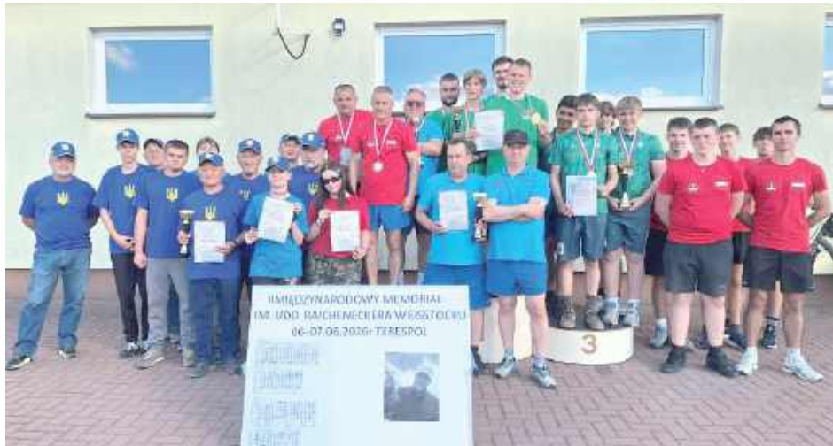
Pamiątkowe zdjęcie uczestników rywalizacji

Kolejne miejsca zajęli: IV miejsce - druga drużyna z Terespolu - 12 pkt, V miejsce - Ukraina I - 8 pkt, VI miejsce - ALO Terespol - 4 pkt, VII miejsce - Ukraina II - 2 pkt.