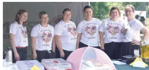
Równoległe do zawodów odbywał się festyn rodzinny, gdzie można było spróbować przysmaków przygotowanych przez panie z KGW

oddawali się zabawie na bezpłatnych dmuchańcach. Ogromnym zainteresowaniem – i to niezależnie od wieku – cieszyła się również wystawa sprzętu ochrony przeciwpożarowej, dzięki