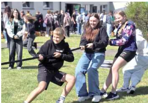
Uczniowie i goście mogli spróbować swoich sił w przeciąganiu liny