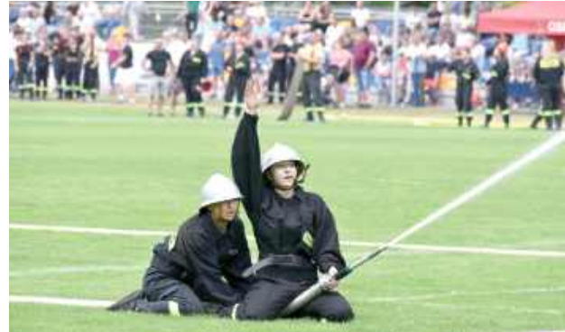
Zawody składały się ze sztafety 7x50 metrów oraz ćwiczenia bojowego

Podczas gdy część dorosłych gorąco kibicowała swoim faworytom na trybunach, inni mogli delektować się regionalnymi i domowymi przysmakami, serwowanymi na bogato zaopatrzonych stoiskach przygotowanych przez niezawodne koła gospodyń wiejskich. W tym czasie najmłodszy uczestnicy imprezy