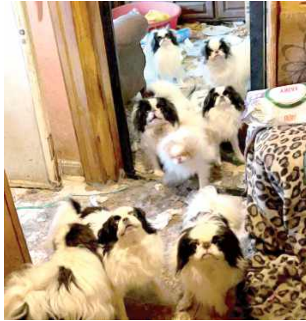
W niewielkim, dwupokojowym mieszkaniu przebywało 12 psów rasy chin japoński. Zwierzęta miały bać się słońca, bo nie były wyprowadzane na spacer. Były zaniedbane, w sierści miały wczepione odchody

- To, co zobaczyliśmy, odebrało nam mowę. W całym mieszkaniu znajdowały się odchody