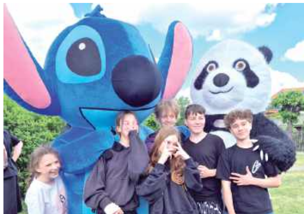
Dużym zainteresowaniem cieszyli się nietypowi goście – ogromne maskotki

W Zespole Szkół Ekonomicznych im. Marii Dąbrowskiej z okazji Dnia Dziecka szkolne boisko oraz teren wokół szkoły zamieniły się w miejsce pełne atrakcji sportowych, rekreacyjnych i integracyjnych.