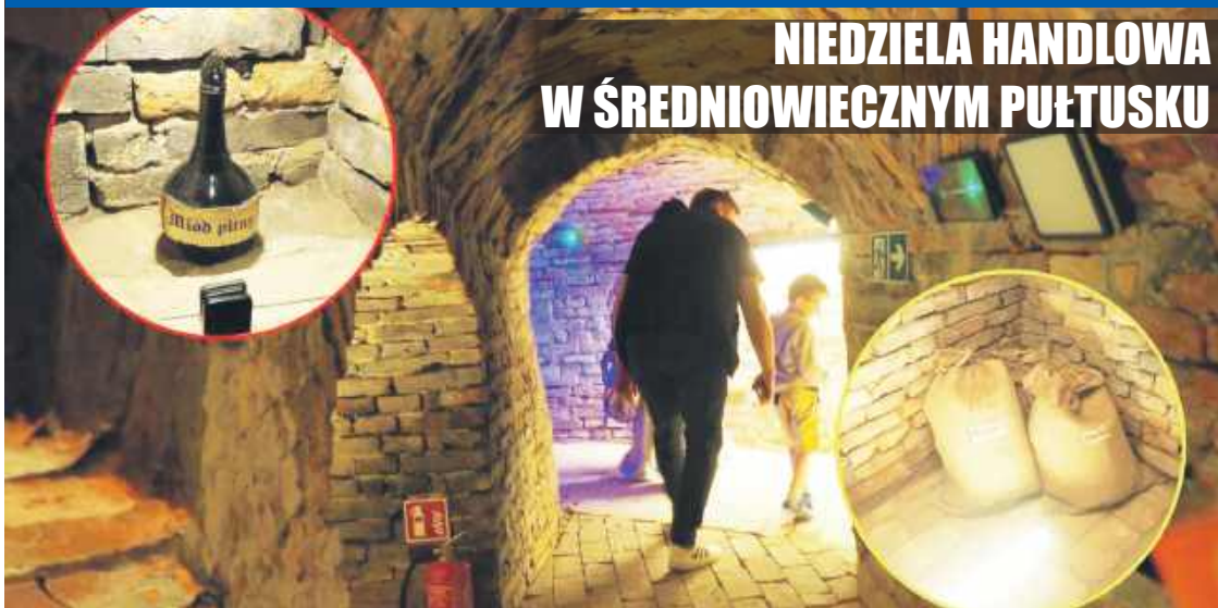
FOTO NA WESOŁO