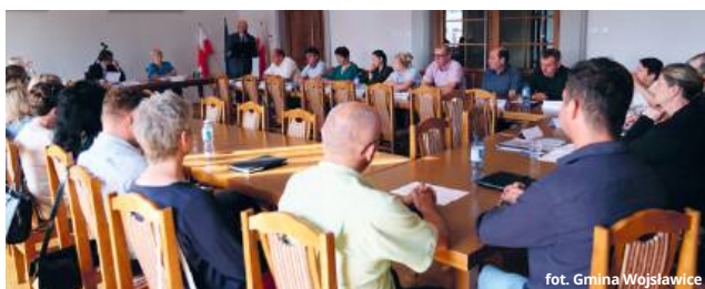
fol. Gmina Wojsławice

Mieszkańcy mogą liczyć na zrównoważony rozwój. Na pierwszy plan wysuwają się oczywiście inwestycje związane z budową gminnych dróg. Sądzę, że nie bez powodu stawiamy te działania na pierwszym