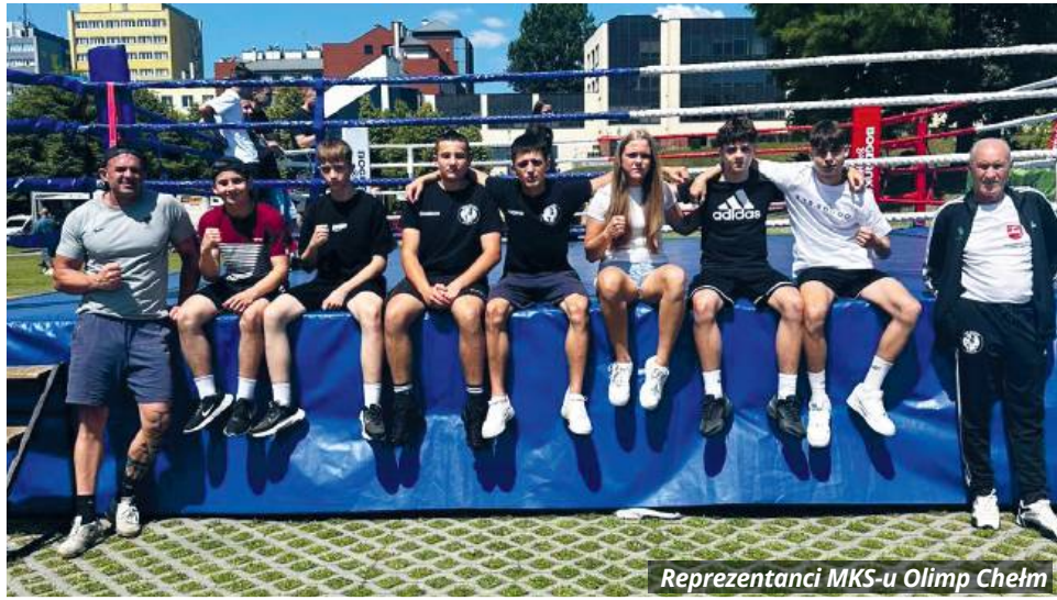
Reprezentanci MKS-u Olimp Chełm