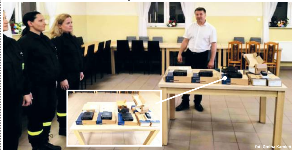
fol. Gmina Kamień

● GM. KAMIEŃ Nowe radiotelefony otrzymała właśnie jednostka Ochotniczej Straży Pożarnej w Kamieniu. Kilka rodzajów nowych urządzeń pozwoli na zachowanie odpowiedniej komunikacji pomiędzy jednostką i poszczególnymi druhami. Jak zapewniają władze gminy, w przyszłym roku na podobne nowinki mogą liczyć także inne jednostki, które działają na terenie gminy.