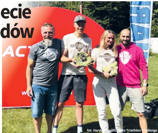
fol. Hardej Suki Ultra Triathlon Challenge