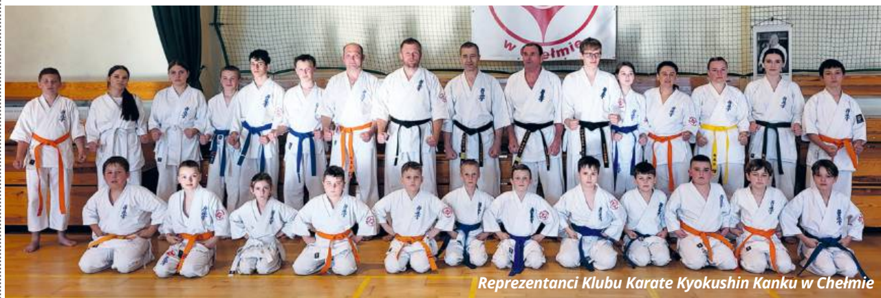
Reprezentanci Klubu Karate Kyokushin Kanku w Chełmie