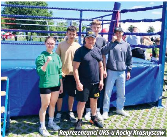
Reprezentanci UKS-u Rocky Krasnystaw

- Jestem bardzo zadowolony z występu swoich zawodników. Można powiedzieć, że nasza główna kadra robi się coraz szersza i w klubie mamy coraz więcej osób chętnych do tre-