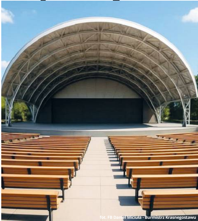
fol. FB Daniel Miciuła - Burmistrz Krasnegostawu

● KRASNYSTAW Po latach niedokończonych koncepcji miasto wraca do tematu odbudowy amfiteatru. Burmistrz Daniel Miciuła zapowiada konkretny plan działania – już w lipcu ogłoszone zostanie zapytanie na wykonanie dokumentacji projektowej. Inwestycja ma być realizowana etapami, a priorytetem będzie amfiteatr z pełnym zapleczem i strefą VIP. Równolegle zagospodarowany zostanie teren Zaułka Nadrzecznego – z zieloną przestrzenią rekreacyjną, plażą i promenadą wzdłuż Wieprza.