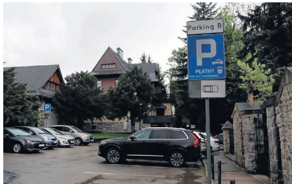
Kto będzie zarządzał parkingiem a kościołem św. Rodziny? Sprawą zajęło się Ministerstwo Finansów i Gospodarki. Teraz (ponownie) kolej na wojewodę

Spór przybrał na sile w maju 2025 roku. Wówczas proboszcz sanktuarium podczas kazań za-