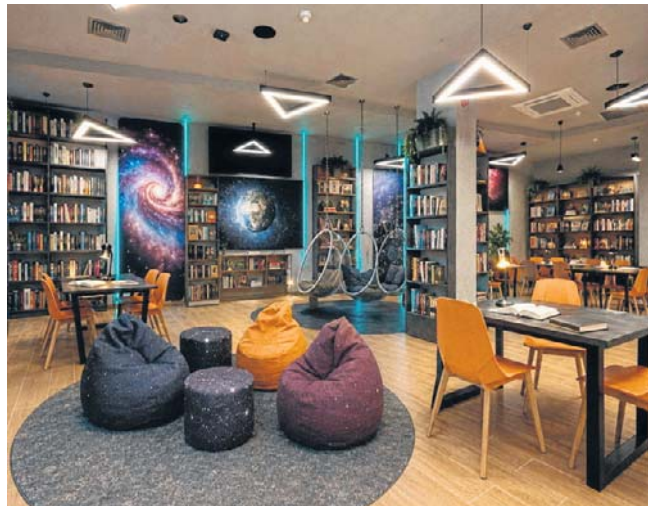
Tak miałyby wyglądać nowa kawiarnia-czytelnia w Astro Centrum w Chełmcu