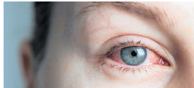
FOTO. ILLUSTRACYJNA

- W przypadku wystąpienia łagodnych podrażnień oczu pomocne będą domowe sposoby, takie jak nawilżanie preparatami sztucznych łez, dostępnymi w aptekach bez recepty czy chłodne okłady na powieki - mówi okulista. Lekarz podkreśla także znaczenie odpowiednio zbilansowanej diety. To, co jemy, ma istotny wpływ na stan naszych oczu nie-