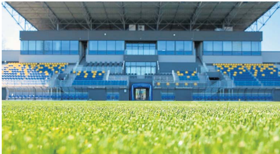
Oficjalne otwarcie nowego stadionu piłkarskiego w Tarnowie zaplanowano na 20 czerwca. Zagrają ZKS Unia Tarnów i Bruk-Bet Termalica Nieciecza

Trybuną, która jest pamiętką po Igrzyskach Europejskich i zawodach w dyscyplinach plażowych rozgrywanych w 2023 roku w Mościcach.