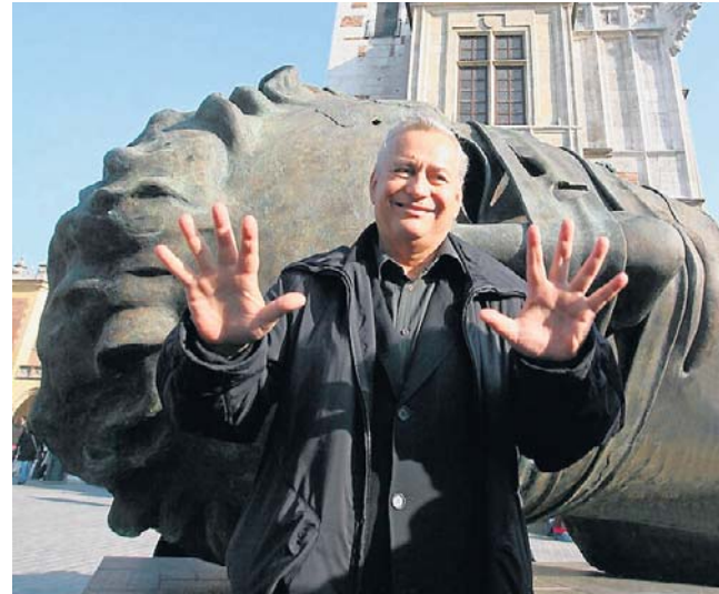
Igor Mitoraj podarował Krakowowi swoją rzeźbę w 2005 roku. Teraz jest ona znaną atrakcją turystyczną

Igor Mitoraj był synem deportowanej polskiej robotnicy przymusowej i pochodzącego z Polski francuskiego jeńca wojennego. Po zakończeniu wojny przyjechał z matką do jej rodziców w Polsce. Dzieciństwo i młodość spędził w małopolskiej miejscowości Grojec. W 1963 roku wstąpił na ASP