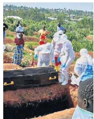
WHO ogłosiła epidemię w DR Konga i Ugandzie

Lokalni lekarze twierdzą, że pacjent zero przybył do szpitala pod koniec stycznia i zmarł w lutym. „The Telegraph” donosi, że pacjent zaraził następ-