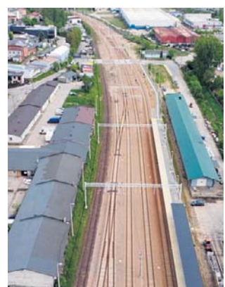
Jazda między Olkuszem a Krakowem będzie szybsza

Ministerstwo Infrastruktury potwierdziło plany budowy nowej łącznicy kolejowej, która bezpośrednio włączy Olkusz w sieć sztychli połączeń z Krakowem.