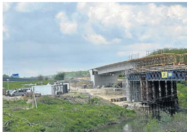
Budowa nowego mostu na Rabie. W Bochni powstaje łącznik do autostrady

Termin zakończenia inwestycji to grudzień 2027 roku. Koszt - ponad 114 mln zł. ©©