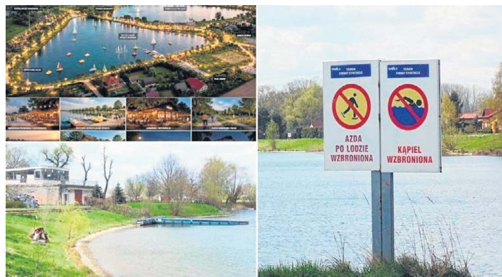
Wielu mieszkańców Oświęcimia marzy o kąpielisku na Krukach. Jeden z nich przygotował nawet wizualizację (na zdj. w lewym górnym rogu). A jak wygląda rzeczywistość, widzimy na załączonych obrazkach

Stanowisko miasta w kwestii otwartego kąpieliska od lat jest takie same: że nad Sołą powstał plac wodny czynny w okresie letnim. W nowym parku na bulwarach są też drewniane pomosty spacerowe wśród zieleni. Jest plac zabaw dla dzieci młodszych i starszych. Od lat w pobliżu rzeki, w okresie letnim, działa strefa wypoczynku „Bulwary”.