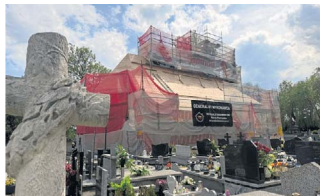
Ze zgliszcz ku nadziei. Spalony kościół na Helenie będzie piękny jak dawniej

- Ja nie mogłam uwierzyć w to, że ktoś ten kościół podpalił. Po co? Tak bardzo się cieszę,