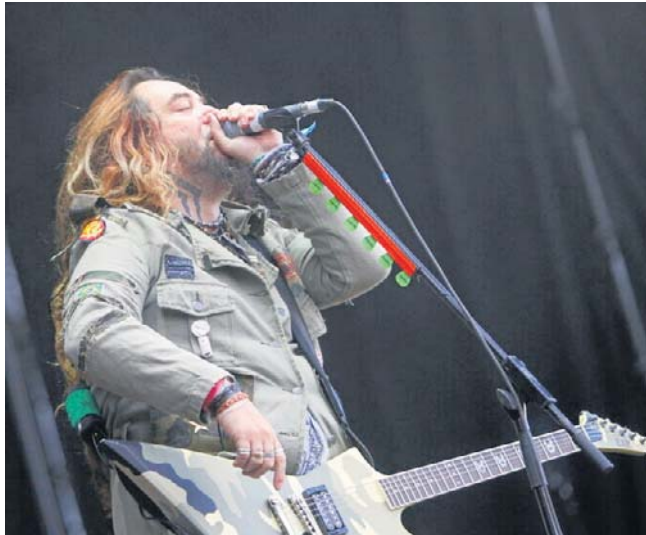
Max Cavalera – niepodzielny lider grupy Soulfly, która wyrusza w europejską trasę koncertową