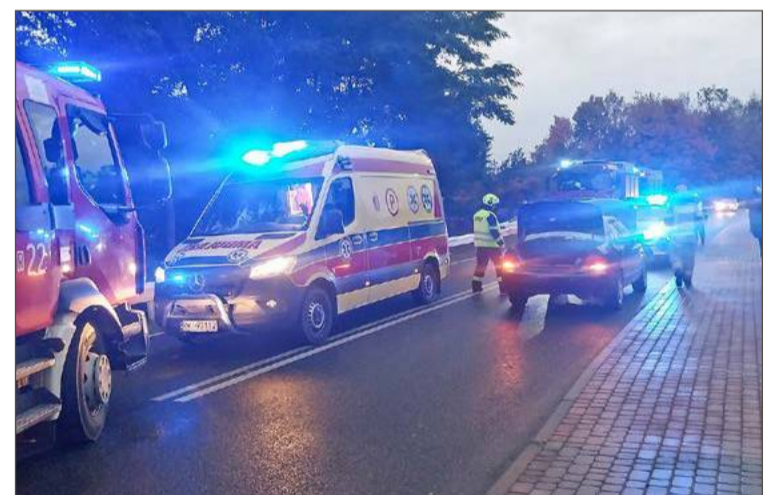
Droga w miejscu zdarzenia była zablokowana.

Zarówno kierujący, jak i pasażerka mitsubishi uskarżali się na dole-