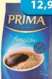
Kawa mielona 250 g Prima