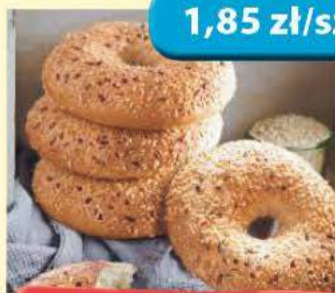
Bajgle Szlacheckie 80 g Społem