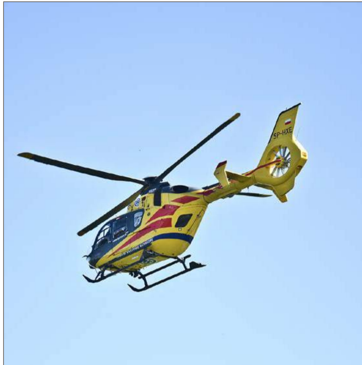
Chłopca zabrał śmigłowiec. W Rzeszowie przeszedł operację.

Wypadki w gospodarstwach nie należą do rzadkości. Statystyki