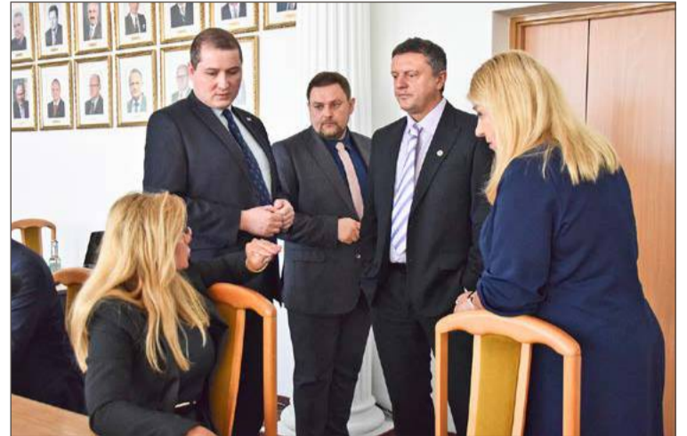
Jaką decyzję podejmą radni, przekonamy się w czwartek 23 października.

Wyjaśnia, że jeśli pięć pań nie podejmie pracy na nowych, krzyw-