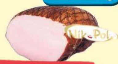
Sztuka Mięsa NIK POL