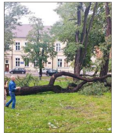
Plac Gryfitów mocno ucierpiał w 2023 roku. Burmistrz nie chce kolejnych strat.

Kolejny park kieszonkowy chce urządzić w mieście burmistrz Mateusz Kutrzeba.