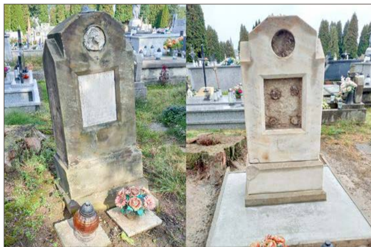
Nagrobek rodziny Lubaczewskich przed i w trakcie odnawiania.

Dlatego tym razem kwesta przeznaczona będzie na opłacenie kosztów odnowienia nagrobka