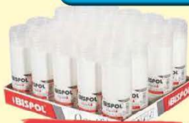
Wkłady do zniczy (różne wielkości) Bispol Ognik