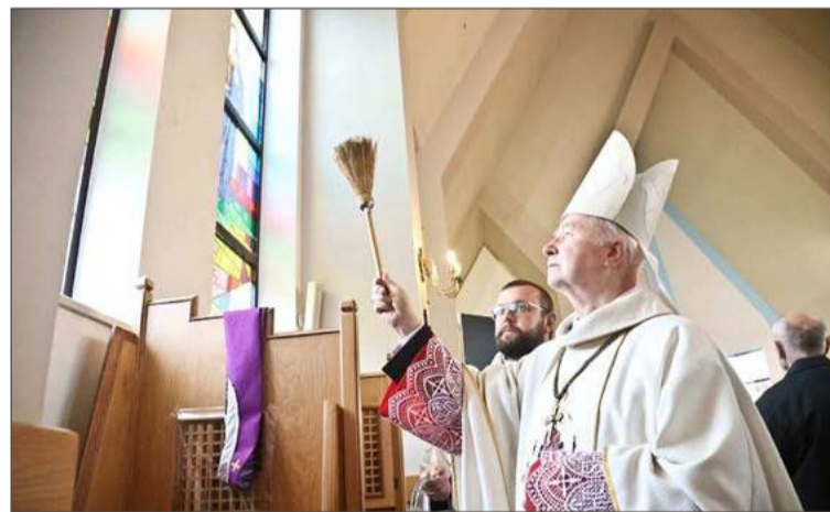
Zwykłe szyby zastąpione zostały pięknymi, wielobarwnymi witrażami.

Witraży jest dwanaście. Dwa z nich znajdują się w prezbiterium. Pierwszy związanym jest ze Zwiastowaniem Najświętszej Marii Panny, drugi nawiązuje do jodłowskiego sanktuarium Dzieciątka Jezus. Kolejne znajdują się po lewej i prawej stronie nawy głównej. Przedstawiają one św. Jana Pawła II, św. Ritę, św. Stanisława Biskupa Męczennika, św. Maksymiliana, Dzieci Fatimskie, bł. ks. Jerzego Popiełuszkę, św. Bernadettę, bł. Ro-