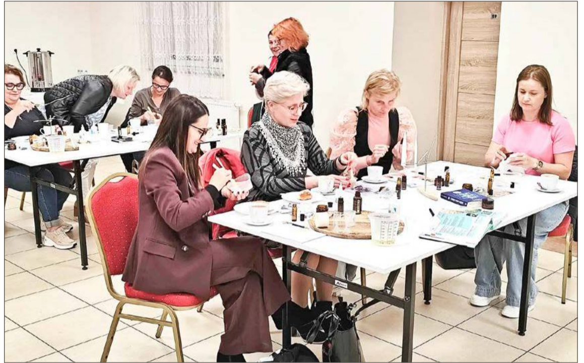
Zabawa z zapachami okazała się wciągająca i bardzo pouczająca.