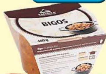
Bigos 400 g Bacówka