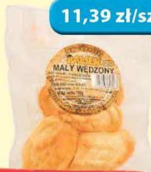
Ser Mały Wędzony 4 szt. Balsar