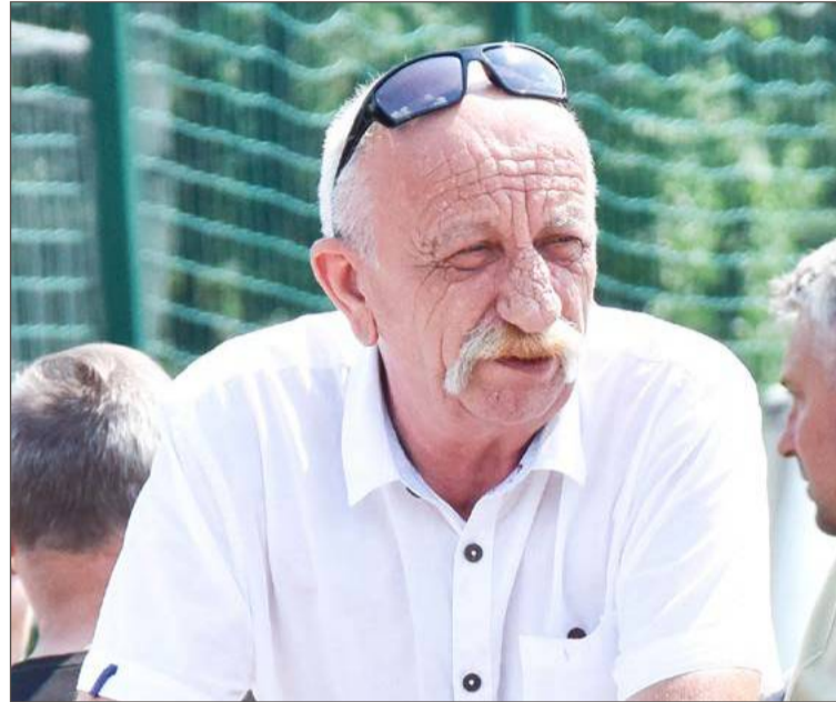
Był człowiekiem, który zawsze starał się znaleźć wyjście z różnych sytuacji.

- Byłeś człowiekiem twardym, uczciwym, pracowitym, wrażliwym i byłeś wszędzie tam, gdzie ludzie chcieli się z Tobą spotkać