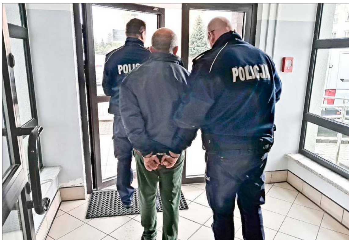
50-latka z Dębicy i jego 43-letnią partnerkę zgubiła chciwość.

W oczekiwaniu na sukcesy mundurowych z Dębicy pojawiło się