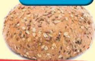
Chleb Staropolski 500 g Społem