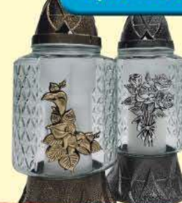
Lampion Kryształ Z-549