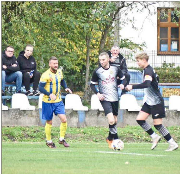
Żyraków (ciemne stroje) przegrał kolejny mecz.