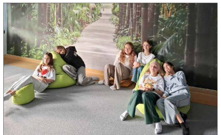
Takie obrazki w polskich szkołach można zobaczyć bardzo rzadko.