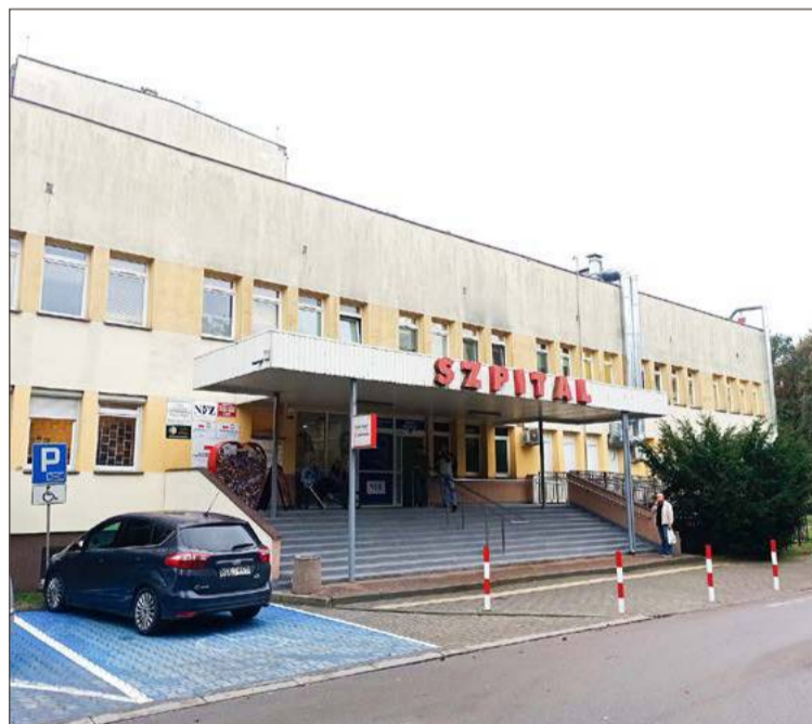
Starosta twierdzi, że powiat nie jest w stanie finansować szpitala.

- Ostatecznie zapłacił 70 procent chyba. Musieliśmy podpisać ugodę, tzn. NFZ przychodzi i mówi: jeśli nie pójdziesz do sądu to my się zgodzimy zapłacić 70 procent tego, co macie wykonane ponad