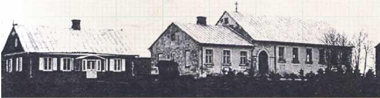
Przedwojenne zdjęcie kościoła protestanckiego w Cycowie wraz z przylegającym do niego budynkiem parafialnej szkoły i mieszkanie pastora

O puszczony kościółek, który kiedyś był cerkwią unicką, a potem prawosławną. Ewangelicki dom modlitwy, który był też szkołą, magazynem i wiejskim domem kultury.