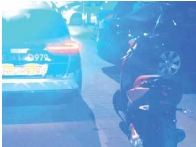
Skuter, którym porusza się nastolatek nie miał tablicy rejestracyjnej, a on sam nie miał prawa jazdy i jechał bez kasku

Wszystko działo się w niedzielę w nocy (1 czerwca) w Puławach. Patrol drogowki, poruszający się ul. Lubelską zauważył młodego mężczyznę jadącego skuterem lewym pasem w kierunku Końskowoli. Mundurowych zaniepokoiło to, że pojazd nie miał tablic rejestracyjnych, a kierujący nie miał kasku. Policjanci dali mu znak do tego, aby zjechał na bok i zatrzymał się. Dalej wszystko potoczyło się już