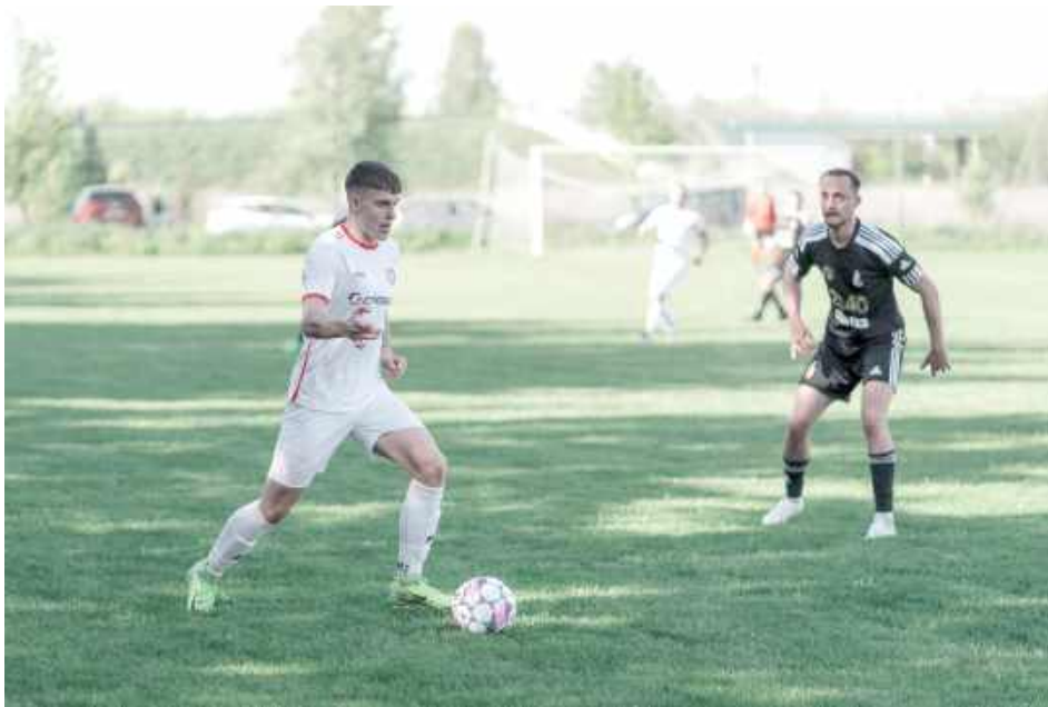
Zespół Wiary tylko podzielił się punktami w starciu z KS Ciecierzyn, pomimo że był tego dnia stroną dominującą

Patrząc na formę obydwu ekip to właśnie czarno-czerwoni wydawali się faworytem tej potyczki, w ostatnich tygodniach pokonując wyżej notowane ekipy jak Victoria Rybczewice czy Ludwiniak Ludwin. Tym razem jednak ekipa z Łęcznej musiała zadowolić się podziałem punktów z tegorocznym beniaminkiem.