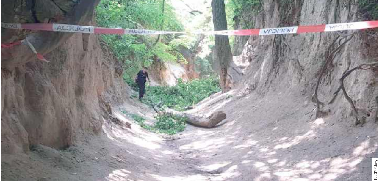
Do wypadku doszło w Wąwozie Korzeniowym, który jest obowiązkowym punktem wycieczek do Kazimierza Dolnego

W Wąwozie korzeniowym na grupę dzieci i ich opiekunów spadła gałąź, która odłamała się od drzewa. Dziewięcioro dzieci i ich opiekunkach trafiło do szpitala. Interweniował śmigłowiec Lotniczego Pogotowia Ratunkowego.