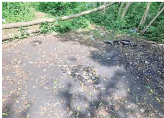
W zarośla w rejonie ulicy Kanałowej w Rykach skierowano policjantów ryckiej prewencji, którzy przy ognisku zastali 28-letniego mieszkańca powiatu ryckiego

W czwartek, 5 czerwca wieczorem dyżurny ryckiej komendy otrzymał zgłoszenie o rozpalonym ognisku, które zaniepokoiło zgłaszającego.