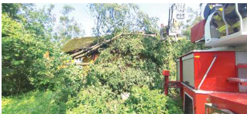
Połamane drzewa w regionie. Straż pożarna miała ręce pełne roboty