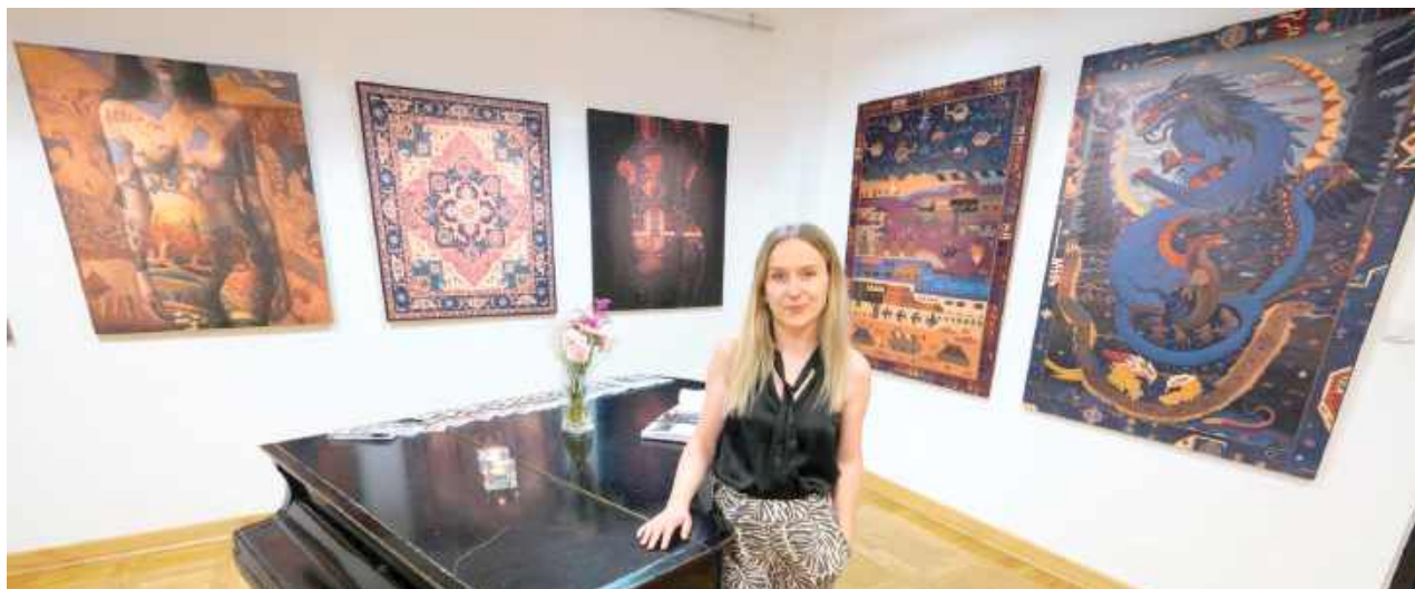
Wernisaż wystawy odbył się 6 czerwca

Do końca czerwca w Centrum Kultury w Łęcznej można oglądać obrazy Ewy Podlodowskiej – artystki z Kijan, urodzonej w 1987 roku, której twórczość zdobyła uznanie zarówno w kraju, jak i poza jego granicami.