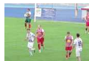
Gracze Opolanina żegnają się z IV ligą

Nie tak miało być. Piłkarze z Opola Lubelskiego muszą pogodzić się ze spadkiem do Klasy Okręgowej.