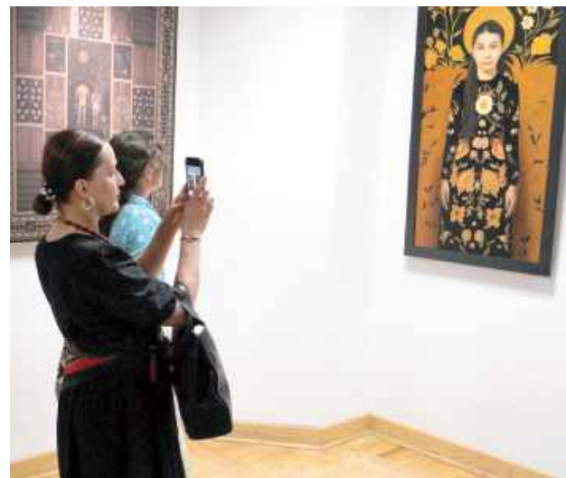
Wystawę można oglądać do końca czerwca