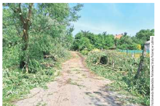
Niewyobrażalne straty po nocnej nawałnicy

Co najważniejsze, w zdarzeniach nikt nie ucierpiał. - W trzech przypadkach strażacy OSP zasilają jednak koncentratory tlenu dla osób, które na co dzień tego potrzebują. Naszym priorytetem jest zabezpieczenie