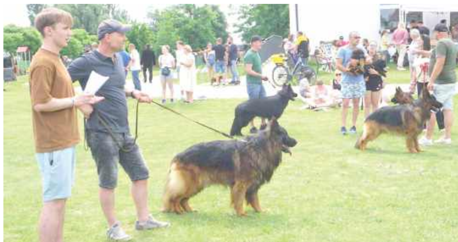
Największą grupę wystawowych piękności stanowiły owczarki niemieckie

Przygotowania do takich wydarzeń trwają wiele tygodni i bywają absorbujące. Pies musi dobrze się prezentować również w ruchu. W trakcie wystawy biegnie kłusem dookoła ringu, przy lewej nodze właściciela. Prawidłowy bieg powinien być dostosowany do tempa właściciela, pupil nie może się wyrwać, podskakiwać, biec zbyt szybko lub zostać w tyle.