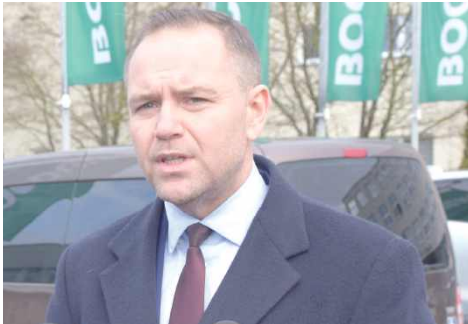
W styczniu kandydat popierany przez PiS odwiedził kopalnię w Bogdanie

Wyniki wyborów wskazują na jednoznaczne poparcie dla Karola Nawrockiego w każdej z sześciu gmin powiatu. Największe poparcie kandydat uzyskał w gminie Cyców – aż 81,28 proc. głosów. Rafał Trzaskowski zdobył tam 18,72 proc.