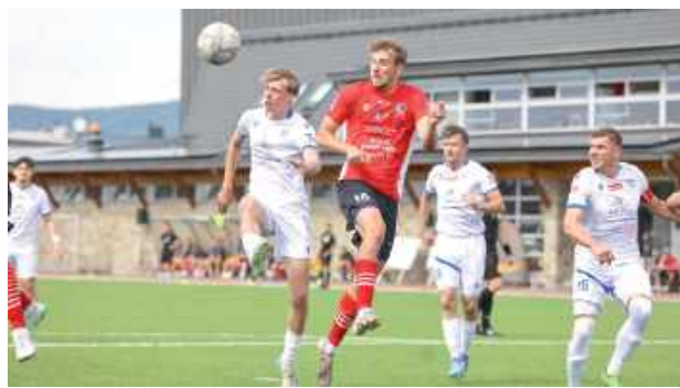
Lubartowianie zakończyli przygodę z III ligą spotkaniem z Podhalem. Przegrali 0:4