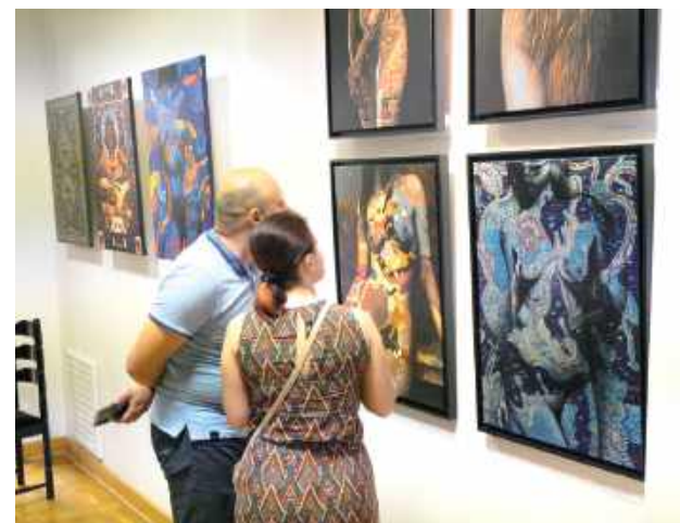
„Interesuje mnie kobiecość, seksualność, piękno ciała”