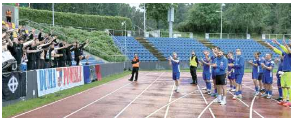
Ostatni taki moment. Kibice podziękowali piłkarzom za walkę w II lidze. Co dalej z Wisłą?

Po przerwie Wisła wciąż walczyła o godne pożegnanie, jednak nie była w stanie sforsować defensywy Resovii. Gdy wszystko wskazywało na to, że mecz zakończy się bezbramkowym remisem, nade-