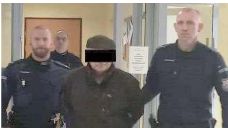
Mężczyzna został aresztowany w 2023 roku

Mężczyzna został zatrzymany i umieszczony w po-