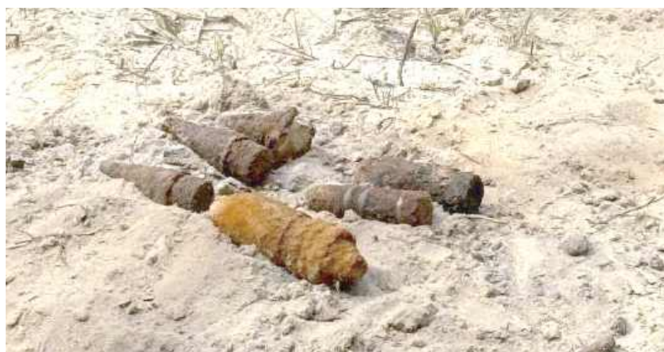
Na takie pamiątki z czasów wojny trafił jeden z mieszkańców

Podczas wiosennych spacerów po lasach można natknąć się na wyjątkowo niebezpieczne pozostałości z czasów II Wojny Światowej. Przekonał się o tym mieszkaniec powiatu ryckiego, który w lesie na terenie Dęblina,