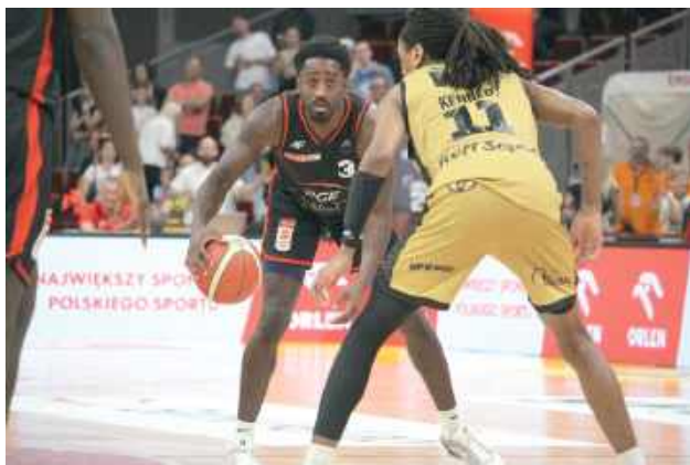
PGE Start Lublin awansował do finału Orlen Basket Ligi

Start zaskoczył ich jednak już od samego początku i objął prowadzenie 9:0. Dalsza część pierwszej kwarty nie była już tak łatwa i to