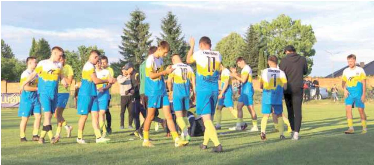
Zespół Ludwiniaka po trzech nieudanych meczach w końcu wygrał. Pokonał Tajfun Ostrów Lubelski 4:1

Ludwiniak Ludwin w dobrym stylu przełamał się i umocnił na fotelu wicelidera lubelskiej klasy „A” gr. III