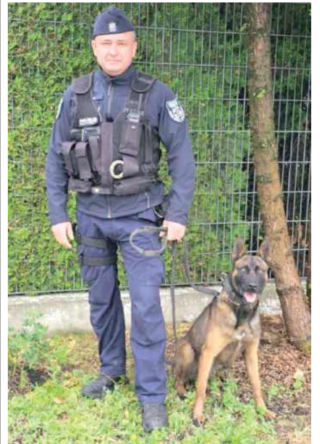
W stosie kartonów pies odnalazł narkotyki

Tango wskazał kartony. Dwóch mężczyzn z powiatu lubelskiego tymczasowo aresztowanych za narkotyki