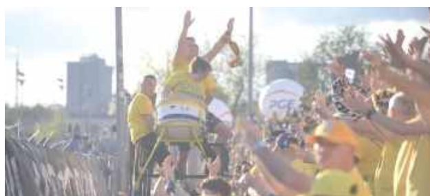
Kibice podkreślają, że trybuny obiektu przy Al. Zygmunto-wskich wypełniają się co mecz, a żużlowy mistrz Polski z Lublina skutecznie promuje miasto w całym kraju

O niepokoju i narastającym poczuciu frustracji piszą do prezydenta Krzysztofa Żuka przedstawiciele Stowarzyszenia Lubelskich Kibiców Speedway Euphoria. Kibice Orlen OIL Motoru Lublin domagają się nowoczesnego stadionu.