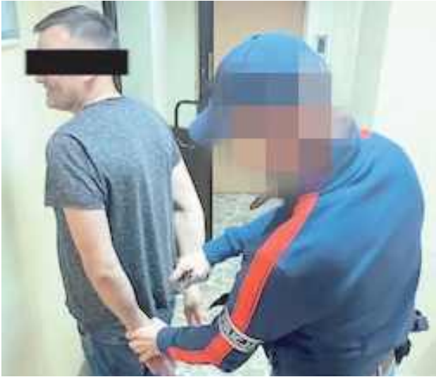
Zatrzymania miały miejsce w powiatach: lubartowskim oraz puławskim

Policjanci z Lubartowa wytypowali cztery osoby podejrzane o przestępstwa związane z narkotykami. Zatrzymania dokonano na terenie powiatów puławskiego i lubartowskiego.