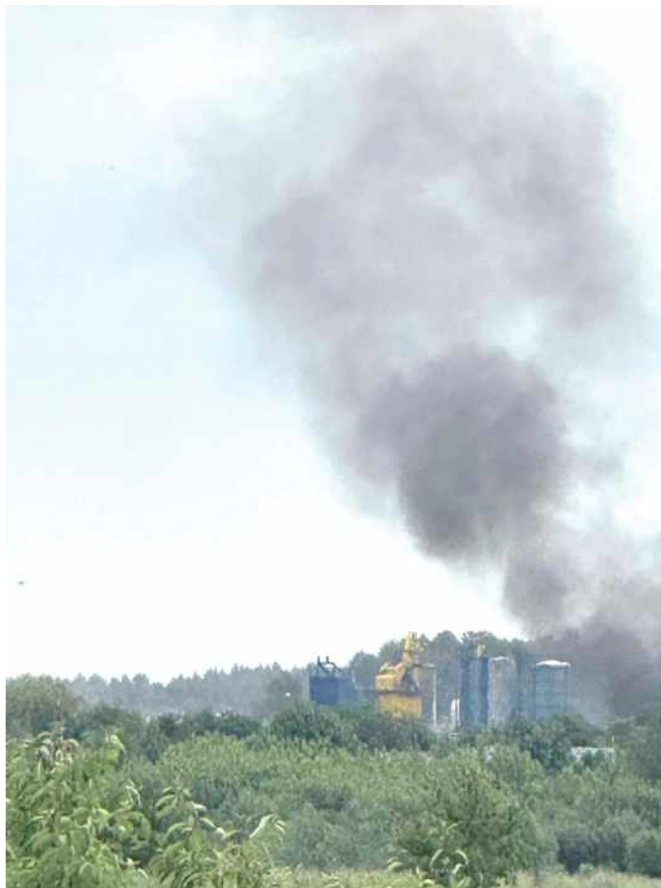
W sobotę „Piekiełko” paliło się po raz kolejny

W niedzielę 29 kwietnia 2018 r. około godz. 23:00 na składowisku opon wybuchł pożar. Płomienie były widoczne w Lubartowie. Pożar gasiło 28 zastępów straży: 14 z Państwowej Straży Pożarnej z Lubartowa i innych powiatów oraz 14 OSP. W zakładzie utylizacji opon znajdowało