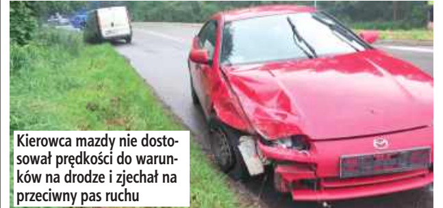
Kierowca mazdy nie dostosował prędkości do warunków na drodze i zjechał na przeciwny pas ruchu