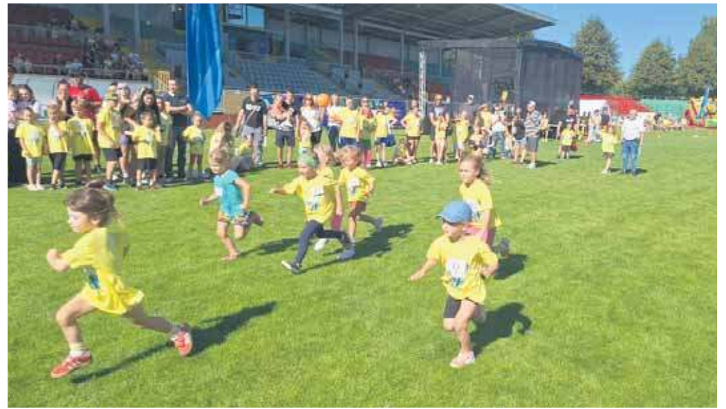
Pola od mety do startu na pierwszym miejscu

Mali jaworznicanie dzielnie spisali się w Festiwalu Biegania dla Dzieci. Zawody rozegrano w sobotę 20 września na Stadionie Miejskim Victoria. W zawodach udział wzięło 125 małych biegowych zapaleńców.