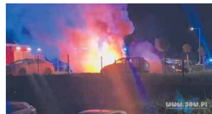
Pożar samochodu na ulicy Podwale

Do zdarzenia doszło w sobotni wieczór, 20 września około godziny 19:30. Po otrzymaniu zgłoszenia na miejsce wyruszyły dwa zastępy straży pożarnej. Gdy dotarli, pojazd był już całkowicie objęty płomieniami. Pomimo podjętych działań, samochód spłonął doszczętnie, a wysoka temperatura uszkodziła także pojazd stojący obok.