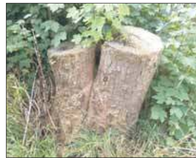
Prawie ścięty javor

Wchodząc na ten teren od strony ulicy Matejki zauważamy bardzo okazałą topolę kanadyjską. Drzewo wyrasta w okolicy przej-