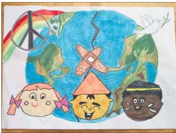
Emilia Bełch SP 6 I miejsce