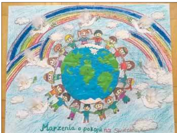
Selehen Dana SP 16 I miejsce

formatu A3 dowolną techniką na temat „Marzenia o pokoju na świecie”.