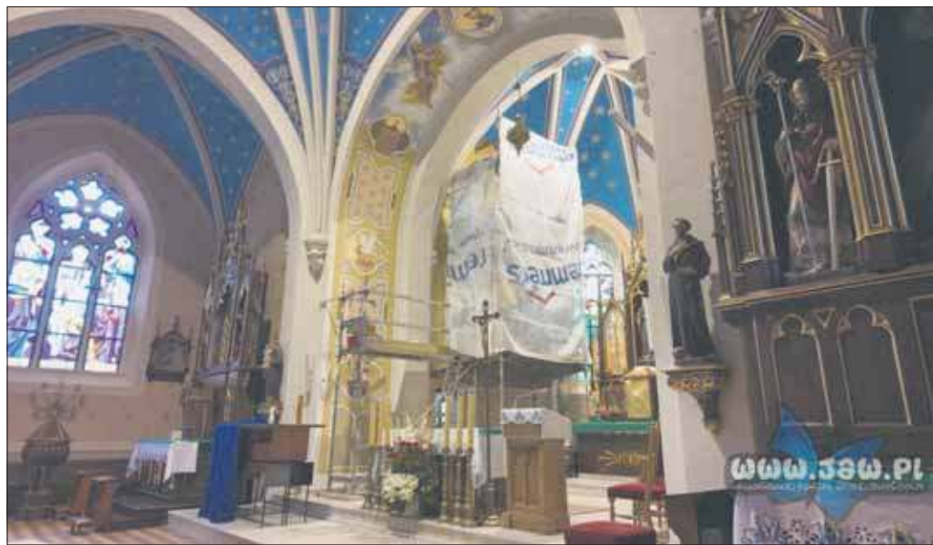
Część prac konserwatorskich w kościele pw. św. Elżbiety Węgierskiej w Szczakowej jest już ukończona

Ponad stuletni kościół pw. św. Elżbiety Węgierskiej w Szczakowej poddawany jest gruntownej renowacji. Za dwa miesiące znikną rusztowania z kościoła w Szczakowej