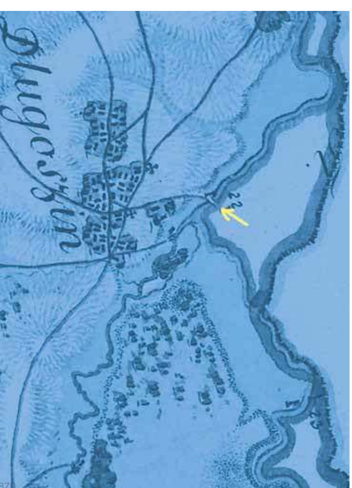
Długoszyń w roku 1804 z zaznaczonym starym mostem (napire.eu)

nie jest tajemnicą, że teren współczesnego Jaworzna był przez całe stulecia rejonem przygranicznym. Na zachodzie, tuż za linią Przemyszy rozciągał się Śląsk wraz ze swoją zmienną przynależnością państwową. W okresie zaborów natomiast Biata Przemsa stanowiła także granicę. Pomimo tego spójność lokalna utrzymywała więzi, nawet jeśli były takowe przez obce państwa utrudniane. Wzajemnie handlowano więc, spotykano się czy podróżowano.