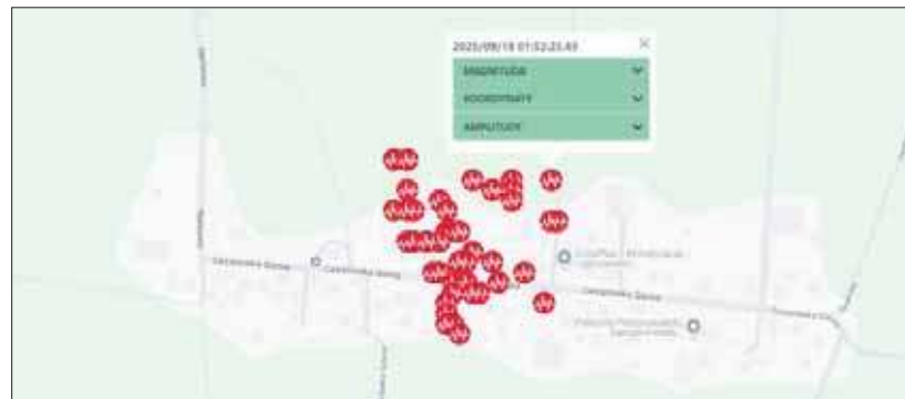
Mapa wstrząsów rejestrowana przez Górnośląską Regionalną Sieć Sejsmograficzną ( https://grss.gig.eu/mapa-wstrzasow/ )

Zarówno w środę jak i w czwartek wieczorem, otrzymaliśmy informacje od mieszkańców Jaworzna o odczuwalnym wstrząsie.