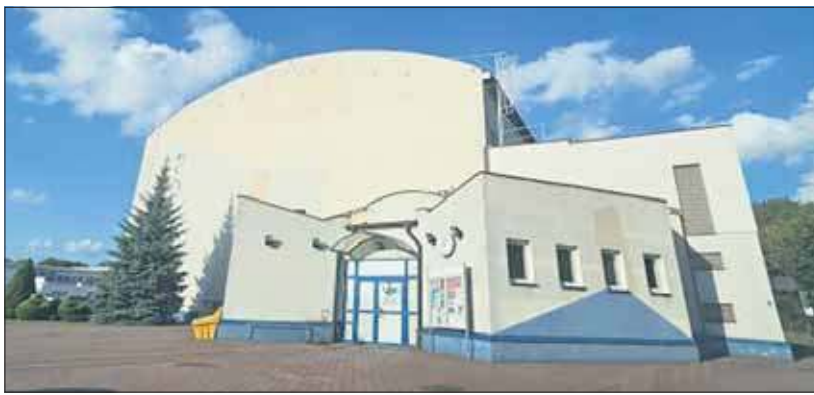
Hala sportowa na Osiedlu Stałym na ten moment jest zamknięta. Trwa ekspertyza dachu

Hala sportowa na ten moment jest zamknięta. Prowadzona jest ekspertyza dachu. Jej wynik poznamy końcem października. Trenujące tam do tej pory grupy i uczniowie pobliskiej szkoły zajęcia mają w innych lokalizacjach