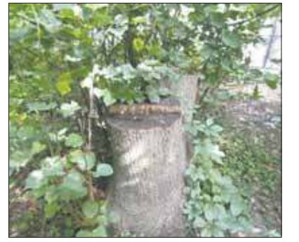
Prawie ścięta lipa

ścia dla pieszych. Stąd w tytułowe chaszcze prowadzi coś, co w pewnych kręgach zwie się szlakiem wydeptanym przez zwierzynę. Przy ścieżce zauważyłem spory płat bardzo młodych klonów zwyczajnych. Nie brak tutaj robinii akacjowej. Natrafiłem jeszcze na młode jawory. Są młode jesiony wyniosłe. Pierwszym prawie wyciętym drzewem skrywającym się