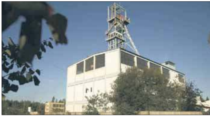
Jeden z budynków po byłej kopalni Jan Kanty

– W 2024 roku gmina rozpoczęła rozmowy ze Spółką Restrukturyzacji Kopalń SA – właścicielem terenu po byłej kopalni KWK Jan Kanty – na temat przejęcia terenu i stworzenia w tym miejscu przestrzeni dla mieszkańców. Zadaniem zespołu jest przygotowanie koncepcji zagospodarowania terenu i przedstawienie jej SRK SA, po to, aby Spółka poznała oczekiwania mieszkańców miasta co do przyszłości obszaru. Poprzez badanie ankietowe zbierzemy pomysły i uwagi mieszkańców, które zostaną zawarte w dokumen-