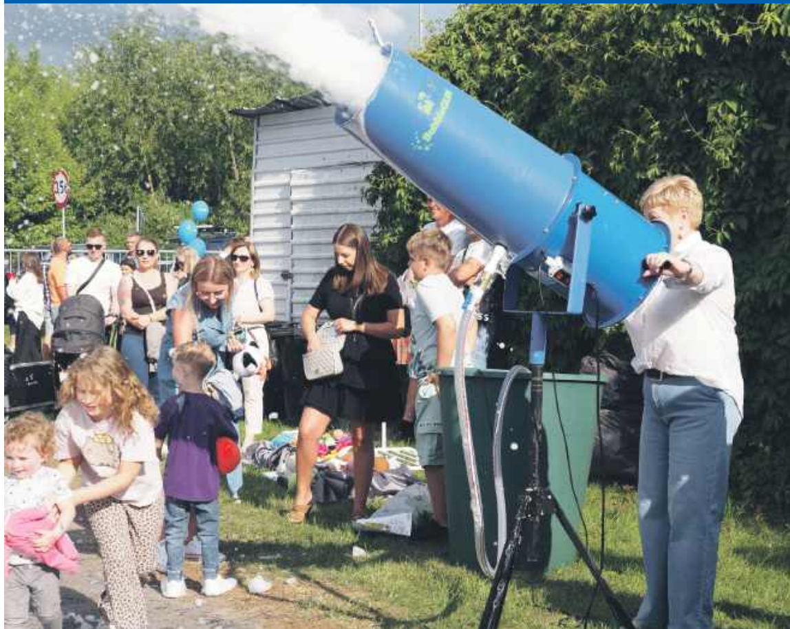
Mieszkańców, u których leci żółta woda z kanu, zapraszam do kąpieli w pianie!

PORTAL INFORMACYJNY MIESZKAŃCÓW PUŁTUSKA I OKOLIC