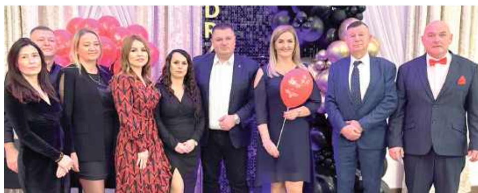
Tego wieczoru humory dopisywały zebrany na gali

GMINA KRZYWDA: W sobotę, 29 listopada w Pałacu Dąbrowa odbyła się uroczysta gala oraz Bal Krwiodawców z gminy Krzywda, podczas którego wyróżniono zasłużonych honorowych dawców krwi.