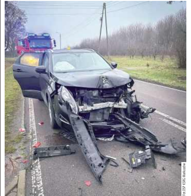
Okazało się, że kierowca volvo, w którego uderzył peugeot był nietrzeźwy i prowadził nie mając uprawnień

Jechał z 2 promilami, bez prawka i stał się ofiarą kolizji