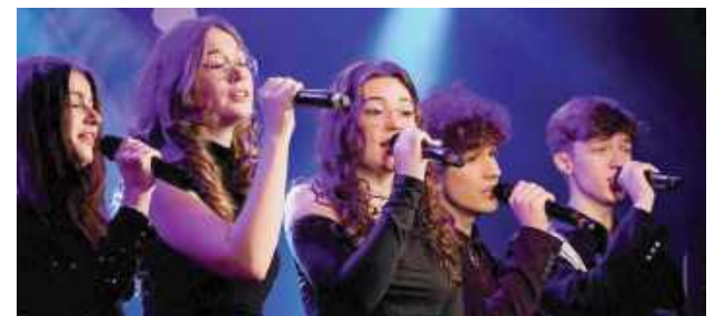
Podczas obu koncertów sala widowiskowa ŁOK pękała w szwach. To wielkie wyróżnienie dla młodych artystów

Koncerty „Wodeckiego” to była prawdziwa muzyczna uczta, pełna wzruszeń i dobrej energii. To trzeba było przeżyć na własne uszy i oczy!