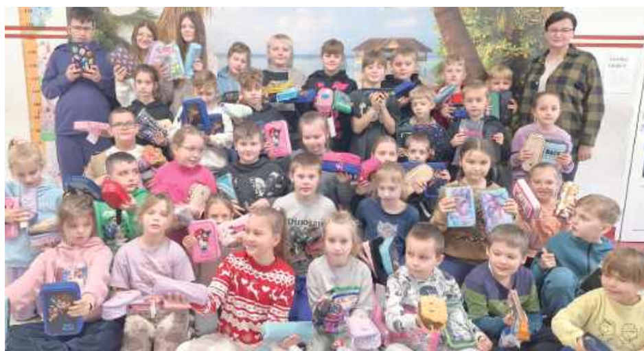
Dzięki zaangażowaniu uczniów, rodziców i nauczycieli udało się zgromadzić 110 piórników wypełnionych przybarami szkolnymi

W akcję włączyli się uczniowie z klas 1-8, a szczególnie wyróżniła się klasa 2a, która przygotowała wyjątkowo dużo materiałów. Wszystkie zebrane piórniki przekazano już do Fundacji „Dzieci Afryki” w Warszawie.