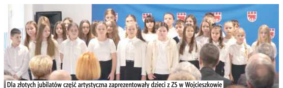
Dla złotych jubilatów część artystyczna zaprezentowały dzieci z ZS w Wojcieszkwie