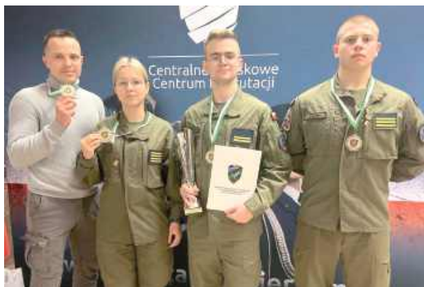
W etapie testu pisemnego uczniowie z Radoryża Smolanego osiągnęli najlepszy wynik, udzielając największej liczby poprawnych odpowiedzi spośród wszystkich uczestników

W Lublinie zakończył wojewódzki Turniej Wiedzy o Wojsku Polskim Ekstraklasa-Wojskowa. Turniej organizowany jest przez Centralne Wojskowe Centrum Rekrutacji, lokalny etap wojewódzki przeprowadził Ośrodek Zamiejscowy CWCR w Lublinie.