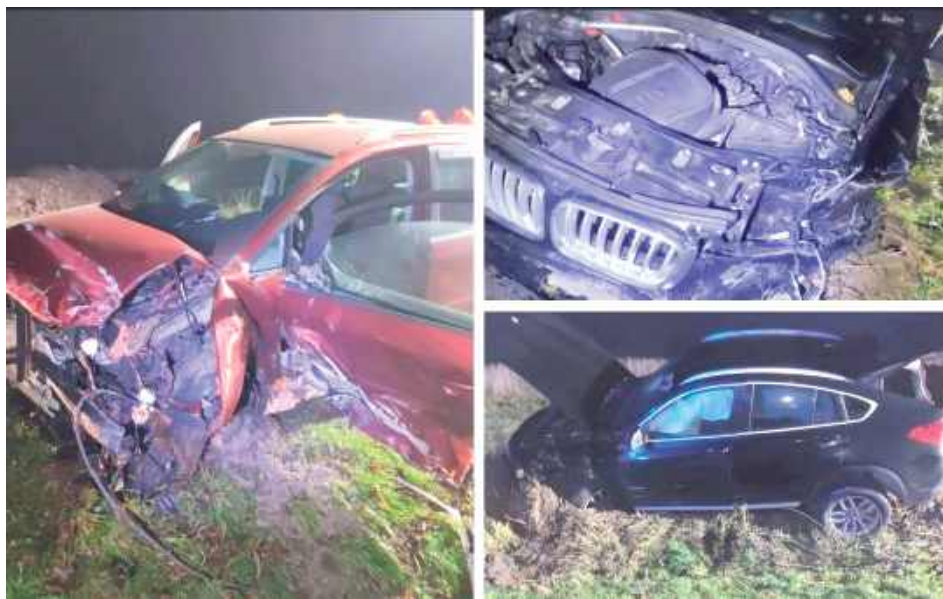
Siła uderzenia była na tyle duża, że volkswagen odbił się od audi i następnie uderzył w kolejny pojazd - BMW

- Siła uderzenia była na tyle duża, że volkswagen odbił się od audi i następnie uderzył w kolejny pojazd BMW