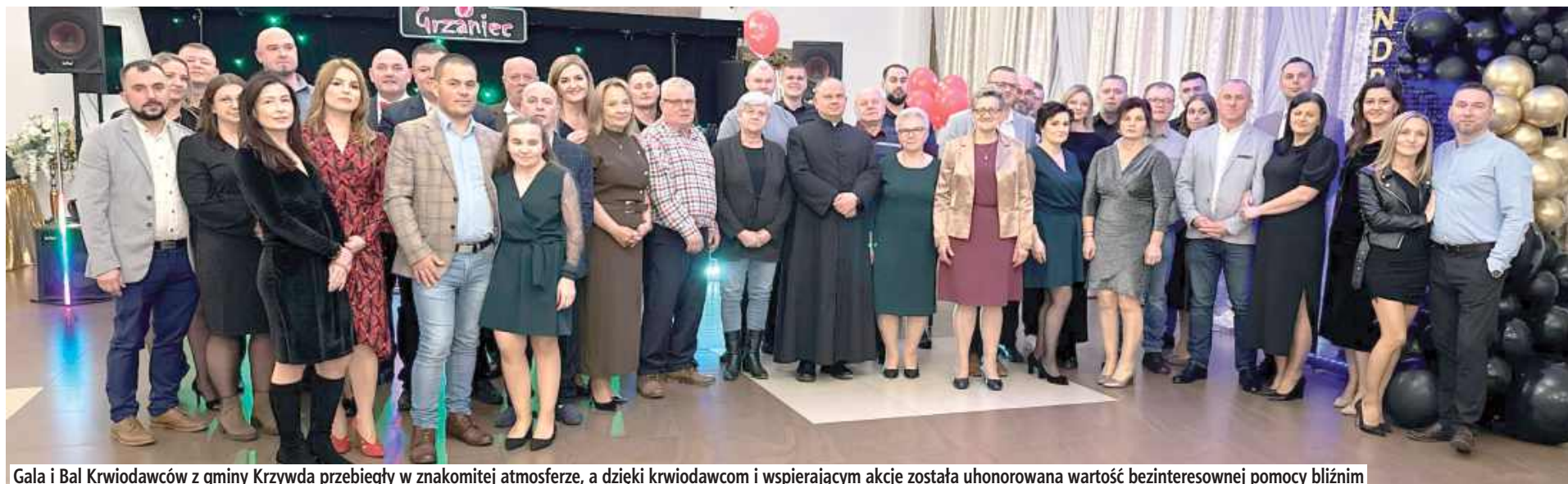
Gala i Bal Krwiodawców z gminy Krzywda przebiegły w znakomitej atmosferze, a dzięki krwiodawcom i wspierającym akcje została uhonorowana wartość bezinteresownej pomocy bliźnim