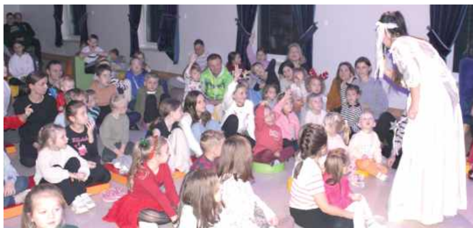
Aktorzy przenieśli publiczność w świąteczny bajkowy świat i zapewnili dzieciom dobrą zabawę

Na początek zaprezentowano przedstawienie „Mikołajowa niespodzianka” w wykonaniu Studia Teatralnego Krak-Art. Aktorzy przenieśli publiczność w świąteczny, bajkowy świat i zapewnili dzieciom dobrą zabawę.