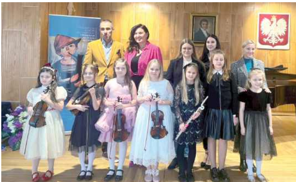
Gratulujemy młodym artystom, ich rodzicom oraz nauczycielom i życzymy kolejnych muzycznych sukcesów!

W dniach 6-7 listopada w Warszawie odbył się IX Ogólnopolski Konkurs Instrumentalny „I Pierwszak może być mistrzem”. Celem konkursu jest docenienie pracy, zaangażowania i pasji dzieci na początku ich edukacji muzycznej oraz zachęcenie do dalszego rozwoju.