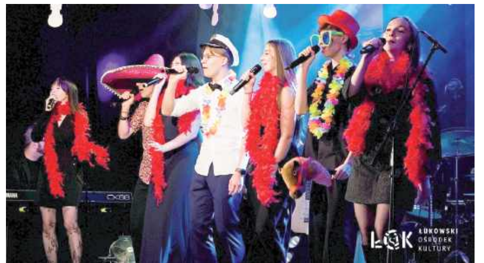
Młodzi wokaliści wspaniale oddali klimat piosenek Zbigniewa Wodeckiego