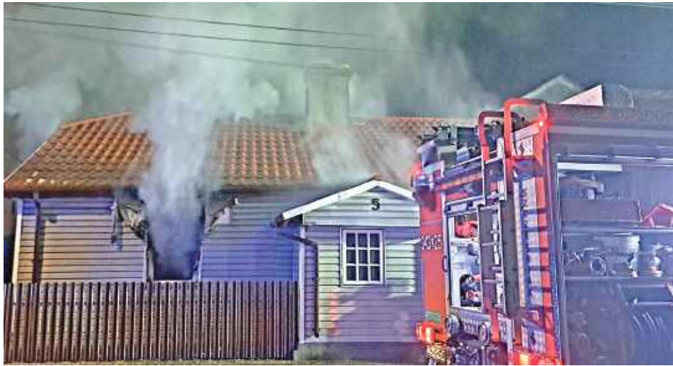
Mieszkańcy nie odnieśli obrażeń, ale w spalonym domu znaleziono dwa martwe koty

W akcji gaśniczej brało udział sześć zastępów z JRG Międzyrzec Podlaski oraz okolicznych OSP. Strażacy pracowali niemal trzy godziny, lokalizując źródło pożaru, usuwając tłące się elementy i zabezpieczając budynek. Mieszkańcy nie odnieśli obrażeń, ale w spalonym domu znaleziono dwa martwe koty –