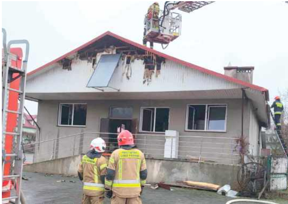
Na miejscu działało łącznie dziewięć zastępów straży pożarnej – trzy z JRG Międzyrzec Podlaski oraz jednostki OSP: Śródmieście, Rzeczyca, Krzewica, Tuliów, Jelnica i Strzakły

Działania ratowników polegały na zabezpieczeniu terenu oraz podaniu trzech prądów wody w natarciu na główne ognisko pożaru. W celu oddymienia strażacy zdjęli trzy arkusze bla-