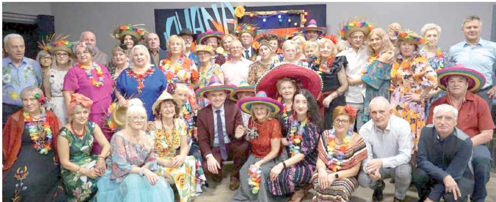
mo Jak pokazują fotografie, kreatywność i potencjał seniorów nie mają granic. Najcenniejsza była jednak radość płynąca ze wspólnego przeżywania takich chwil