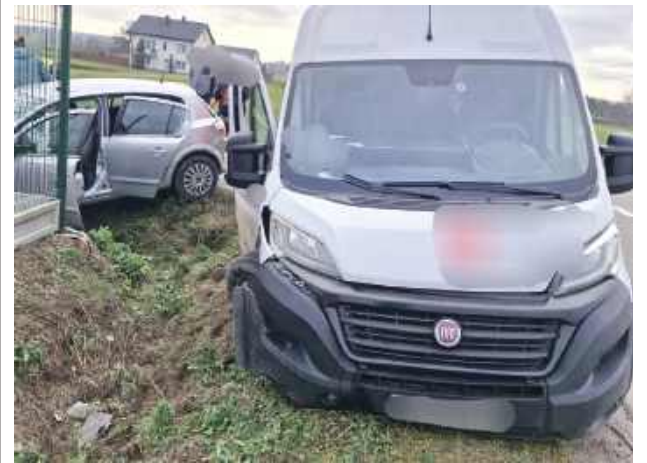
W wyniku zderzenia kierująca oplem oraz 35-letnia pasażerka zostały przewiezione do szpitala

5 grudnia około godziny 12 w Grabowie Szlacheckim (powiat rycki) doszło do poważnego zdarzenia drogowego.