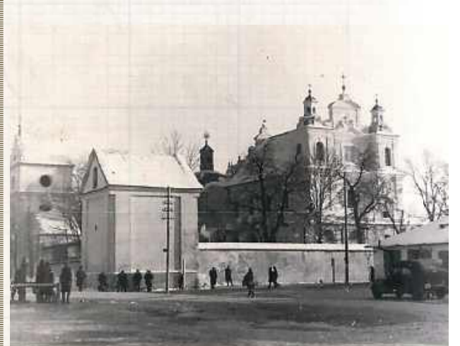
Obecny kościół pw. Wniebowzięcia Najświętszej Marii Panny został zbudowany w drugiej połowie XVII wieku, kiedy Słupeccy powrócili już do katolicyzmu. Zdjęcie z 1940 roku