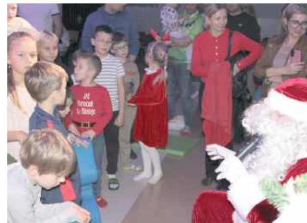
Była też chwila na rozmowę z Mikołajem

W spotkaniu wzięło udział ponad 100 dzieci, a każdy maluch otrzymał słodki upominek. Radość najmłodszych