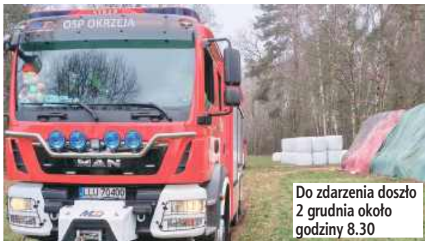
Do zdarzenia doszło 2 grudnia około godziny 8.30

2 grudnia o godzinie 8.26 służby ratunkowe zostały wezwane do pożaru nieużytków rolnych w miejscowości Wola Okrzejska.