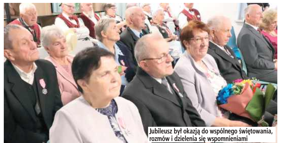
Jubileusz był okazją do wspólnego świętowania, rozmów i dzielenia się wspomnieniami