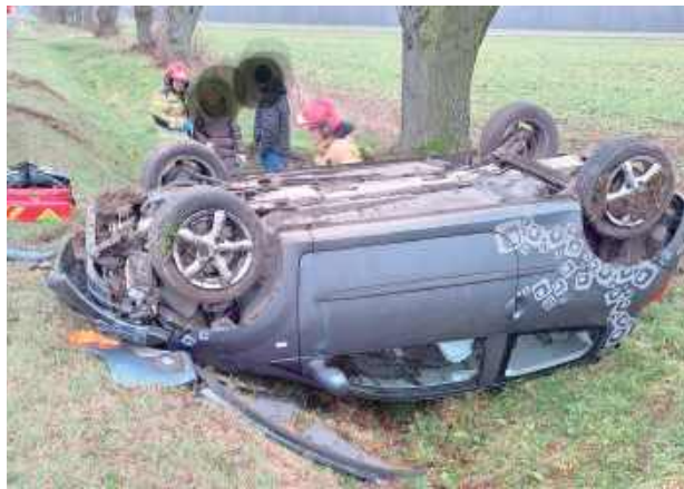
Kobieta prowadząca pojazd zdołała go opuścić o własnych siłach

Jak poinformował st. kpt. Paweł Szyszowski, w miejscowości Jeziora na DW nr 63 doszło do dachowania samochodu osobowego marki Renault, którym kierowała kobieta.