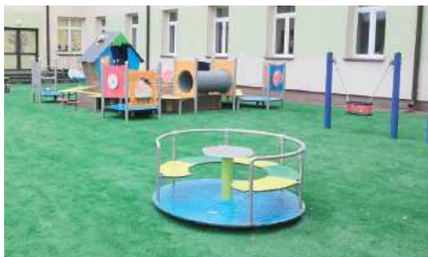
Dzięki przeprowadzonym pracom dzieci uczęszczające do żłobka zyskały miejsce sprzyjające rozwojowi i bezpiecznej zabawie

Zadanie wykonano przy wsparciu środków zewnętrznych z Funduszu Pracy, pozostających w dyspozycji Ministra Rodziny, Pracy i Polityki Społecznej. Na ten cel przeznaczono 300 tys. zł. W ramach inwestycji usunięto sta-