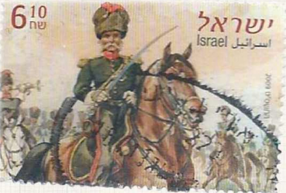
Wydany przez poczty izraelską i polską w 2009 roku znaczek z Berkiem Joselewiczem. Polski odpowiednik miał walor 3 zł