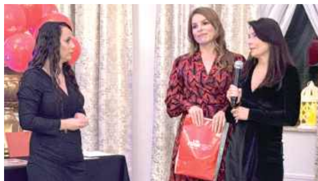
Organizatorzy akcji krwiodawstwa wyrazili wdzięczność osobom wspierającym

Podczas gali wyróżniono osoby, które w 2025 roku oddały krew podczas pięciu akcji zorganizowanych w Domu Parafialnym w Hucie Dąbrowie. Otrzymały one podziękowania od osób i firm wspierających ideę krwiodawstwa.