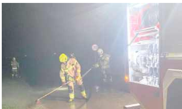
Zdarzenie miało miejsce 1 grudnia przed północą

Działania straży pożarnej polegały na zabezpieczeniu miejsca zdarzenia oraz neutralizacji