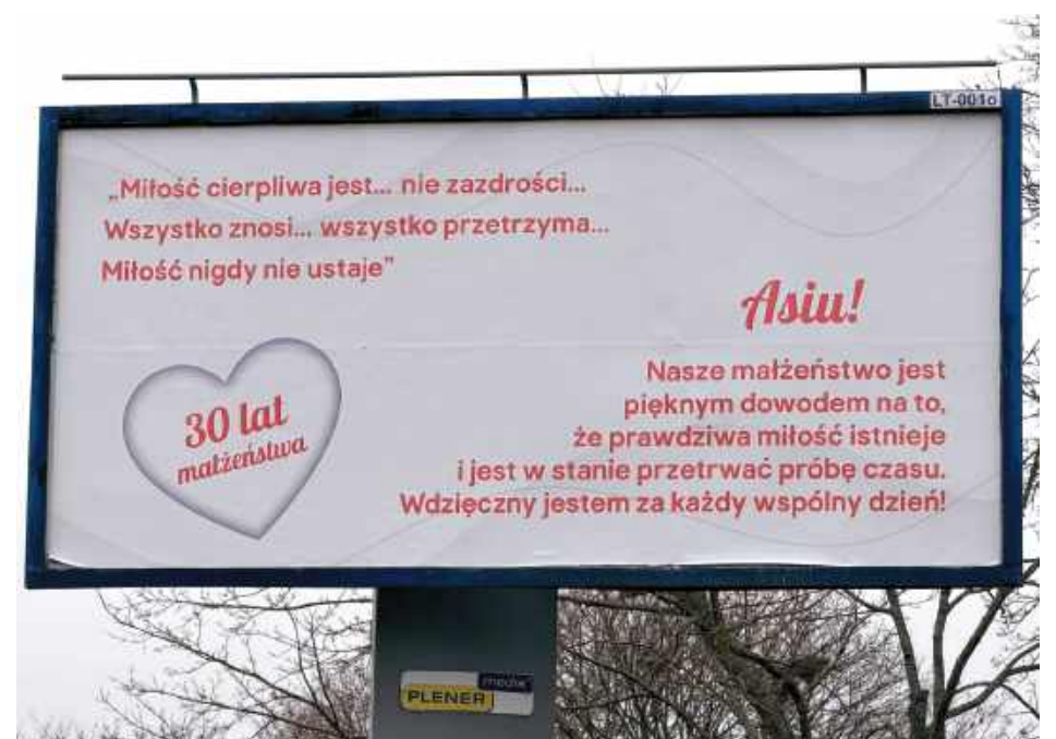
Billboard o miłości przy al. Jana Pawła II

Takiemu publicznemu, a jednocześnie anonimowemu