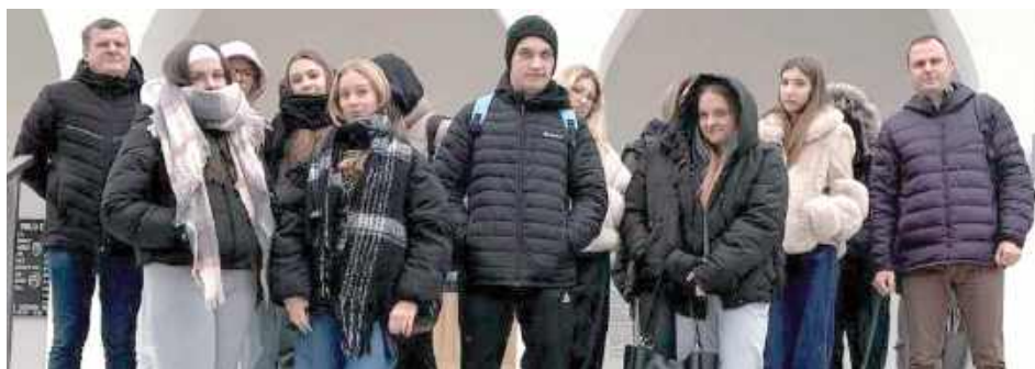
We wtorek, 25 listopada uczniowie klas III i IV LO udali się na wycieczkę do Muzeum Czynu Bojowego Kleeberczyków w Woli Gułowskiej

Podczas wizyty uczniowie poznali przebieg ostatniej bitwy kampanii wrześniowej w 1939 roku, w której Samodzielna Grupa Operacyjna „Polesie” pod dowództwem gen. Franciszka Kleeberga stawiała czoła niemieckim