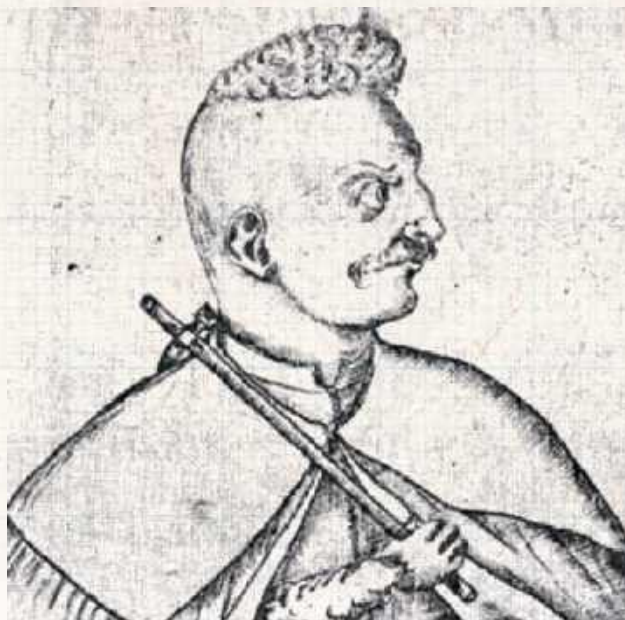
Domniemany wizerunek Michała Piekarskiego. W rękę trzyma będący narzędziem zamachu nadziak, czyli wydłużony toporek mający z jednej strony obuch, a z drugiej wydłużone, umożliwiające nie tylko cięcie, ale i klucie ostrze

- Gdy Piekarski na umyśle pomieszanym dostał krewni jego, Daniłowiczowie i Tomaszewski [Domaszewski], uprosili u króla