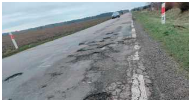
O jeździe po drodze 807 mieszkańcy gminy Wola Mysłowska mówili: „To masakra!”. Szykuje się jej remont

Rozbudowa drogi wojewódzkiej nr 807 na wymienionym odcinku ma na celu poprawę