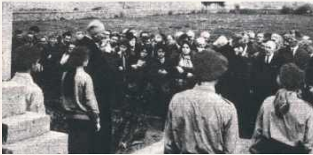
Większość ofiar spoczęła na cmentarzu w Woli Gułowskiej (na granicy ze wsią Turzystwo). Na tej samej nekropolii odbywają się tradycyjnie uroczystości ku czci poległych żołnierzy z 1939 roku. Zdjęcie z 1971 roku z tygodnika Stolica

kowskiego (Ajdakowskiego) i Jana Wasilewskiego, z racji na chorobę niemogące przyjąć na miejsce zbiórki, zastrzelono w domach.