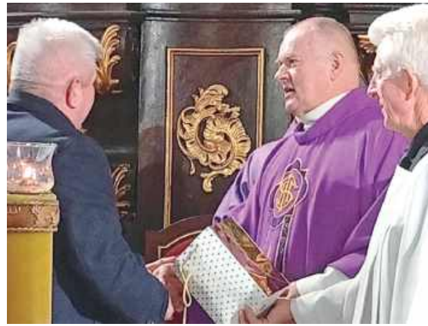
Parafianie życzyli swojemu proboszczowi Bożego błogosławieństwa i potrzebnych łask na dalszą kapłańską posługę

O godzinie 10 została odprawiona msza święta dziękczynno-błagalna w jego intencji, jako wyraz uznania za dotychczasową posługę kapłańską.