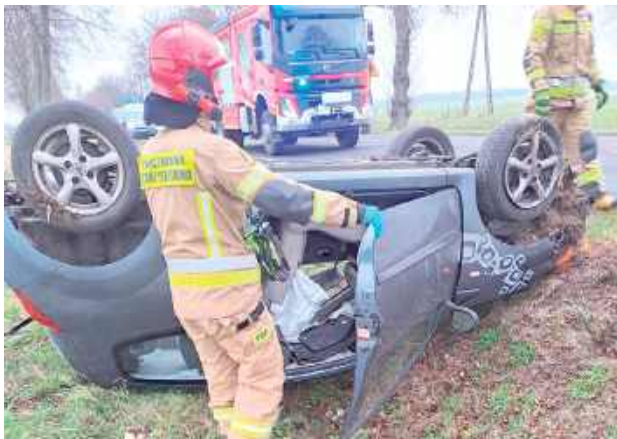
Zdarzenie miało miejsce 3 grudnia po godzinie 10

3 grudnia po godzinie 10 do stanowiska kierownika KP PSP w Łukowie wpłynęło zgłoszenie o niebezpiecznym zdarzeniu na drodze w gminie Łuków.