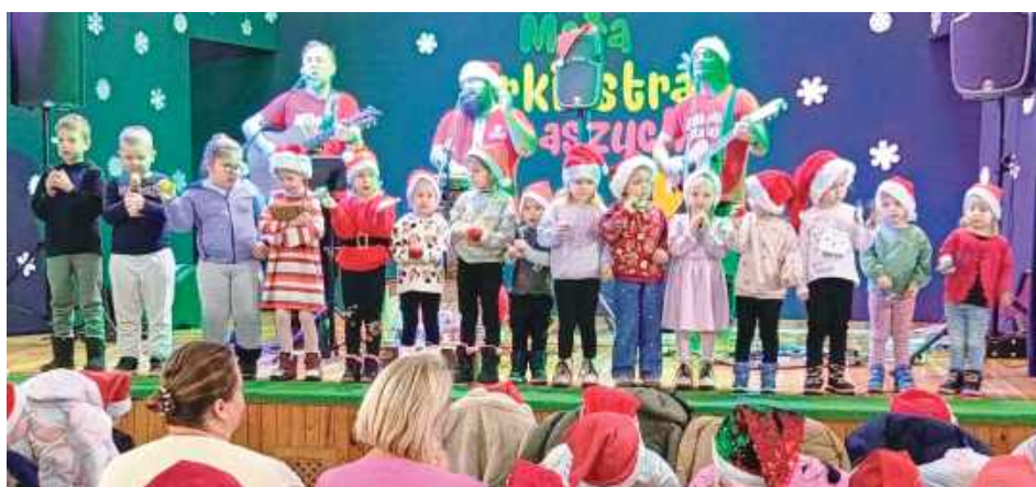
Na zaproszenie Gminnej Biblioteki Publicznej. Na scenie wystąpiła Mała Orkiestra Dni Naszych, która swoim koncertem wprowadziła wszystkich w prawdziwie mikołajkowy nastrój

Na widowni zasiedli uczniowie z Zespołu Szkolno-Przedszkolnego w Trzebieszowie Drugim. Dzieci miały na sobie czerwone czapki Mikołajów, co dodało wydarzeniu jeszcze więcej świątecznej magii. Od początku koncertu dzieci świetnie się bawiły – śpiewały, klaskały i chętnie odpowiadały na zaproszenia zespołu do