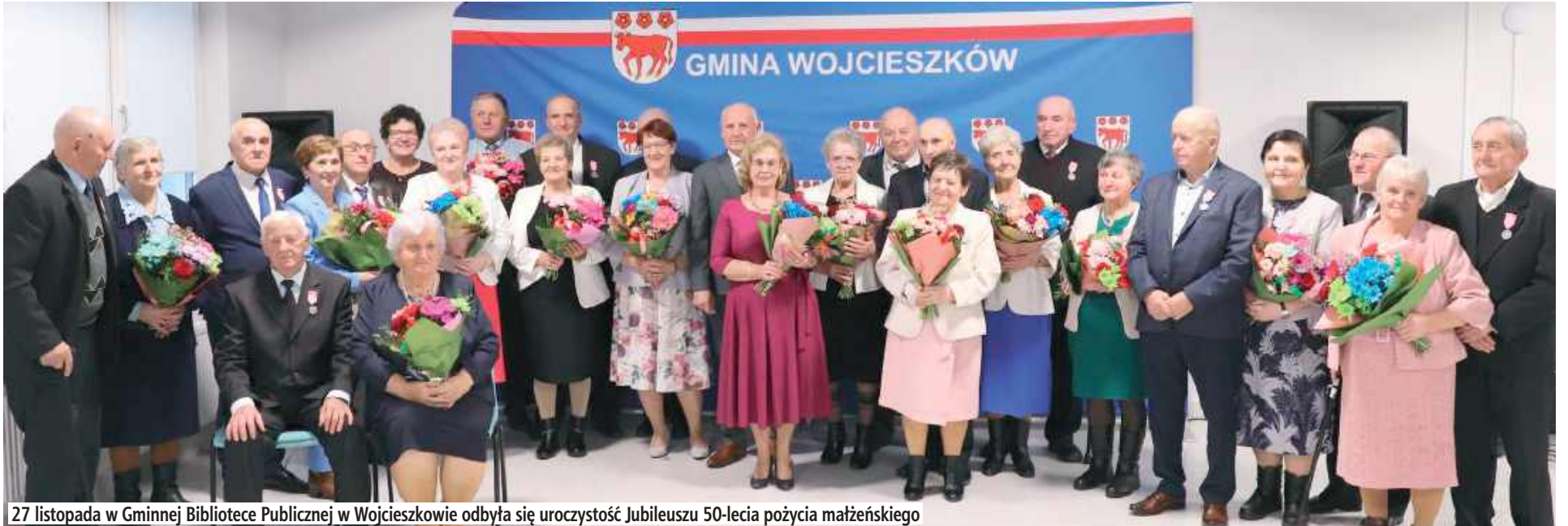
27 listopada w Gminnej Bibliotece Publicznej w Wojcieszkwie odbyła się uroczystość Jubileuszu 50-lecia pożycia małżeńskiego