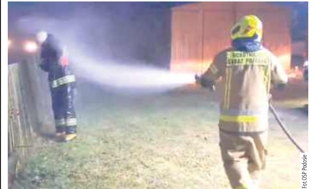
Zaraz po zakończeniu akcji druh Bartek Kot przeszedł strażacki „chrzest”

28 listopada przed godziną 15 do stanowiska kierownika KP PSP w Łukowie wpłynęło zgłoszenie o pożarze w gminie Krzywda.