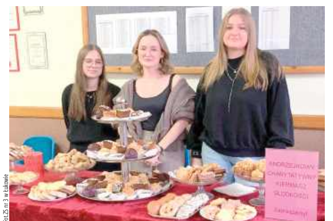
Dochód z kiermaszu zostanie przeznaczony na świąteczne upominki dla dzieci z Zespołu Placówek w Łukowie