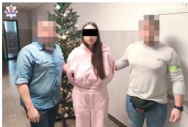
19-latka była jedną z osób zamieszanych w przestępstwa

Policjanci z „Mienia” Komendy Miejskiej Policji w Lublinie zatrzymali trzy osoby podejrzane o oszustwo seniorów na kwotę prawie 400 tys. zł. Sprawcy oszukali najpierw 81-latkę, a później przekonywali 87-latkę, że jej wnuczka spowodowała wypadek i potrzebne są pieniądze, by nie trafiła do więzienia.