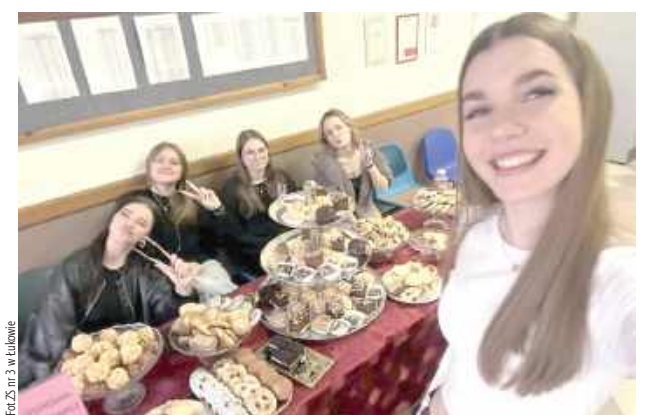
Podczas kiermaszu każdy mógł znaleźć coś dla siebie - od tradycyjnych serników, po kolorowe babeczki i ciasteczka oraz wrózby andrzejkowe