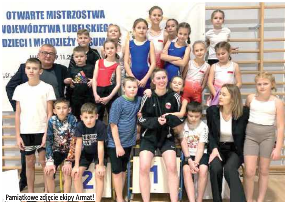
Pamiątkowe zdjęcie ekipy Armat!

Młodzi sportowcy klubu Armat Stoczek Łukowski pokazali klasę podczas Otwartych Mistrzostw Województwa Lubelskiego Dzieci i Młodzieży, które odbyły się w Lublinie. Zawody pełne były sportowych emocji, a reprezentanci Armat wrócili do domu z imponującym workiem medali.