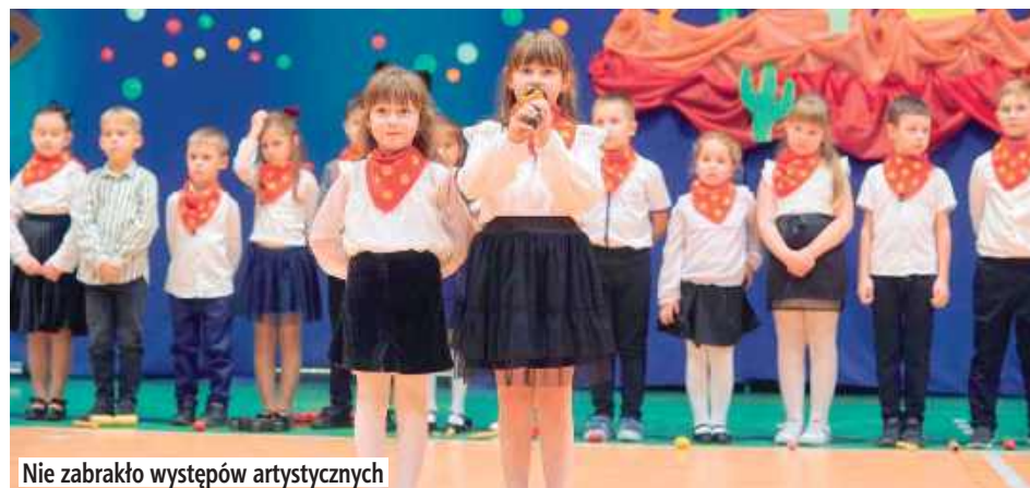
Nie zabrakło występów artystycznych