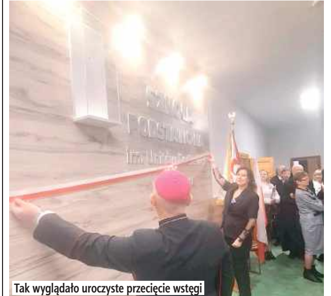
Tak wyglądało uroczyste przecięcie wstęgi