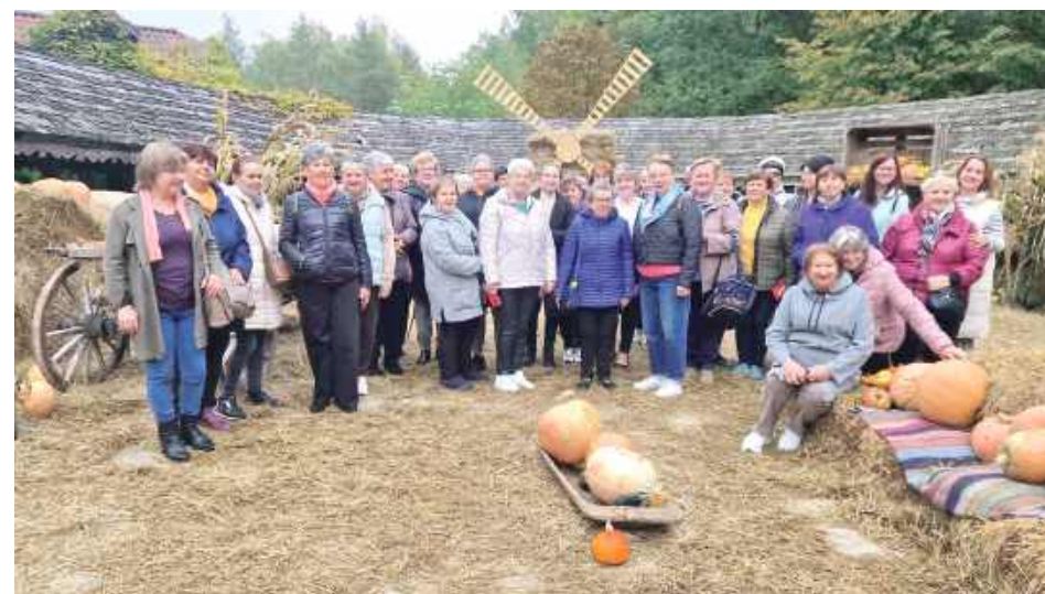
Było pysznie i bardzo ciekawie. Ziołowy Zakątek to unikatowy w skali świata obiekt agroturystyczny położony w samym sercu najczystszej regionu Polski, Podlasia

Podczas wycieczki seniorzy z gminy Siemień wyruszyli na zwiedzanie wyjątkowego miejsca na Podlasiu, tym razem ich celem był Ziołowy Zakątek. Dla seniorów zorganizowano warsztaty