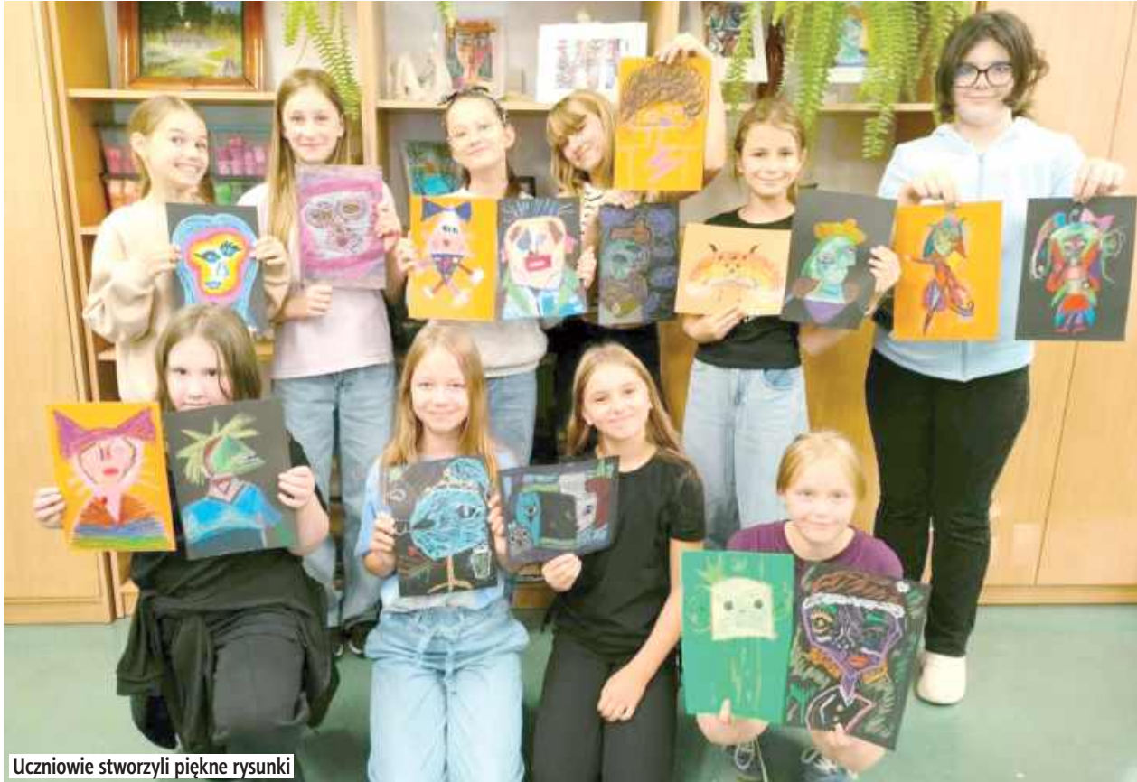
Uczniowie stworzyli piękne rysunki

Szkoła Podstawowa z gminy Jabłoń dostała imię