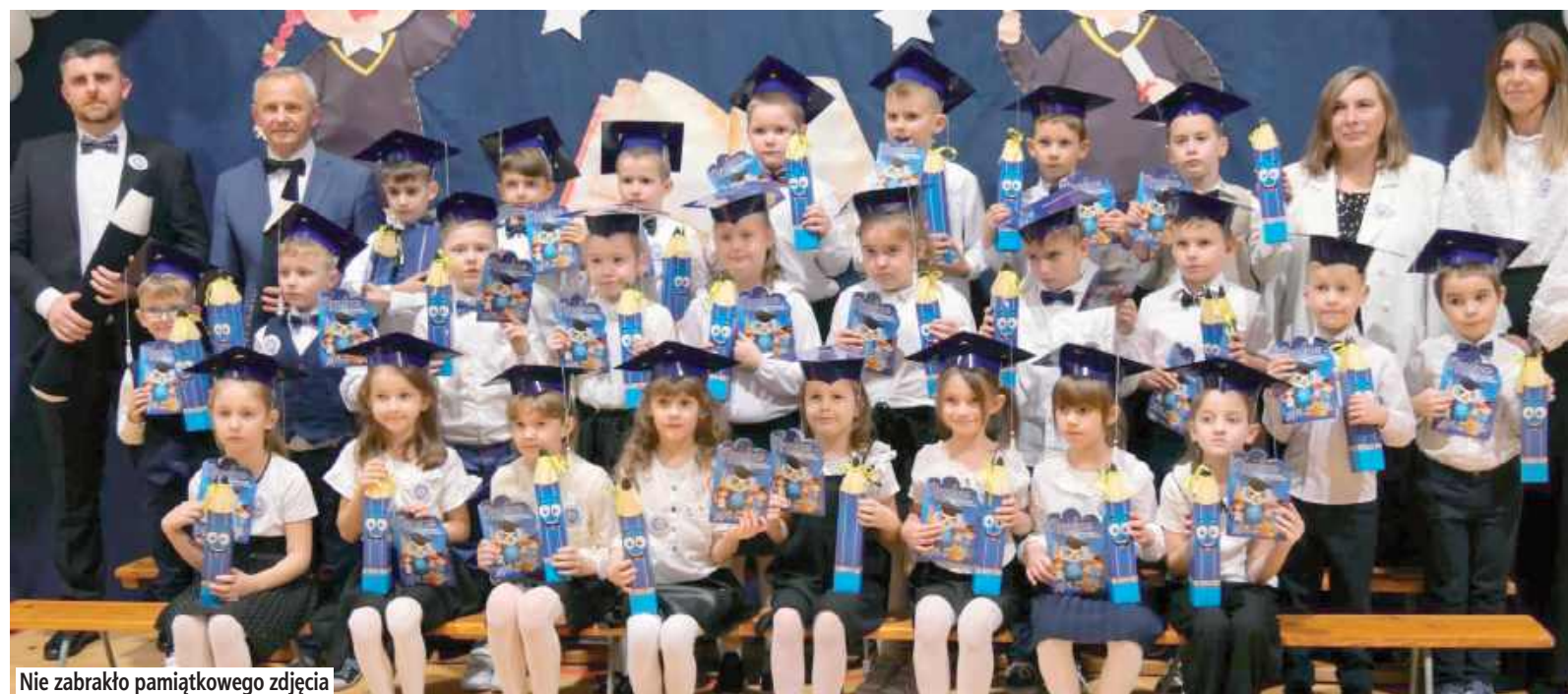
Nie zabrakło pamiątkowego zdjęcia

W części artystycznej mali bohaterowie zaprezentowali piosenki, wiersze oraz układ taneczny. Następnie panowie dyrektorzy uroczystie „pasowali” pierwszaków na uczniów.