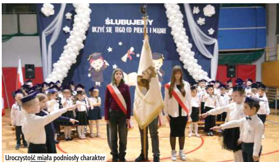
Uroczystość miała podniosły charakter