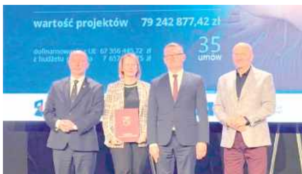
W ramach projektu powstanie także wypożyczalnia sprzętu rehabilitacyjnego dla mieszkańców objętych wsparciem

miony pakiet usług społecznych, w tym opiekuńczych i specjalistycznych. Pomoc obejmie m.in. rehabilitację i usprawnianie funkcji organizmu, wsparcie