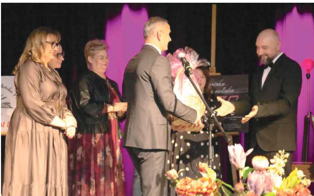
Podczas jubileuszu były podziękowania, życzenia i plany na nowoczesną przyszłość biblioteki

W głównej bibliotece czytelnicy mają dostęp do tytułów