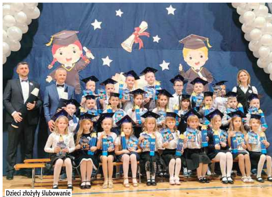
Dzieci złożyły ślubowanie