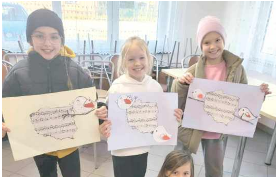
W czasie zajęć powstały patriotyczne prace, które wzmacniają w dzieciach poczucie patriotyzmu

Na przygotowanych kartach pojawiła się mapa Polski ozdobiona nutami pieśni patriotycznych, a obok niej kolorowe ptaki – interpretacje motywów wolności i pokoju. Zajęcia połączyły elementy nauki, sztuki