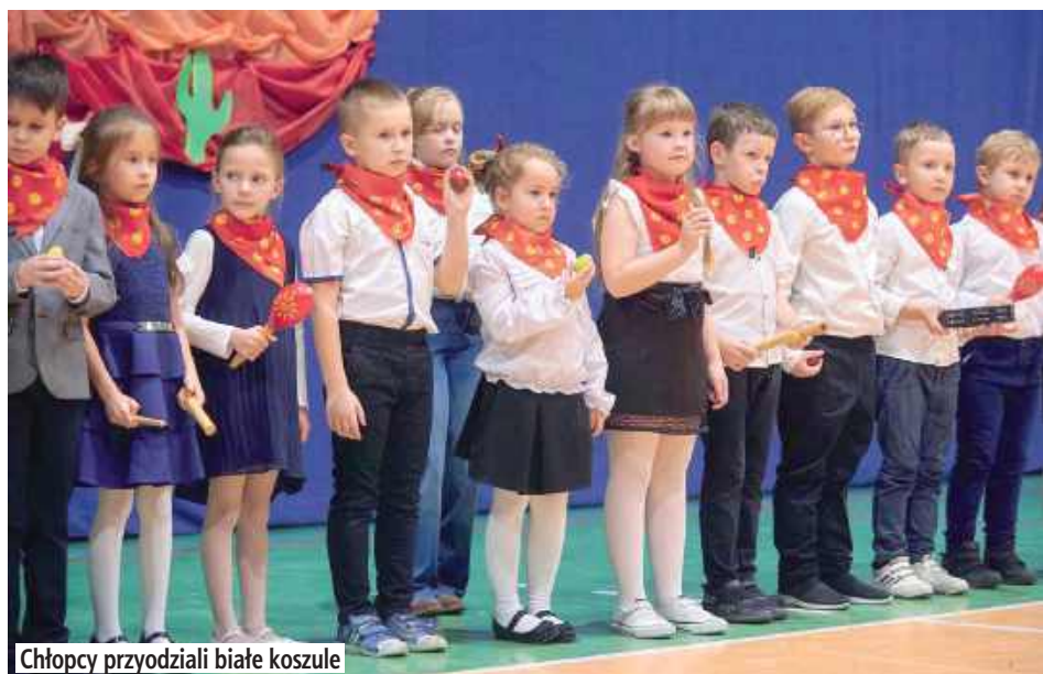
Chłopcy przydziali białe koszule