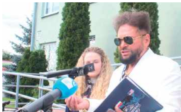
Detektyw Krzysztof Rutkowski wyjaśnia, ile pieniędzy klientów poszło na leczenie współwłaściciela firmy

Sprawa stała się głośna najpierw w lipcu 2024 r., gdy biuro słynnego detektywa Krzysztofa Rutkowskiego i Telewizja.Patriot24.net zorganizowały pod białską Komendą Miejską Policji briefing prasowy, dotyczący - jak określili - „licznych wyłudzeń dokonanych przez spółkę