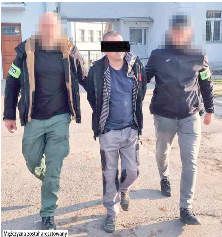
Mężczyzna został aresztowany

Jak się okazało, kierującym nim 42-latek z gminy Siemień po sprawdzeniu w bazach danych ma orzeczony zakaz kierowania pojazdami mecha-