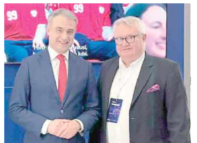
Starosta rozmawiał z ministrem

W swoim wystąpieniu wicepremier i minister cyfryzacji Krzysztof Gawkowski pod-