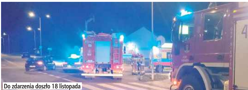
Do zdarzenia doszło 18 listopada

Samochód osobowy potrącił dwóch 14-latków na przejściu dla pieszych w Siemieniu.