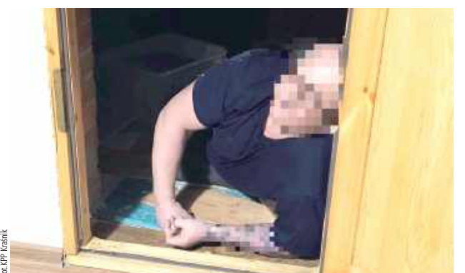
Mężczyzna został skazany na karę ponad 2 lat pozbawienia wolności