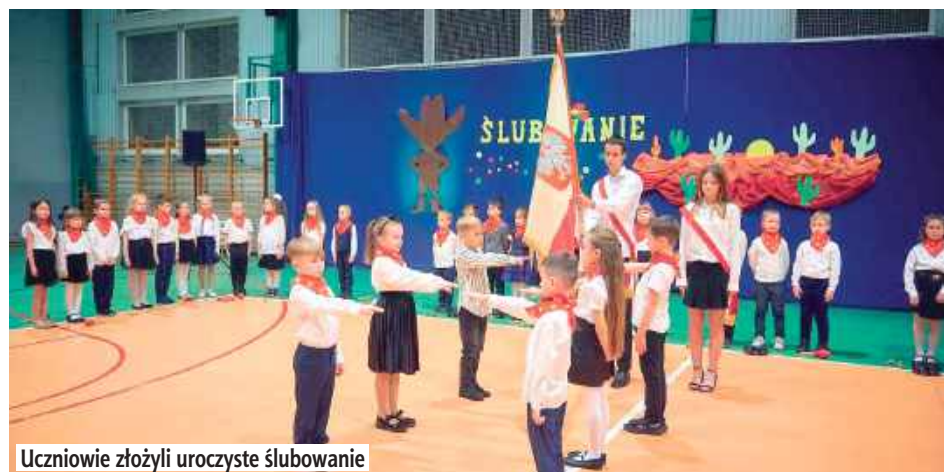
Uczniowie złożyli uroczyste ślubowanie