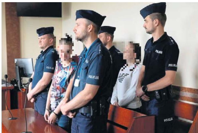
Sąd Rejonowy w Białymstoku skazał dwie kobiety na karę więzienia za wyłudzenie pieniędzy metodą „na wnuczka”

Podczas procesu pokrzywdzona seniorka zeznała, że