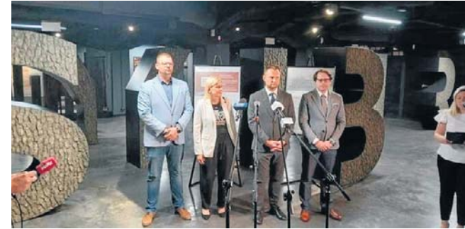
Konferencja poświęcona 90. rocznicy deportacji Polaków do Kazachstanu