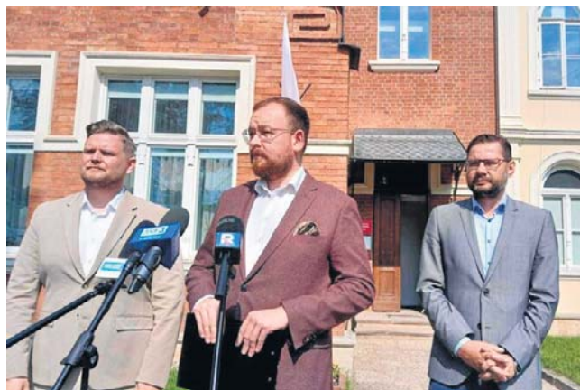
Interwencja działaczy PiS w Regionalnej Dyrekcji Ochrony Środowiska

Przed siedzibą Regionalnej Dyrekcji Ochrony Środowiska mówił, że ma kilkanaście pytań