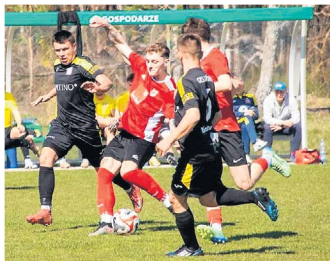
Losy wicemistrzostwa okręgowki rozstrzygną w ostatniej kolejce GKS Gródek (ciemniejsze stroje) i Pomorzanka