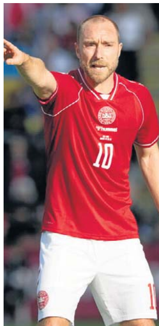
Możliwe, że po drugim takim zajściu, Christian Eriksen zakończy sportową karierę...

- To może być dla danej osoby bardzo gwałtowne doświadczenie, ponieważ przypomina porażenie prądem z zwykłego defibrylatora. Człó-