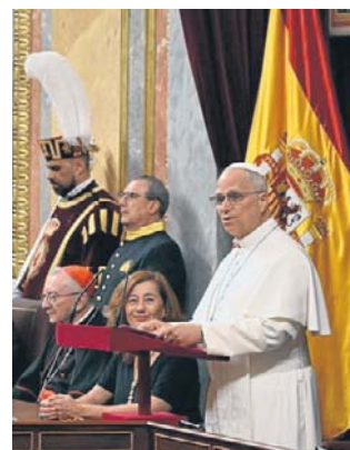
Parlamentarzyści zgotowali papieżowi owację

Papież gościł w niższej izbie parlamentu królestwa Hiszpanii, noszącego nazwę Kortezy Generalne. Przemawiał jednak do członków obu izb. Na sali zabrakło parlamentarzystów lewicowego ugrupowania Podemos i lewicowo-nacjonalistycznego bloku galicyjskiego BGN, którzy zaprotestowali w ten sposób przeciwko obecności przywódcy religijnego w parlamencie świeckiego państwa. Na wstępie Ojciec Święty zadeklarował: Staję przed wami jako biskup Rzymu i pasterz Kościoła katolickiego świadomy, że misja powierzona następcy apo-