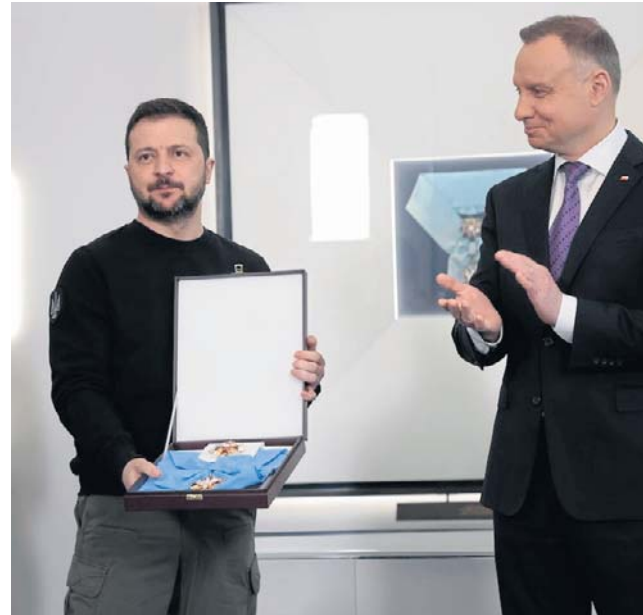
Zelenski został odznaczony Orderem Orła Białego w kwietniu 2023 roku przez prezydenta Andrzeja Dudę

„Ponieważ dyplomacja nie przyniosła żadnych efektów, zwracam się publicznie do Prezydentów Karola Nawrockiego i Wołodymyra Zelenskiego o bezpośrednią i szczerą rozmowę. Zanim emocje zrujnują naszą solidarność, która narodziła się w obliczu rosyjskiego zagrożenia” - napisał premier. Podkreślił, że „współpraca leży w interesie obu naszych państw i narodów, a konflikt w interesie Mo-