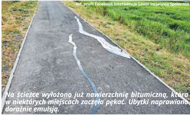
Na ścieżce wyłożono już nawierzchnię bitumiczną, która w niektórych miejscach zaczęła pękać. Ubytki naprawiono doraźnie emulsją.

Ścieżka pieszo-rowerowa w ciągu drogi wojewódzkiej nr 812 nie została jeszcze oddana do użytkowania, a mieszkańcy gminy zauważyli, że pojawiły się na niej pierwsze defekty. W sieci opublikowano zdjęcie rysy w nawierzchni bitumicznej, którą postanowiono naprawić doraźnie emulsją asfaltową. Wójt Agnieszka Dąbrowska zaznacza, że nie ma powodów do niepokoju.