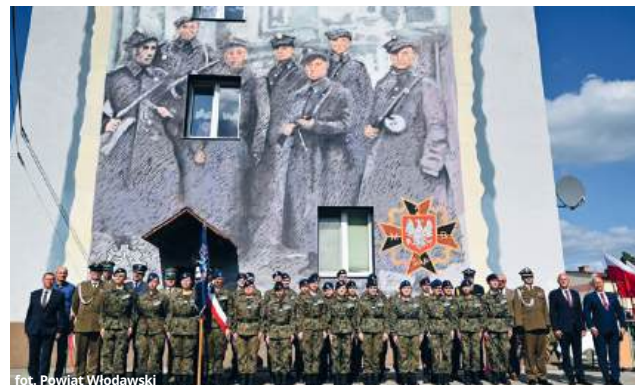
fol. Powiat Włodawski

Nowy mural patriotyczny upamiętnia 2 Warszawską Brygadę Saperów, jednostkę wpisaną w tradycję polskich formacji