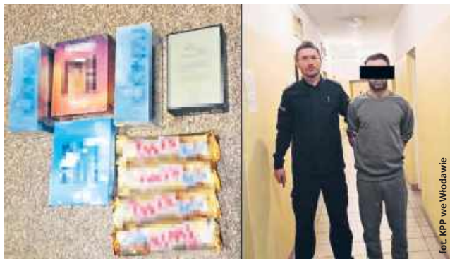
fol. KPP we Włodawie

– Jak ustalili policjanci, bezpośrednio po kradzieży został