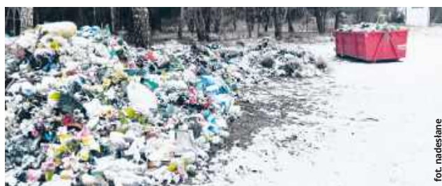
Tak wygląda obecnie miejsce składowania odpadów na cmentarzu parafialnym w Rudzie-Hucie

sześciu grobów, to musi zapłacić nie 50, a już 300 zł. - Do tej pory płaciliśmy za każdy grób standardowo 450 zł. To jednorazowa opłata na dwie dekady. W ramach tej kwoty były też zabezpieczone środki związane z wywozem odpadów, utrzymaniem. Tymczasem proboszcz żąda od nas teraz wniesienia dodatkowej opłaty, która może stanowić poważny problem dla osób, które utrzymują się z niskomniejszej renty czy emerytury. Nie jestem zresztą odosobniony w swojej ocenie - twierdzi