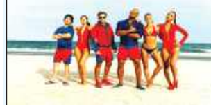
21.10 Słoneczny patrol - komedia, USA, 2017, reż. Seth Gordon, wyk. Dwayne Johnson, Zac Efron, Priyanka Chopra Jones, Alexandra Daddario, Kelly Rohrbach