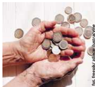
fot. freepik/zdjęcie ilustracyjne

ZUS zaczął przyjmować wnioski o tzw. rentę wdowią od 1 stycznia. W ciągu pierwszego tygodnia w skali Polski do instytucji wpłynęło niemal 34 tysiące