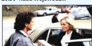
21.55 Zabójcza broń II - film sensacyjny, USA 1989, reż. Richard Donner, wyk. Mel Gibson, Danny Glover, Joe Pesci, Joss Ackland, Derrick O'Connor, Patsy Kensit