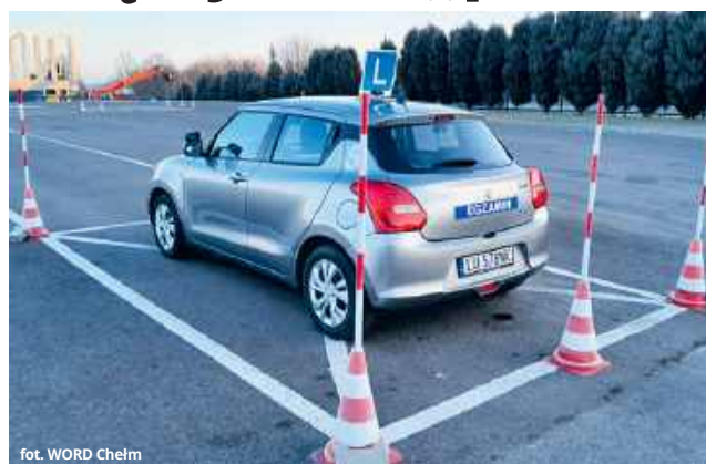
fol. WORD Chełm

● CHEŁM W 2024 r. Wojewódzki Ośrodek Ruchu Drogowego w Chełmie przeprowadził ponad 21 000 egzaminów, z których ok. 12 000 stanowiły te praktyczne. Jest to jeden z lepszych wyników w kraju, biorąc pod uwagę stosunek wielkości miasta do liczby zainteresowanych posiadaniem uprawnień. Niestety, nie wszystkie statystyki przedstawiają się pozytywnie, ponieważ wciąż nie brakuje osób, które starają się o przywrócenie prawa jazdy straconego za punkty lub alkohol.