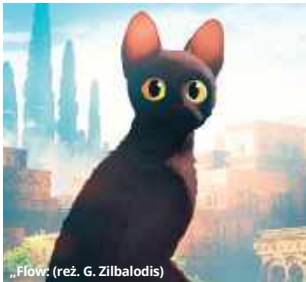
„Flow” (reż. G. Zilbalodis)

spędzania dni we własnym towarzystwie - wydreptując swoje kocie ścieżki i śpiąc w ulubionych miejscach w domu, który, choć pełny śladów ludzkiej obecności, zdawał się należeć tylko do niego. Jednak do czasu. Gdy tajemnicza powódź pochłania znany kotu świat, jedynym schronieniem przed wielką falą staje się stara, drewniana łódź. Szansę na przetrwanie znajdują w niej również inni: kapibara, ptak, lemur i pies, wśród których kocia natura i niezależność są wystawiane na próbę. Dryfując przez mistyczne, zalane wodą krajobrazy zwierzęta wspólnie