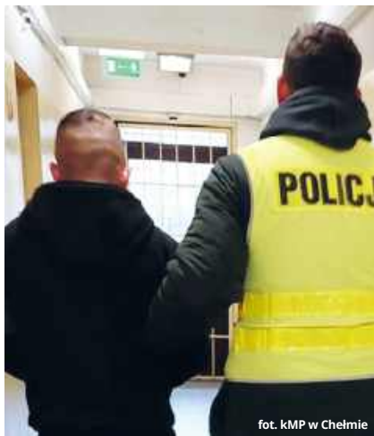
fol. KMP w Chełmie

został zatrzymany przez chełmskich kryminalnych. Jak się okazało, był nietrzeźwy. Nie przyznał się do zarzucanych mu czynów i odmówił składania wyjaśnień. Za podobne przestępstwa odbywał już kary pozbawienia wolności. W niedzielę (12 stycznia) sąd, na wniosek policji i prokuratury, zastosował wobec niego tymczasowy areszt na okres 3 miesięcy. Za czynną napaść na funkcjonariuszy grozi mu do 10 lat pozbawienia wolności – dodaje policjantka. (apm)