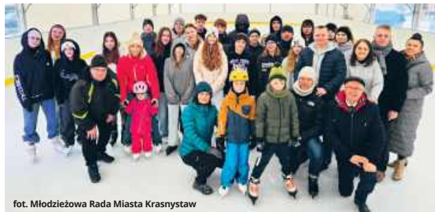
fol. Młodzieżowa Rada Miasta Krasnystaw

- Wszyscy wiemy, jak ważna jest aktywność fizyczna podczas kształtowania sylwetki oraz dbania o zdrowie, kondycję i odporność organizmu. Korzystając ze sztucznego lodowiska, które funkcjonuje na krasnostawskim rynku, zorganizowaliśmy zimową aktywną integrację na lodzie. W wydarzeniu wzięli udział członkowie młodzieżowej rady miasta i współpracujący z radą uczniowie oraz radni „Krasnostawianie” - wyjaśnił