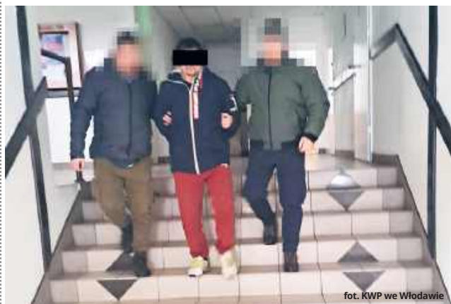
fol. KWP we Włodawie

– Apelujemy, aby reagować, jeżeli komuś z naszego otocze-