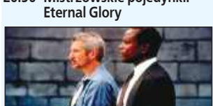
21.55 Szakal - film sensacyjny, USA, Wielka Brytania, Francja, Niemcy, Japonia 1997, reż. Michael Caton - Jones, wyk. Bruce Willis, Richard Gere, Sidney Poitier, Diane Venora, Mathilda May, Jack Black, J.K. Simmons, Tess Harper