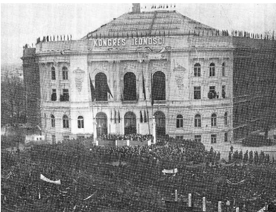
Kongres zjednoczeniowy obu partii na Politechnice Warszawskiej poprzedziły szeroko zakrojone „operacje” polityczne

Naciski na kierownictwo PPS nasiliły się na początku 1948 r. Była to gra obietnic i zastraszania, którą komuniści rozegrali względem najważniejszych członków partii. Członek PPS, a niebawem wieloletni premier Józef Cyrankiewicz opisał ją krótko i dosadnie: „połączenie ugrupowań zostało załatwione od głowy, nie od dupy”. 17 marca Centralny Komitet Wy-