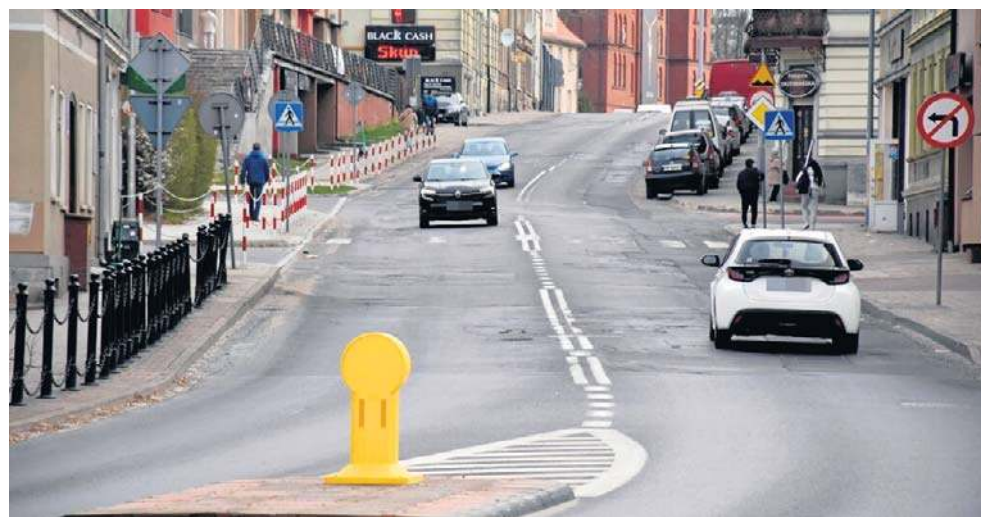
Kierowcy od wielu lat narzekają na stan techniczny ulicy Młyńskiej