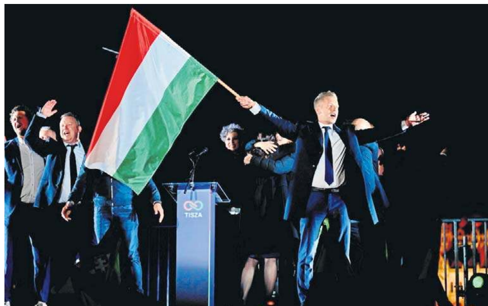
Objęcia urzędu premiera przez Petera Magyara należy oczekiwać najpóźniej w drugiej połowie maja – tak wynika z węgierskiej konstytucji i przepisów wyborczych

– Odzyskałiśmy nasze państwo, uwolniliśmy je. TISZA nie tylko wygrała, ale będzie mieć większość konstytucyjną