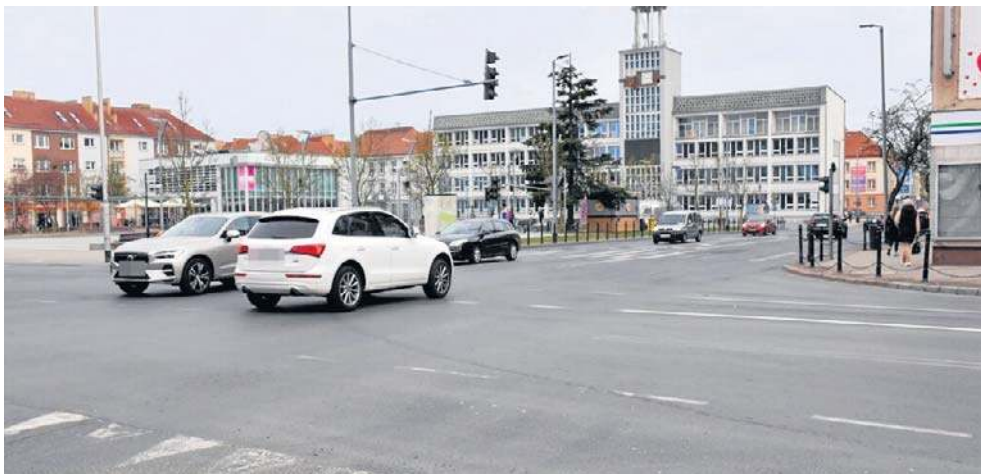
Nowe malowanie było planowane na kwiecień. Ale już wiemy, że na razie zostało odłożone w czasie

Chodzi o planowaną nową organizację ruchu na ulicy Zwycięstwa od dawnego Empiku aż do skrzyżowania z ul. Połtawską, przy sklepie Saturn i dawnym Narodowym Banku Polskim. Wstępny plan był taki, by wyznaczyć na całym tym odcinku tylko po jednym pasie ruchu w każdą stronę, a na pozostałej części jezdni wymalować miejsca parkingowe. To nie wszystko, na skrzyżowaniu ulic Zwycięstwa z ul. Młyńską i 1 Maja miała być wyłączona sygnalizacja świetlna i wymalowane rondo. Takie malowanie miało przyzwyczajając i przygotować kierowców z Koszalina