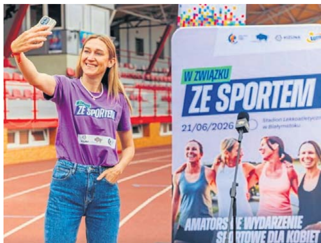
Ambasadorką wydarzenia jest mistrzyni świata i rekordzistka Polski w skoku wzwyż Kamila Lićwinko

- Chcemy promować rozpoczęcie uprawiania sportu, budować świadomość zdrowotną oraz wspierać integrację spo-