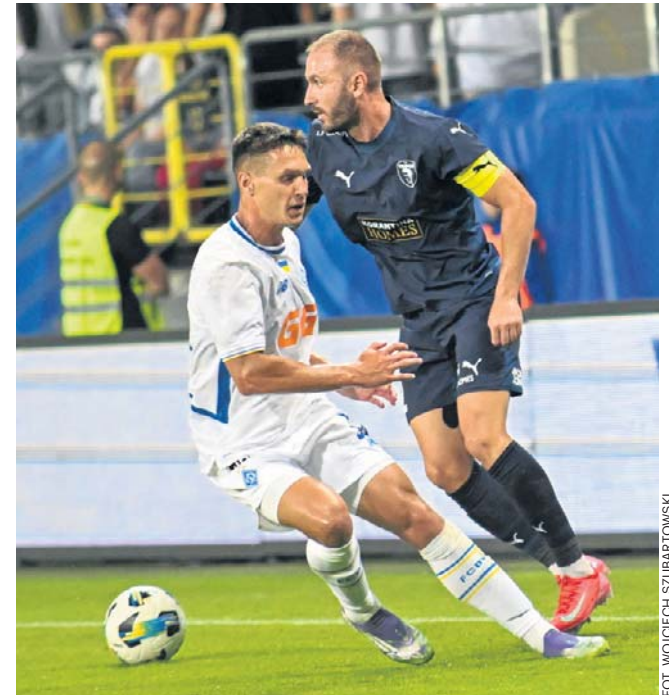
Cypryjski zespół Pafos FC (ciemniejsze stroje) będzie jednym ze sparingowych rywali Jagi na obozie w Austrii

Plan przygotowań jest już znany i najważniejszym zadaniem jest teraz wzmocnienie kadry, bo bilans kadrowy jest