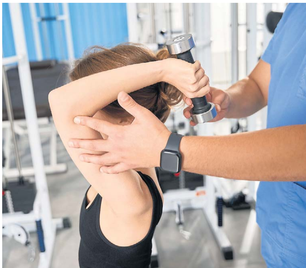
Należy pamiętać, że fizjoterapeuta nie leczy, a przede wszystkim wspomaga proces leczenia oraz znacząco poprawia komfort życia