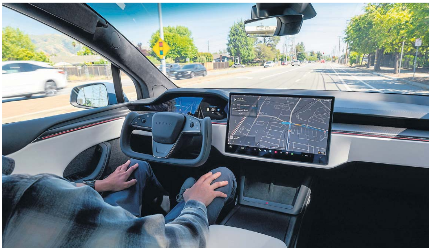
Najnowsze samochody działają jak „centra danych na kołach”, zbierając ogromne ilości informacji o pojeździe, kierowcy i pasażerach. Dane te są gromadzone, przetwarzane i wysyłane do serwerów producentów

Już teraz na terenie jednostek i obiektów wojskowych – m.in. w Wielkiej Brytanii, Izraelu i Polsce – obowiązuje zakaz wjazdu pojazdów chińskich producentów. W trosce o bezpieczeństwo państwowe. Rzecz w tym, że taką inwigilację może dziś prowadzić praktycznie każde nowoczesne auto. A to oznacza, że na teren obiektów o szczególnym znaczeniu należałoby zakazać wjazdu... wszystkich pojazdów. Paranoja? Niekoniecznie! Ale jak to w życiu bywa, widać, że przepisy nie nadążają za postępem technologicznym.