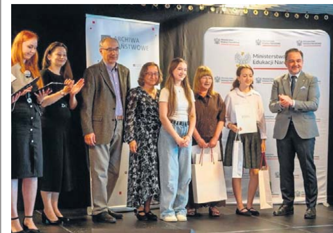
Gala konkursu „Bez korzeni nie zakwitniesz. Moja Wielka i Mała Ojczyzna” odbyła się na Chorten Arenie

Do wielkiego finału weszły 93 prace, a jury wręczyło nagrody 19 osobom.