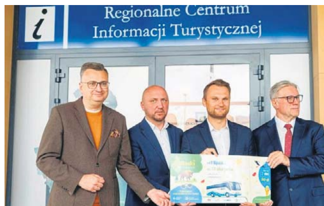
O nowej ofercie opowiadano w piątek podczas konferencji prasowej w hali dworca PKS

- W PKS Nova bilet będzie dotyczył 50 połączeń do najpiękniejszych miast i miejsc turystycznych w naszym regionie. To świetny pomysł, by tu-