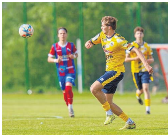
MOSP Białystok przegrał z Warmią Grajewo 0:2

Dla pokonanych gości oznacza to degradację do okręgowki, a ich los podzielą także zwycięzcy, jeśli Warmia nie