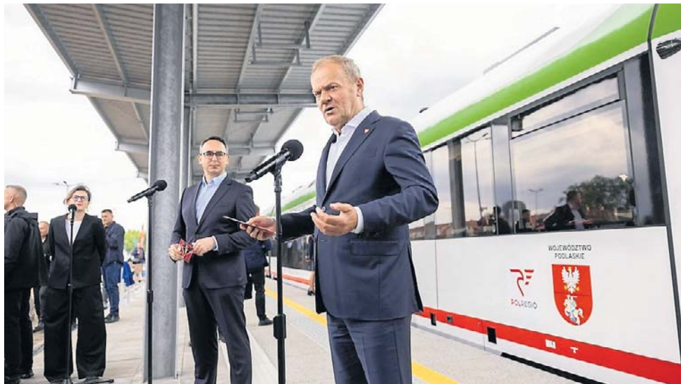
- Łomża czekała na ten moment 33 lata i wreszcie się doczekała - powiedział premier Donald Tusk. - Przywracamy połączenia kolejowe w wielu miejscowościach w całej Polsce